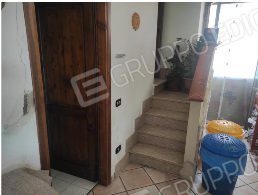
Vista parziale interna della scala di accesso al piano primo ubicata all'interno della zona pranzo a piano terra in cui si evincono le rifiniture e la porta del bagno.