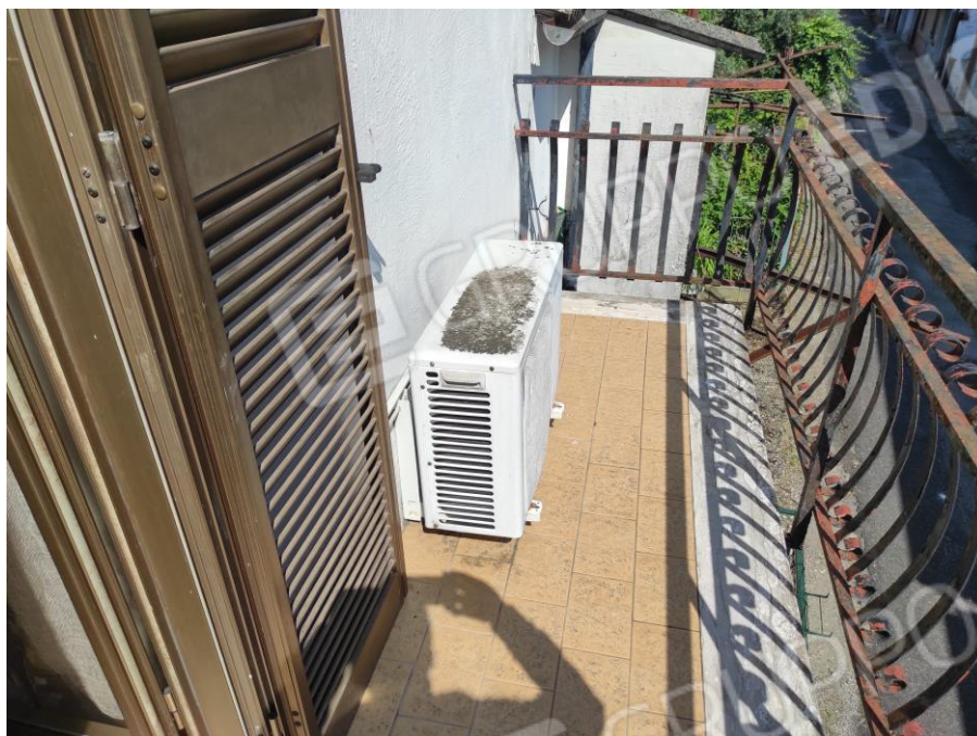
Vista parziale esterna del balcone della camera da letto piccola prospiciente la strada comunale.