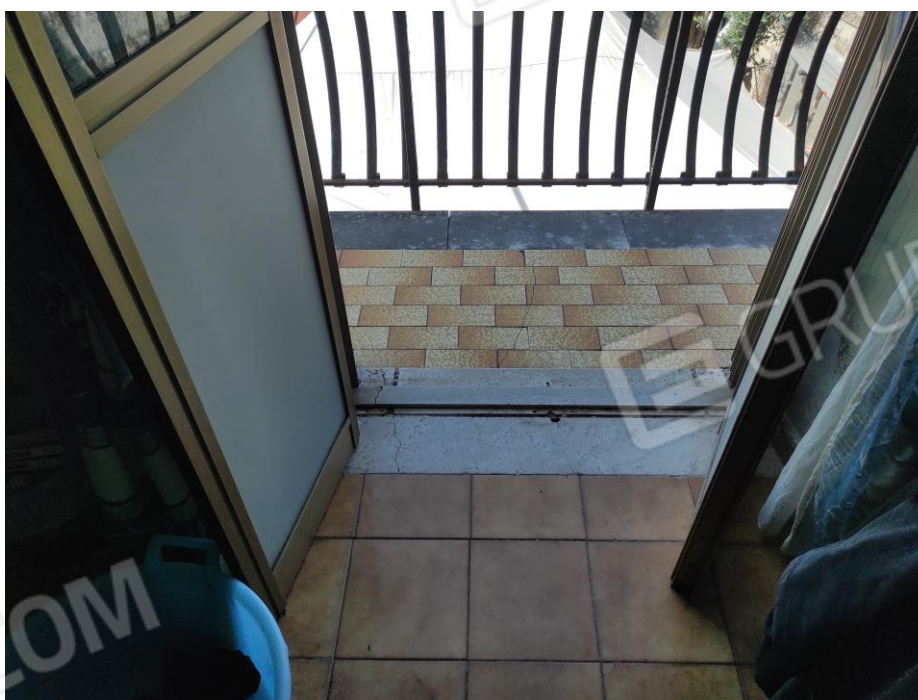
Vista parziale esterna del balcone della camera da letto matrimoniale prospiciente la corte.