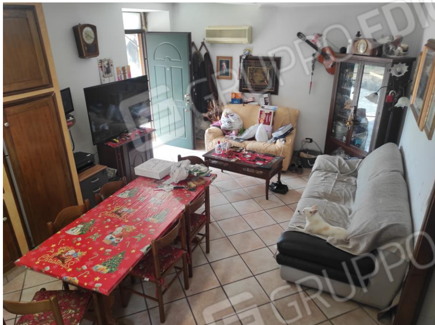
Vista generale interna dell'ingresso sala da pranzo in cui si evince il portone blindato e le rifiniture.