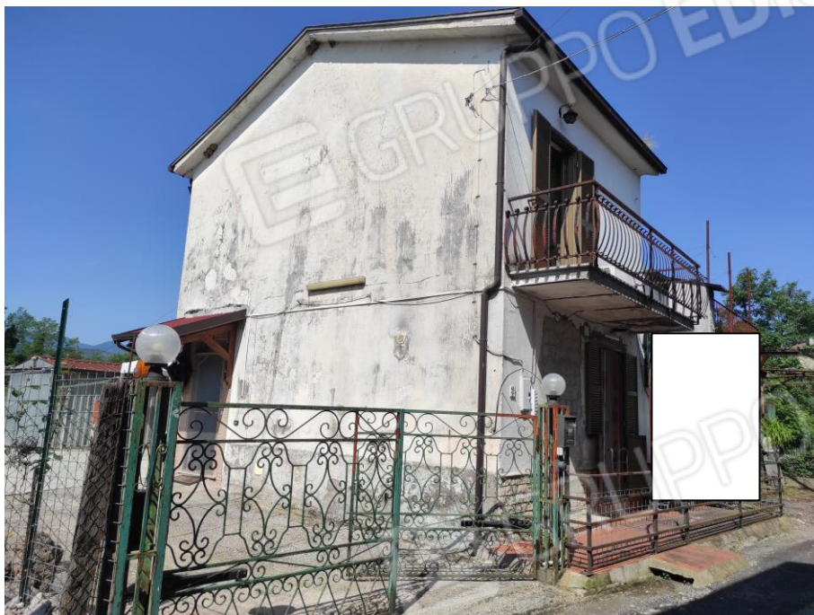
Vista esterna del fabbricato da via Case Vecchie. (Prospettiva lati sud-est e sud-ovest)