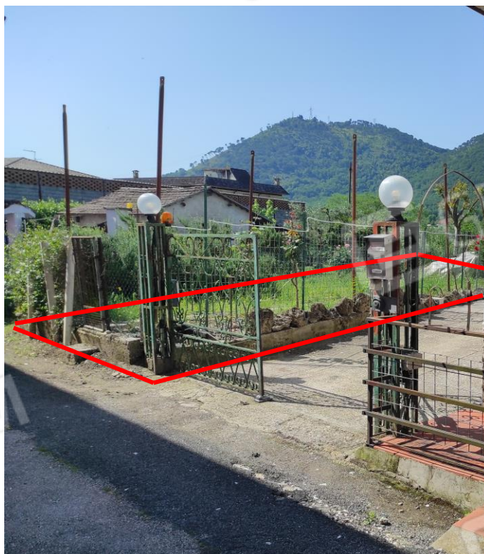
Vista esterna del terreno (nel riquadro rosso) da via Case Vecchie con cancelletto di accesso posto a quota maggiore rispetto alla strada ed alla corte dell'abitazione oggetto della stessa Esecuzione Immobiliare. (Prospettiva lato sud-est)

03037 PONTECORVO (Fr) Via C.da Melfi di Sotto, snc - Tel./fax. 0776761774 - e-mail: dariobastoni@libero.it - Pec: architettodariobastoni@pec.it