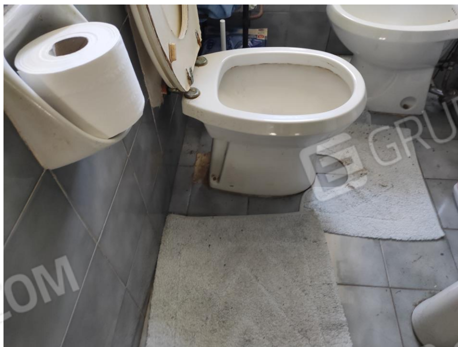
Viste parziali interne del bagno a piano primo in cui si evincono le rifiniture