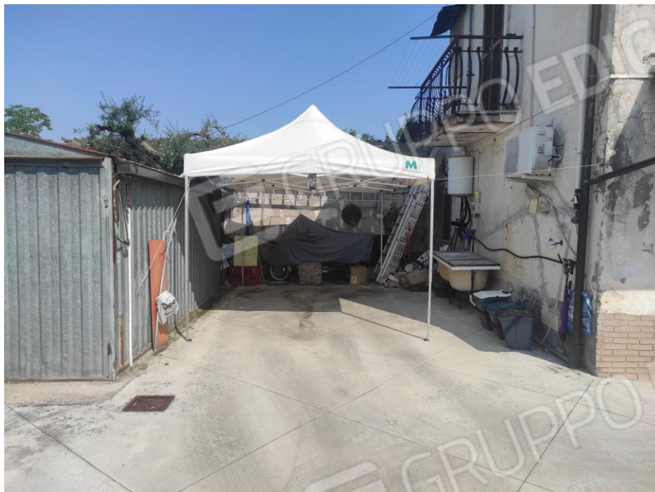
Vista interna della corte