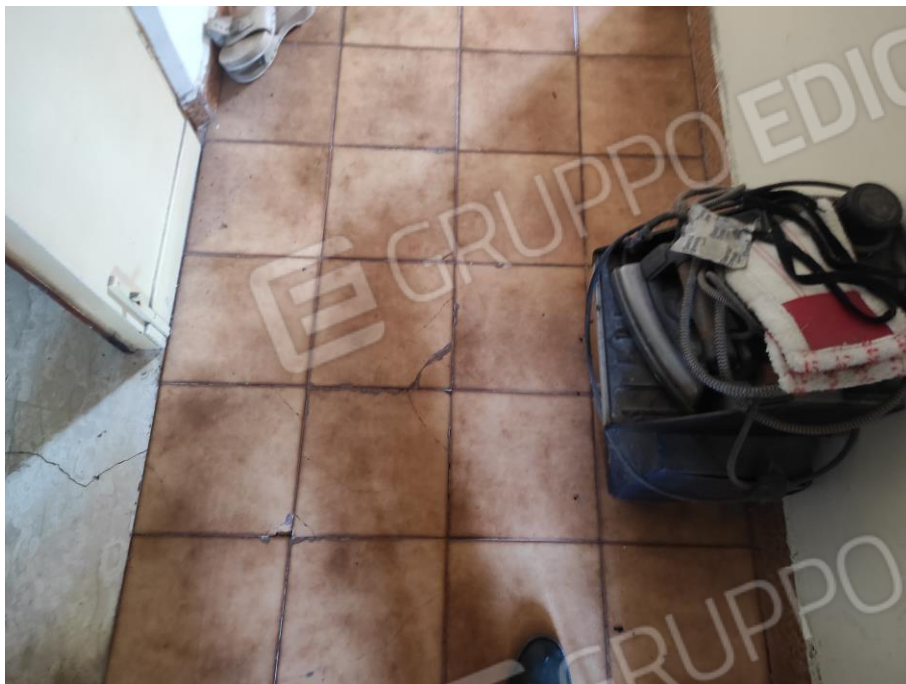
Vista parziale interna del disimpegno a piano primo in cui si evincono le rifiniture.