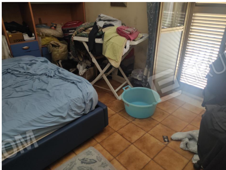
Vista parziale interna della camera da letto piccola in cui si evincono le rifiniture.