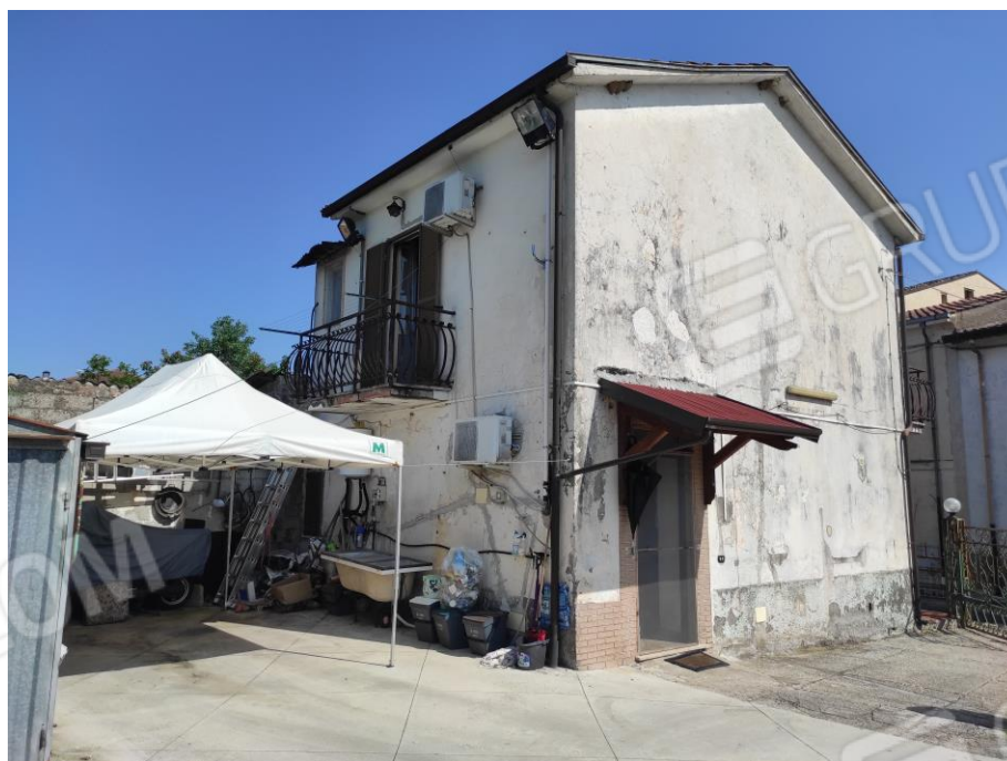
Vista esterna del fabbricato. (Prospettiva lati sud-est e sud-ovest)