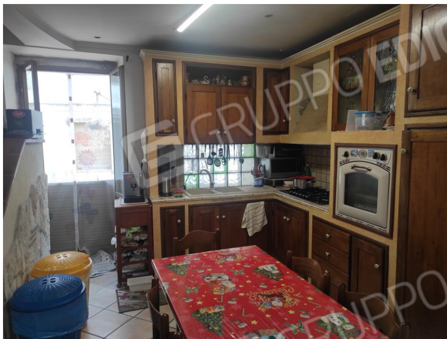
Vista parziale interna della zona cucina con le scale di accesso al piano primo in cui si evincono le rifiniture.