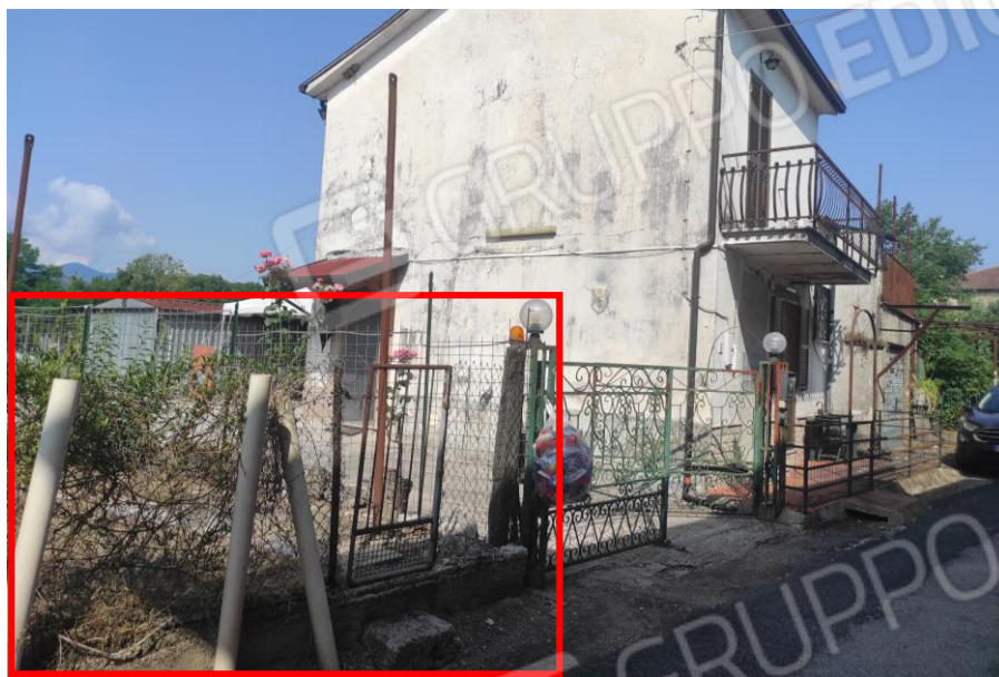
Vista esterna del terreno da via Case Vecchie con cancelletto di accesso (nel riquadro rosso) posto a quota maggiore rispetto alla strada e nello sfondo della foto si evince l'abitazione oggetto della stessa Esecuzione Immobiliare. (Prospettiva lato sud-est)