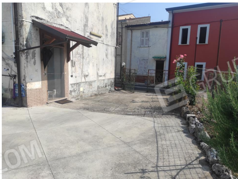
Vista interna della corte