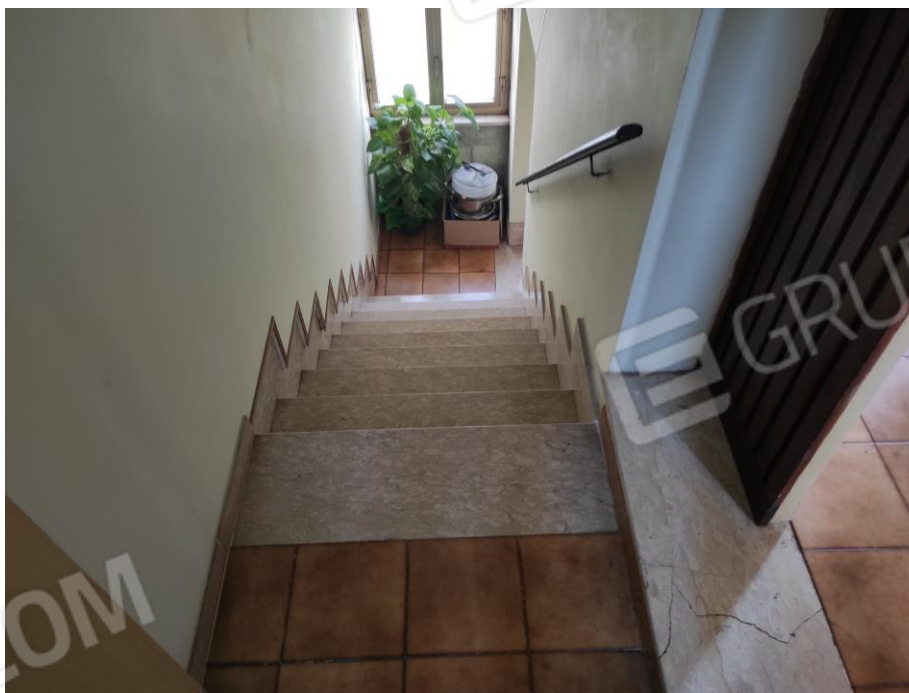
Vista parziale interna della scala di accesso al piano primo in cui si evincono le rifiniture.