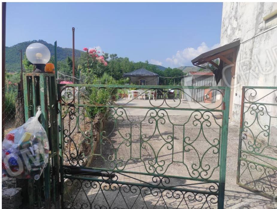
Vista esterna della corte dalla strada Via Case Vecchie