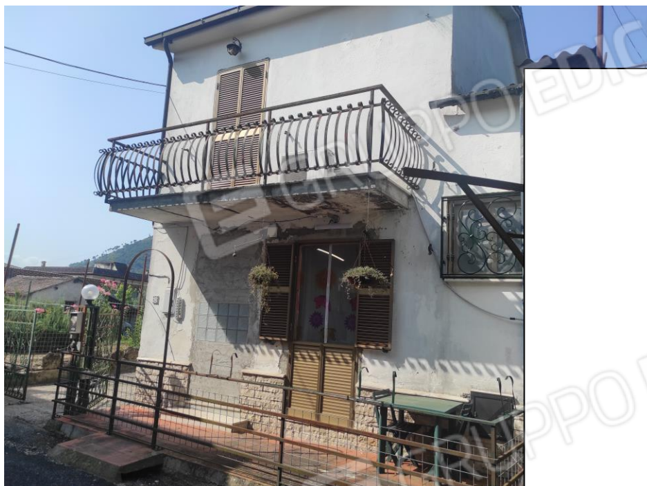
Vista esterna del fabbricato. (Prospetto lato nord-est)