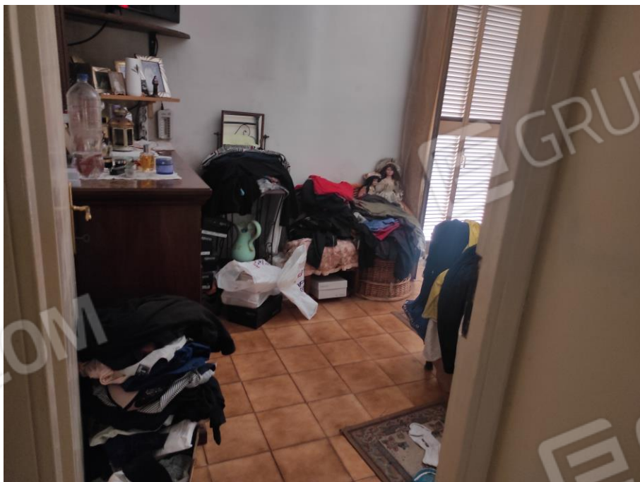
Vista parziale interna della camera da letto matrimoniale in cui si evincono le rifiniture.