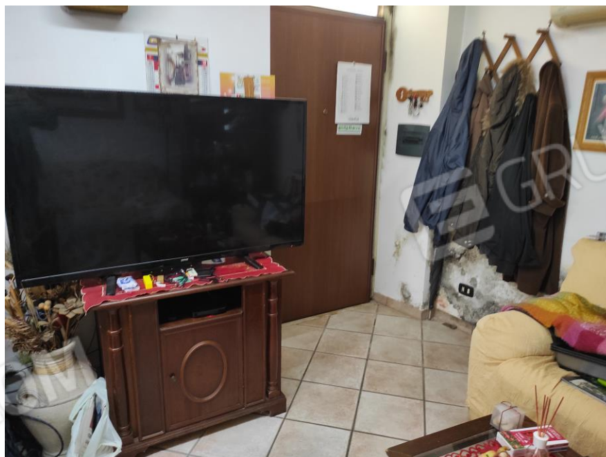
Vista parziale interna dell'ingresso sala da pranzo in cui si evincono le rifiniture e le macchie di umidità.