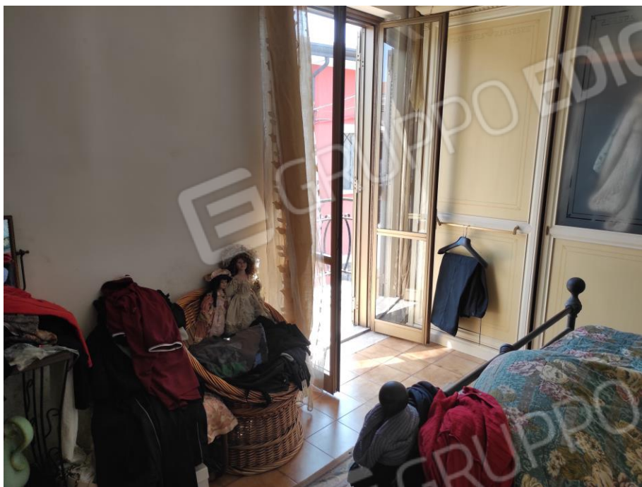
Vista parziale interna della camera da letto matrimoniale in cui si evincono le rifiniture.