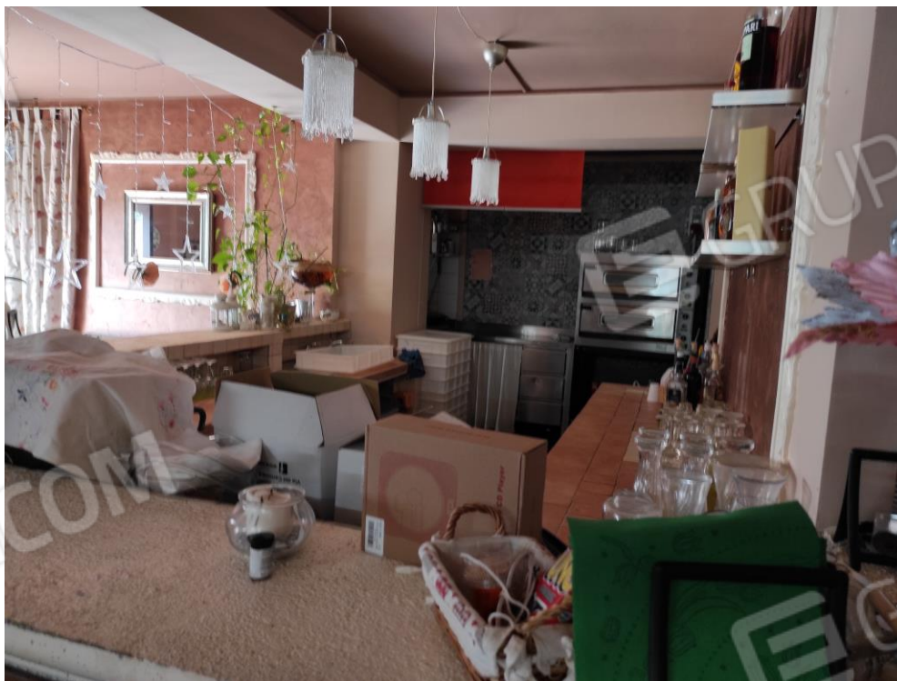
Vista parziale interna della zona bar del locale commerciale.