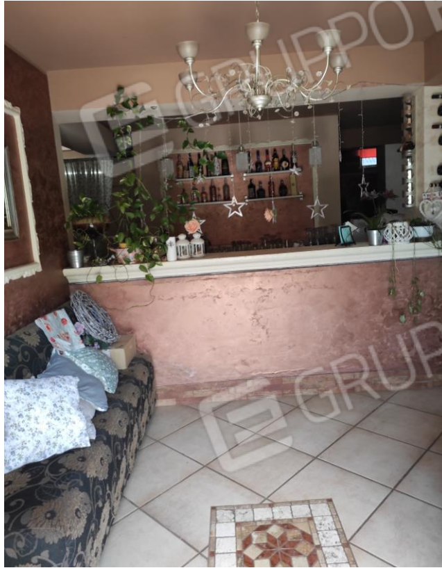
Viste parziali interne della zona bar del locale commerciale.

(Locale Commerciale a piano primo sottostrada ubicato nel Comune di Castrocielo (Fr) alla Via Grotta Scacciamosca, 23, in N.C.E.U., al Fg. 6 P.lla 374 Sub 5)