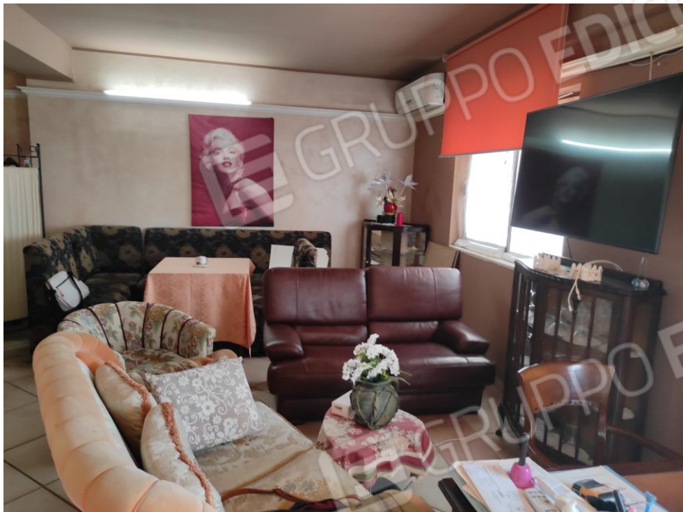
Vista parziale interna di parte della zona relax del locale commerciale.