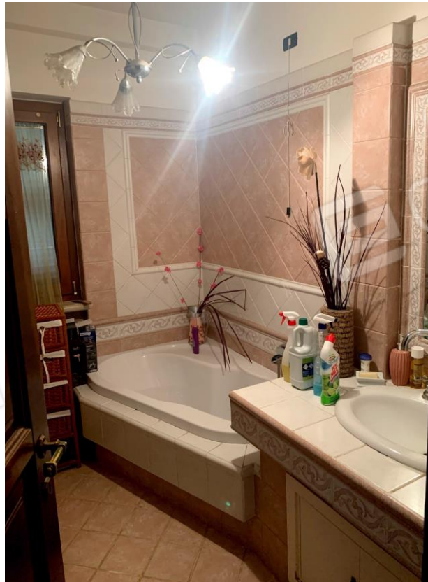
Vista parziale interna del bagno padronale.

03037 PONTECORVO (Fr) Via B. CROCE, snc Tel./fax. 0776761774 e-mail: dariobastoni@libero.it Pec: architettodariobastoni@pec.it