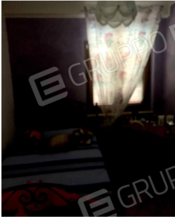
Vista parziale interna di una camera da letto.