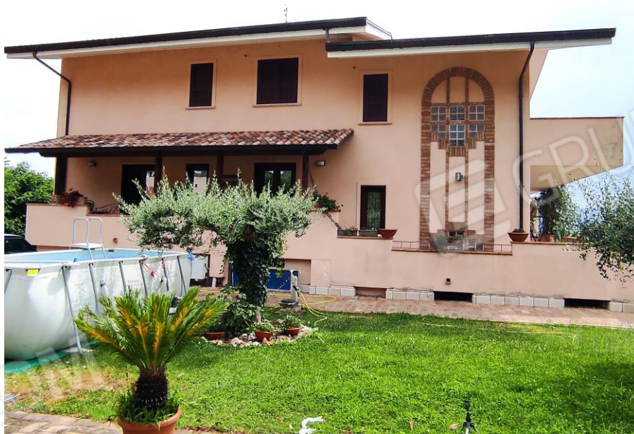
Prospetto laterale del fabbricato in cui sono ubicati i beni oggetto della presente Esecuzione Immobiliare (lato nord). In cui si evince sul balcone l'ingresso del bene n. 1 contraddistinto con il sub 7.