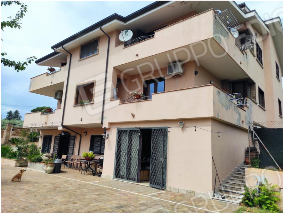
Prospetto laterale del fabbricato in cui sono ubicati i beni oggetto della presente Esecuzione Immobiliare (lato sud). In cui si evince a piano primo sottostrada l'ingresso del bene n. 2 contraddistinto con il sub 5.