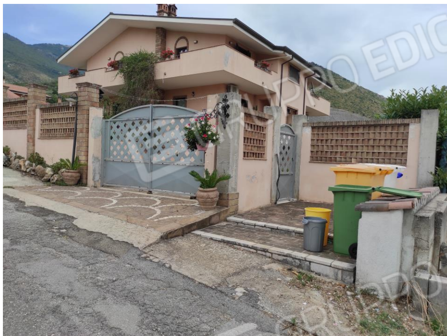
Vista generale del fabbricato da via Grotta Scacciamosca in cui sono ubicati i beni oggetto della presente Esecuzione Immobiliare. (lato sud-ovest)