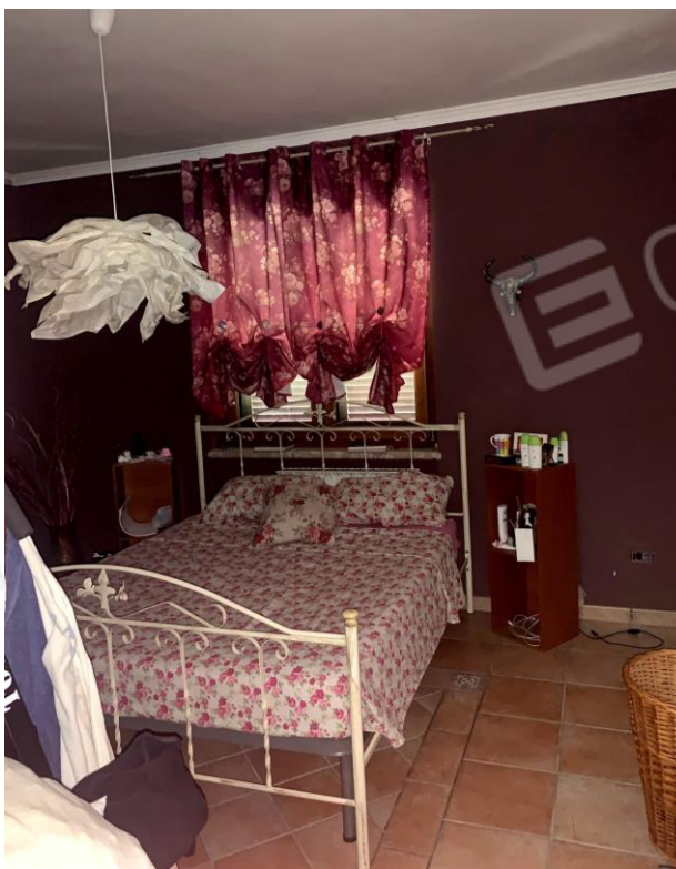
Vista parziale interna di una camera da letto.

03037 PONTECORVO (Fr) Via B. CROCE, snc Tel./fax. 0776761774 e-mail: dariobastoni@libero.it Pec: architettodariobastoni@pec.it