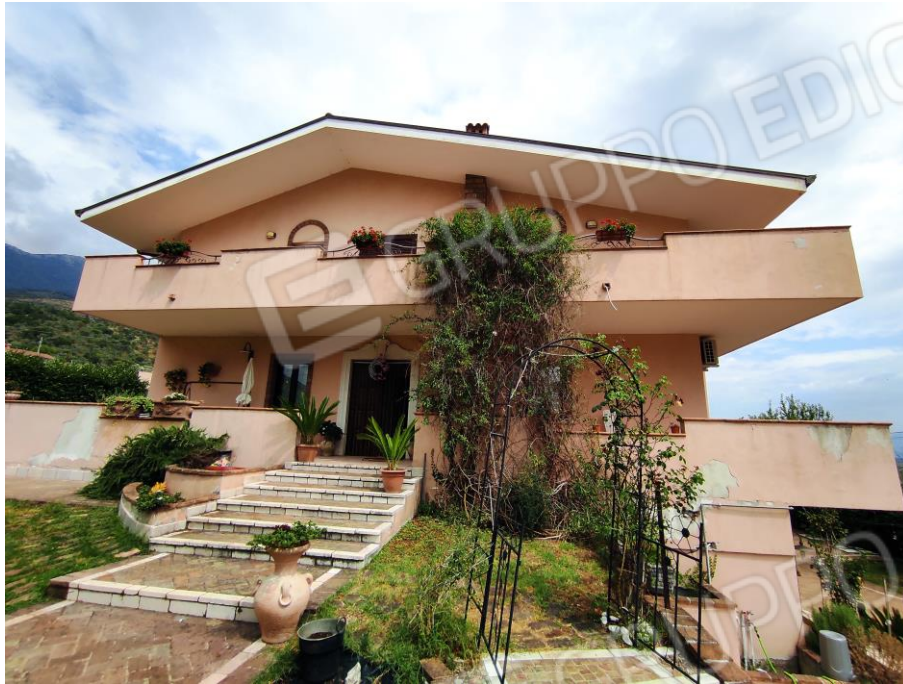
Prospetto frontale lato ingresso del fabbricato in cui sono ubicati i beni oggetto della presente Esecuzione Immobiliare (lato ovest). In cui si evince l'ingresso dei beni n. 1, 3 e 4 contraddistinti con i sub 6,7,8.