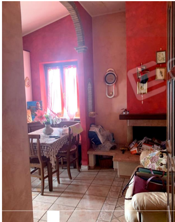
Vista parziale interna della cucina dalla zona ingresso.

03037 PONTECORVO (Fr) Via B. CROCE, snC Tel./fax. 0776761774 e-mail: dariobastoni@libero.it Pec: architettodariobastoni@pec.it