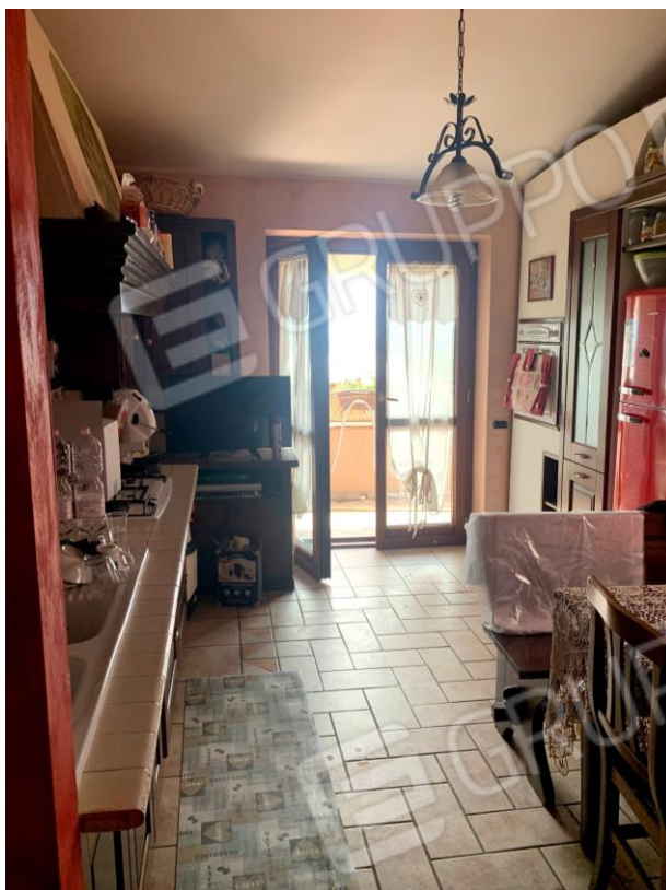
Vista parziale interna della cucina.