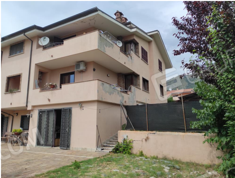
Prospetto laterale del fabbricato in cui sono ubicati i beni oggetto della presente Esecuzione Immobiliare (lato est).