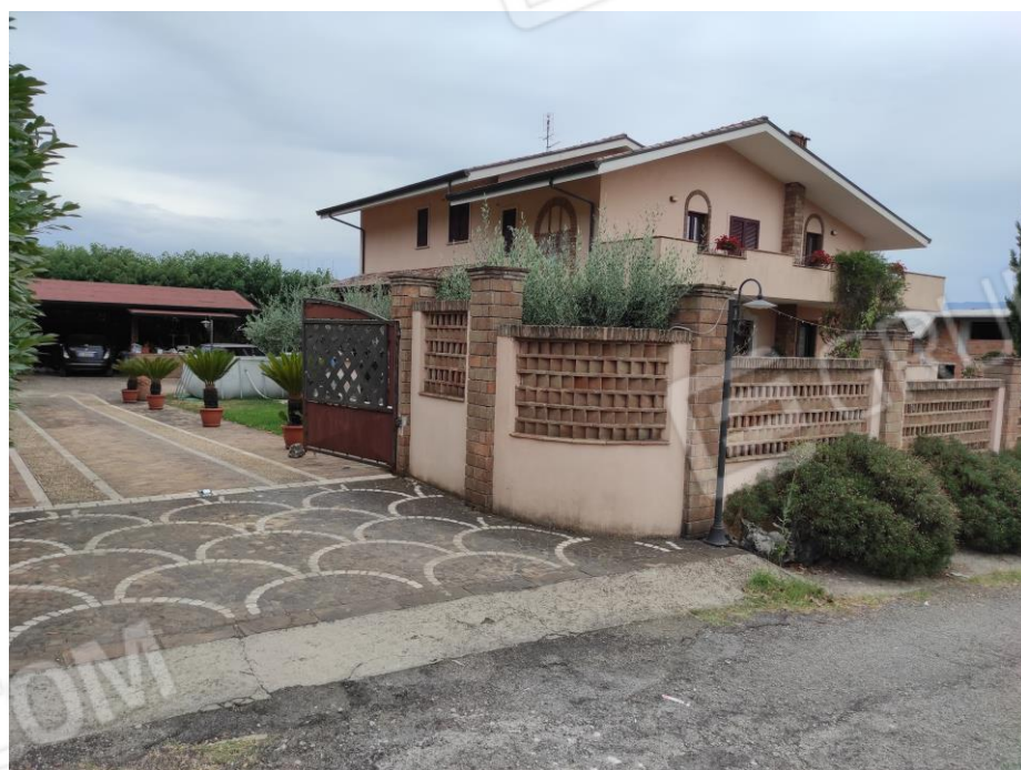
Vista generale del fabbricato da via Grotta Scacciamosca in cui sono ubicati i beni oggetto della presente Esecuzione Immobiliare. (lato nord-ovest)