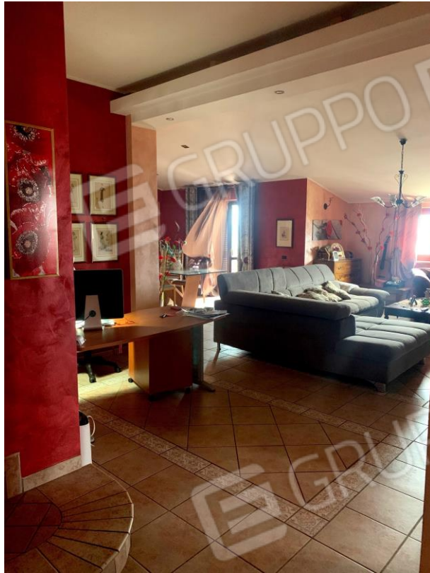
Vista parziale interna della sala da pranzo dalla zona ingresso.