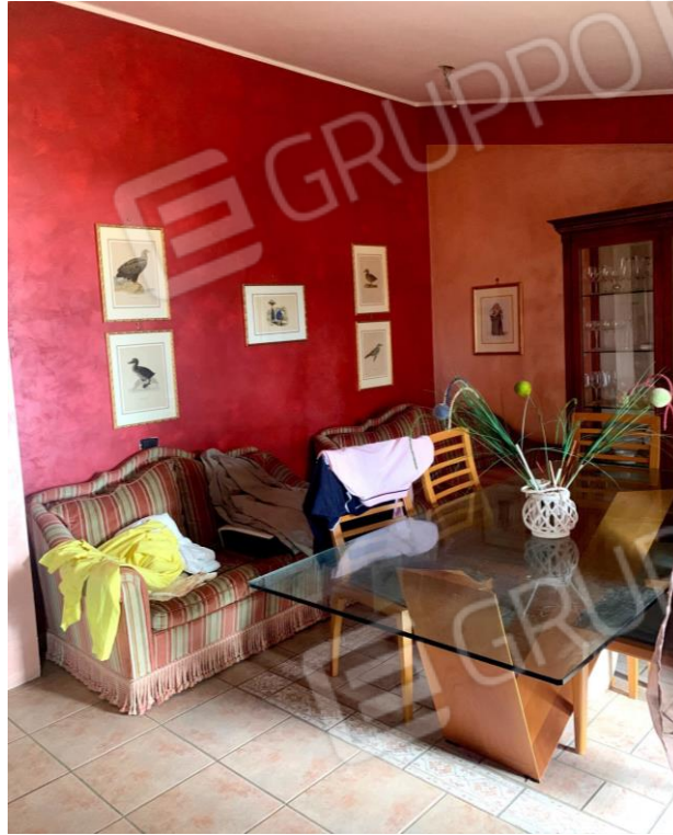
Viste parziali interne della sala da pranzo.

(Appartamento a piano primo ubicato a Castrocielo (FR) - Via Grotta Scacciamosca, 23 in N.C.E.U., al Fg. 6 P.lla 374 Sub 6)