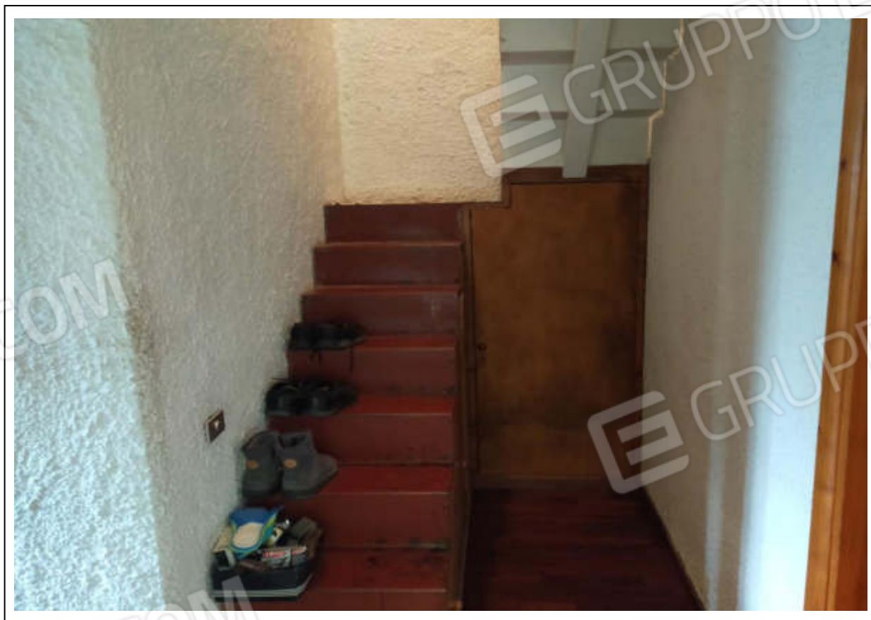
ripresa fotografica n.8 - scala di collegamento piano primo-sottotetto