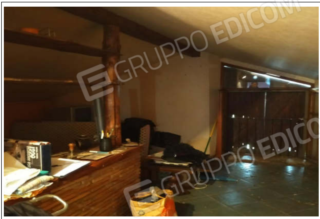
ripresa fotografica n.7 – sottotetto