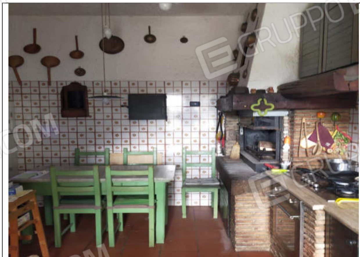
ripresa fotografica n.4 - cucina piano terra