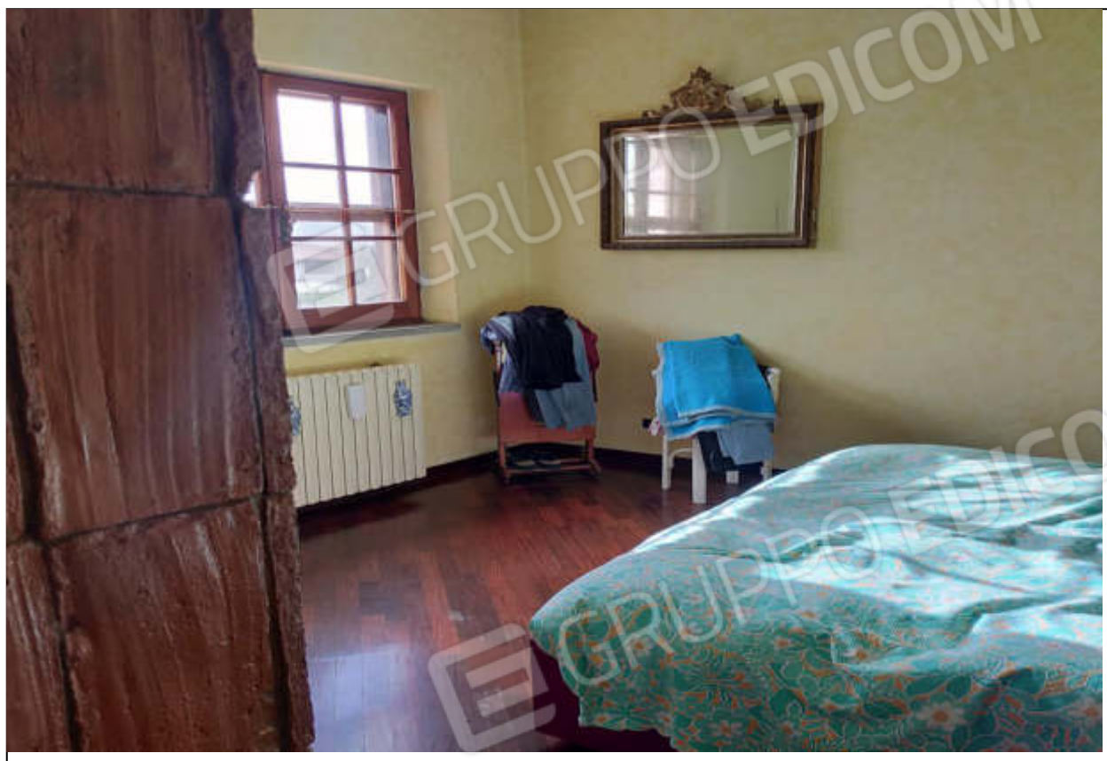
ripresa fotografica n.9 – camera piano primo