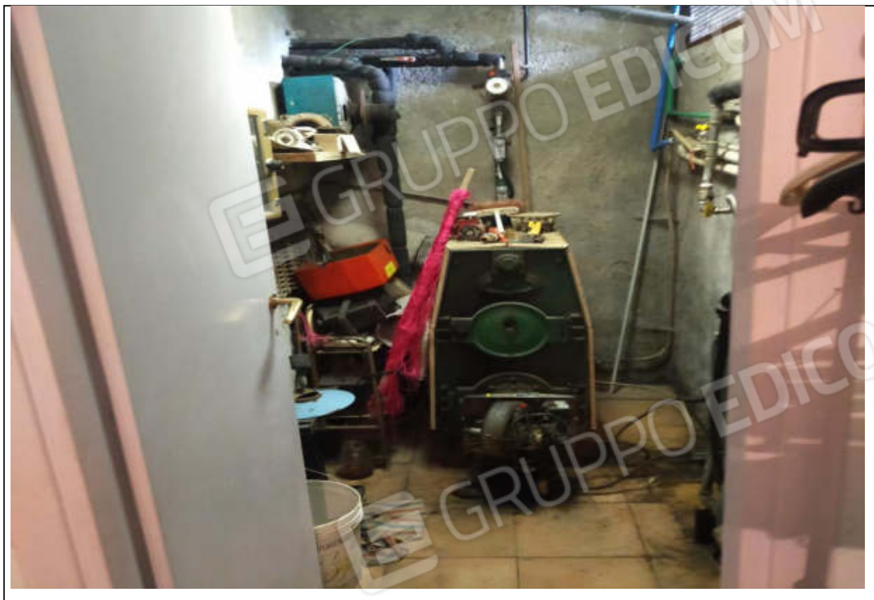
ripresa fotografica n.17 – locale caldaia piano interrato