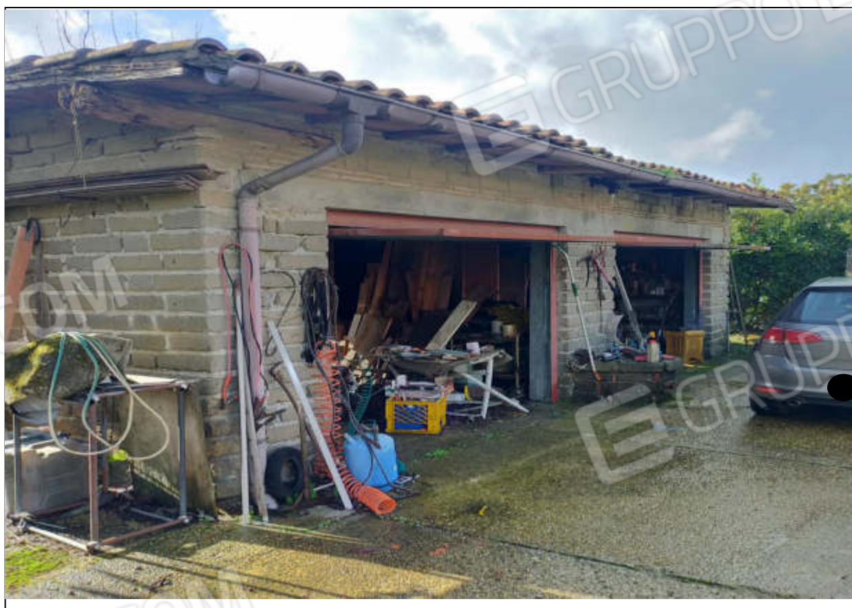
ripresa fotografica n.18 - magazzino-box