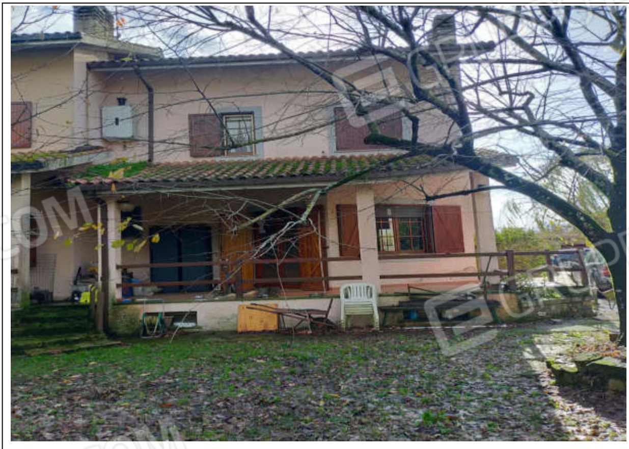
ripresa fotografica n.2 - esterno villino