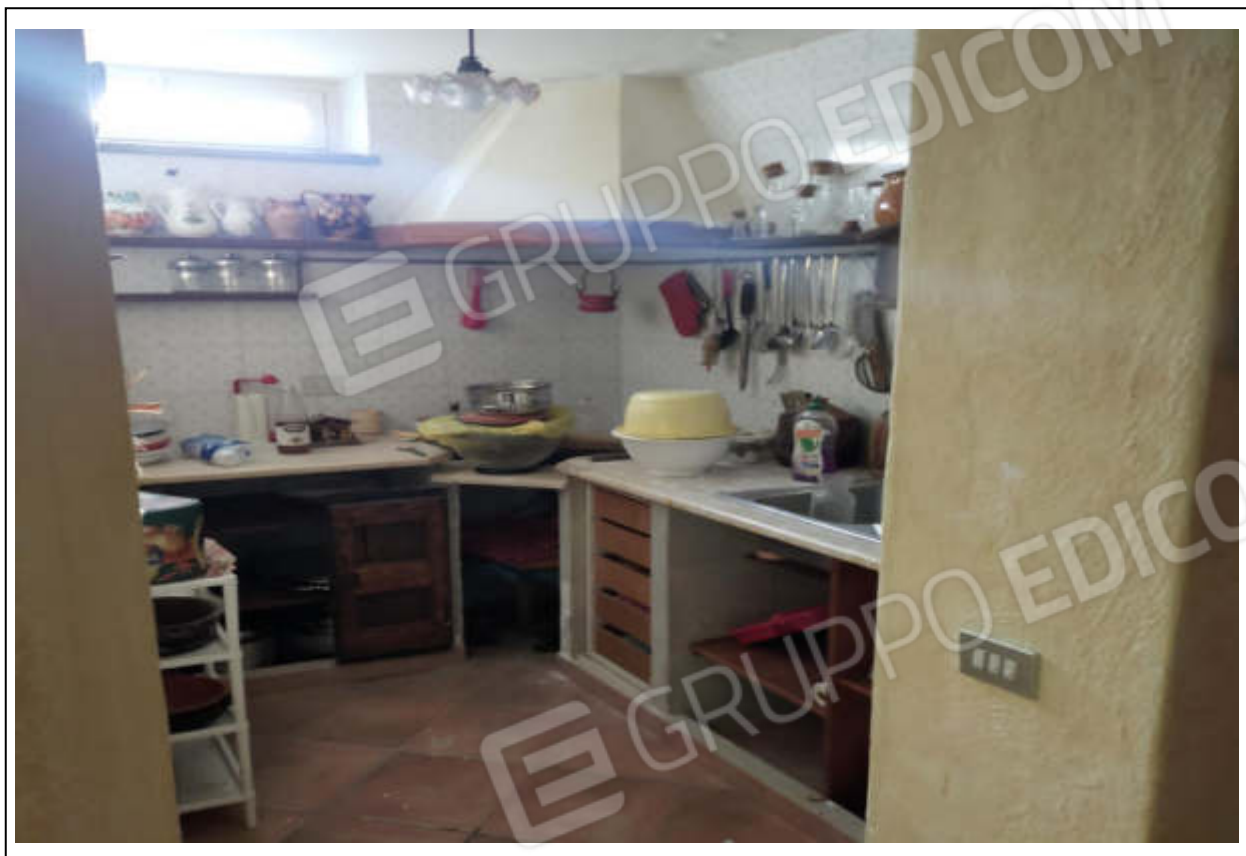
ripresa fotografica n.13 – cucinino piano interrato