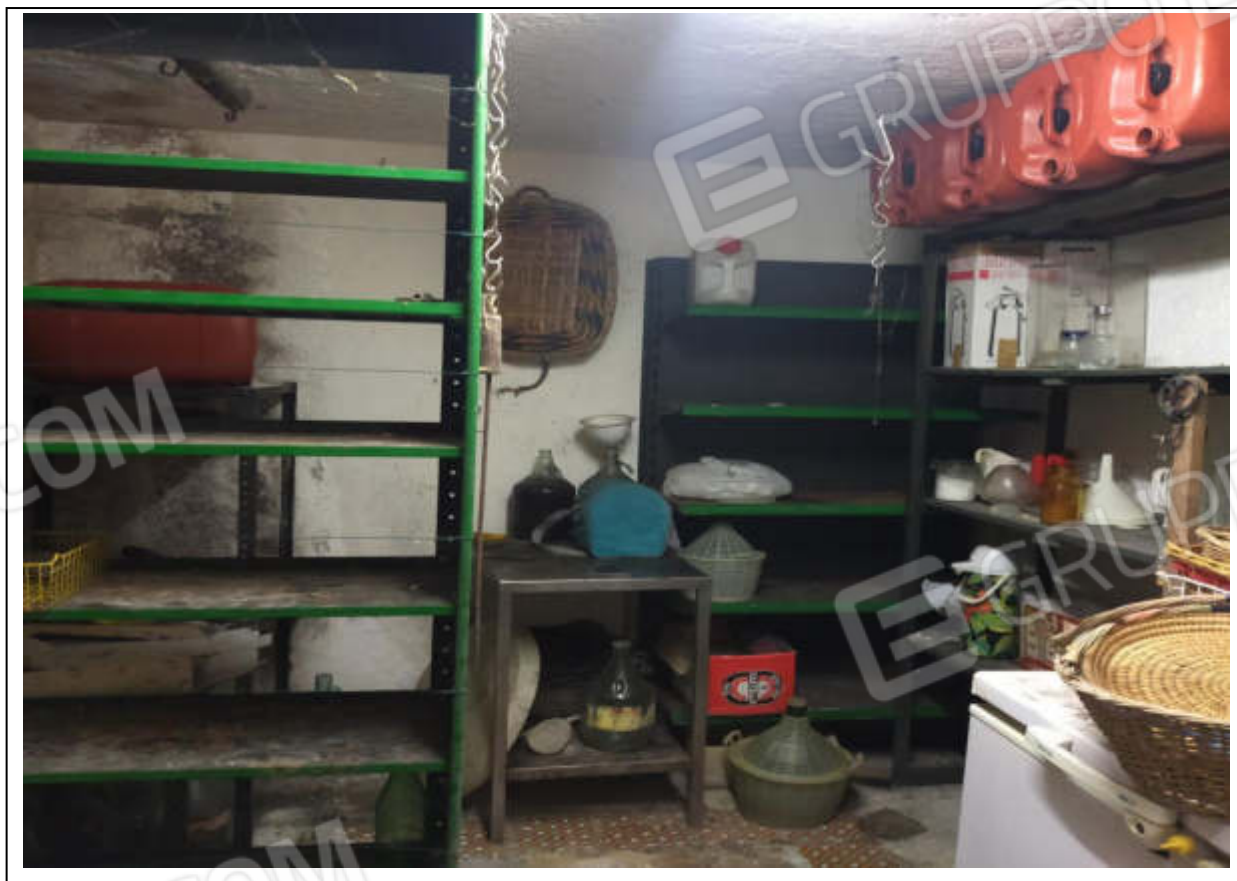
ripresa fotografica n.14 - deposito piano interrato