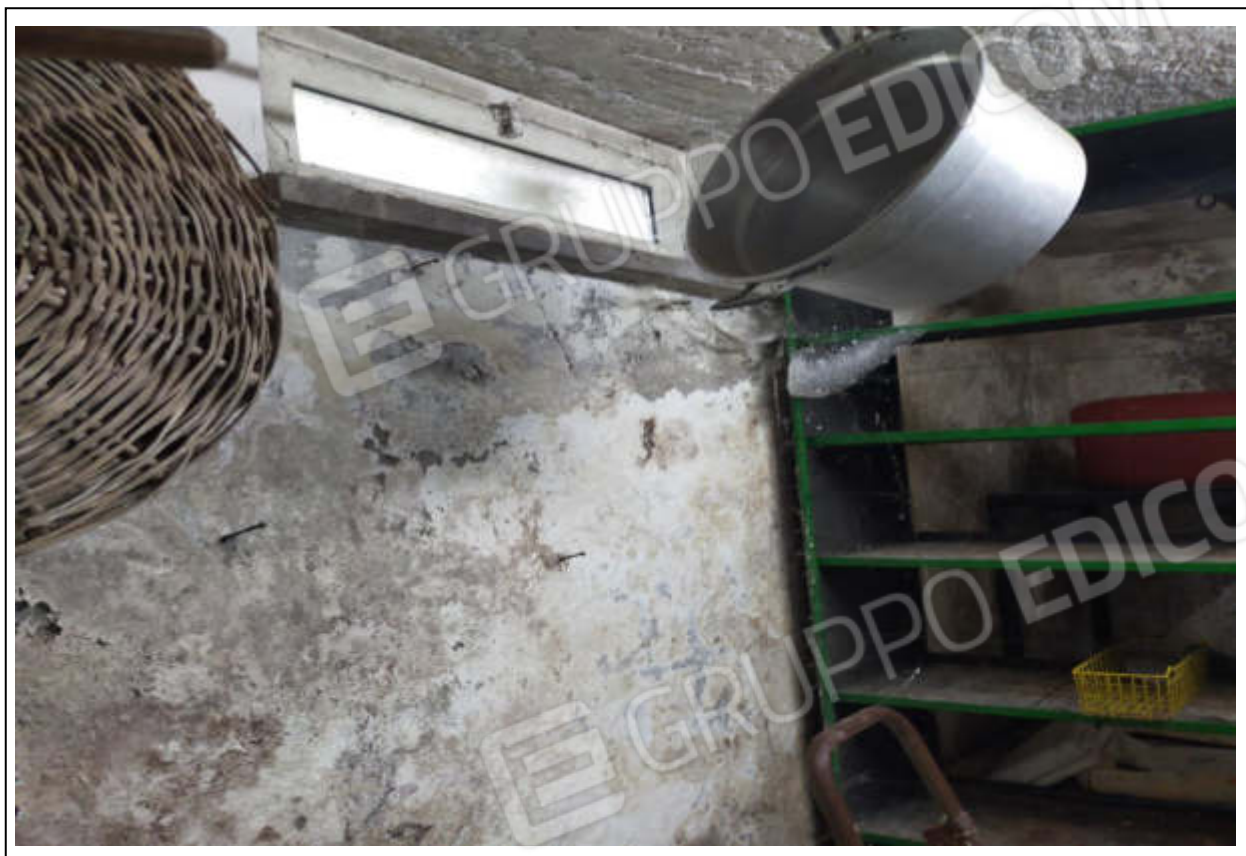
ripresa fotografica n.15 – deposito piano intetto