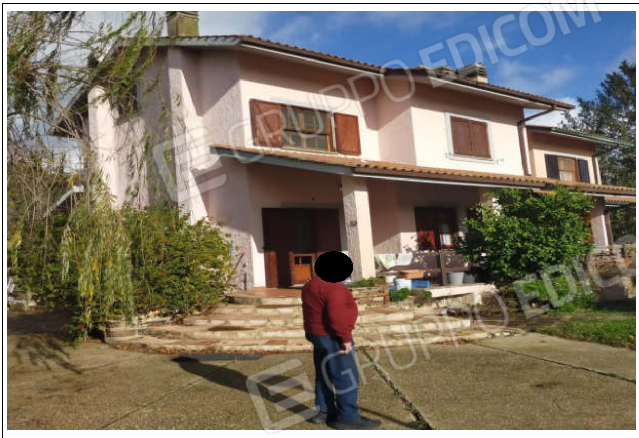
ripresa fotografica n.1 – esterno villino