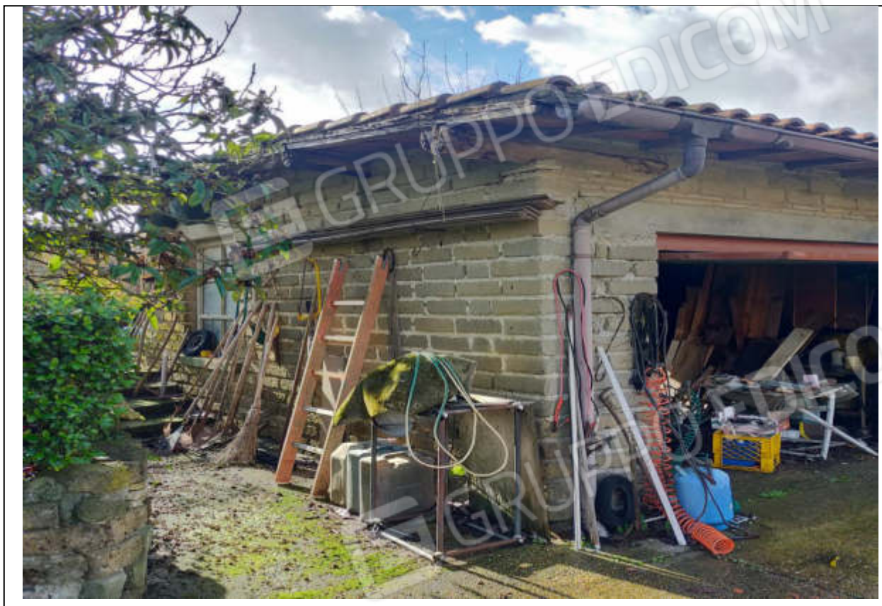
ripresa fotografica n.19 - magazzino-box