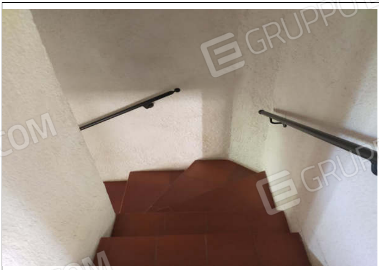
ripresa fotografica n.6 - scala di collegamento piano terra-primo