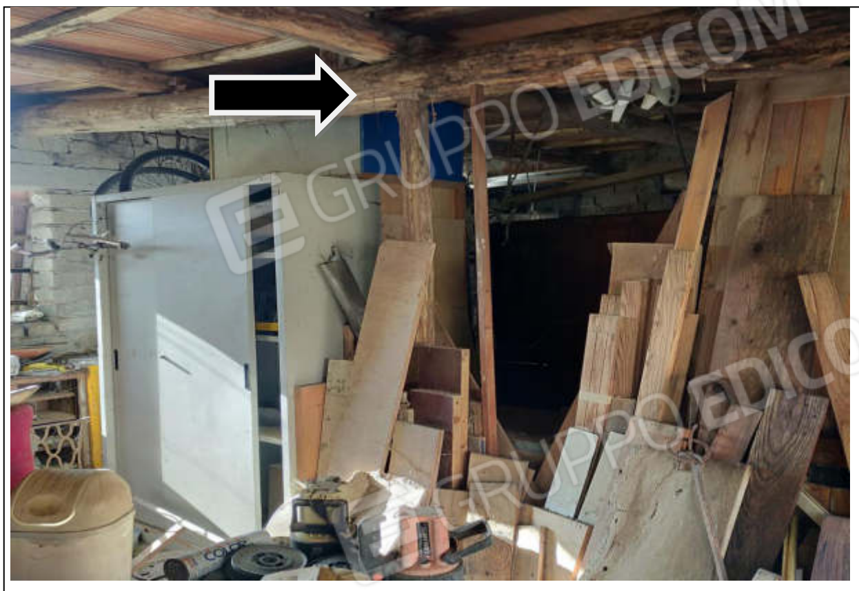
ripresa fotografica n.21 – interno magazzino-box