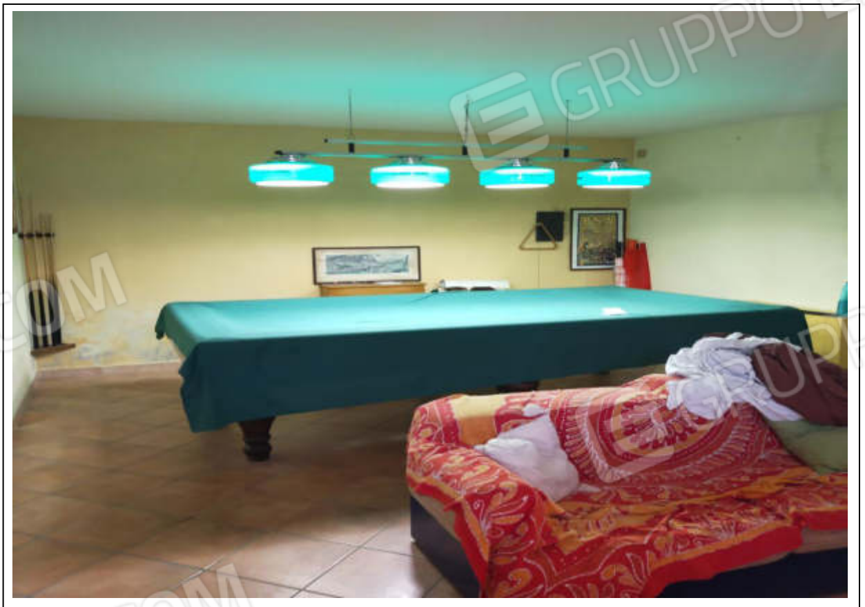
ripresa fotografica n.12 - piano interrato