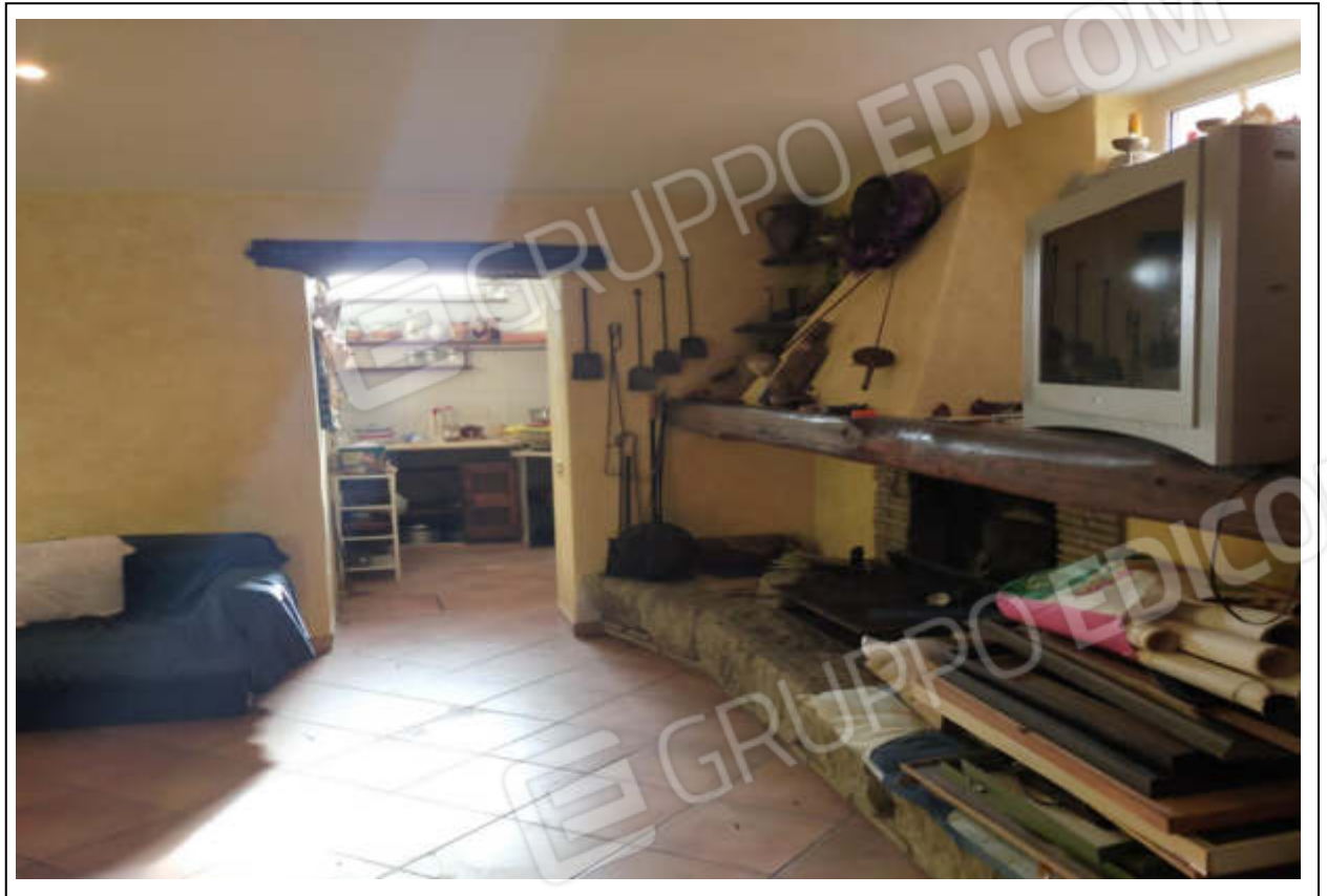
ripresa fotografica n.11 – piano interrato