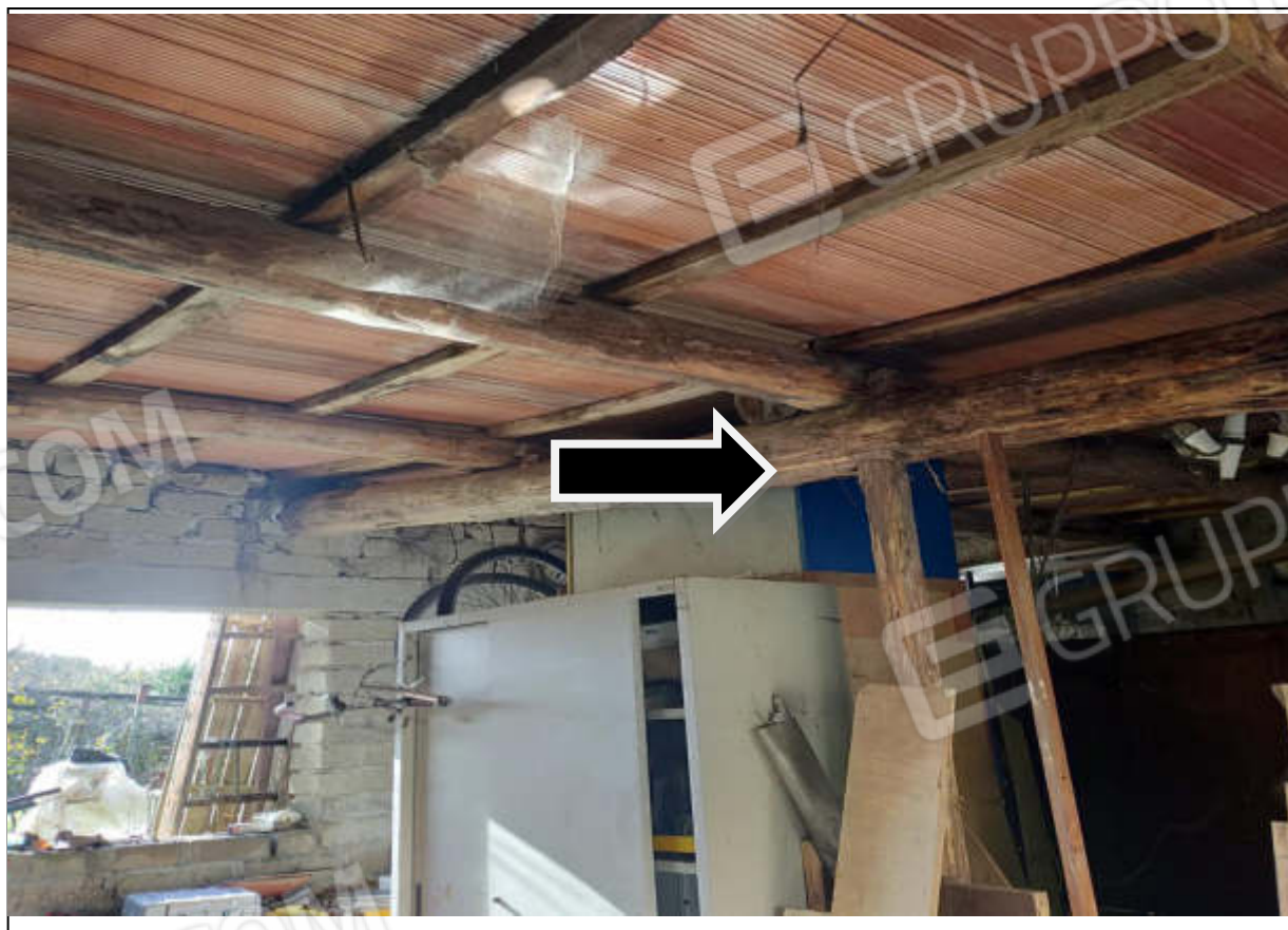
ripresa fotografica n.22- interno magazzino-box