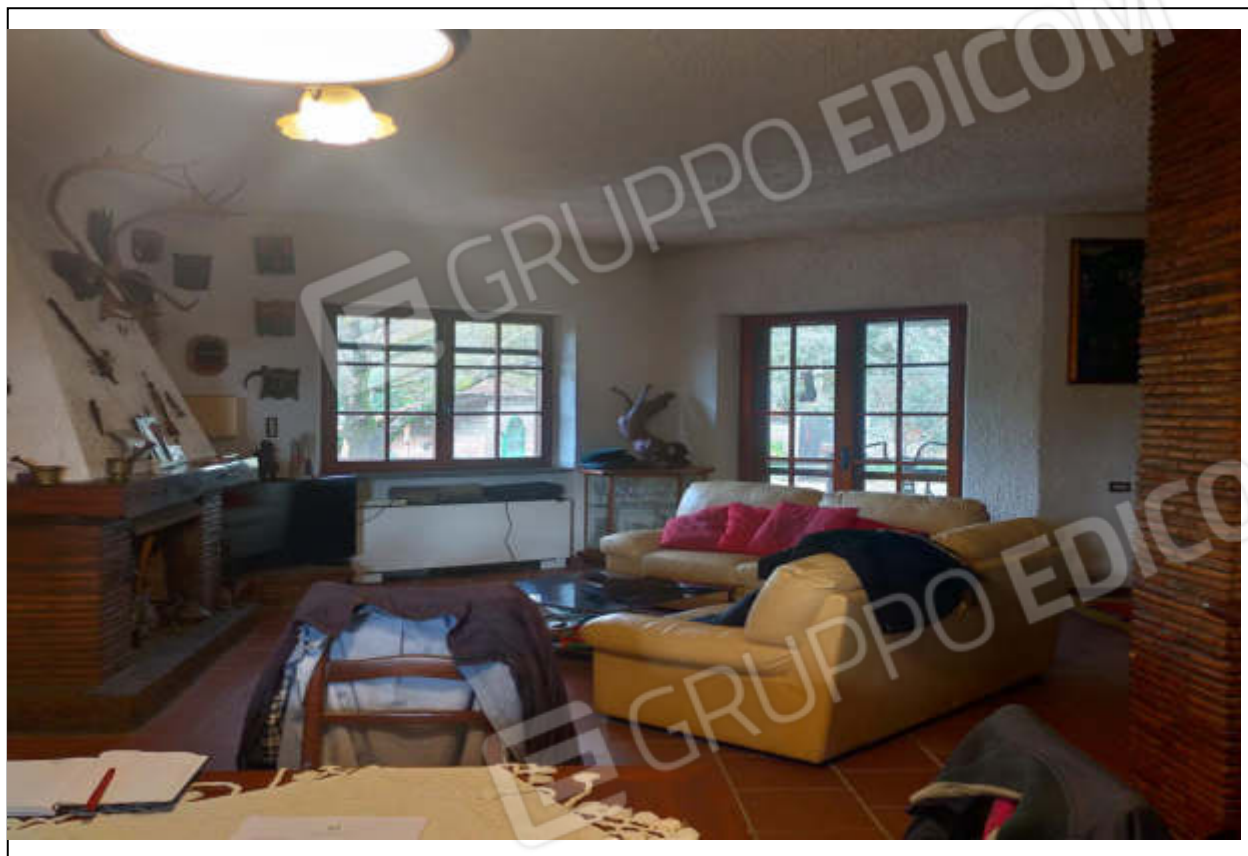
ripresa fotografica n.3 – soggiorno piano terra