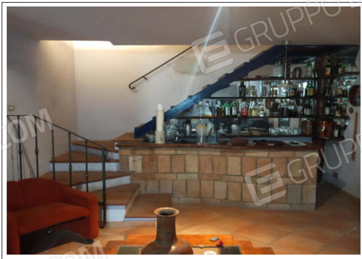
ripresa fotografica n.10 – scala di collegamento piano interrato-primo