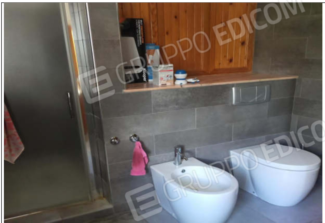
ripresa fotografica n.5 – bagno piano terra