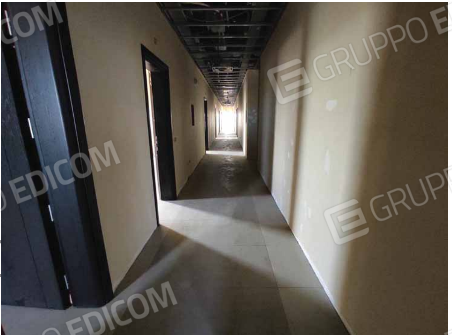
Corridoio piano primo