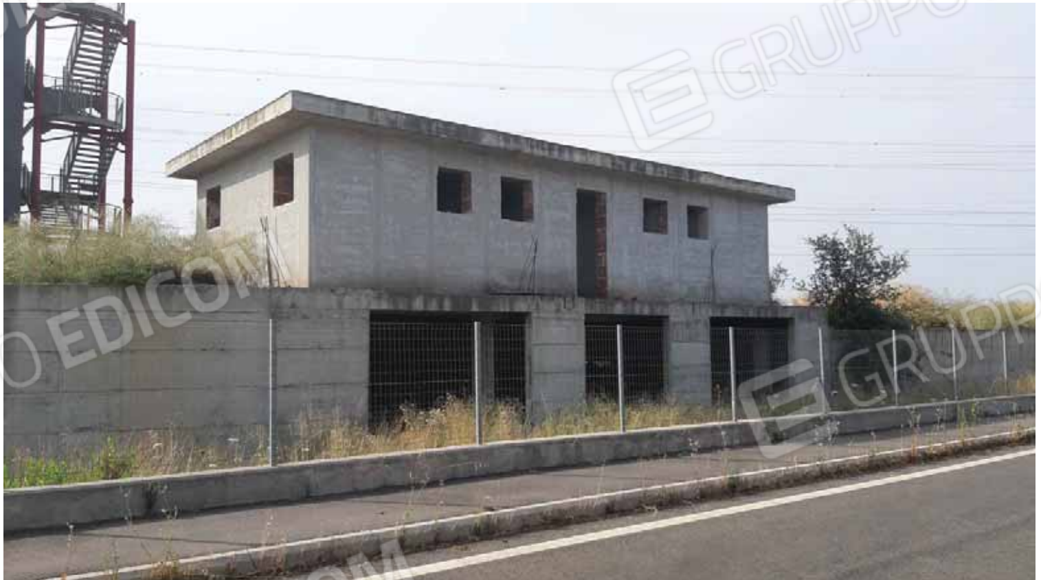
Casottino servizi piscina