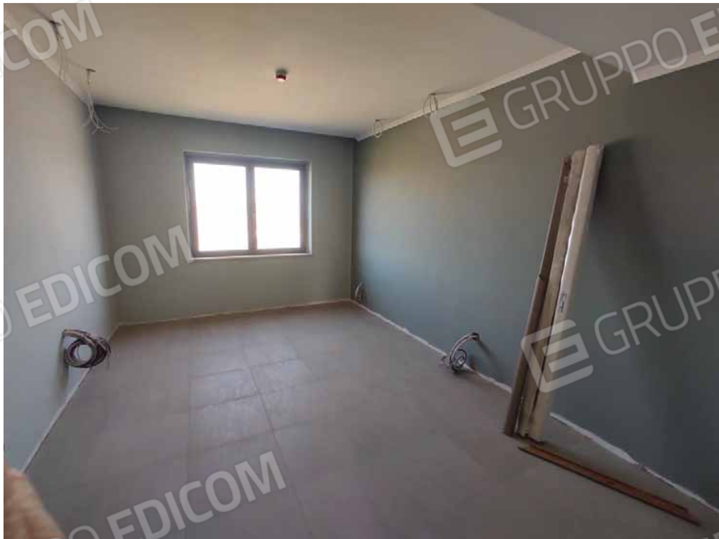
Camera tipo piano secondo