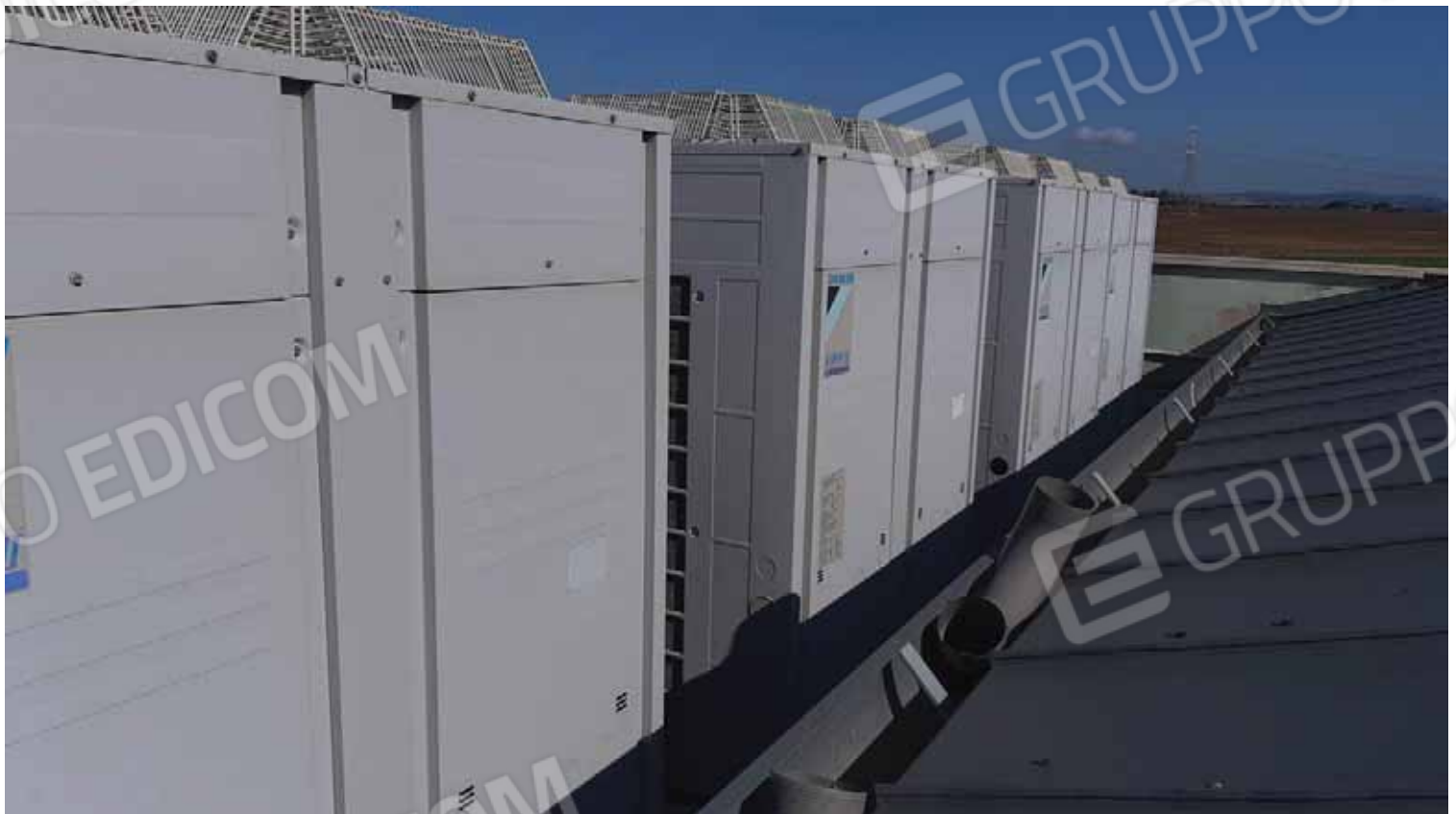
Macchinari posti su piano coperture