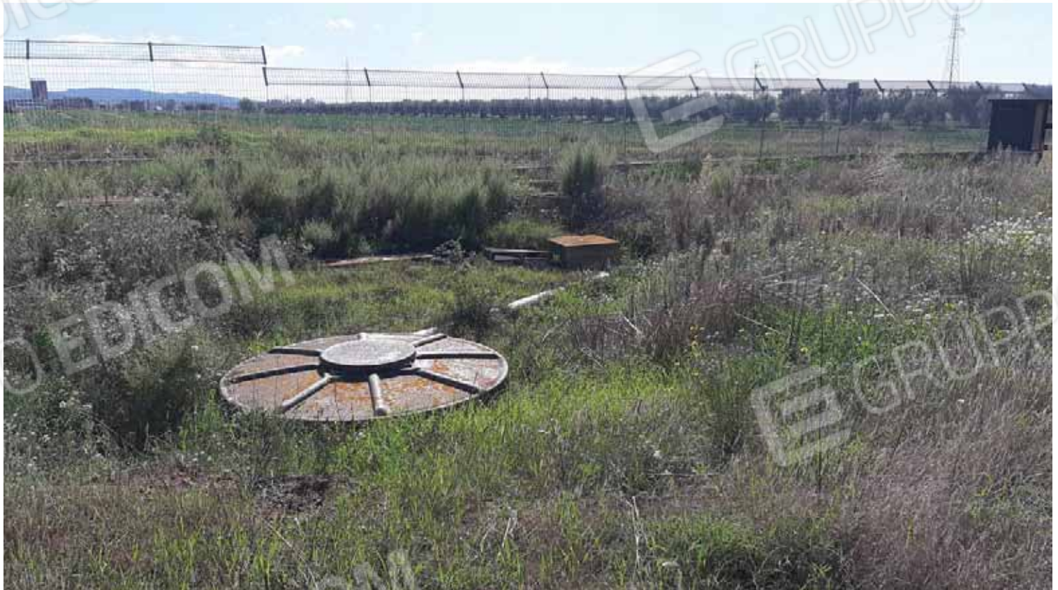
Foto terreno, Foglio 123, part. 45/59/100, impianti tecnologici.