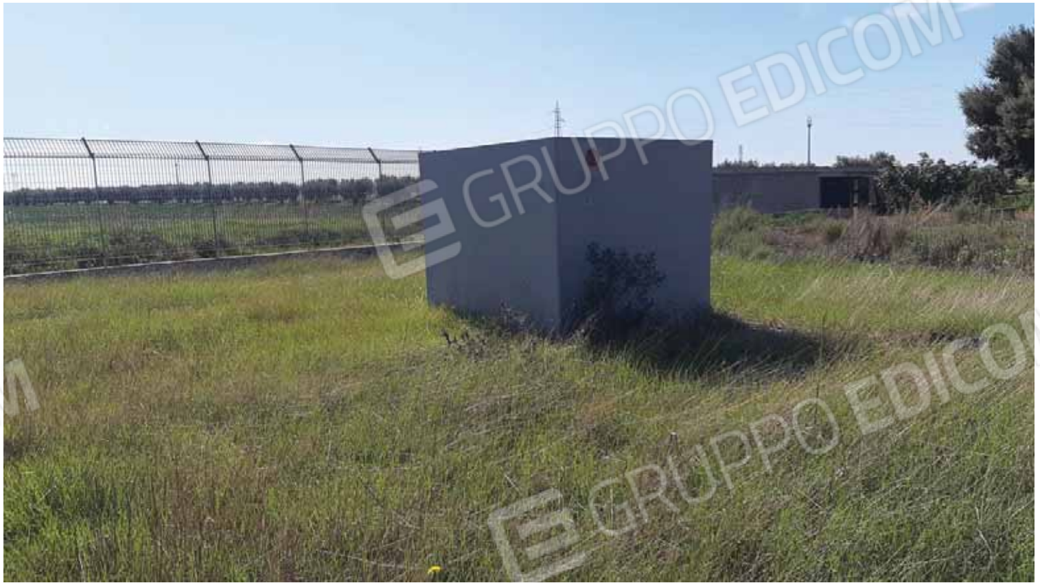
Foto terreno, Foglio 123, part. 45/59/100, impianti tecnologici