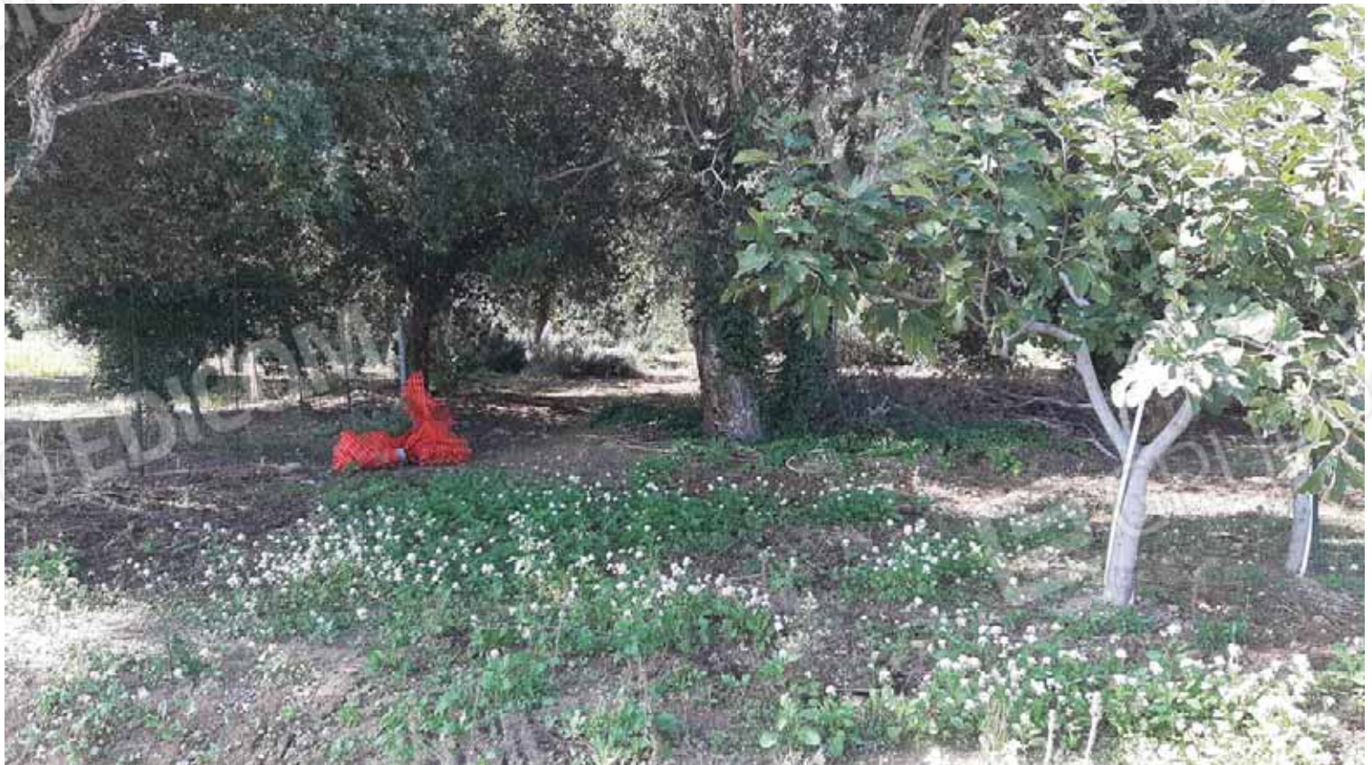
Foto terreno, Foglio 123, part. 45/59/100, impianti tecnologici