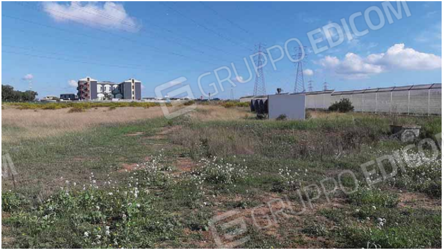
Foto terreno, Foglio 123, part. 45/59/100, impianti tecnologici