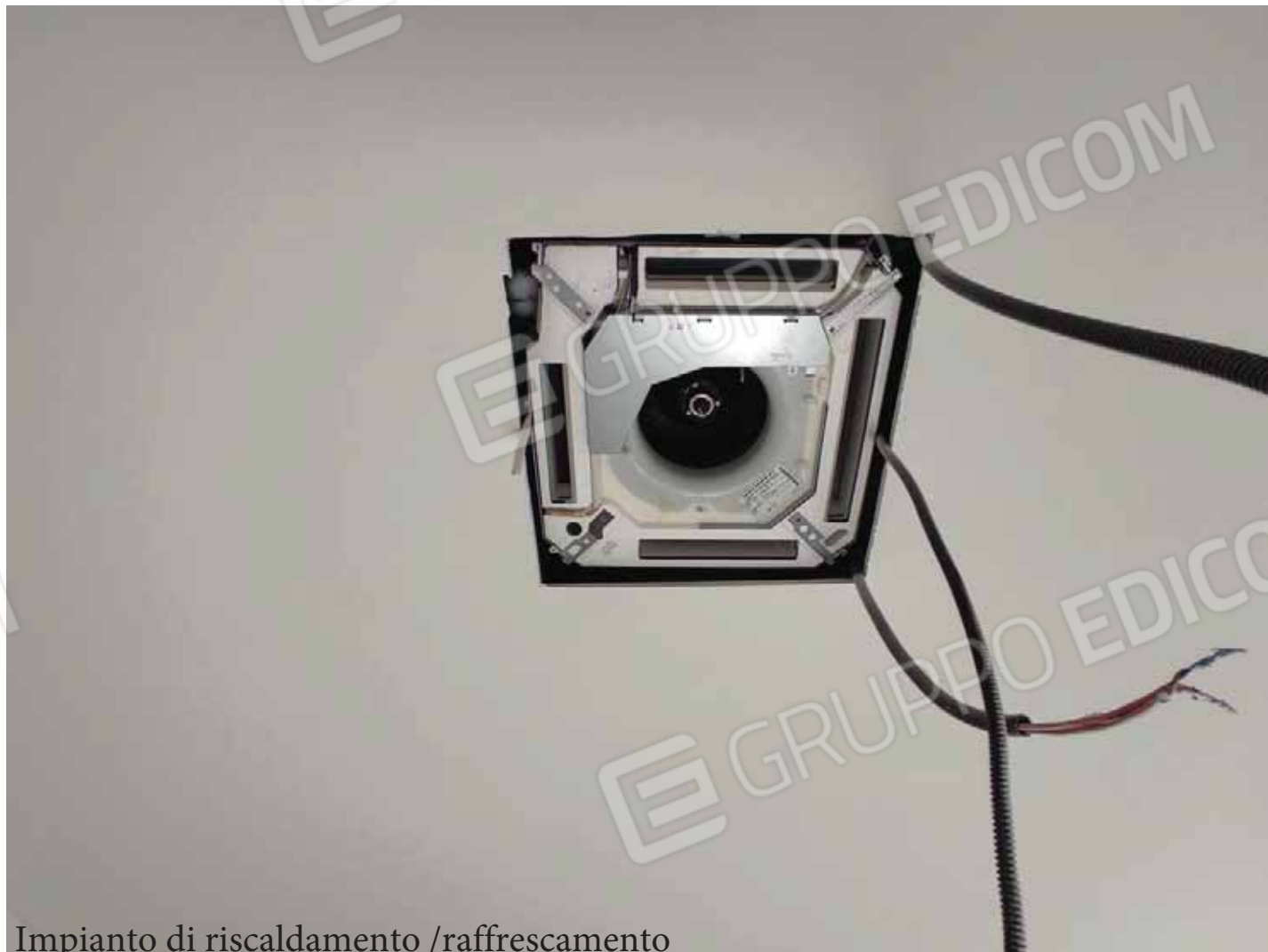
Impianto di riscaldamento /raffrescamento