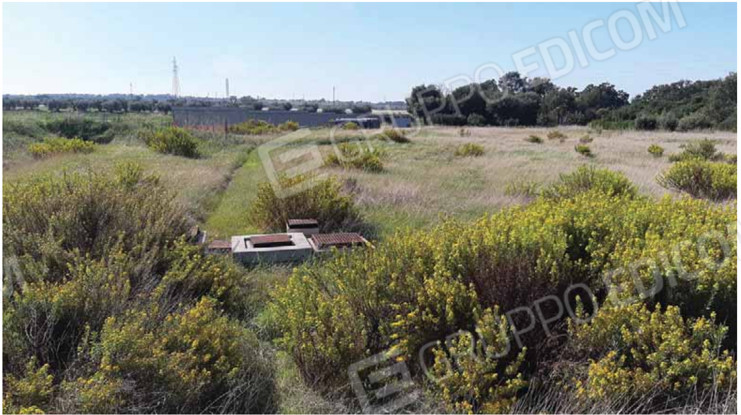
Foto terreno Foglio 123, part. 45/59/100, impinti tecnologici.