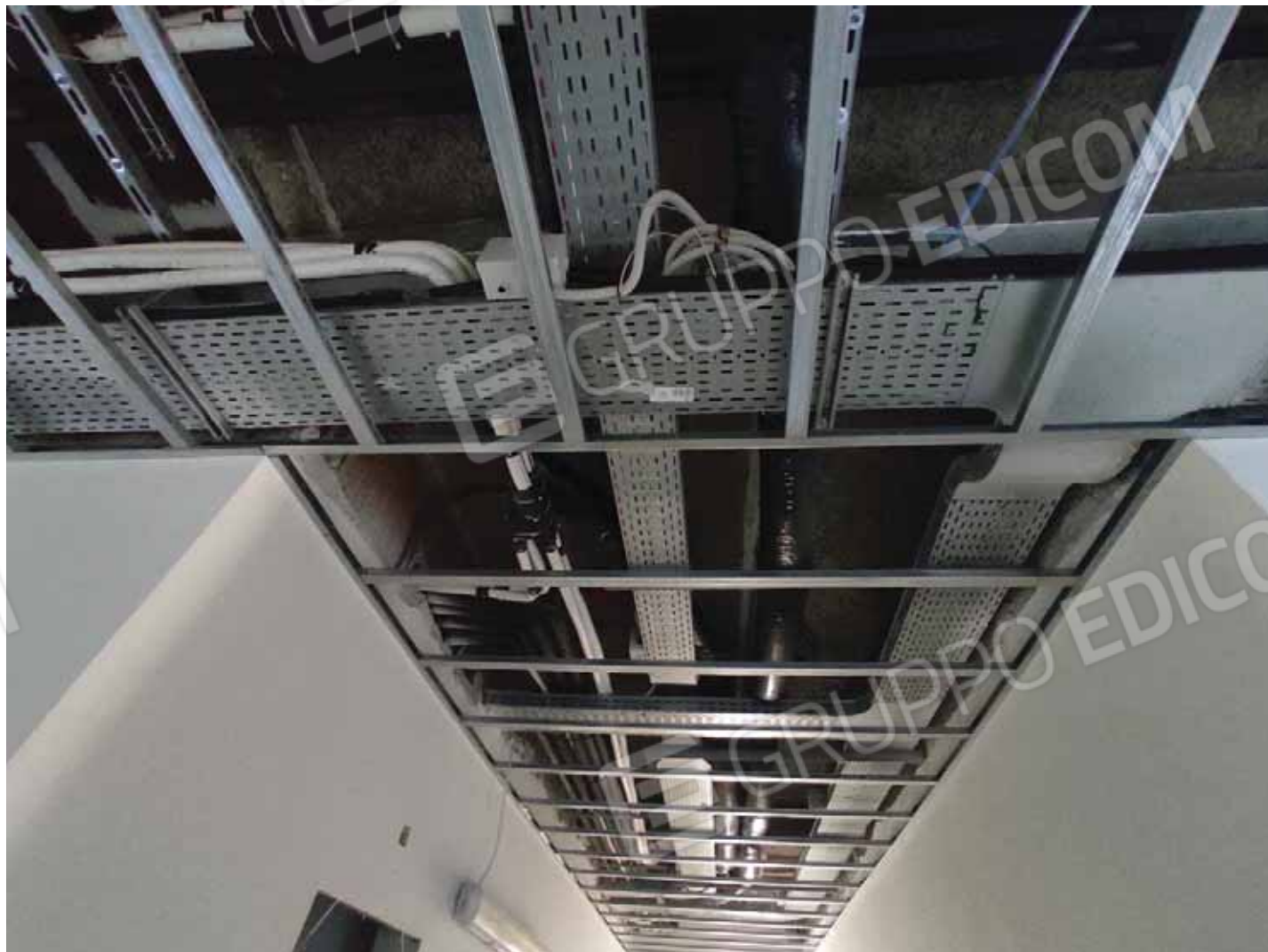
Impianti nel controsoffitto