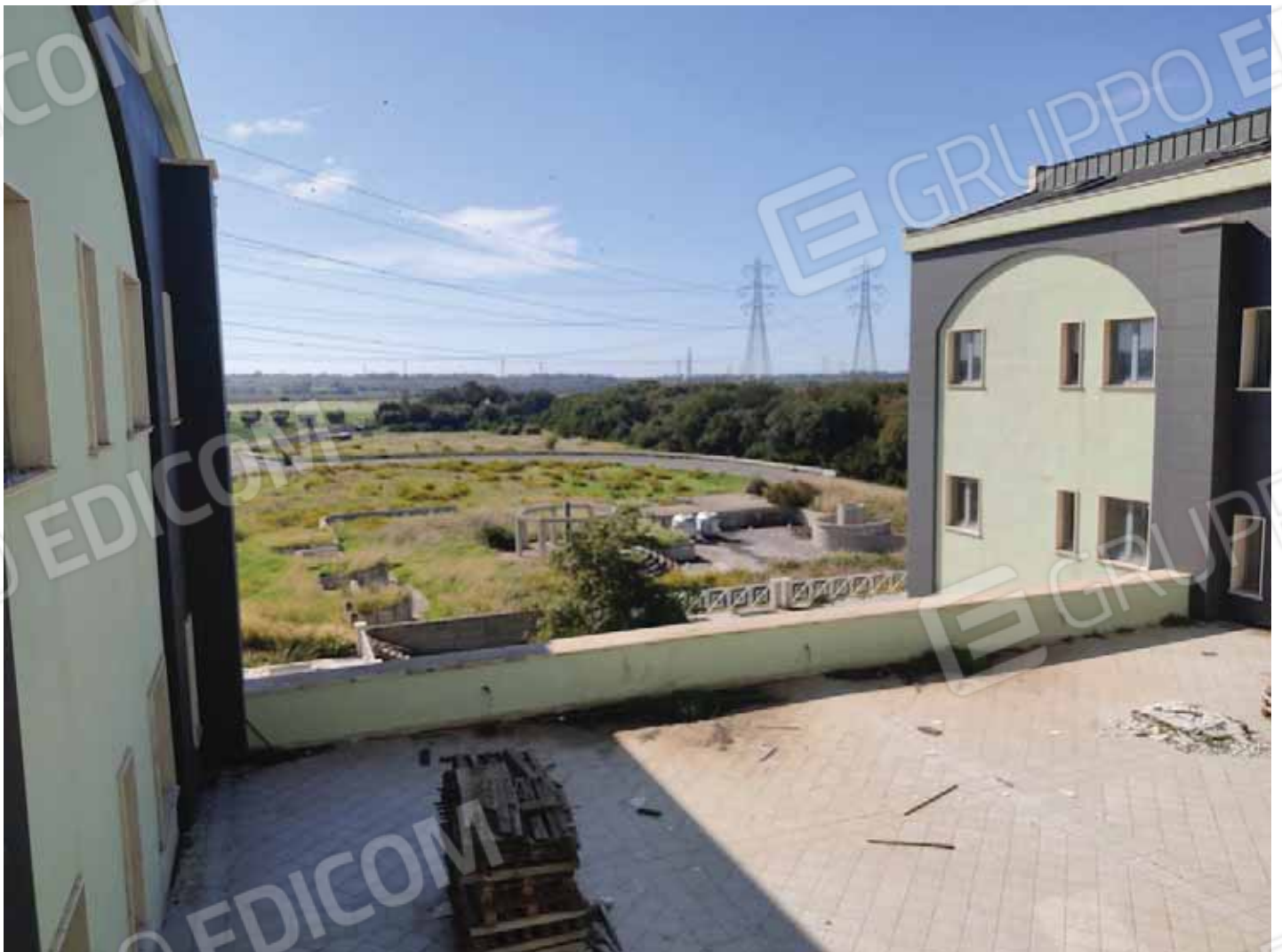
Vista terrazzo da balcone al primo piano