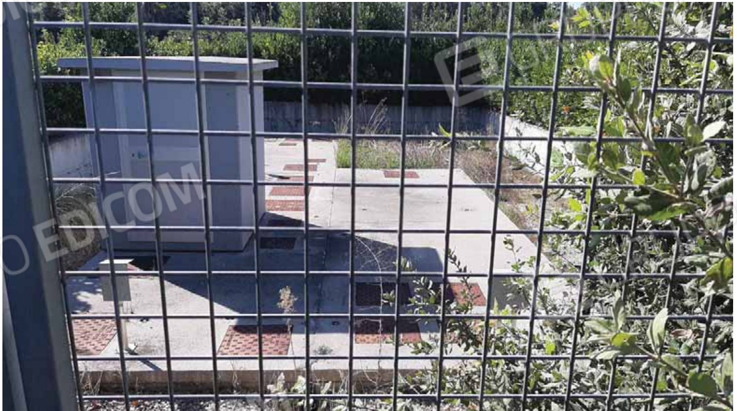
Foto terreno, Foglio 123, part. 45/59/100, impianti tecnologici.