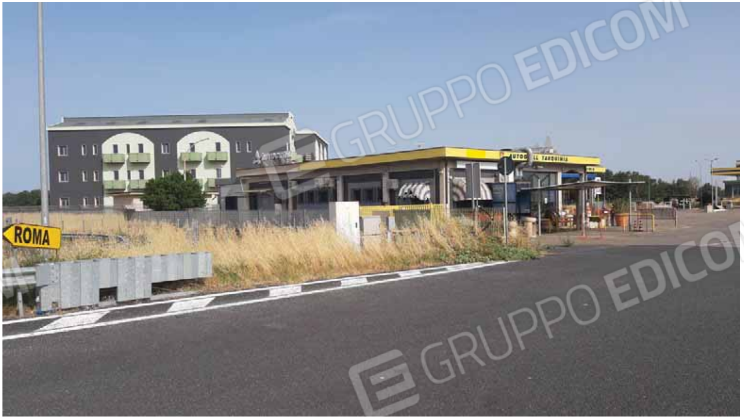
Struttura ricettiva lato autogrill