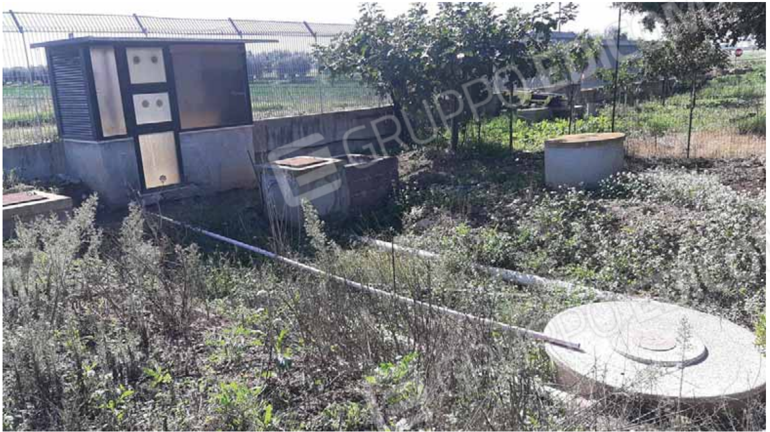
Foto terreno, Foglio 123, part. 45/59/100, impianti tecnologici