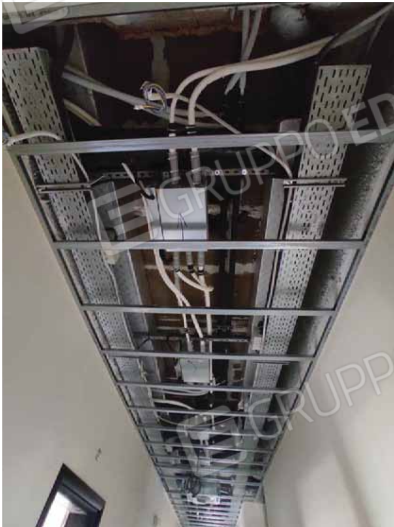
Passaggio di impianti a controsoffitto