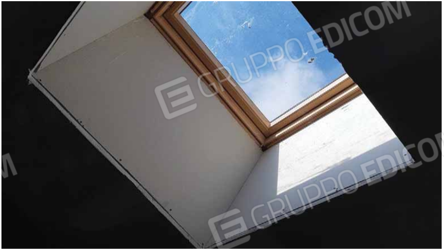
Lucernaio piano sottotetto