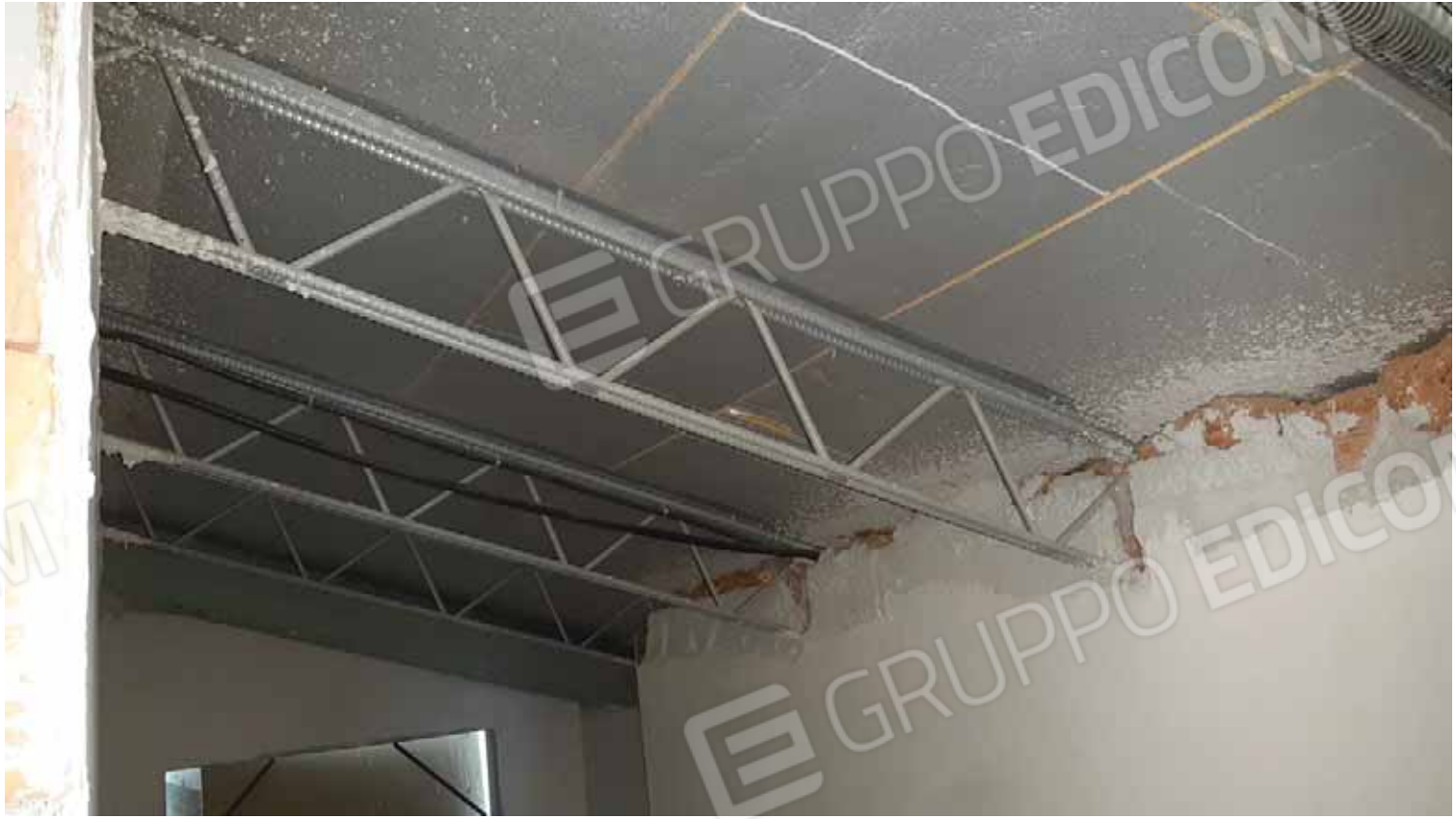
Vano scala verso piano seminterrato