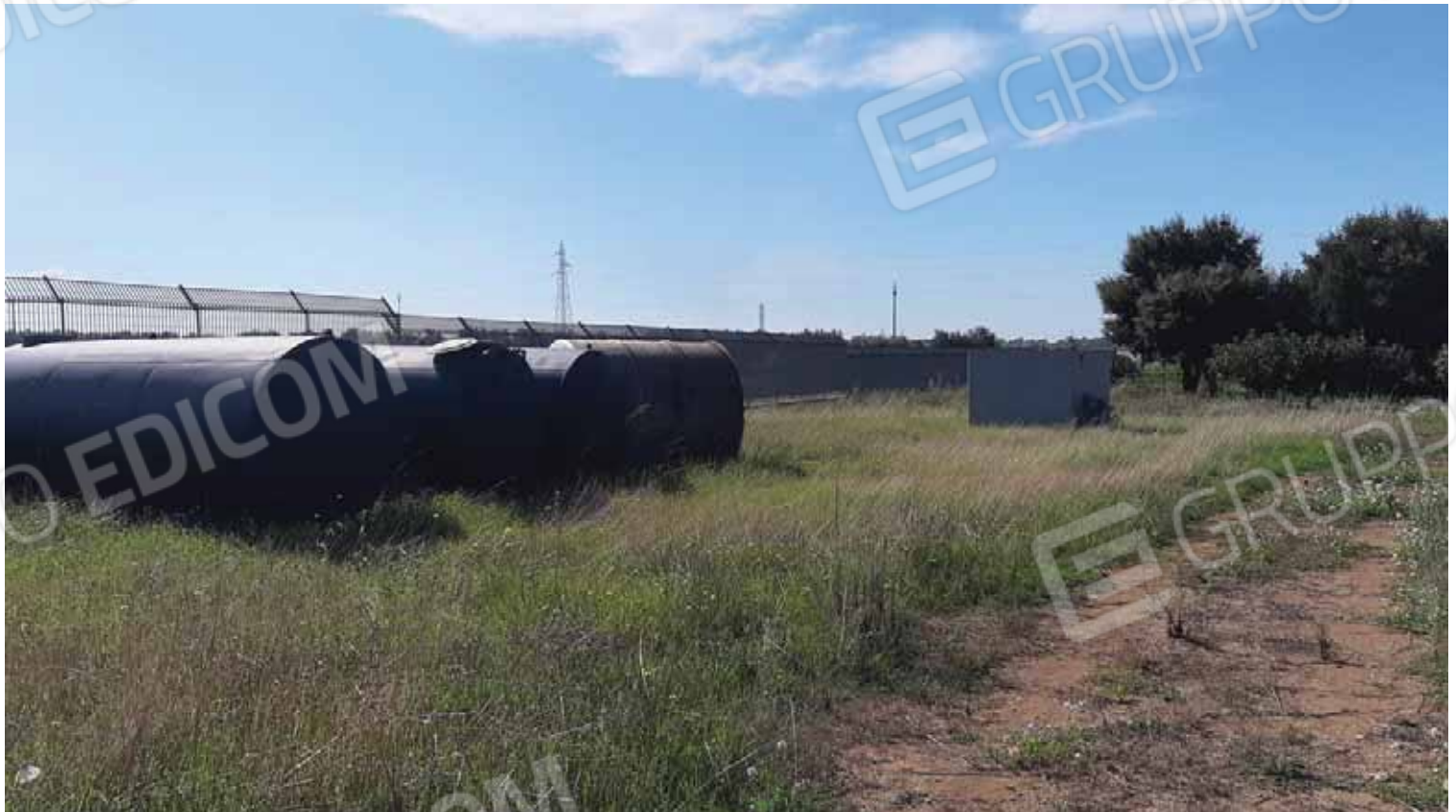
Foto terreno Foglio 123, part.45/59/100 , impianti tecnologici