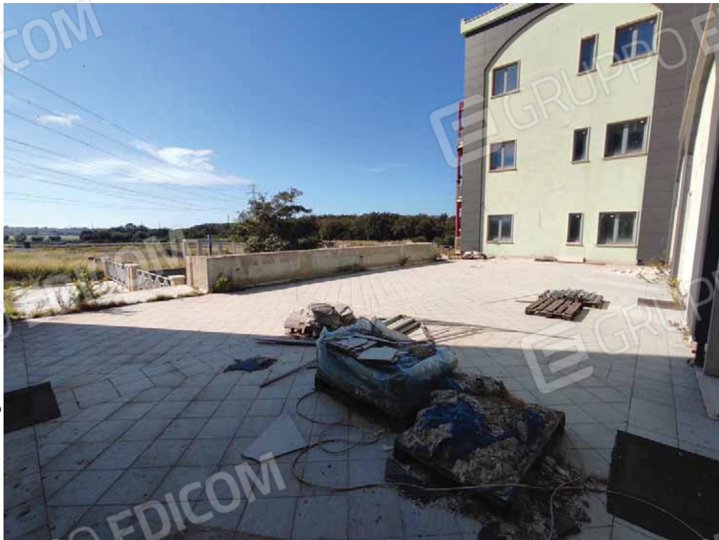
Vista terrazzo piano terra