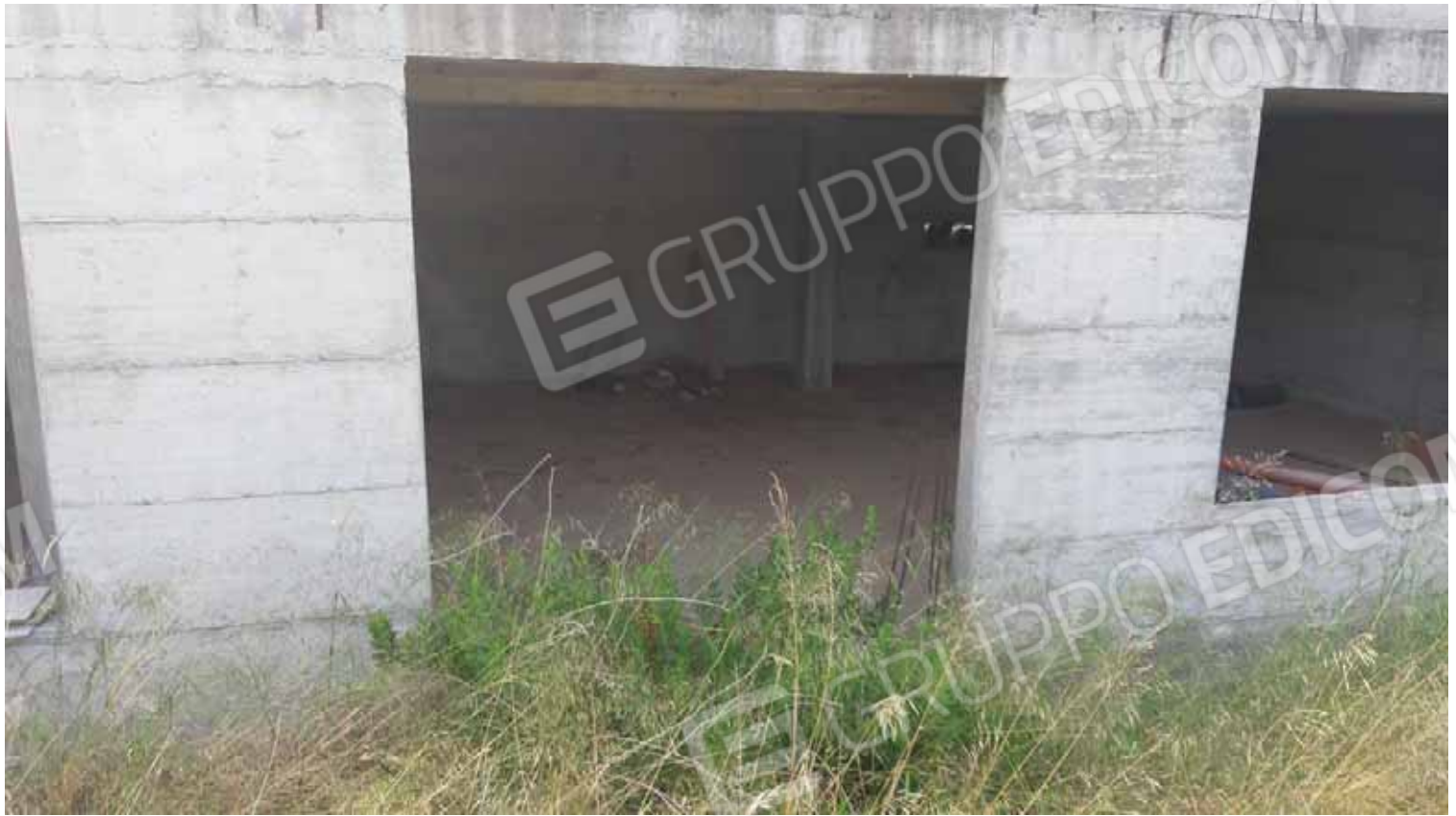
Casottino servizi piscina