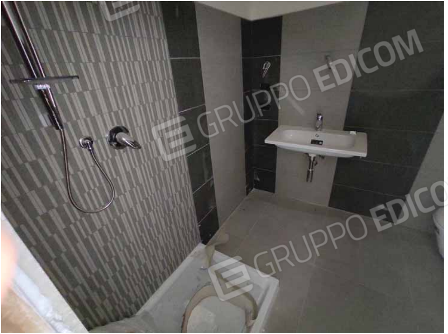
Tipologia di bagno al piano secondo