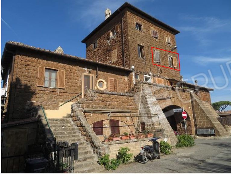
Foto n. 9_Esterna