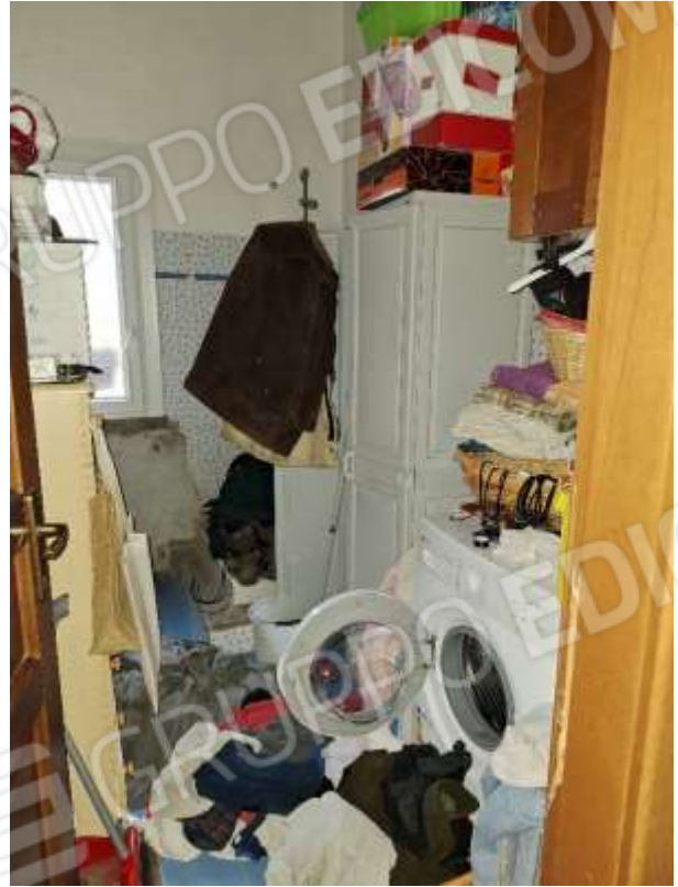
BAGNO 1 P.T.