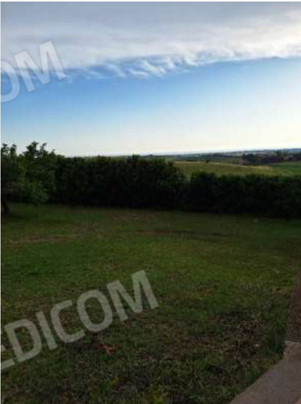
AREA GIARDINATA ESTERNA