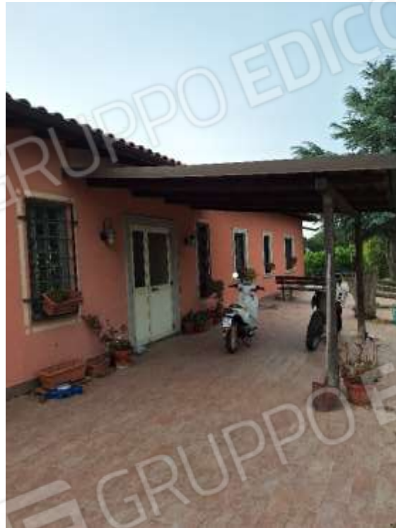
AREA ESTERNA P.T.