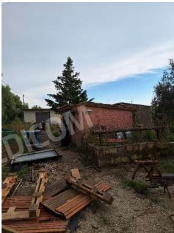
VOLUMI TECNICI P.T.