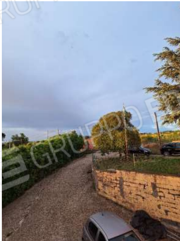
RAMPA ACCESSO P.INT.