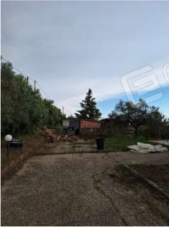
AREA ESTERNA P.T.