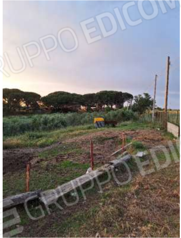
AREA ESTERNA P.T.