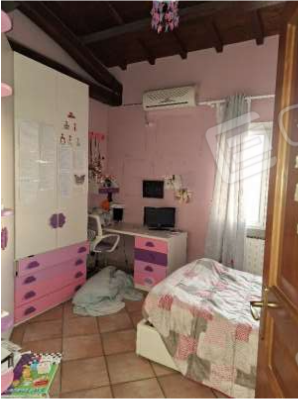
CAMERA 3 P.T.