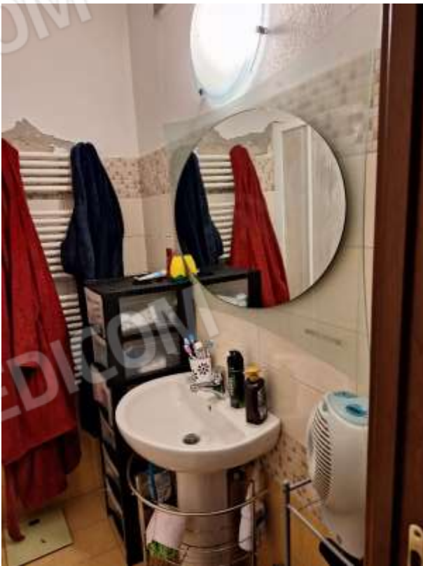
BAGNO 2 P.INT.