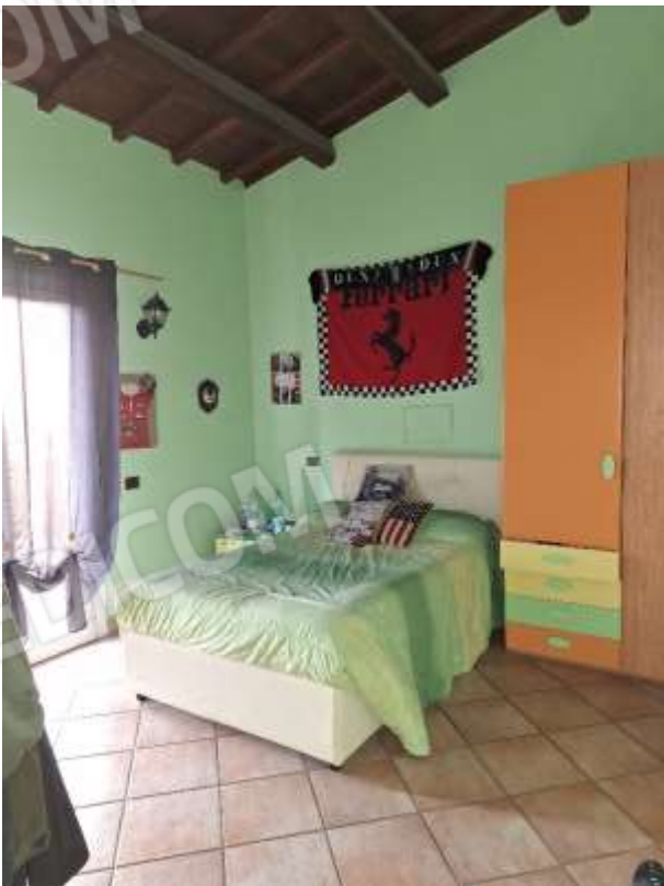
CAMERA 2 P.T.