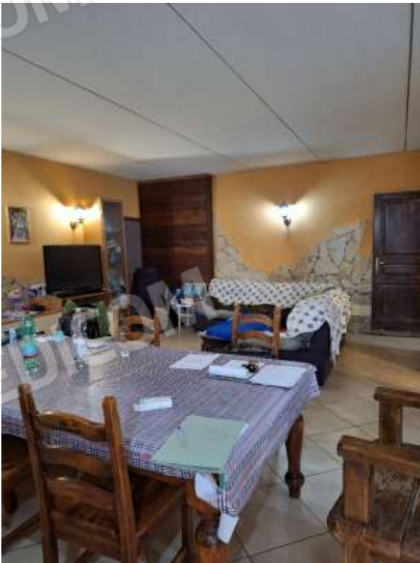
SOGGIORNO 2 P.INT.