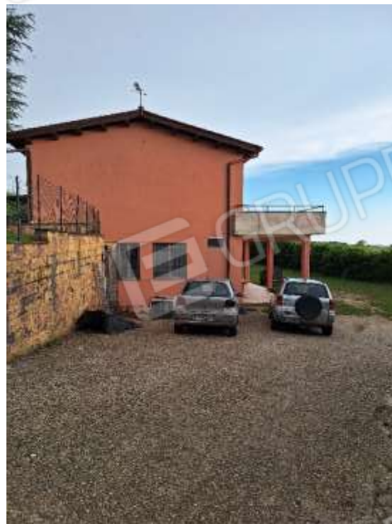
AREA ESTERNA P.INT.