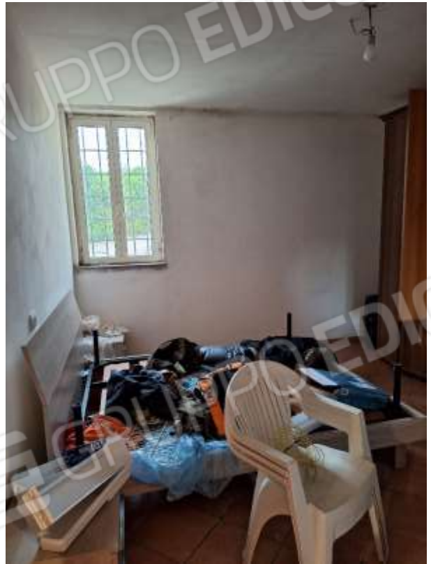
CAMERA 2 P.INT.