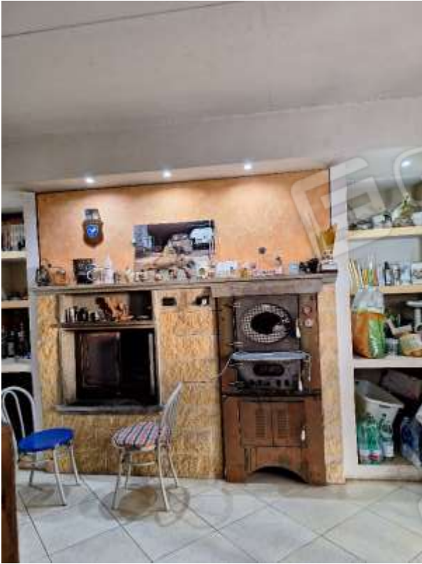
SOGGIORNO 2 P.INT.