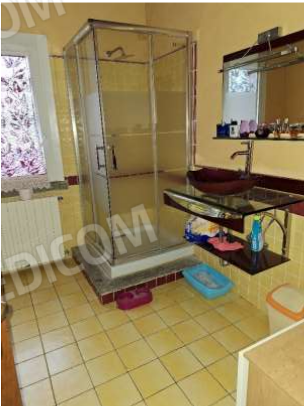
BAGNO 2 P.T.