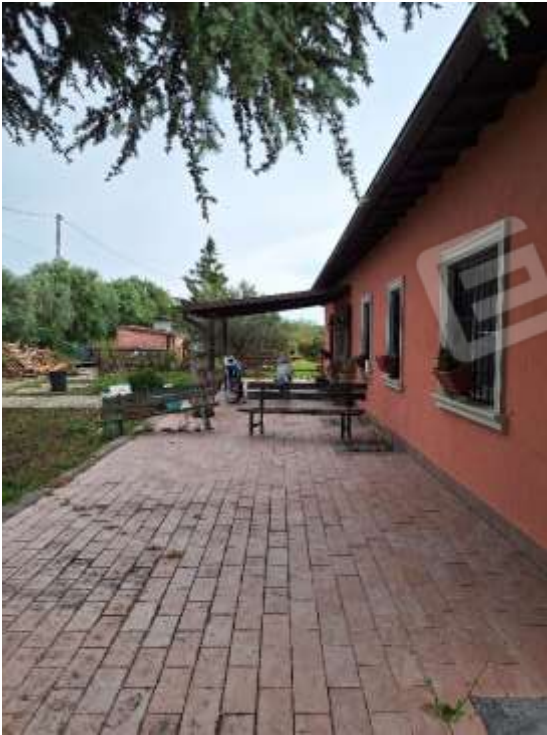
AREA ESTERNA P.T.