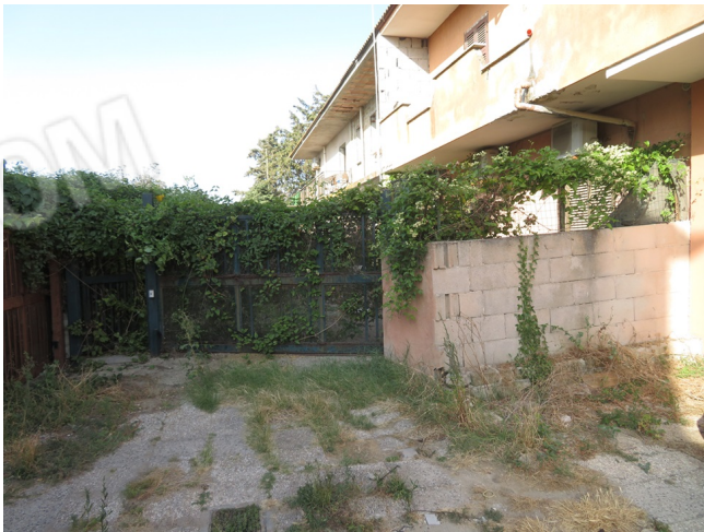
Foto n. 9_Esterna