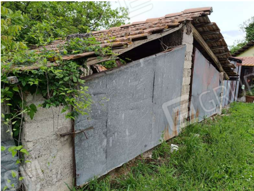
Foto n. 19 - Foglio 133 p.lla 566 - Rimessa