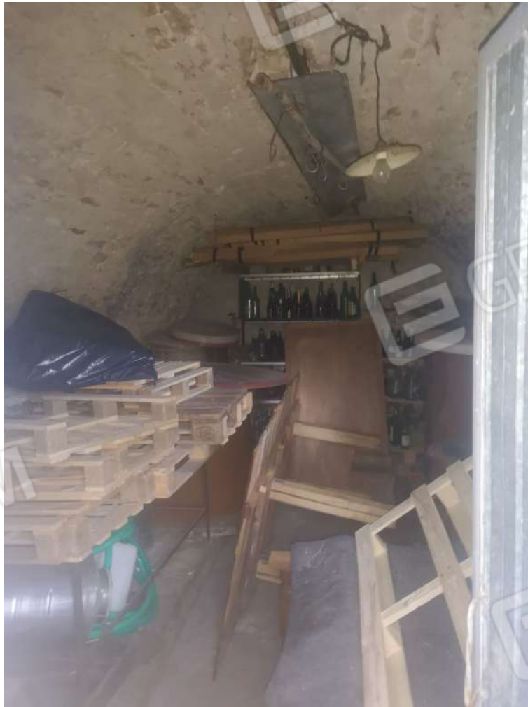
Foto n. 13 - Cantina al piano seminterrato