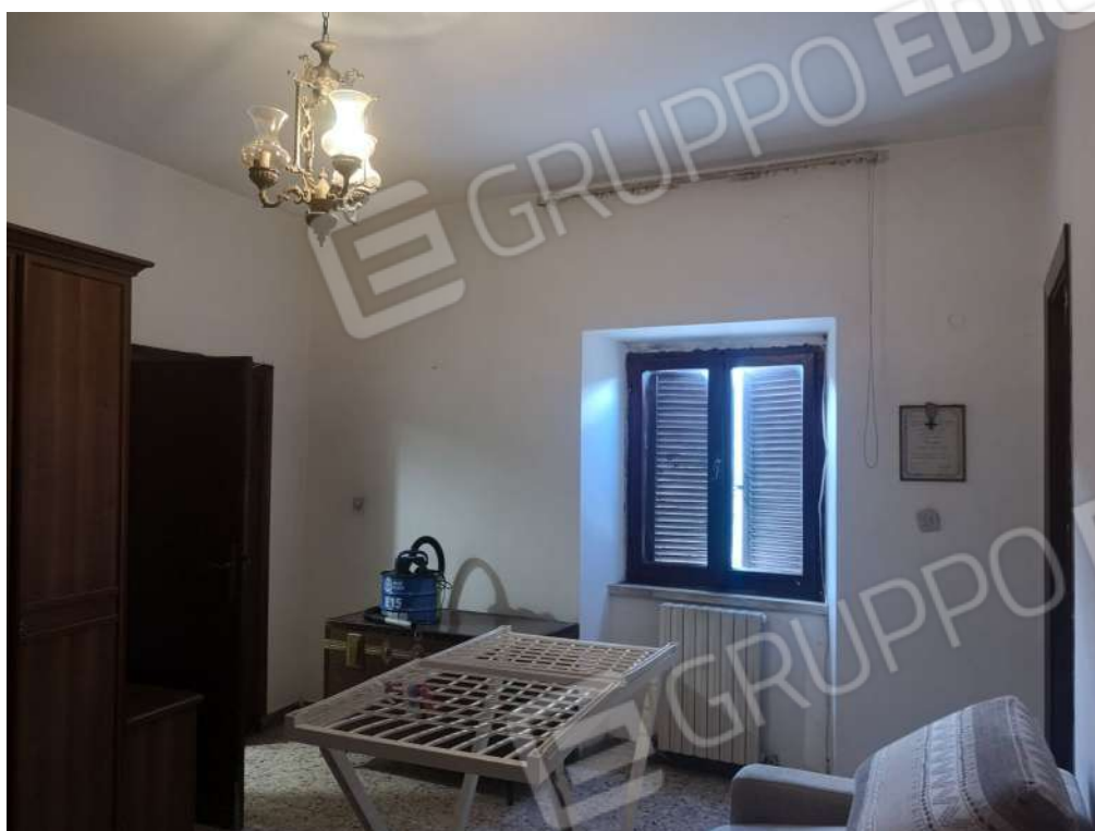
Foto n. 10 - Disimpegno al piano primo