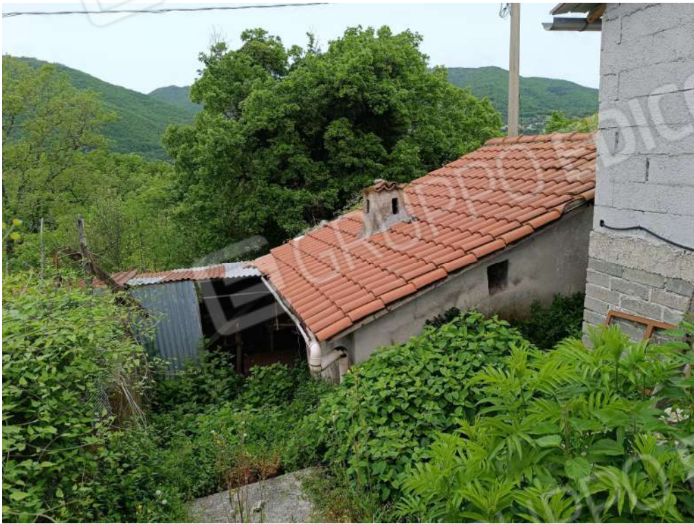
Foto n. 18 - Foglio 133 p.lla 536 - Magazzino