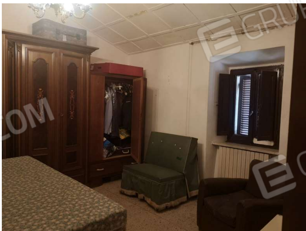
Foto n. 9 - Camera da letto al piano primo