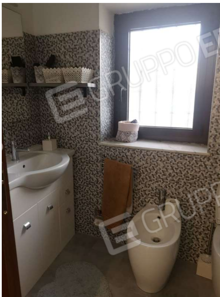
Foto n. 8 - Wc al piano terra