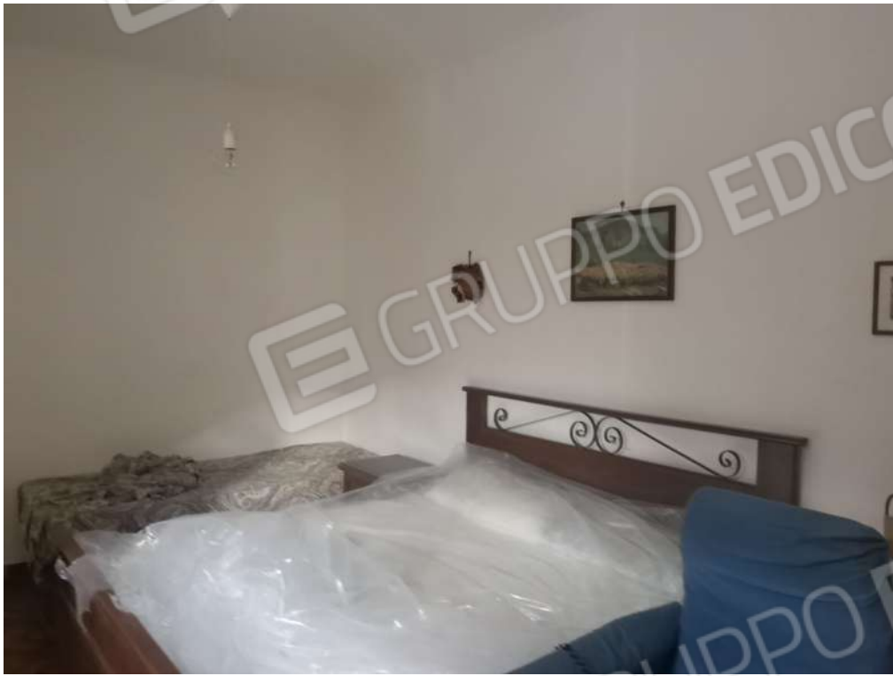
Foto n. 12 - Camera da letto al piano primo