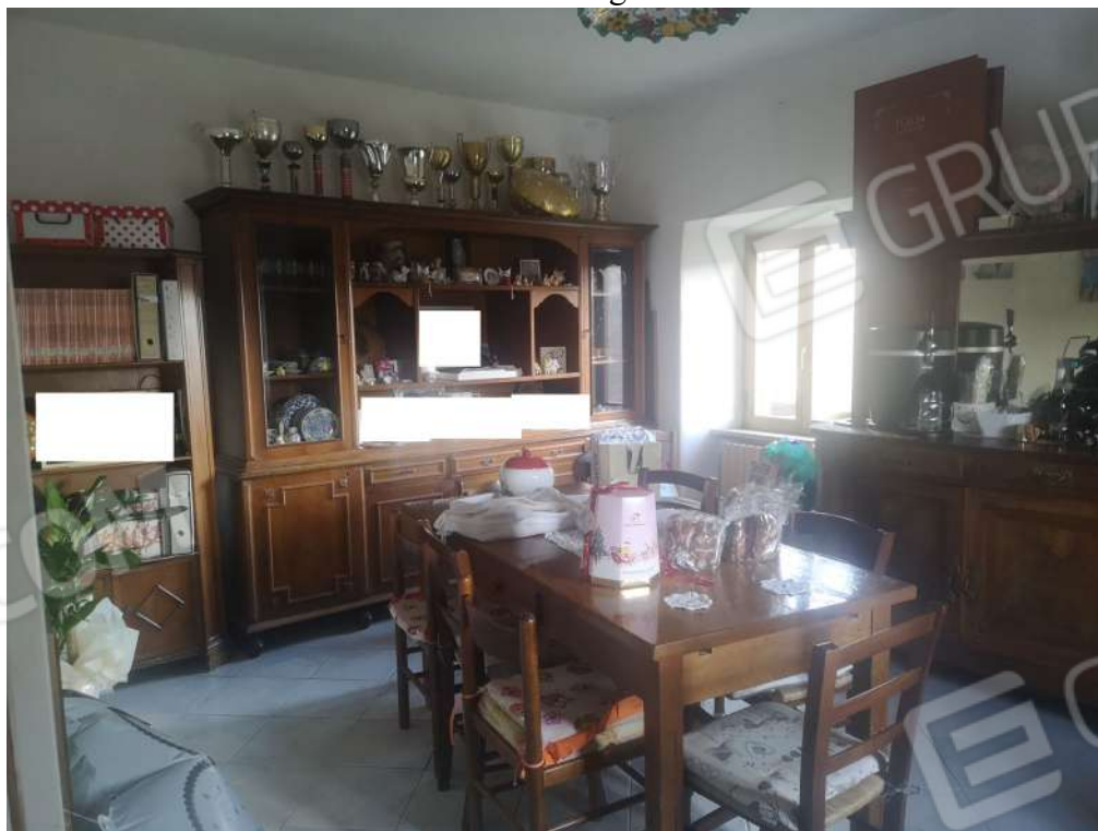
Foto n. 7 - Soggiorno