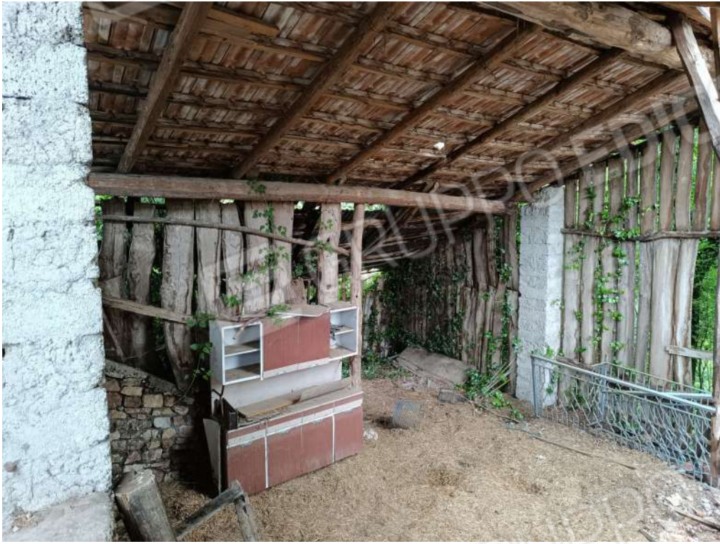
Foto n. 7 - Foglio 133 p.lla 566 - Rimessa