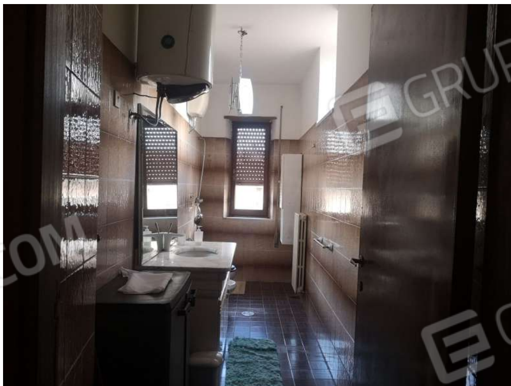
Foto n. 11 -Wc al piano primo