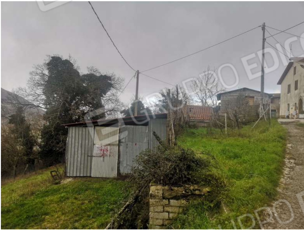
Foto n. 14 - Foglio 133 p.lla 599 - Tettoia chiusa