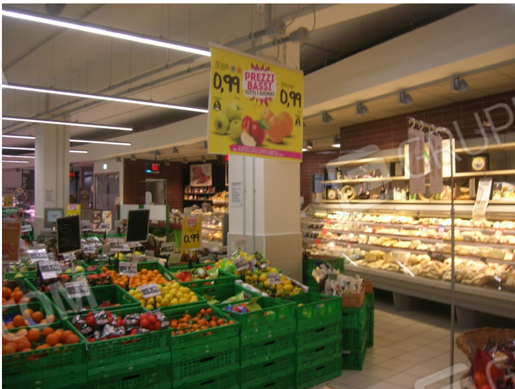
Vedute interne del supermercato – area di vendita