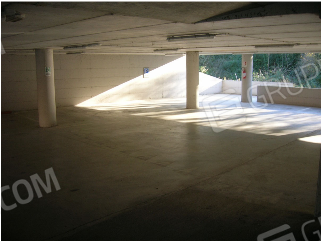
Piano S3 sub 3