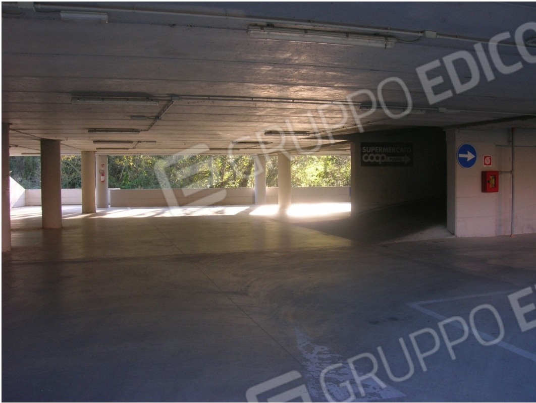
Piano S3 sub 3