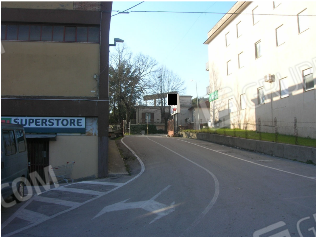
Strada di accesso al supermercato – particella 213