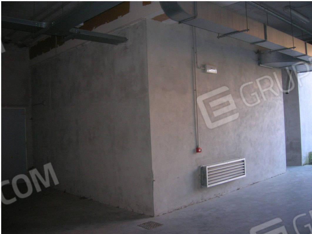
Locali piano secondo sottostrada sub 32 e 33