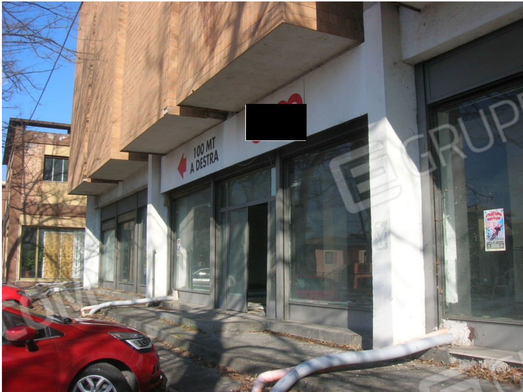
Vedute esterne del fabbricato dalla via Provinciale Stazione