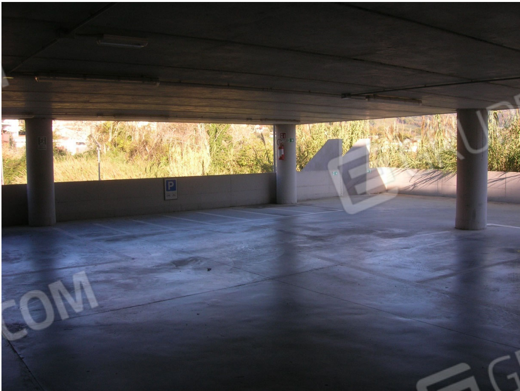
Piano S2 sub 4