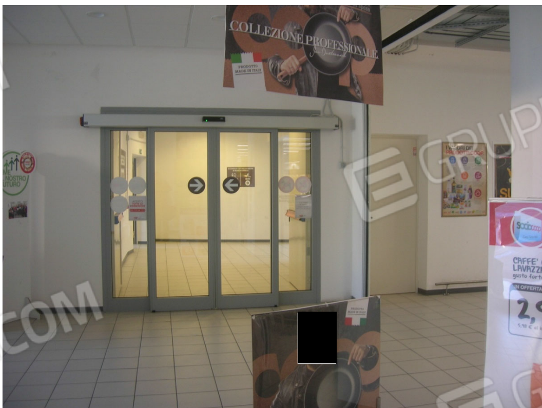
Vedute della zona di ingresso al supermercato (bcnc – sub 31)