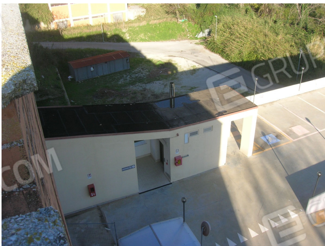
Piano terra sub 6 e sub 10 (corpo scale BCNC)