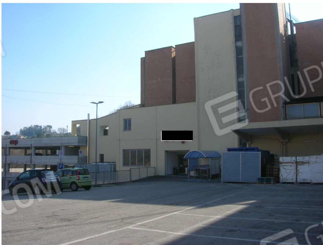
Vedute esterne del fabbricato, prospetto nord con gli accessi al piano primo sottostrada del supermercato (sub 27) e del locale commerciale (sub 28)