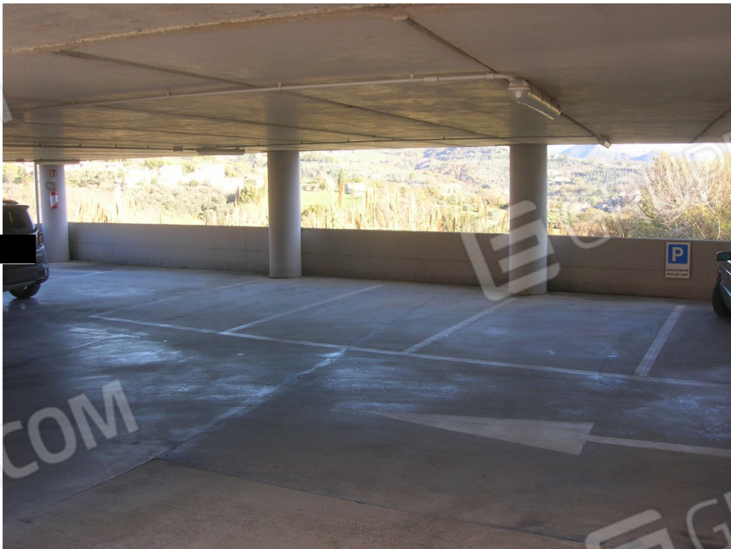
Piano S1 sub 5