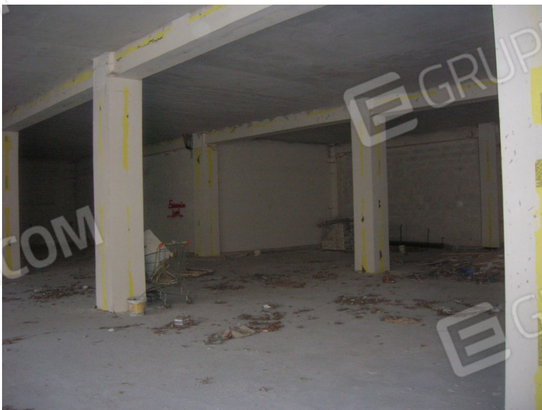
Vedute interne del locale ad uso commerciale – piano secondo sottostrada