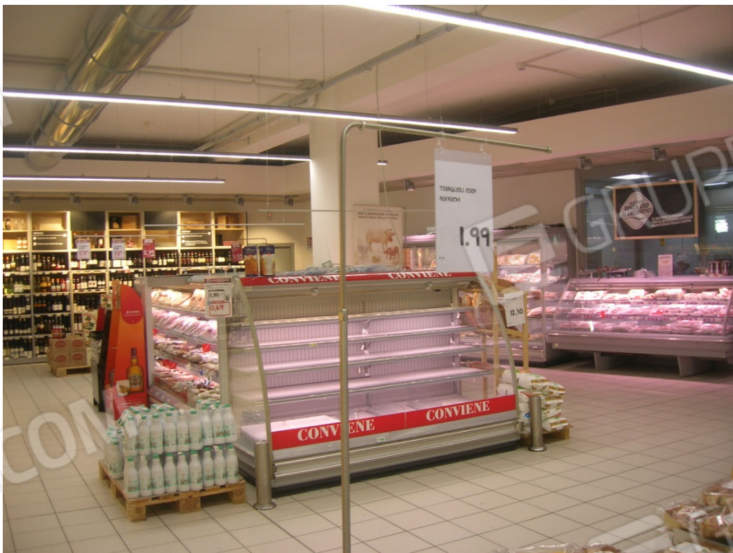
Vedute interne del supermercato – area di vendita