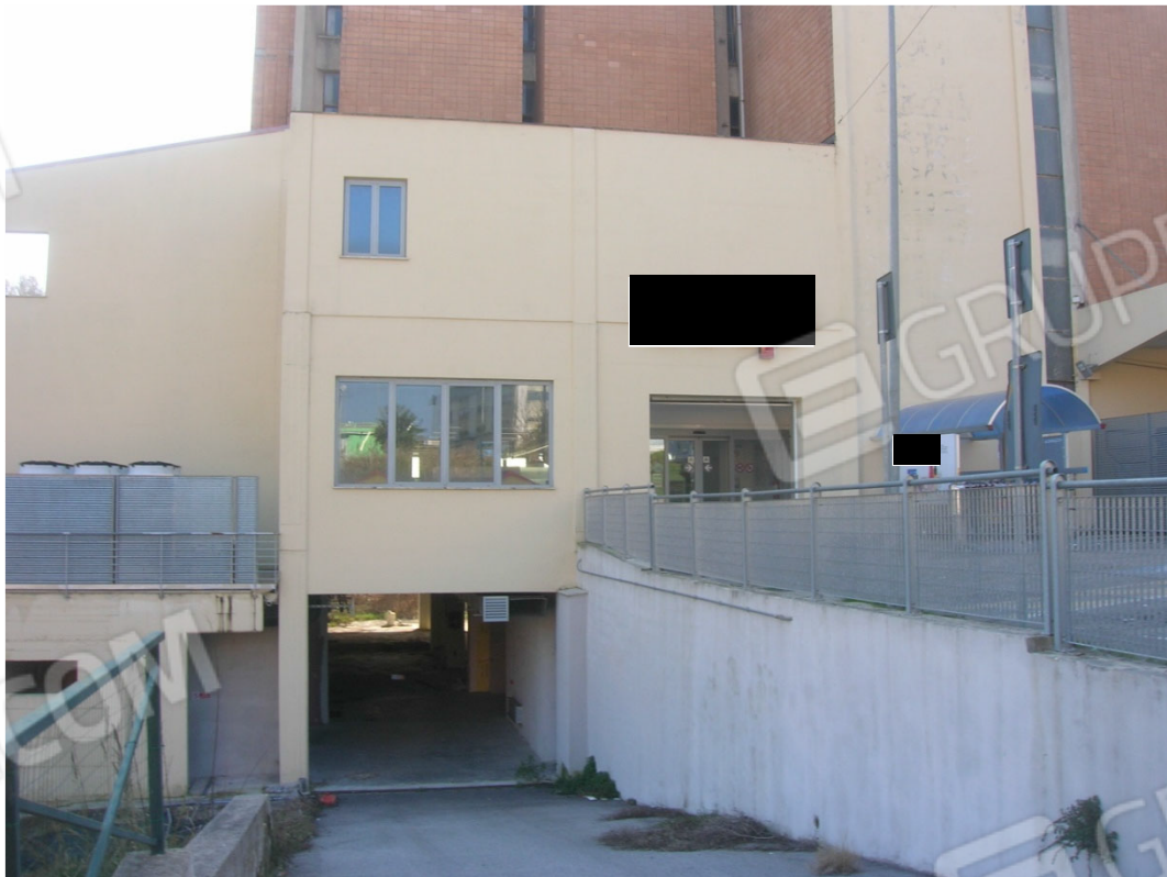
Accesso al piano secondo sottostrada (sub 29 e 27)