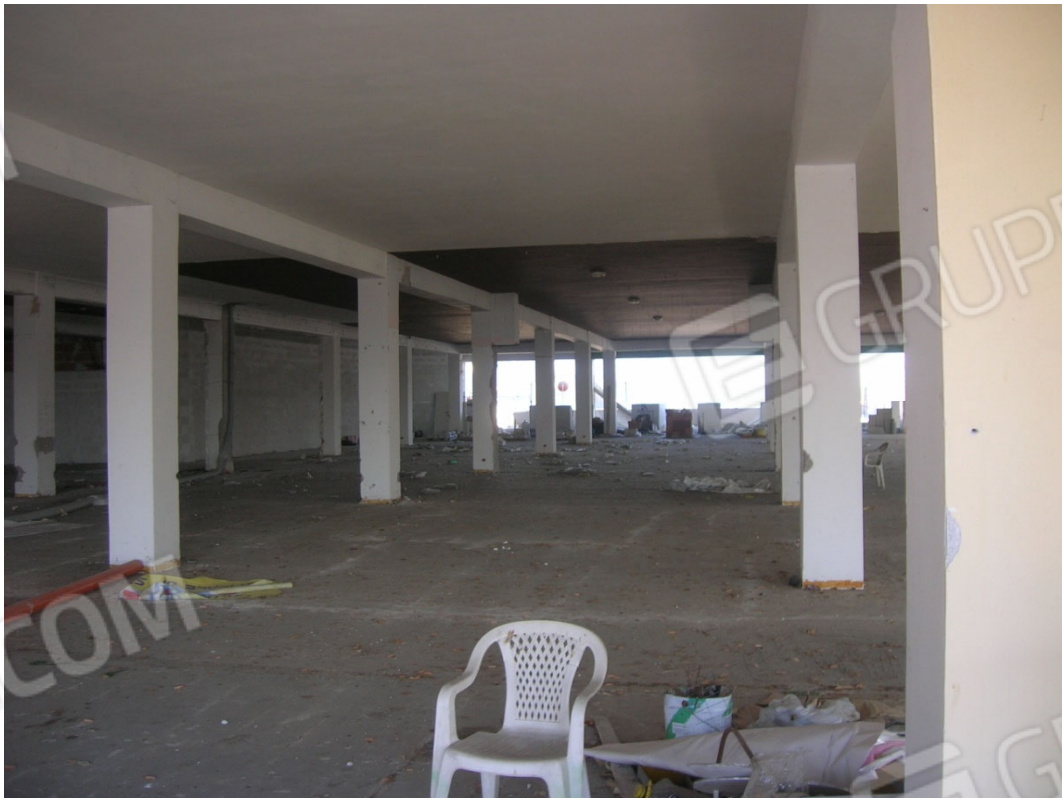
Vedute interne del locale ad uso commerciale – piano terra