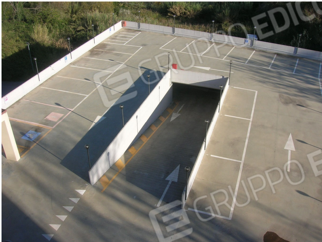
Piano terra sub 6