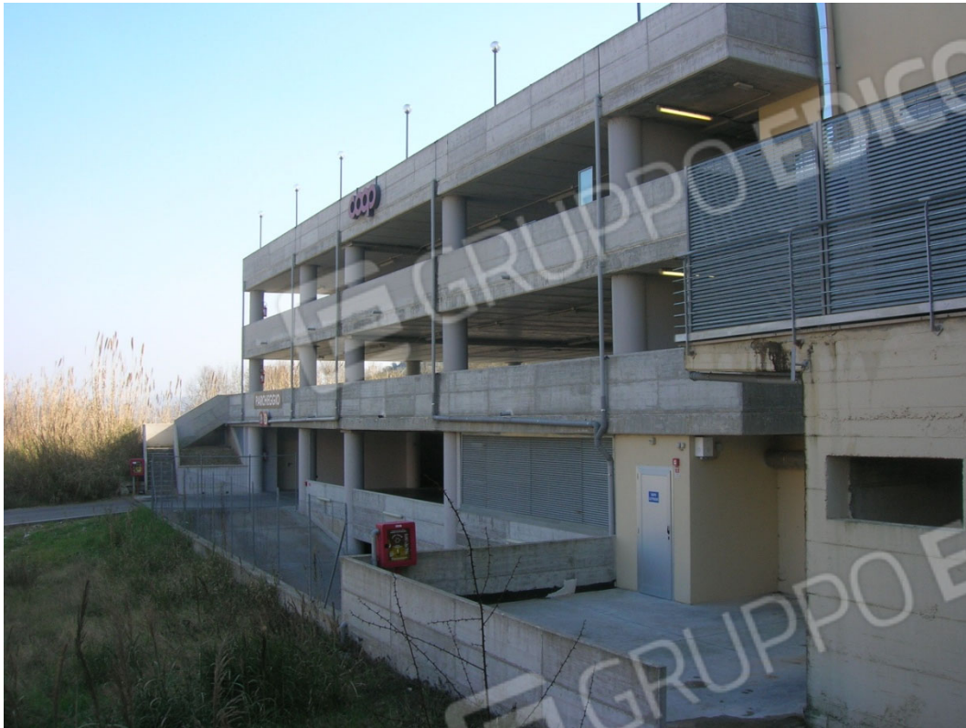
Parcheggio asservito al supermercato non oggetto della procedura