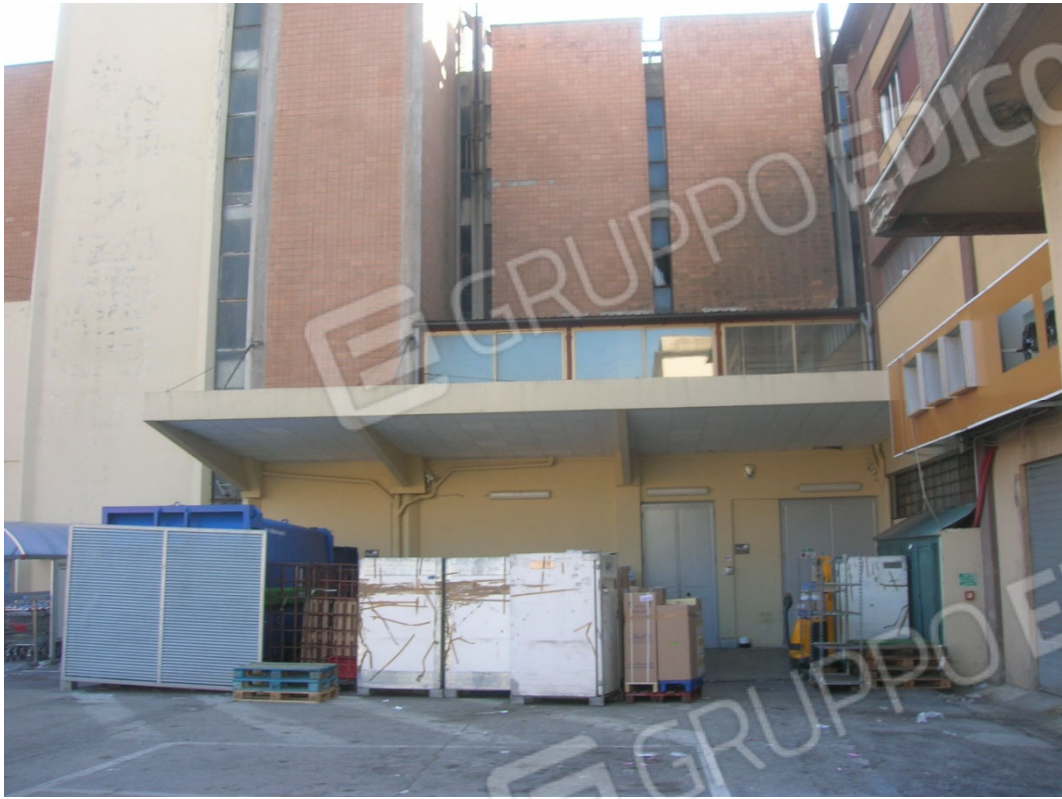
Zona di carico e scarico supermercato (sub 27)