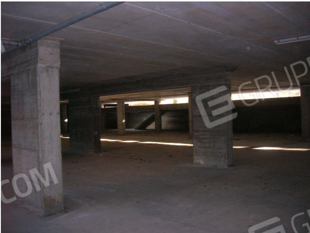
Piano S4 sub 2