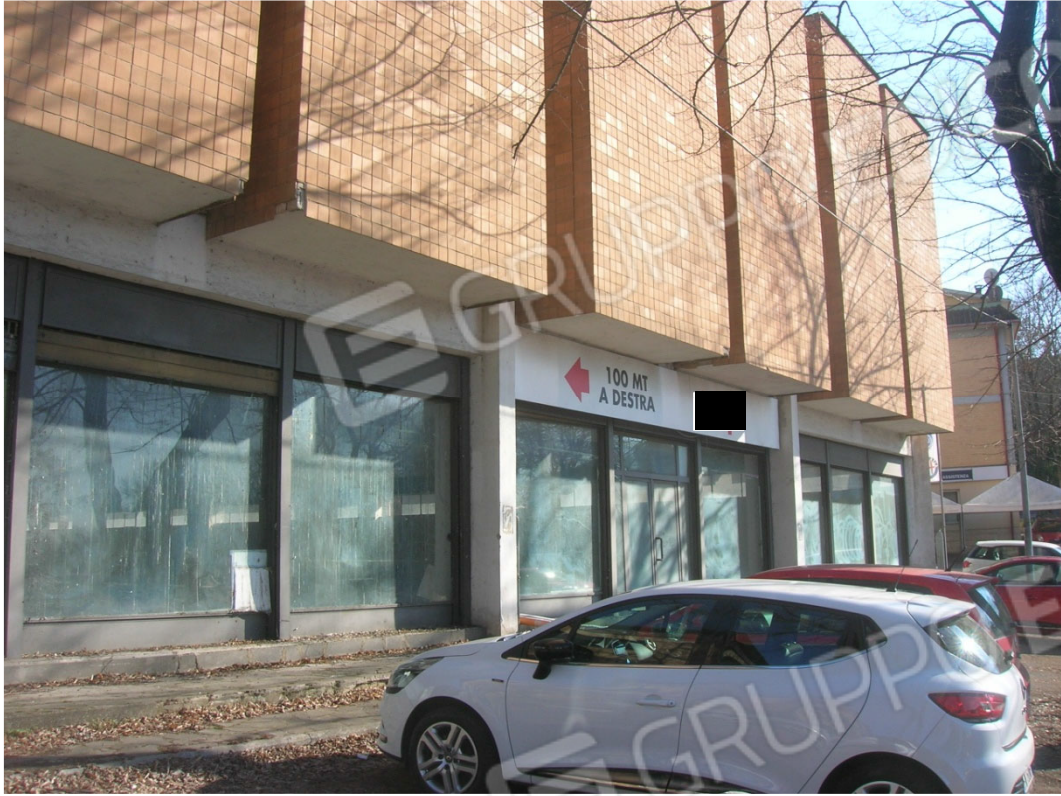
Veduta esterna del fabbricato da via Provinciale Stazione