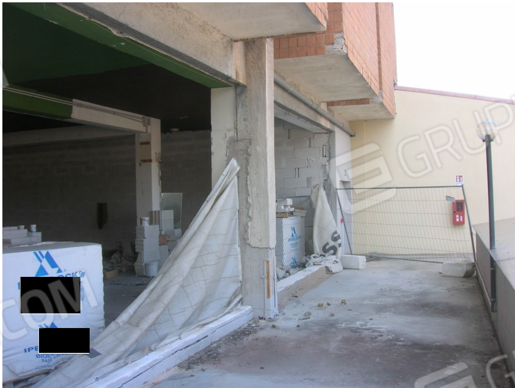
Vedute esterne del fabbricato – lato est (sub 26) interessato da lavori edili di ultimazione