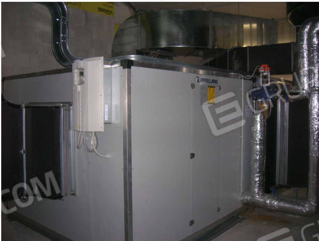
Vedute interne dei locali tecnici al piano secondo sottostrada (sub 27)