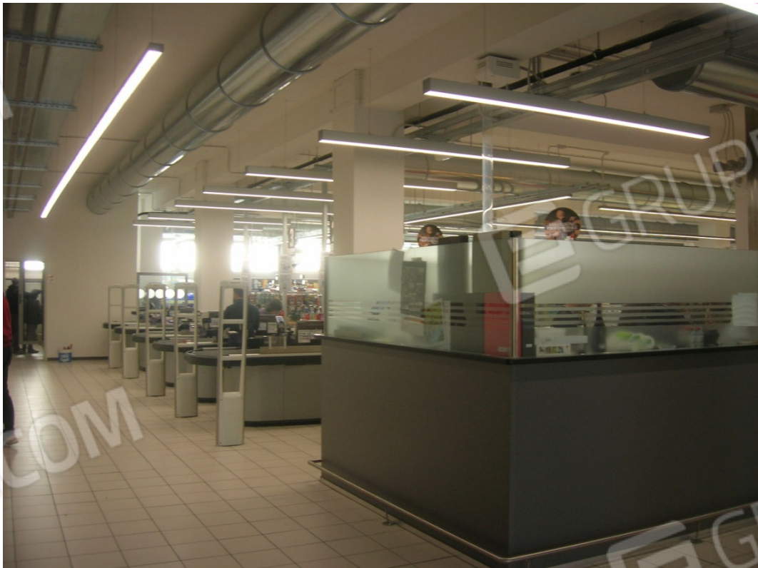
Vedute interne del supermercato – area casse e ufficio