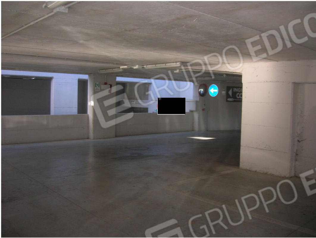
Piano S1 sub 5