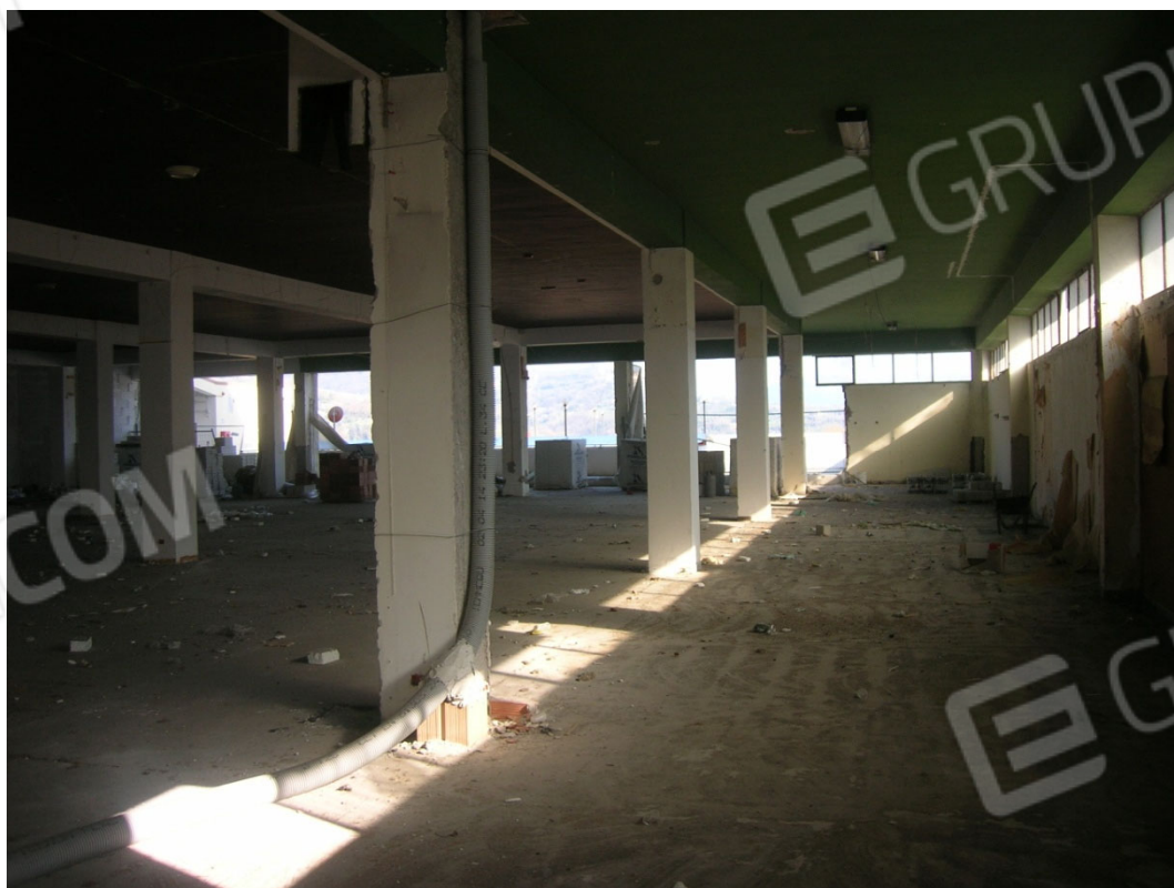
Vedute interne del locale ad uso commerciale – piano terra