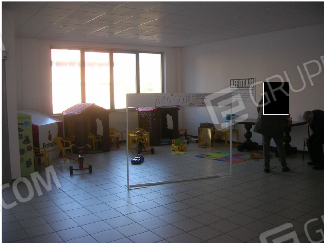
Vedute interne del locale commerciale – sub 28