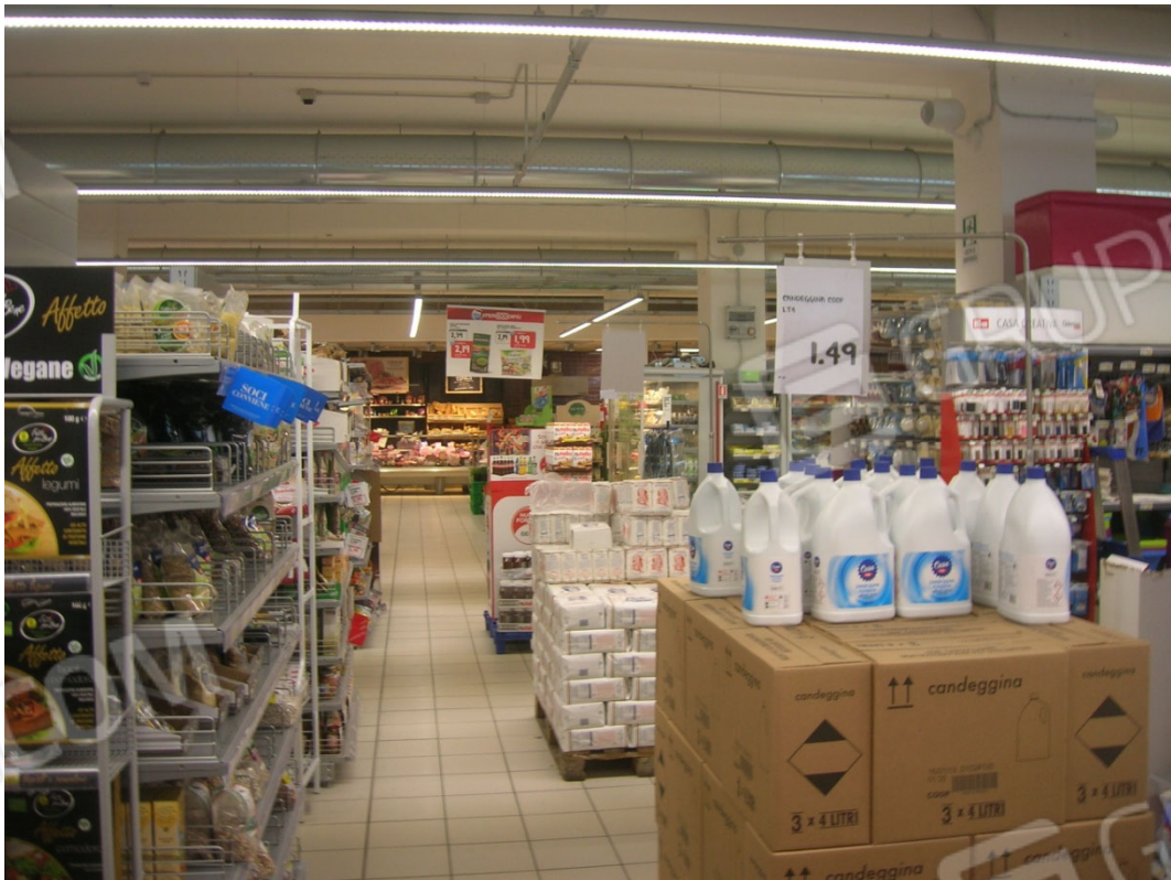
Vedute interne del supermercato – area di vendita