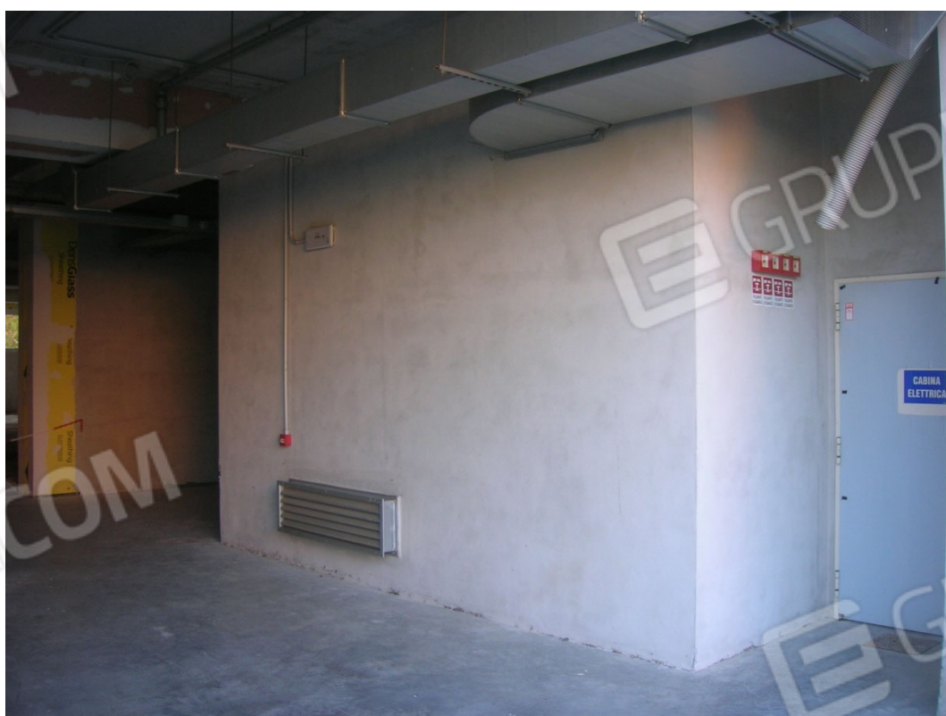
Locali piano secondo sottostrada sub 32 e 33