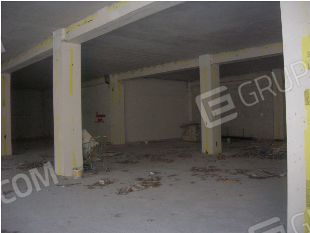
Vedute interne del locale ad uso commerciale – piano secondo sottostrada