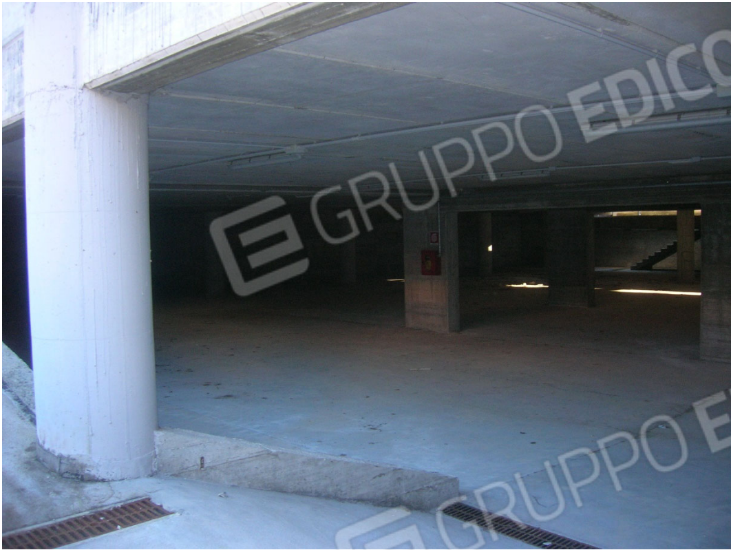
Piano S4 sub 2