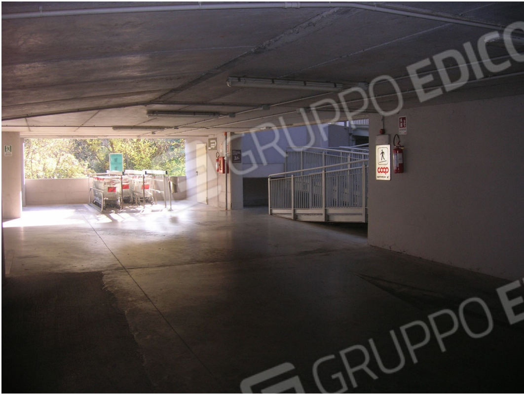
Piano S2 sub 4