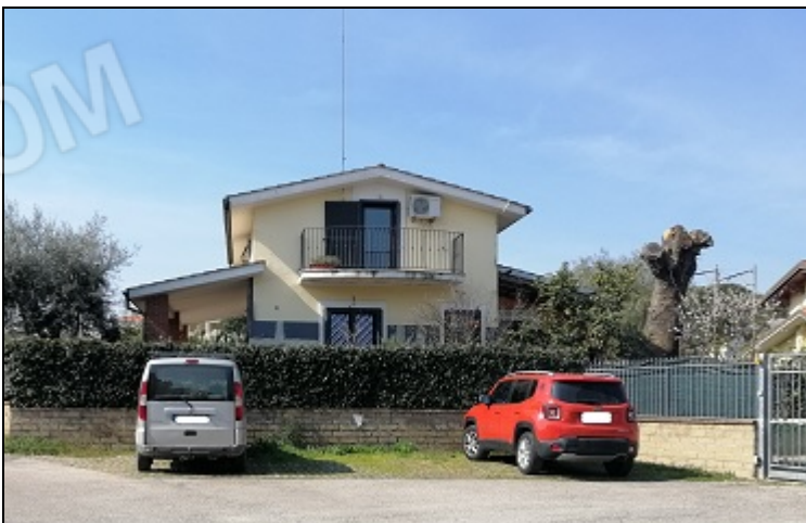
Foto 8: particolare posto auto scoperto. Foglio catastale 12 Particella 1124 sub 11.