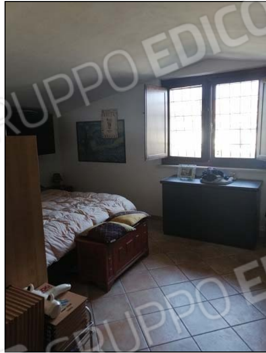
Foto 7: sottotetto, camera da letto, da ripristinare lo stato autorizzato.