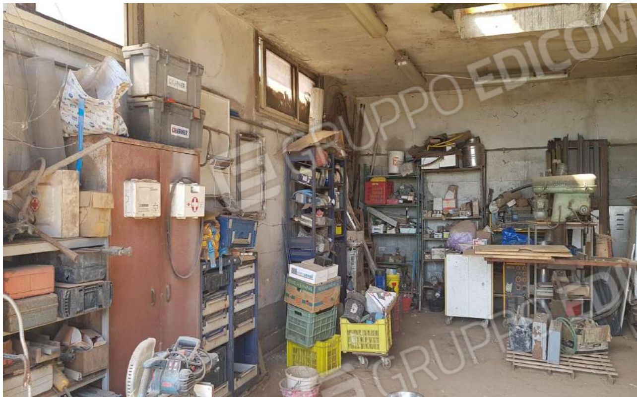
FOTO 20: Veduta interna fabbricato ad uso magazzino realizzato sulla part. 223