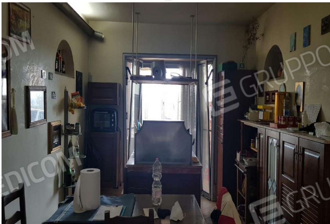
FOTO 21: Veduta interna locale soggiorno/angolo cottura piano S1, sub. 1