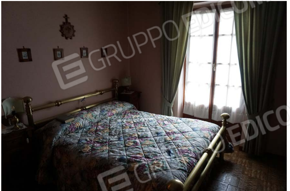
Foto n. 4 Camera 2 Piano Primo