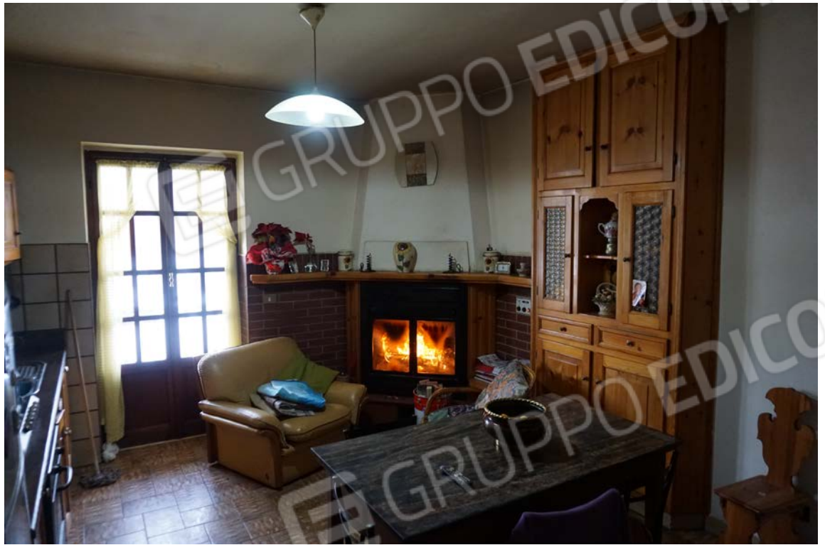
Foto n. 2 Soggiorno Piano Primo