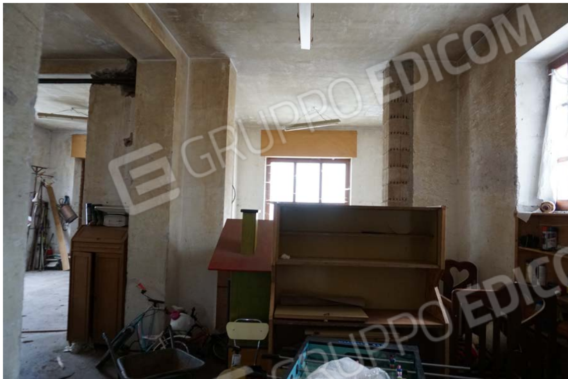
Foto n. 4 Lab. artigianale 4 Piano terra