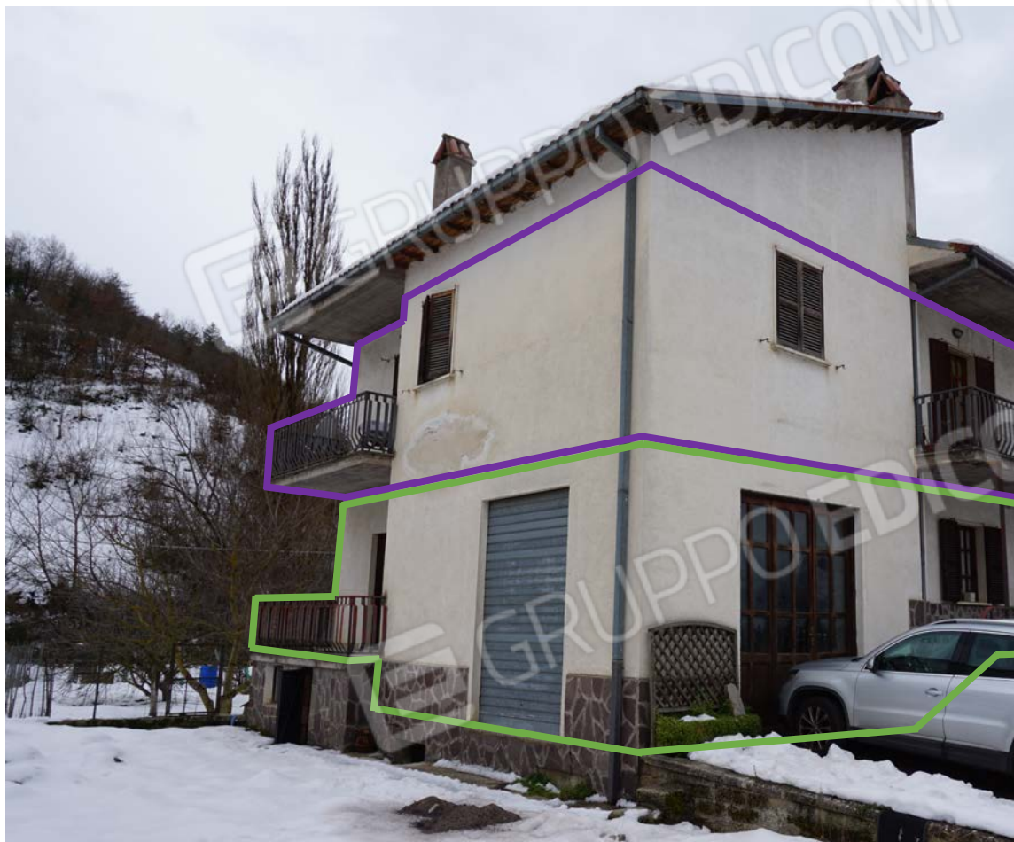
Foto n. 4 Esterno del Fabbricato Prospetto Nord - Est Lotto 001 - 002 - 003 - 004