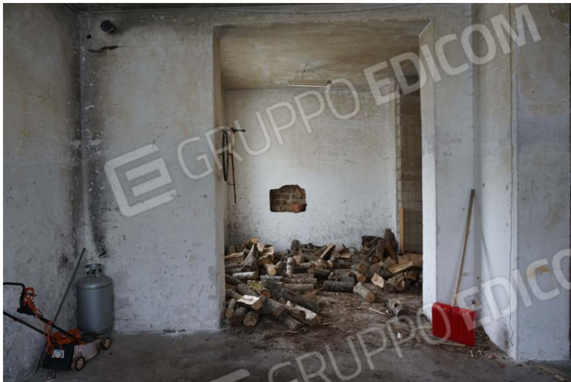
Foto n. 2 Lab. artigianale 2 Piano Terra