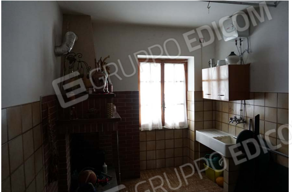
Foto n. 2 Cucina 1 Piano Terra