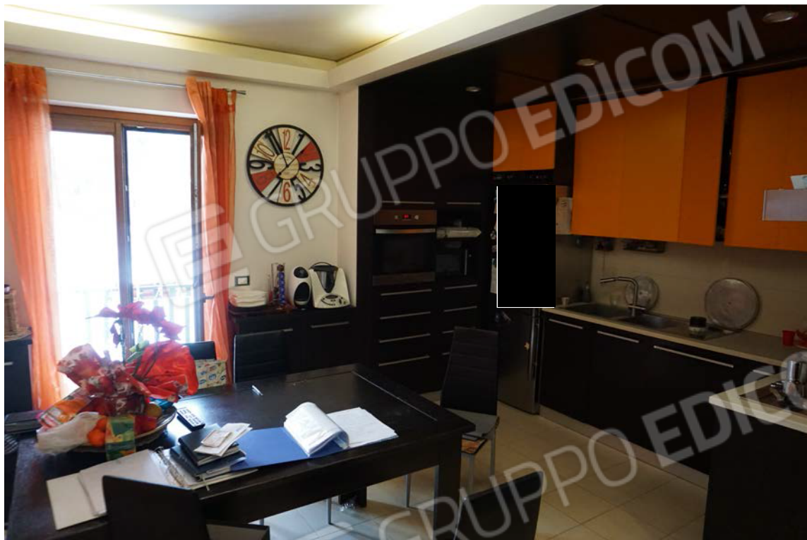
Foto n. 2 Camera 3 Piano Primo