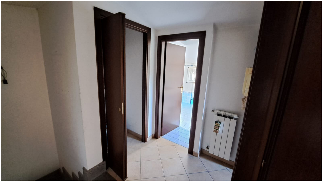
Vedute interne piano sottotetto - disimpegno