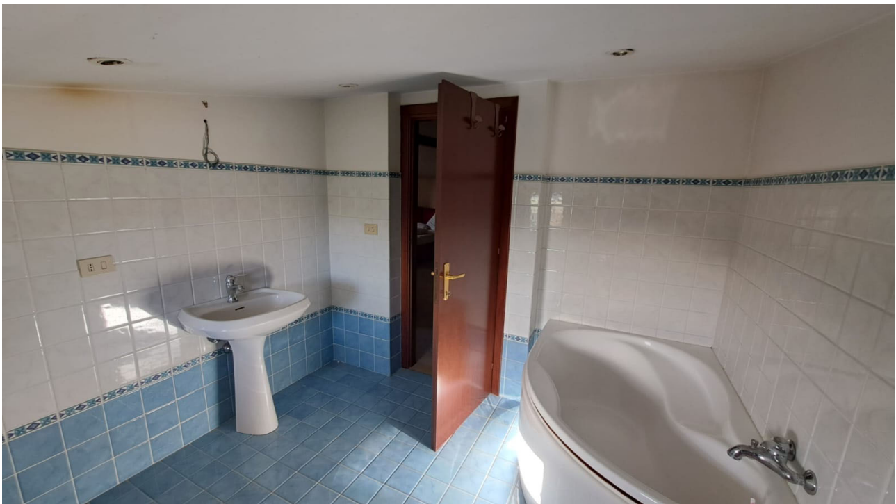
Vedute interne piano sottotetto - bagno