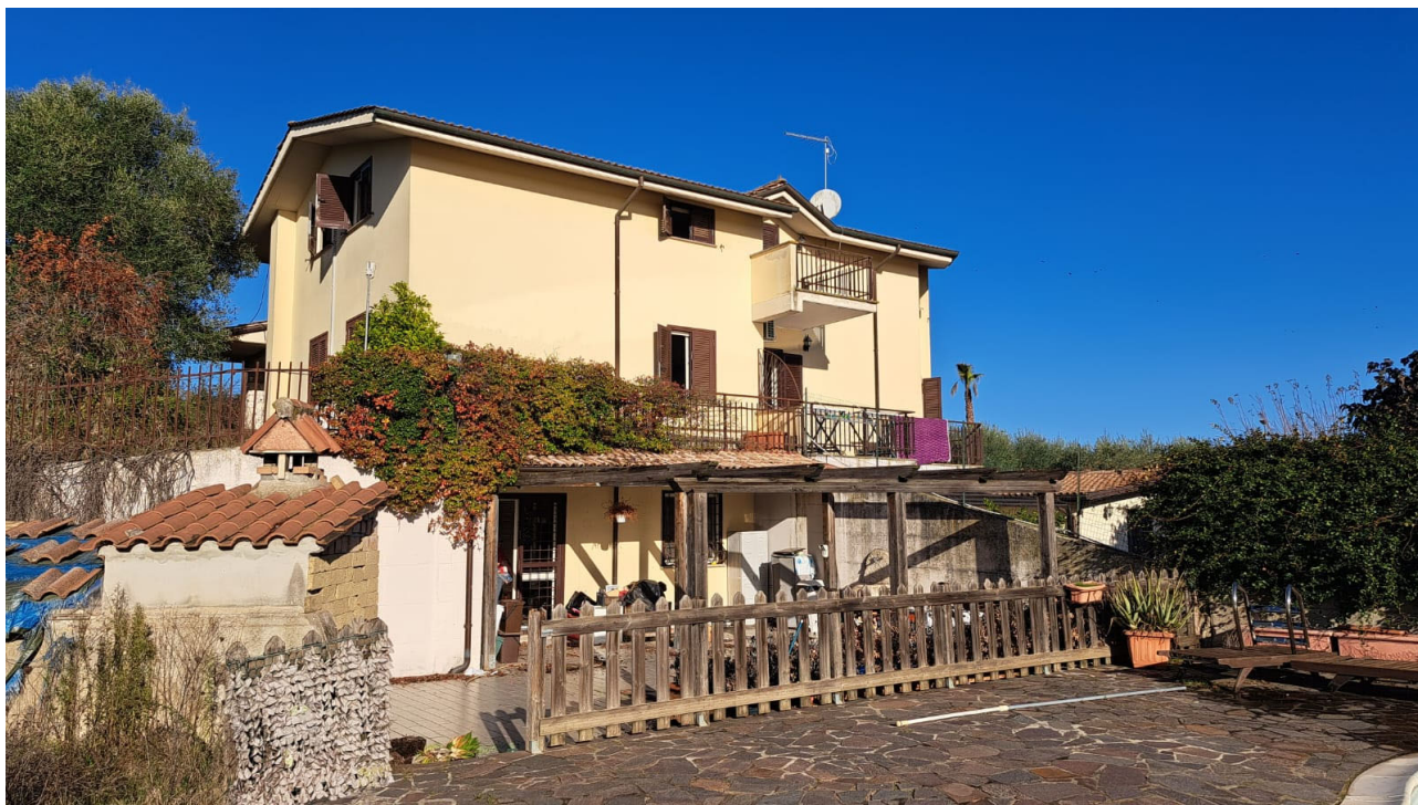
Vedute esterne del fabbricato e delle aree di accesso