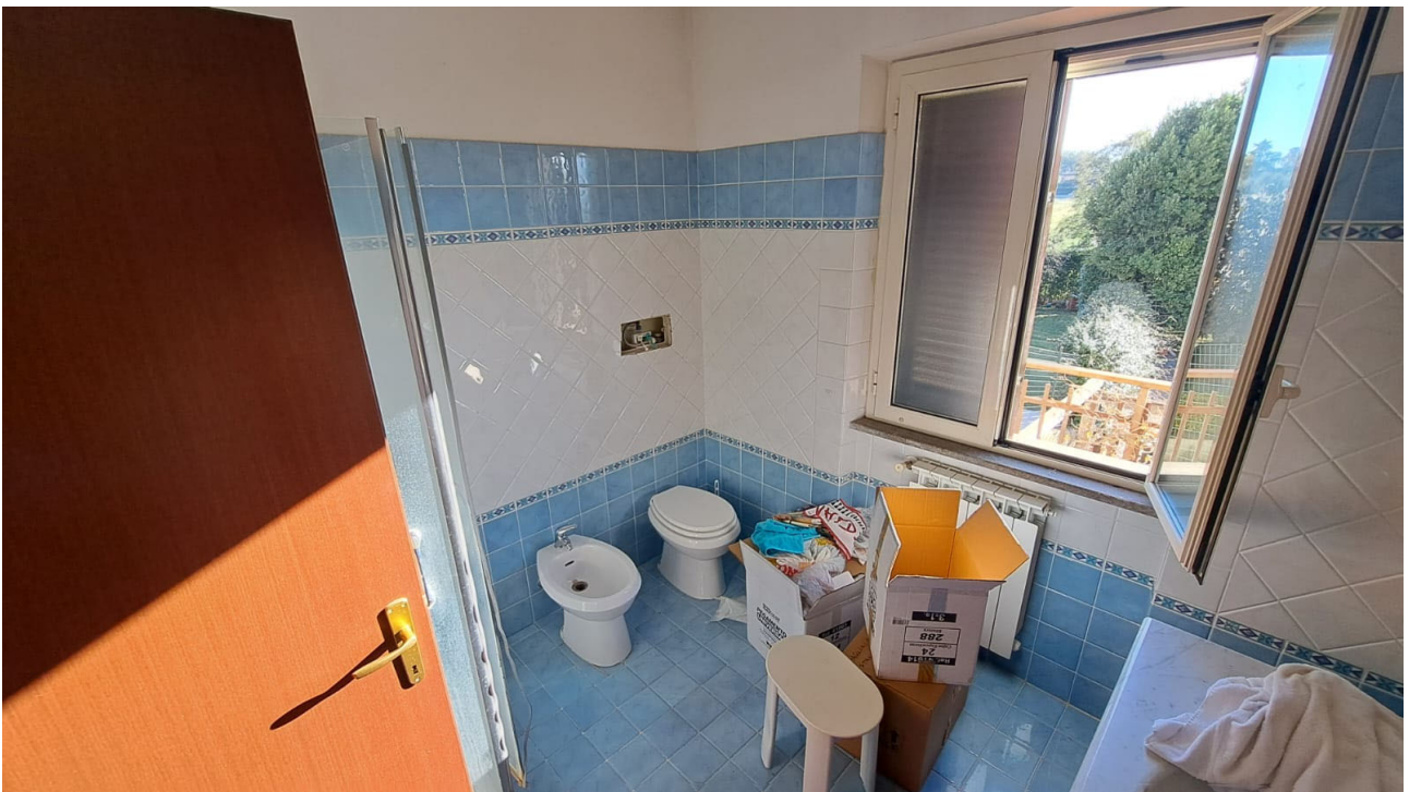
Vedute interne piano terra, bagno