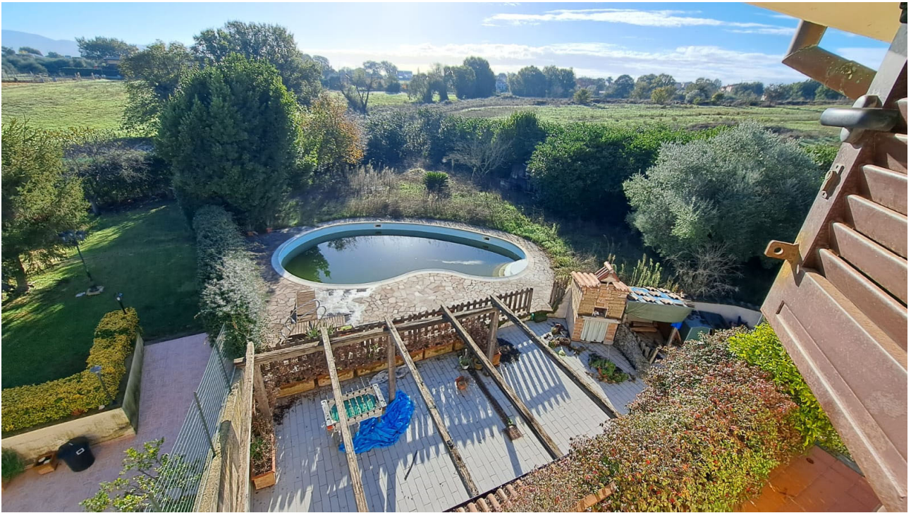
Vedute esterne del fabbricato zone ad uso giardino e piscina