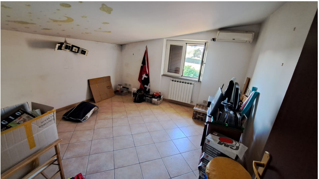
Vedute interne, piano sottotetto - camere da letto