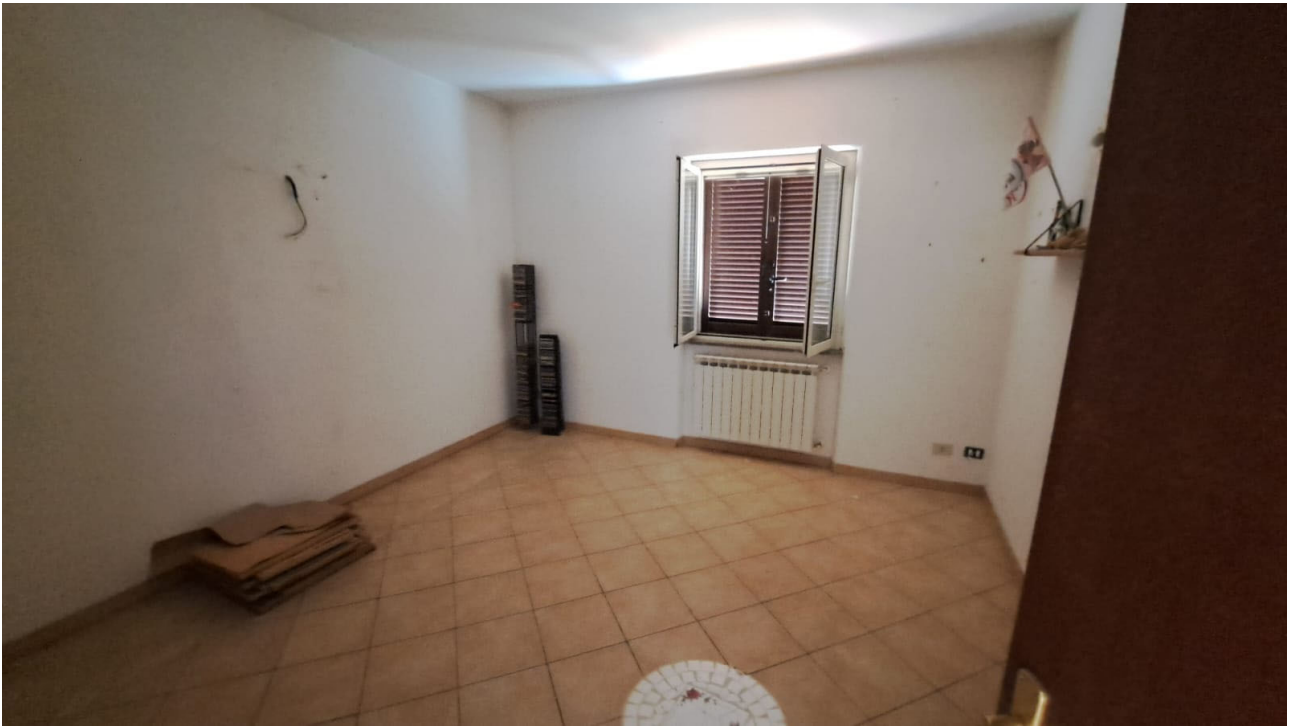
Vedute interne piano terra, camera