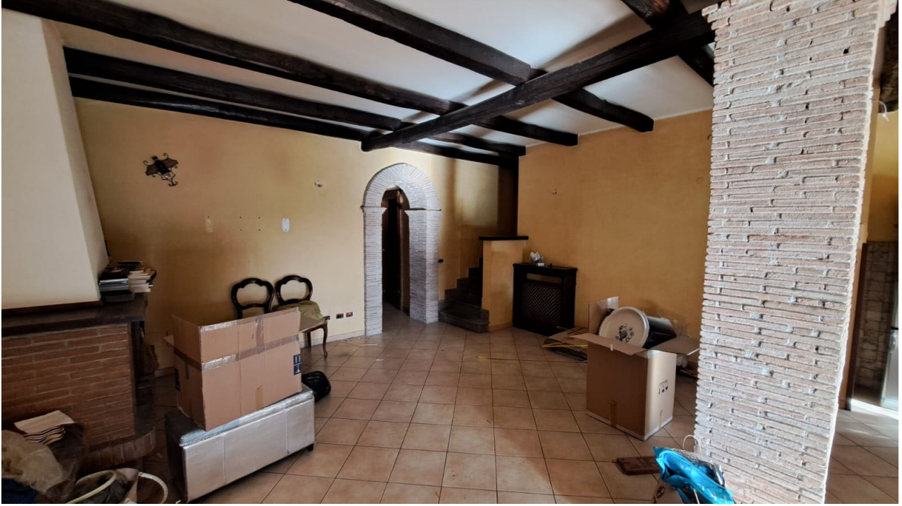
Vedute interne piano S1