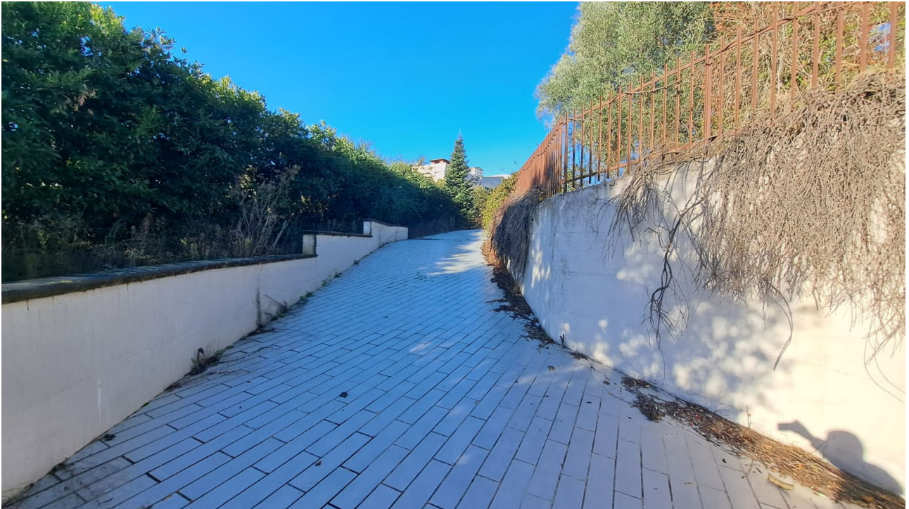
Vedute esterne del fabbricato e della rampa di accesso al piano S1