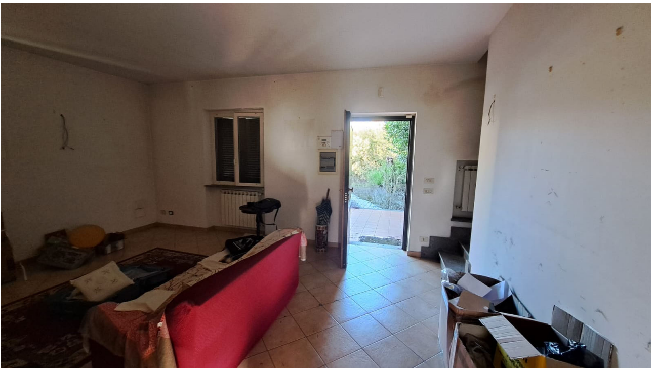
Vedute interne piano terra, soggiorno