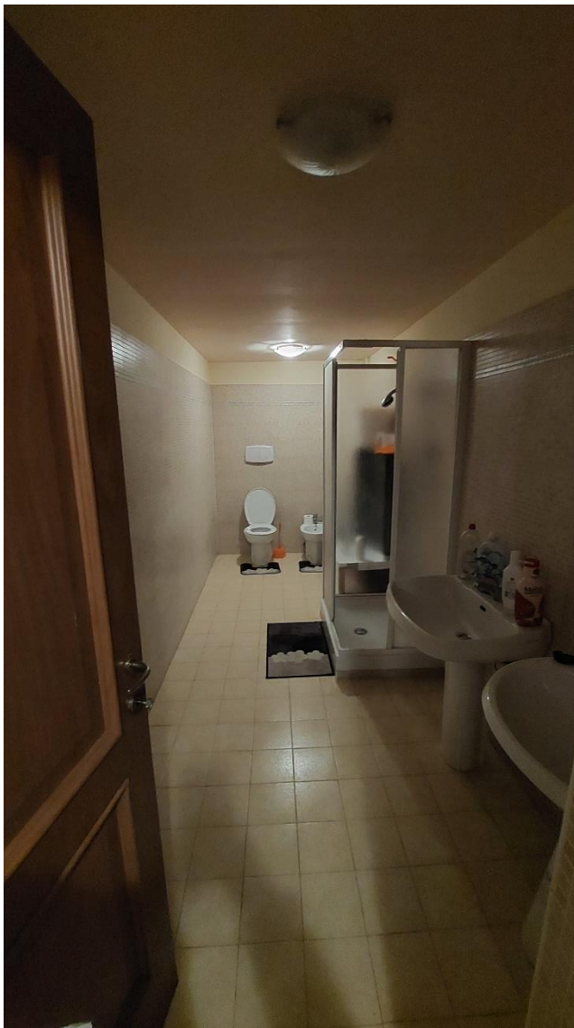
Foto n. 7 Camera Piano Seminterrato