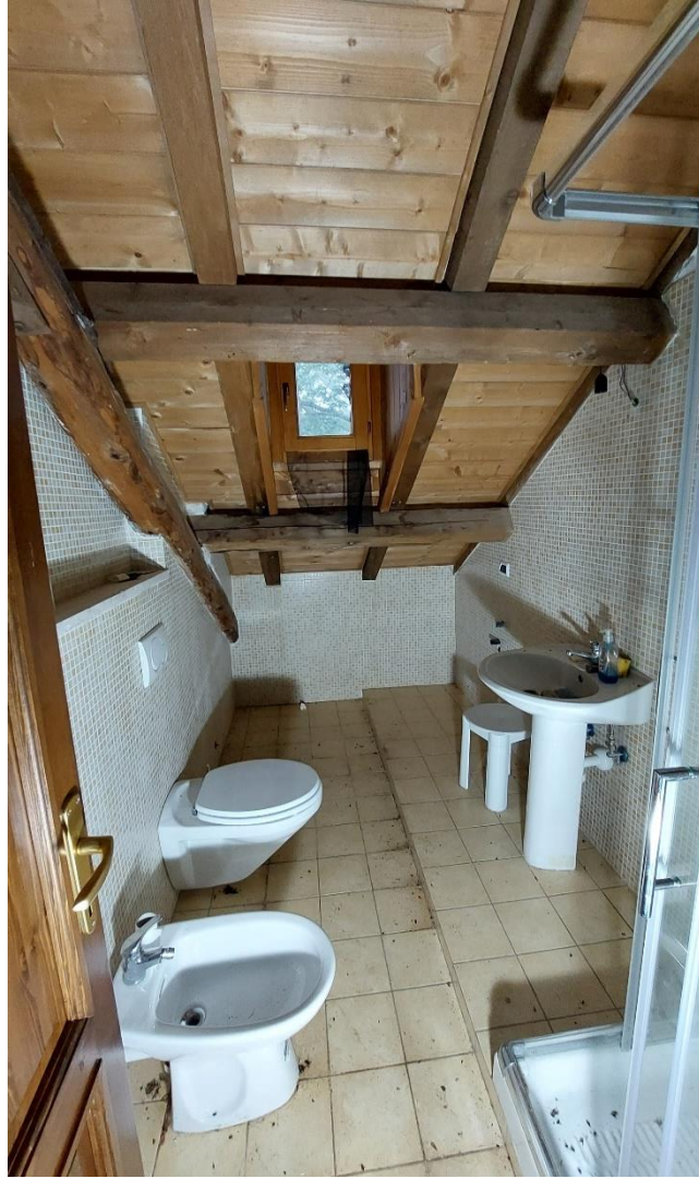
Foto n. 15 Camera Piano Sottotetto