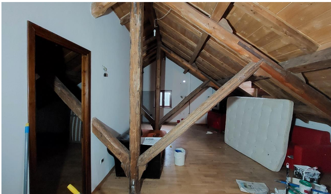
Foto n. 13 Sgombero Piano Sottotetto