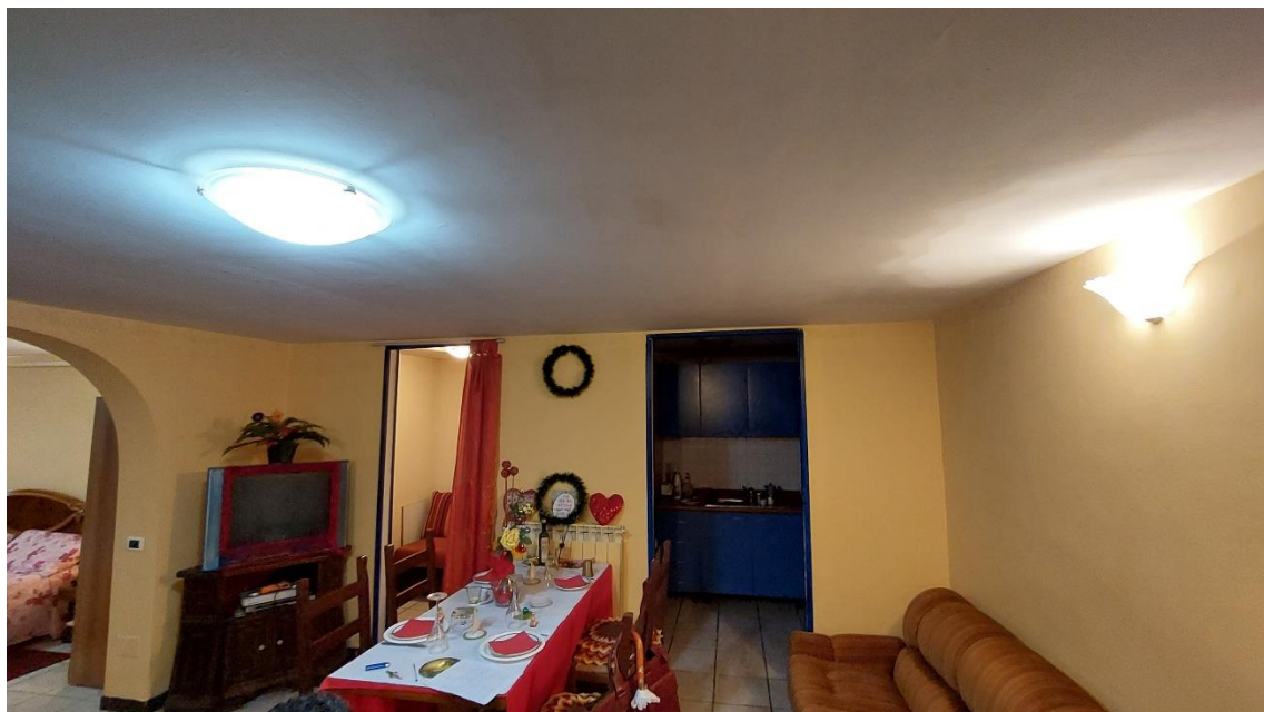
Foto n. 5 Cucina Piano Seminterrato