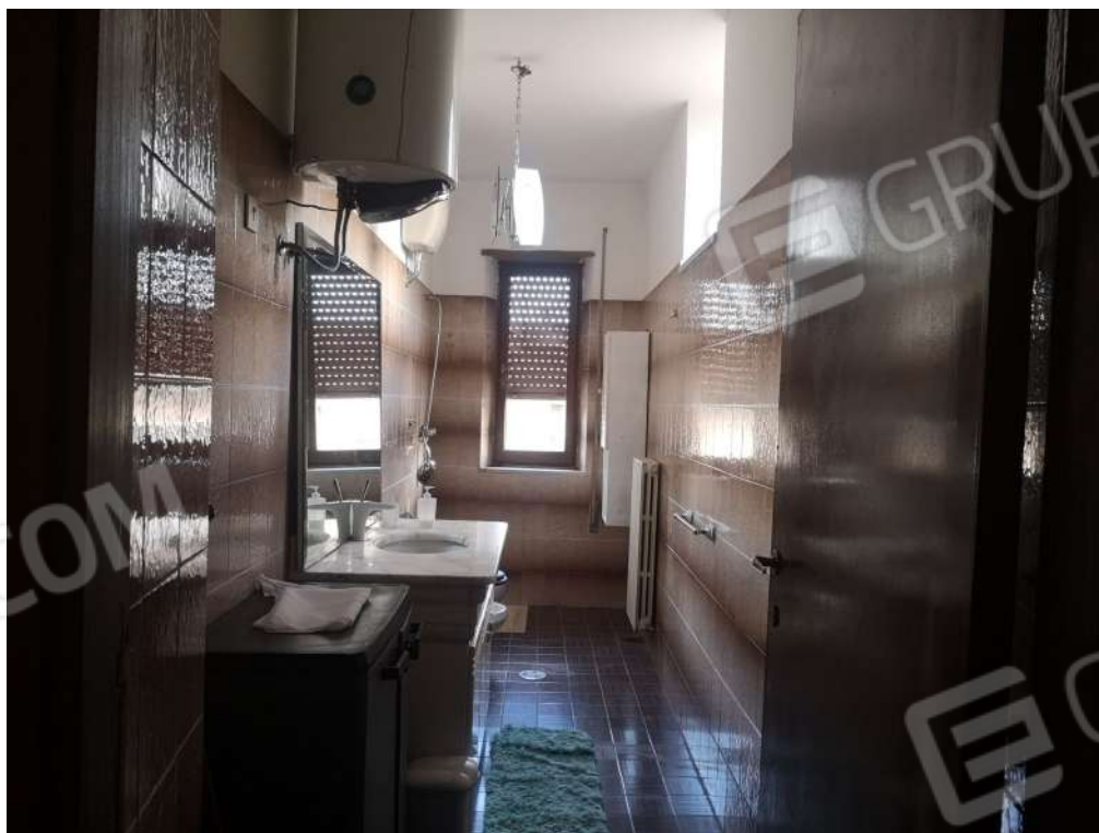
Foto n. 11 -Wc al piano primo