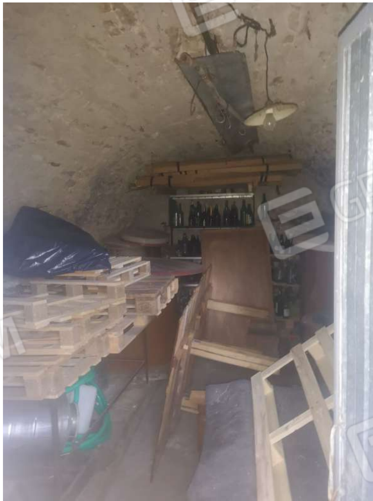
Foto n. 13 - Cantina al piano seminterrato