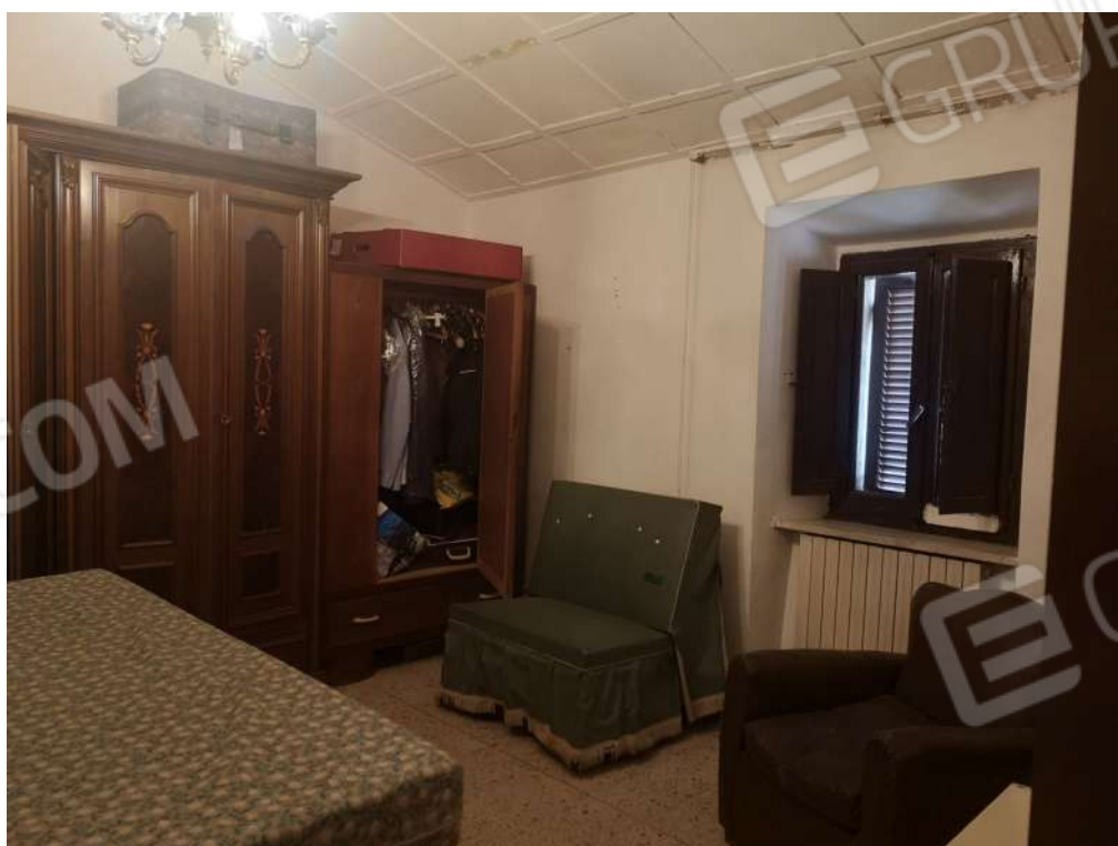
Foto n. 9 - Camera da letto al piano primo