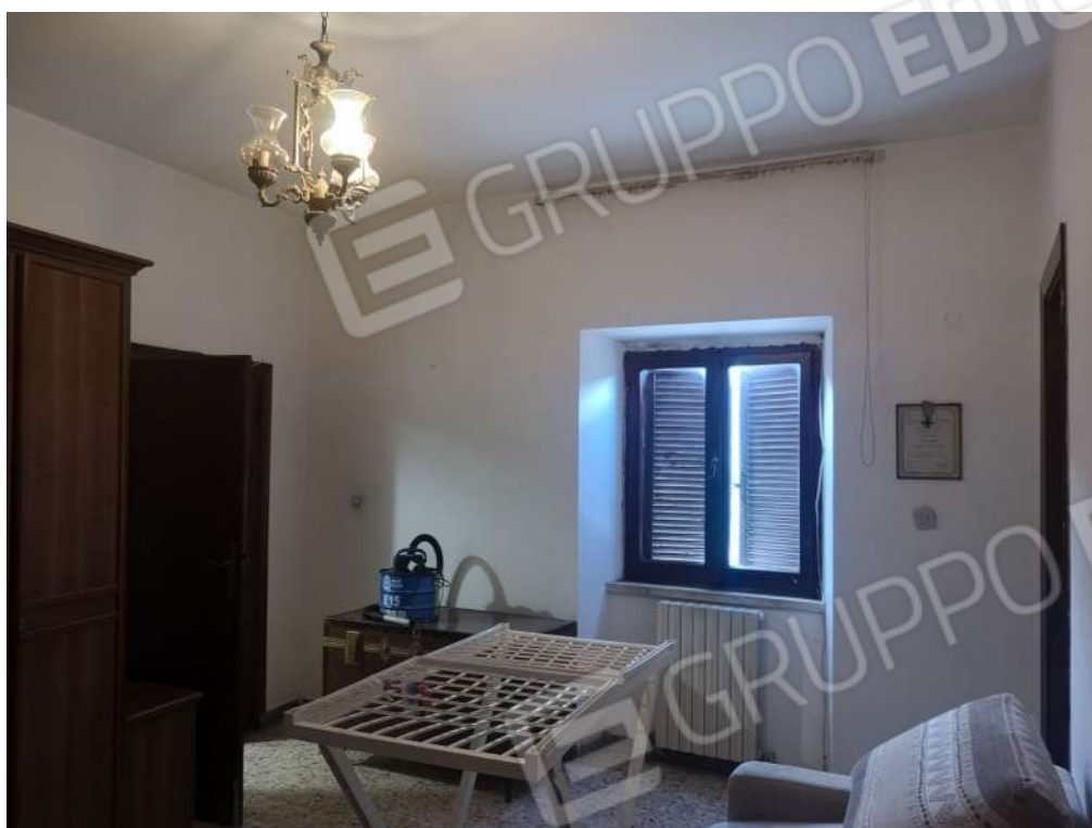
Foto n. 10 - Disimpegno al piano primo