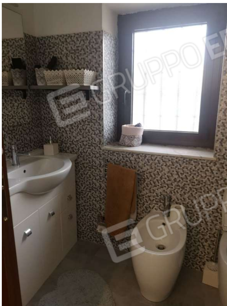
Foto n. 8 - Wc al piano terra