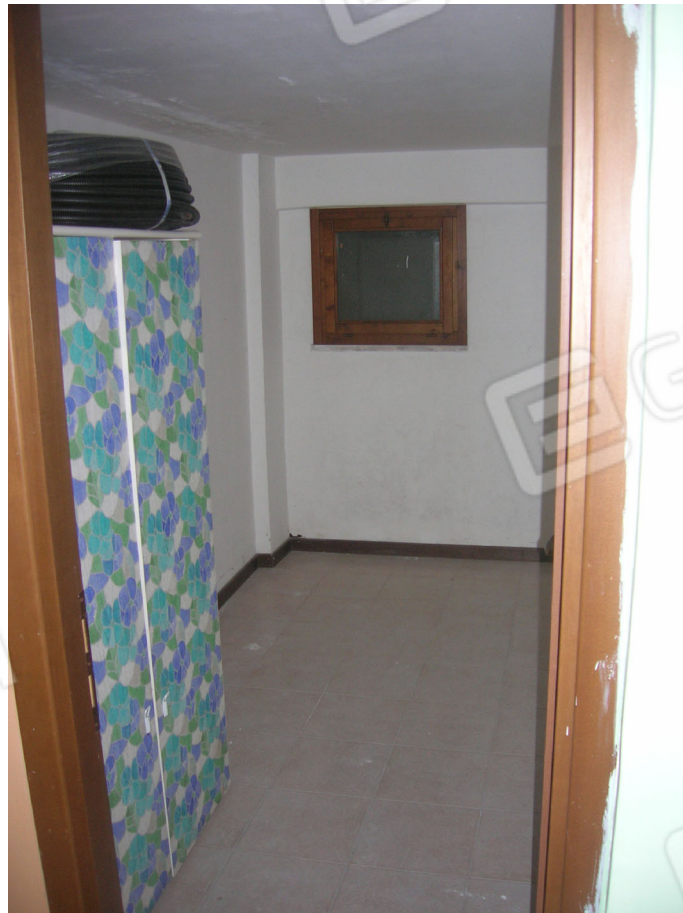
Vedute interne: piano sottostrada