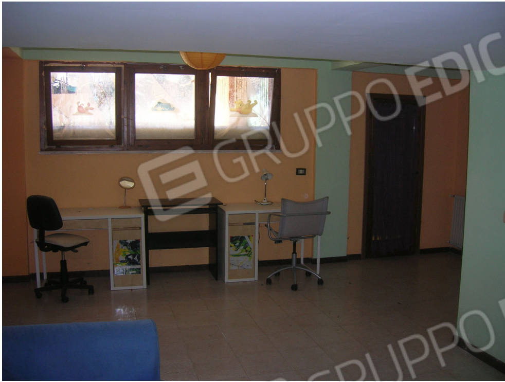
Vedute interne: piano sottostrada