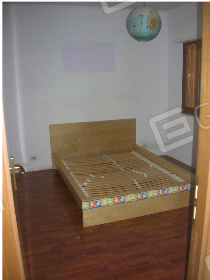
Vedute interne: piano terra