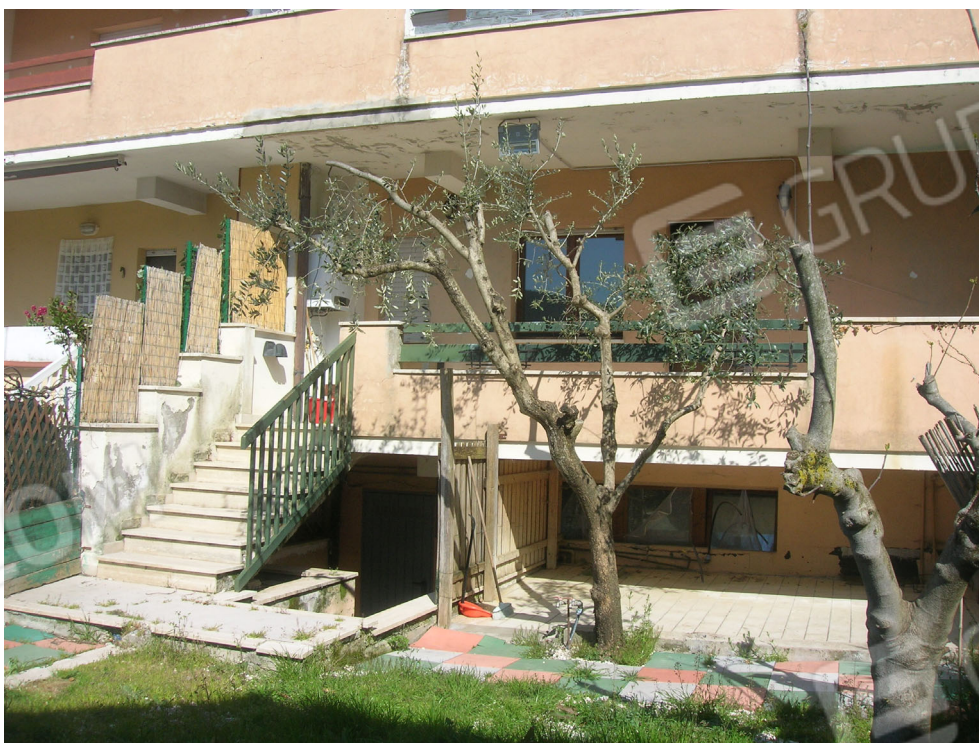
Vedute esterne del fabbricato