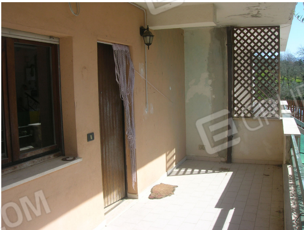
Vedute esterne del fabbricato – zona di accesso all'alloggio