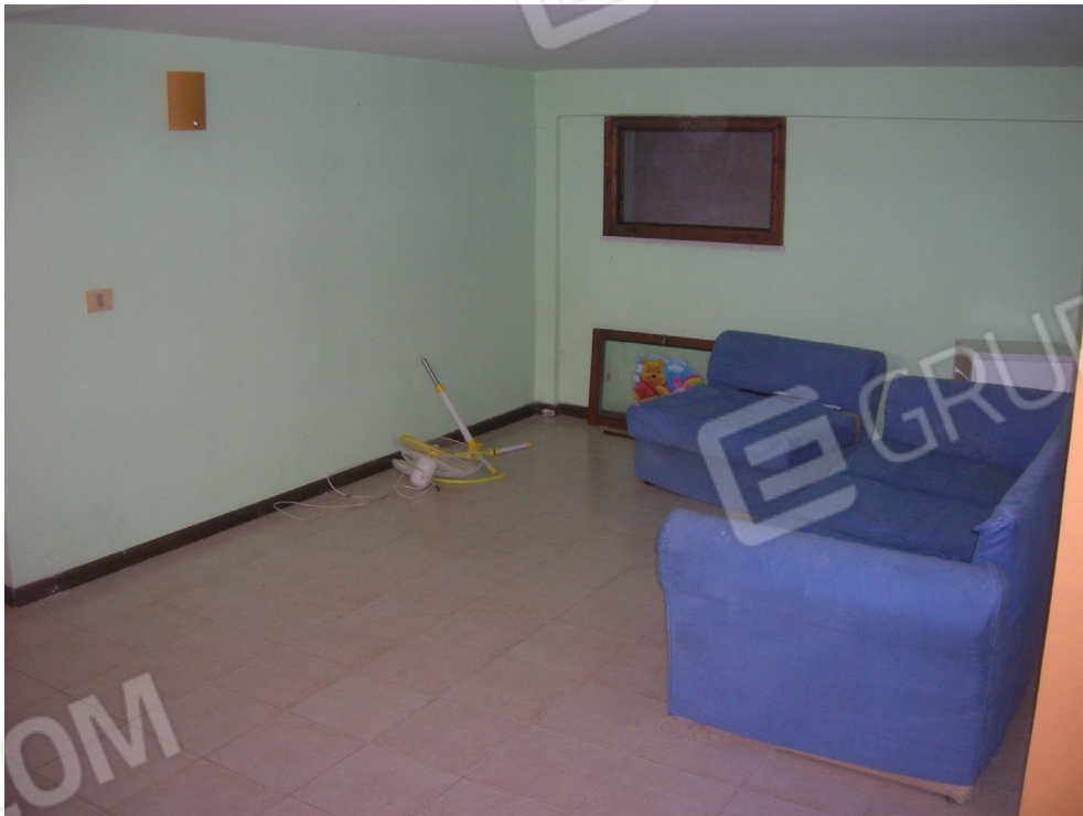
Vedute interne: piano sottostrada