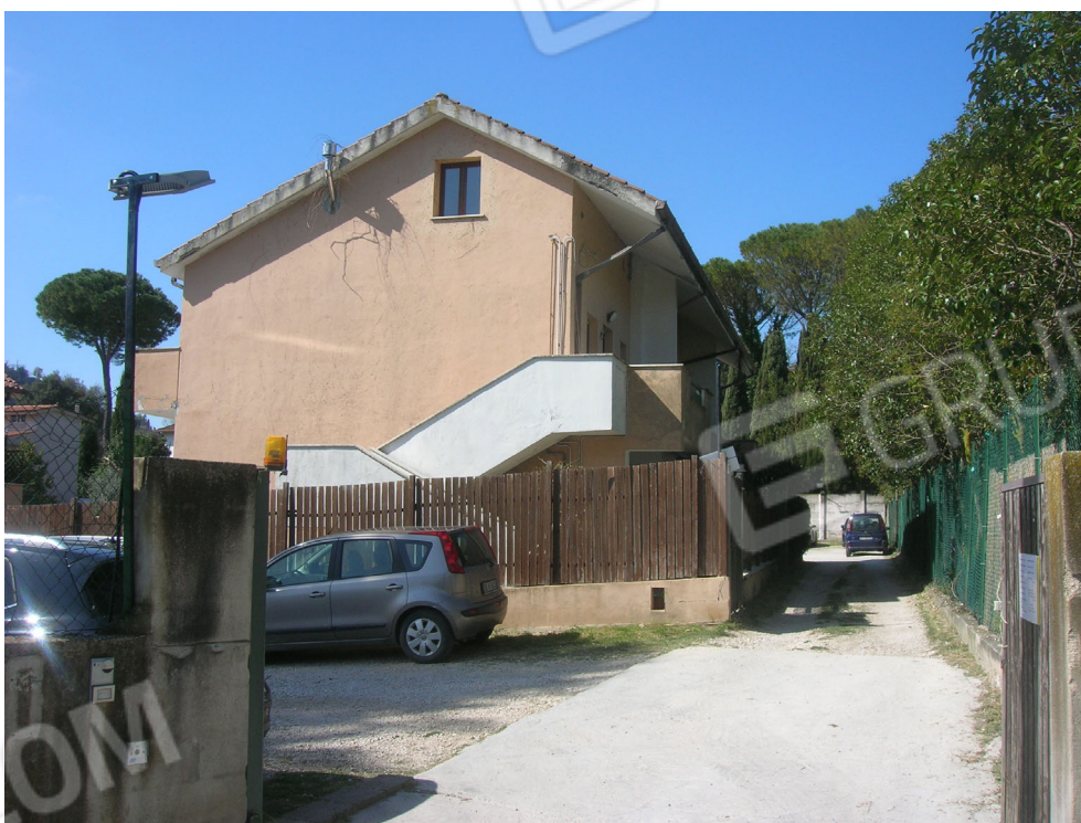
Vedute esterne del fabbricato e del contesto in cui è inserito