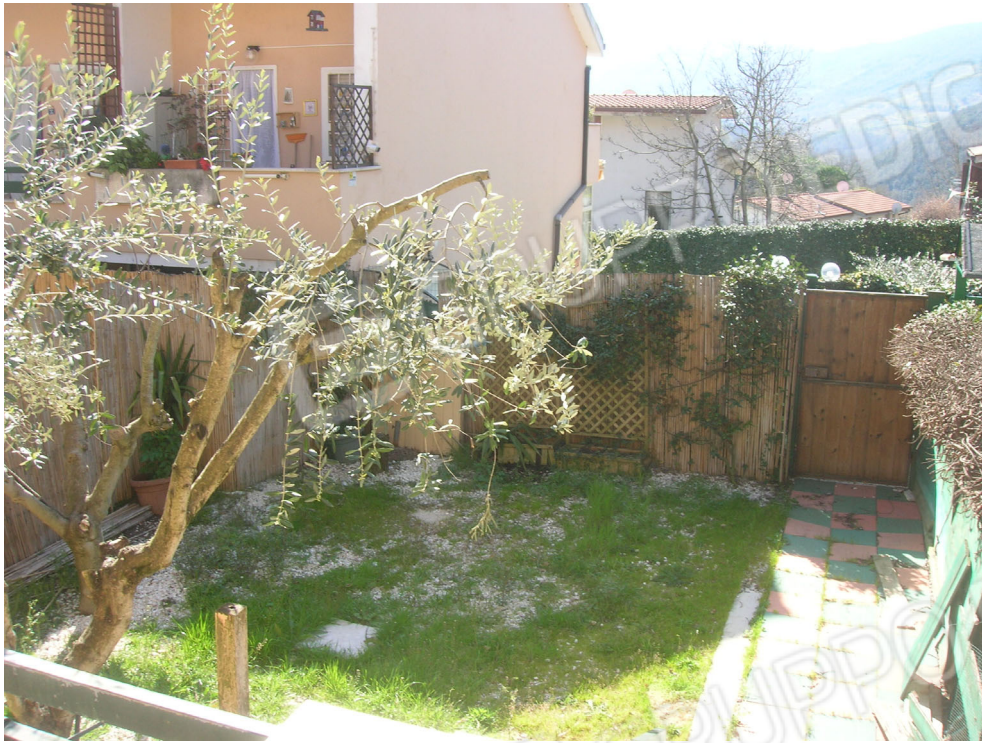
Vedute esterne del fabbricato – giardino pertinenziale