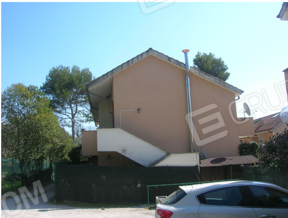
Vedute esterne del fabbricato