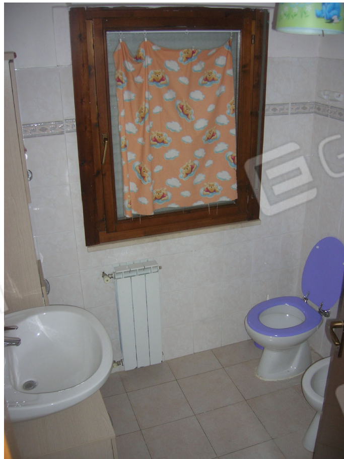
Vedute interne: piano terra