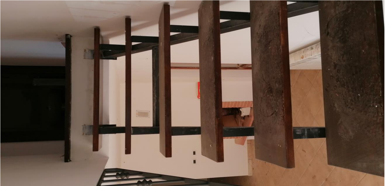
9) Scala interna