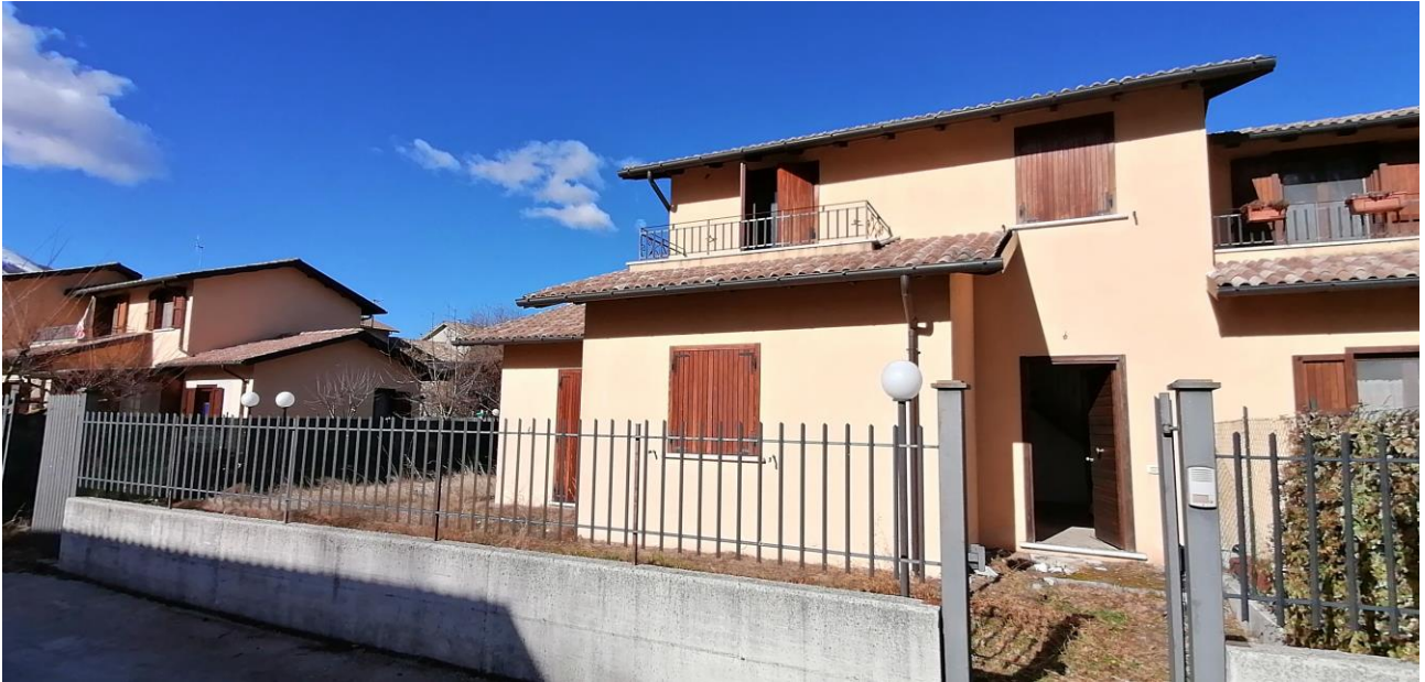
1) Vista prospetto principale