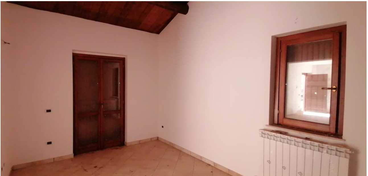
6) Vano cantina p.t.