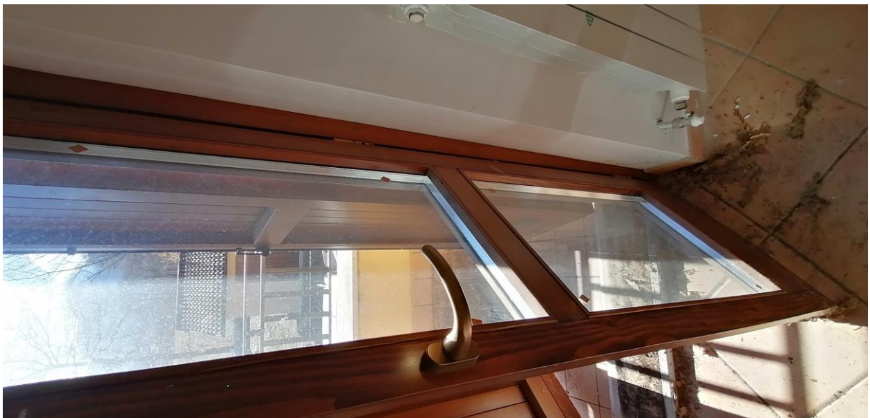
10) Particolare infisso