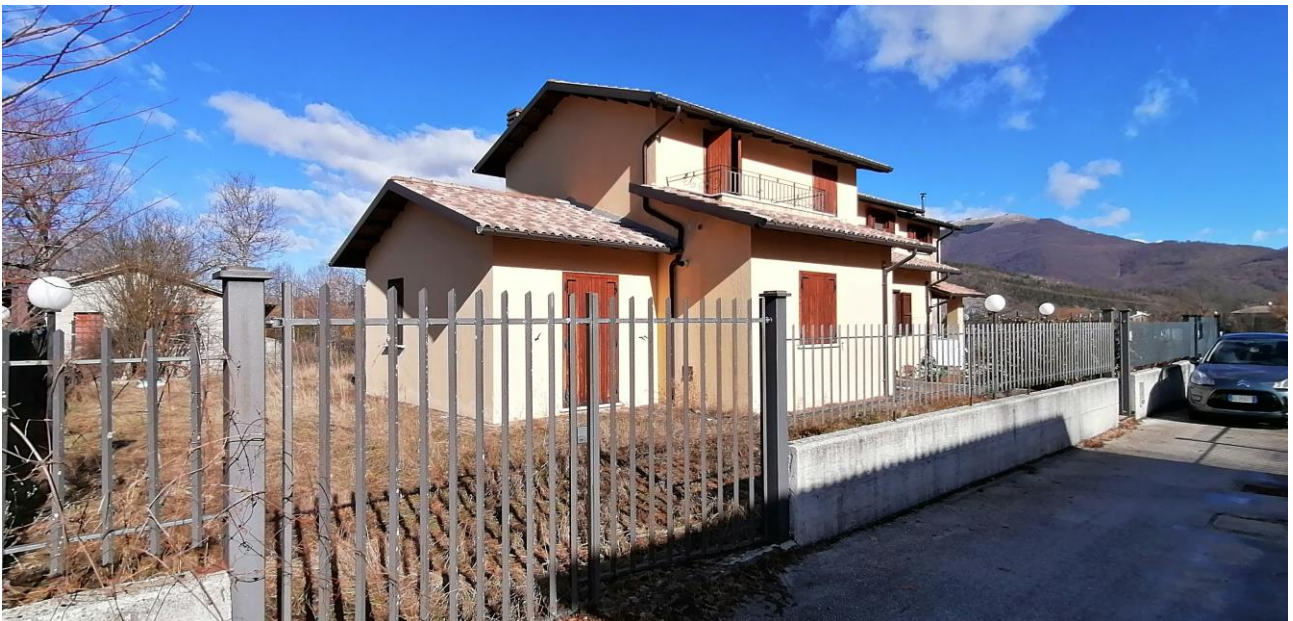
2) Vista prospetto principale