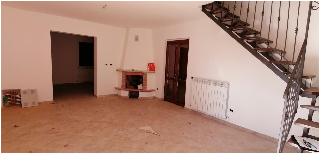
4) Soggiorno p.t.