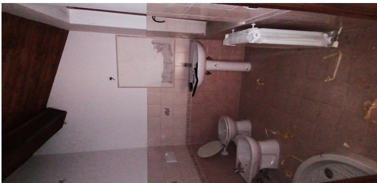
8) Bagno 1° p.