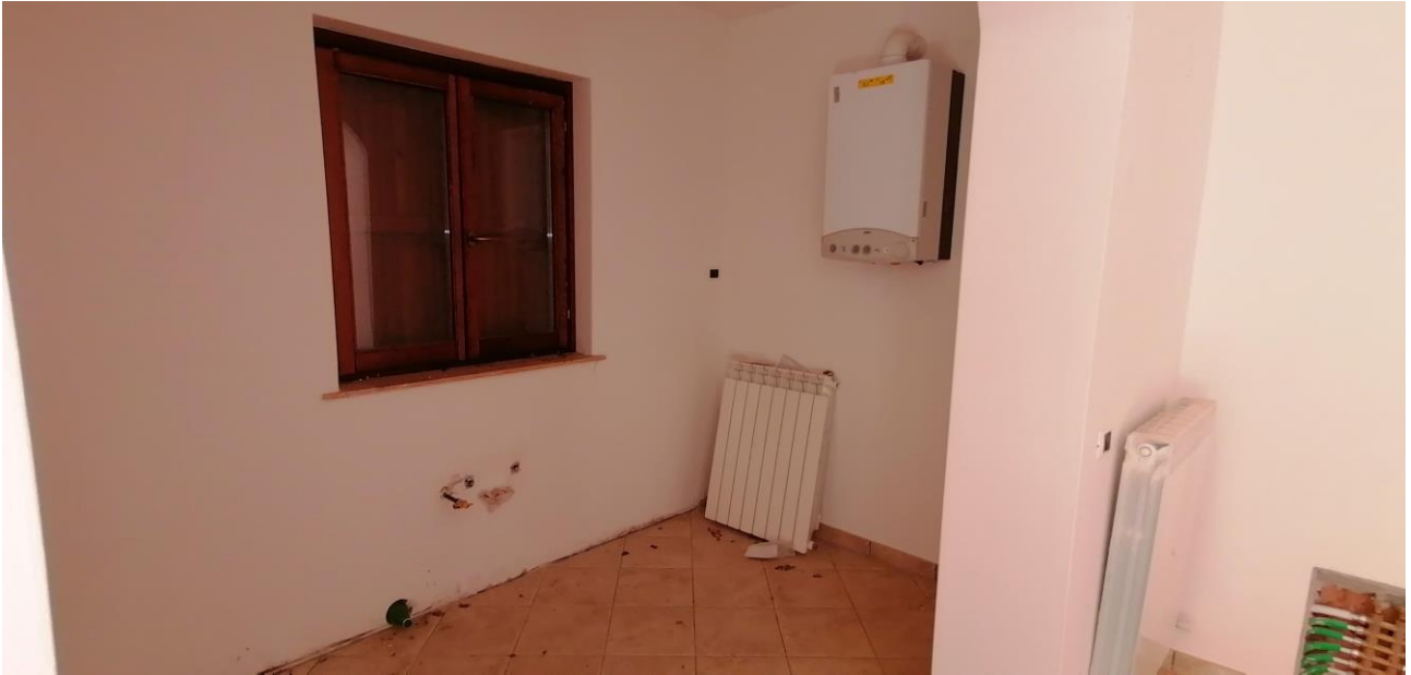
5) Vano cucina