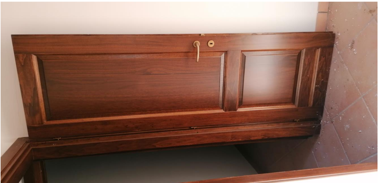
14) Particolare infisso interno