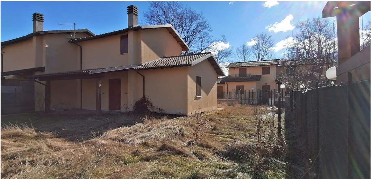
3) Vista prospetto posteriore