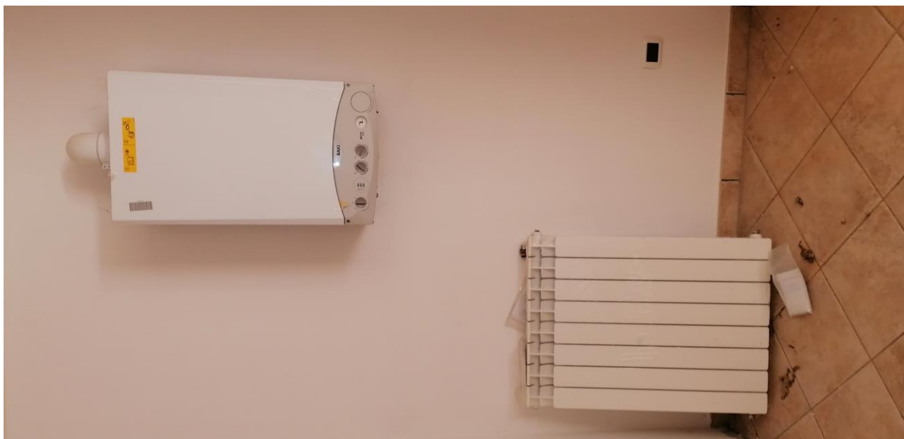
11) Caldaia murale ed elemento radiante