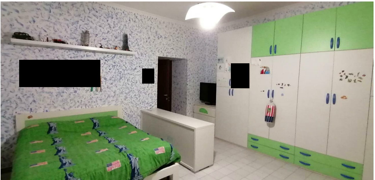
FOTO 9 Vano letto