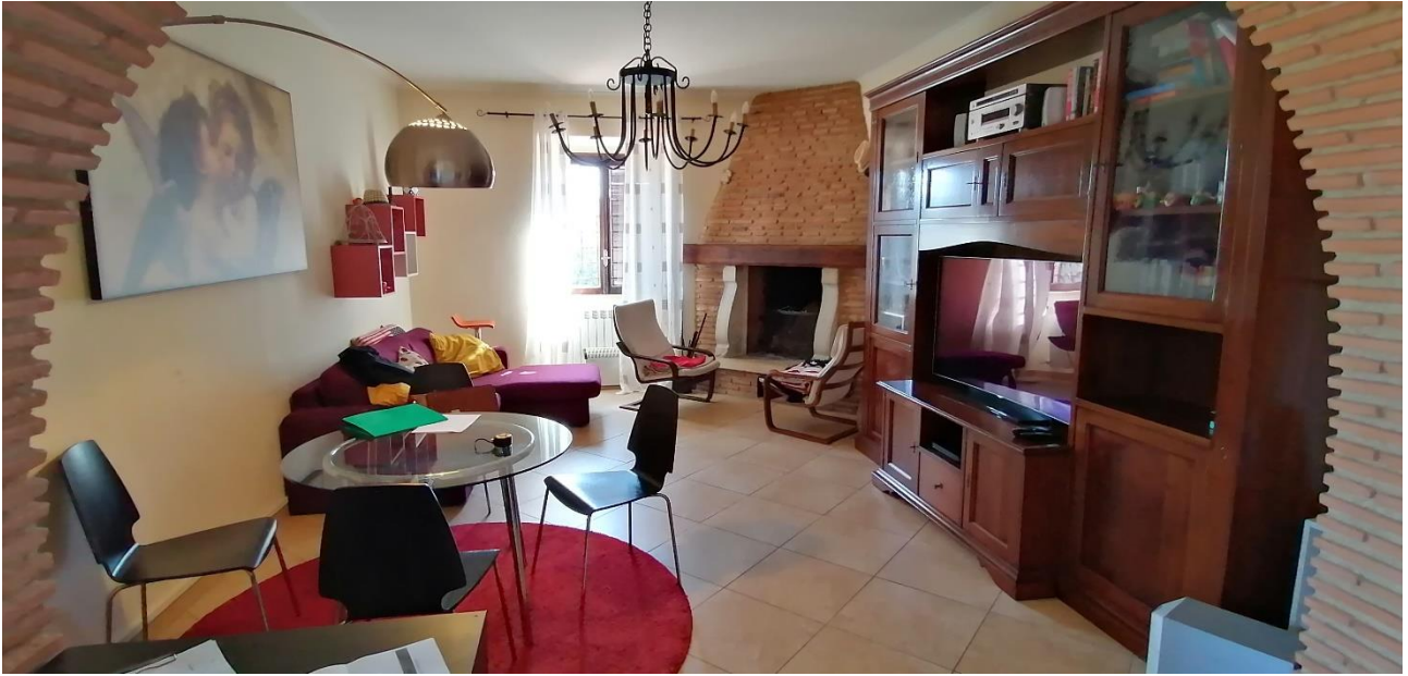
FOTO 4 Soggiorno