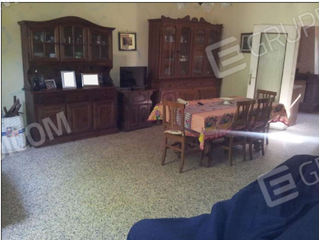
Foto 12– Vista interna appartamento piano terra – Soggiorno/Pranzo