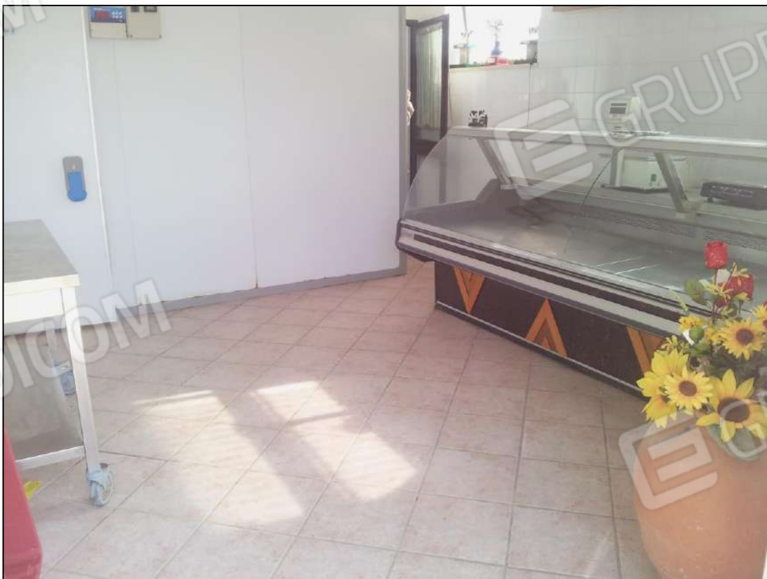
Foto 16 – Vista interna locale stagionatura/vendita - piano seminterrato