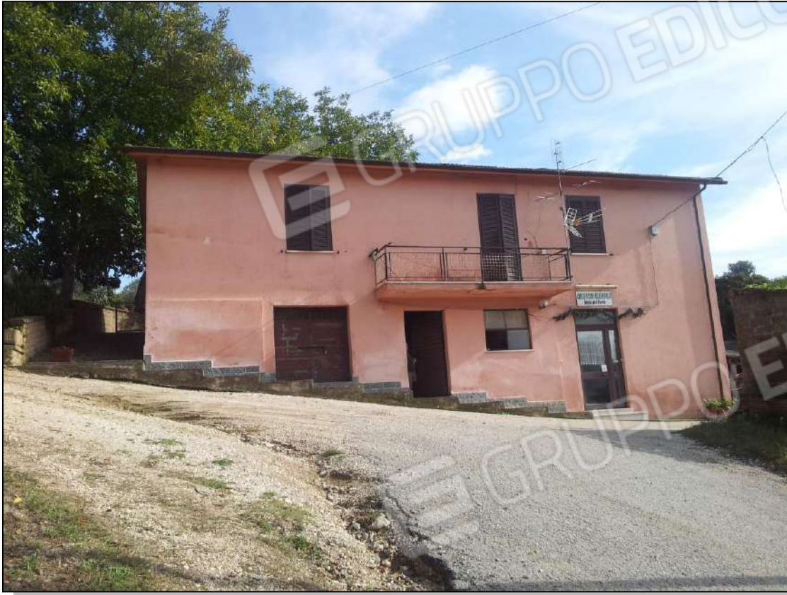
Foto 1 – Vista del fabbricato lato nord-est – strada di accesso (servitù) da Via Ferruti