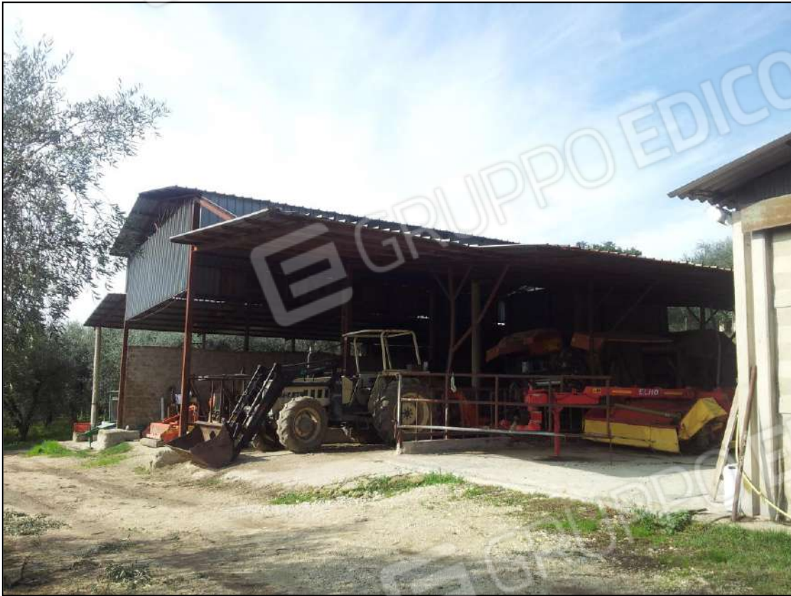
Foto 21 – Vista Capannone e Tettoie (rimesse mezzi/attrezzi) – lato sud -est