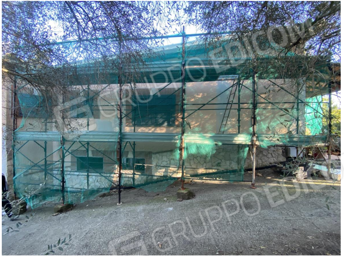
Foto n. 4 Esterno del Fabbricato Prospetto Nord