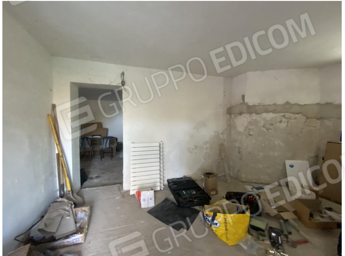
Foto n. 8 Soggiorno/A.c. Piano Terra