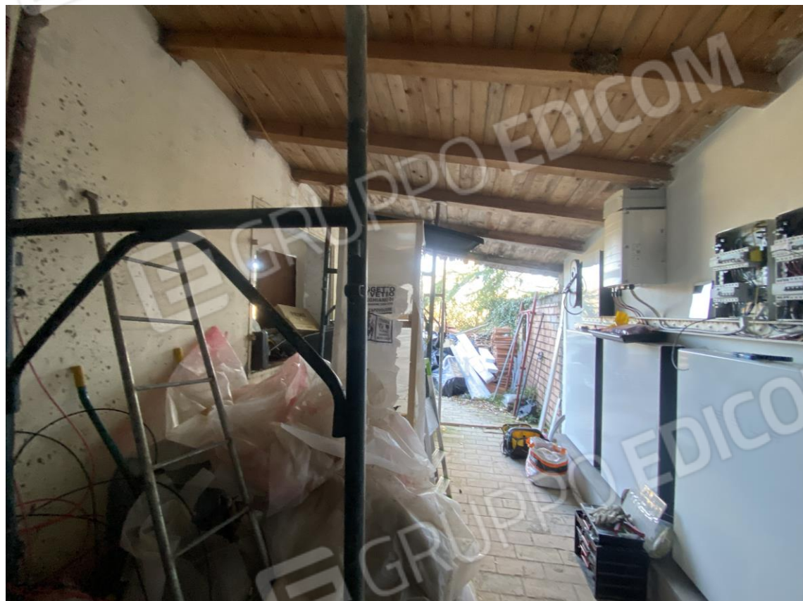
Foto n. 6 Deposito 1 Piano Primo Sottostrada