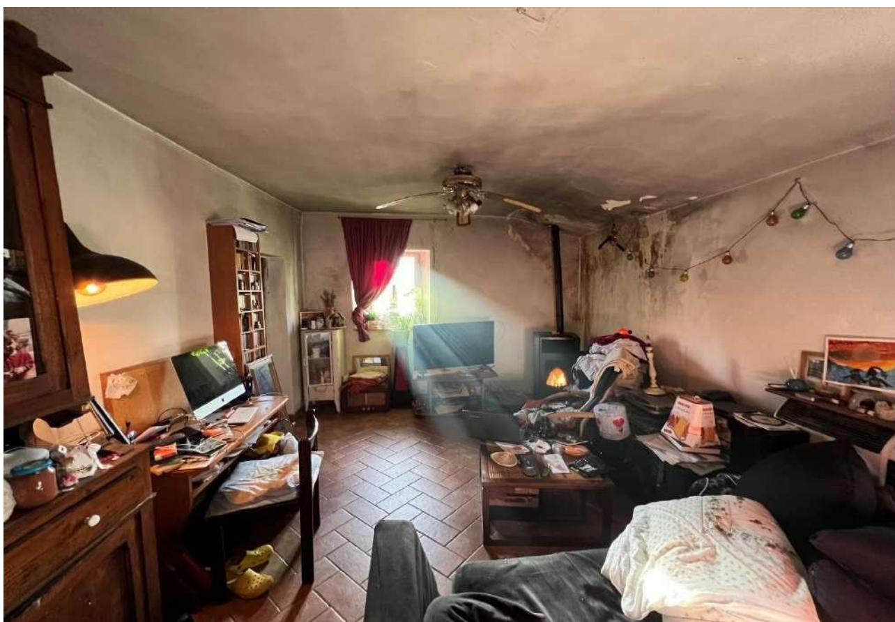
FOTO 6: Veduta interna vano soggiorno/angolo cottura piano secondo