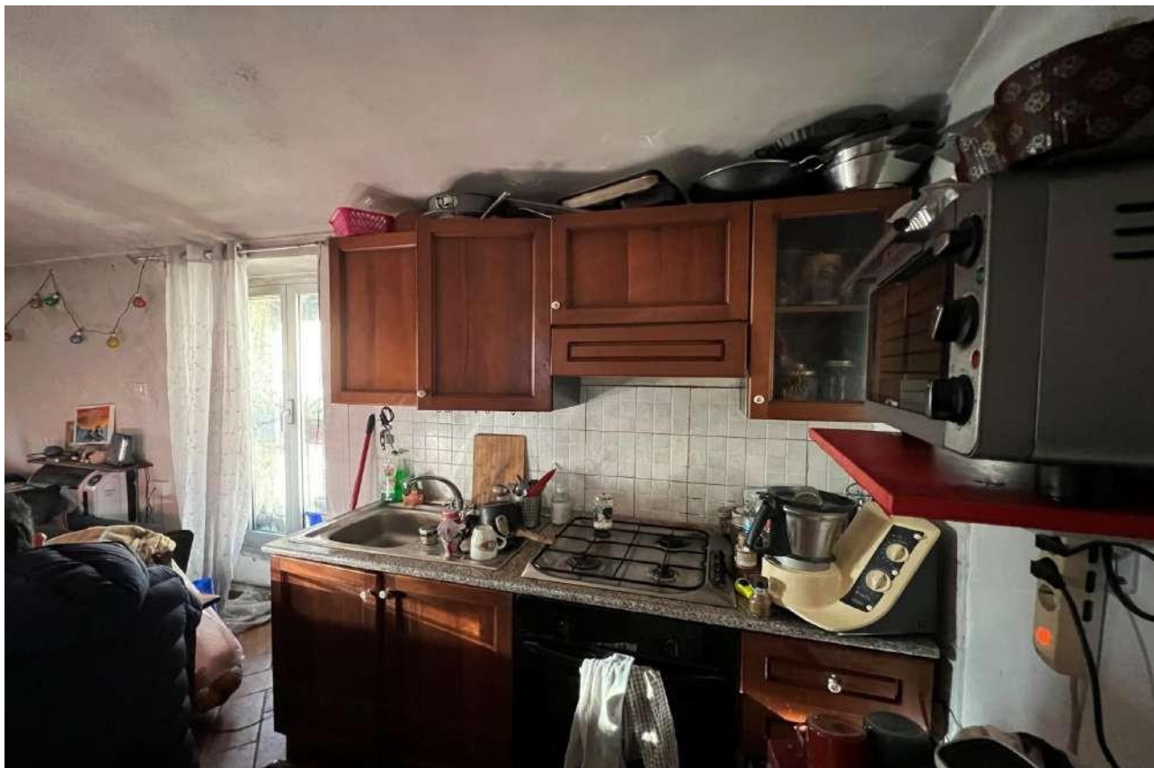
FOTO 9: Veduta interna vano soggiorno/angolo cottura piano secondo