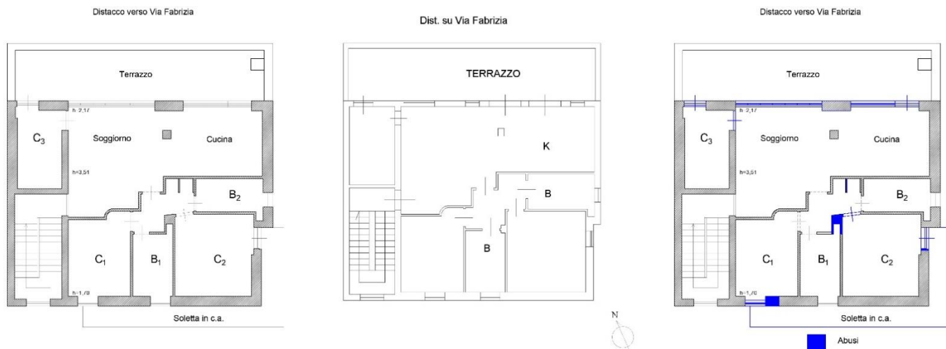
Immagine 2: difformità tra stato dei luoghi e la planimetria catastale dell'appartamento A/2, Int.3.

- DIFFORMITA' - Via Fabrizia n.18 - (Roma) ABITAZIONE Piano Secondo - Int.3 II max= 3,51 ml H min= 1,70 ml