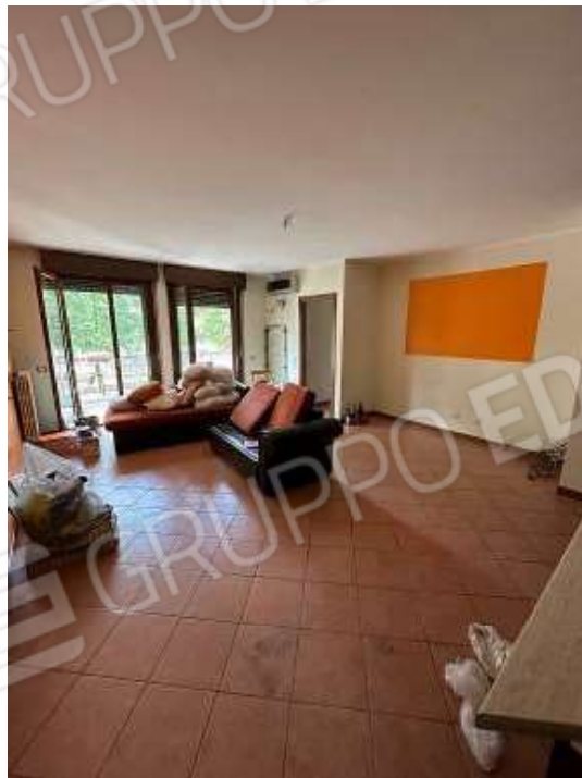
Fotografia n° 6: zona giorno