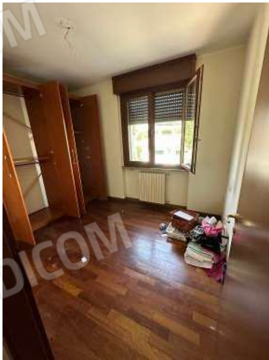
Fotografia n° 11: camera singola