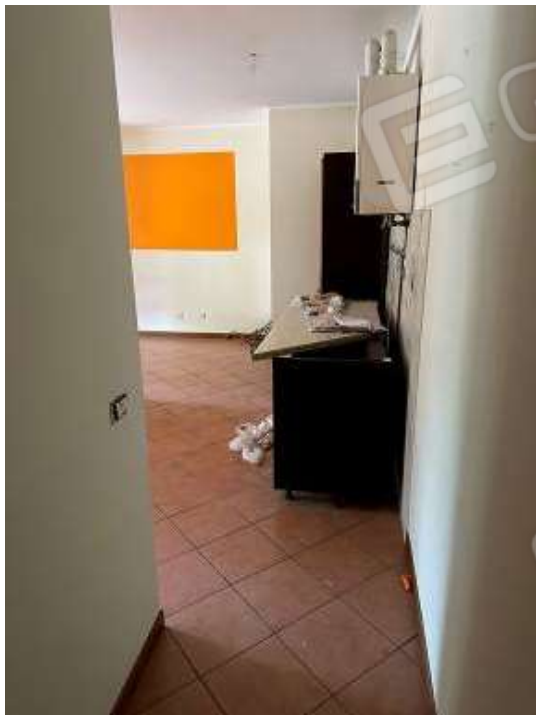
Fotografia n° 5: ingresso