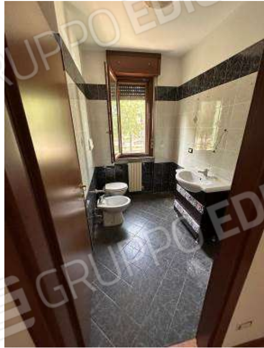
Fotografia n° 10: bagno