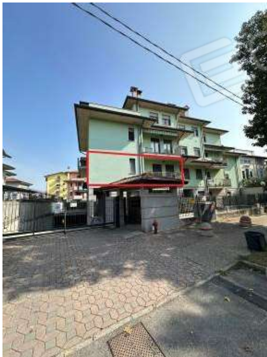
Fotografia n° 1