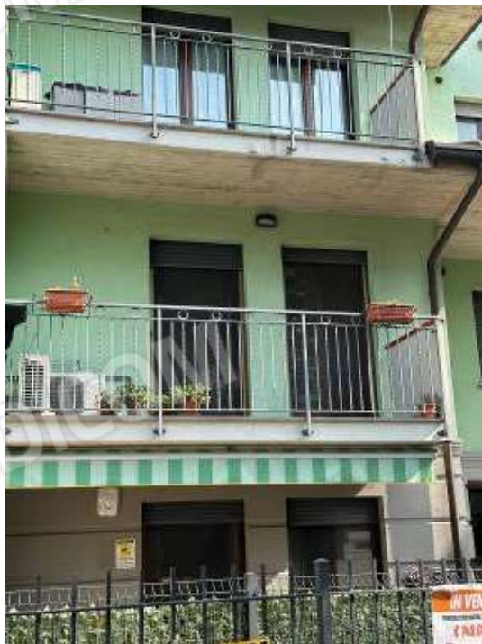
Fotografia n° 3