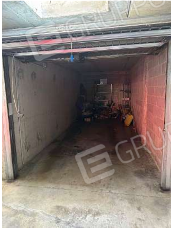
Fotografia n° 13: box