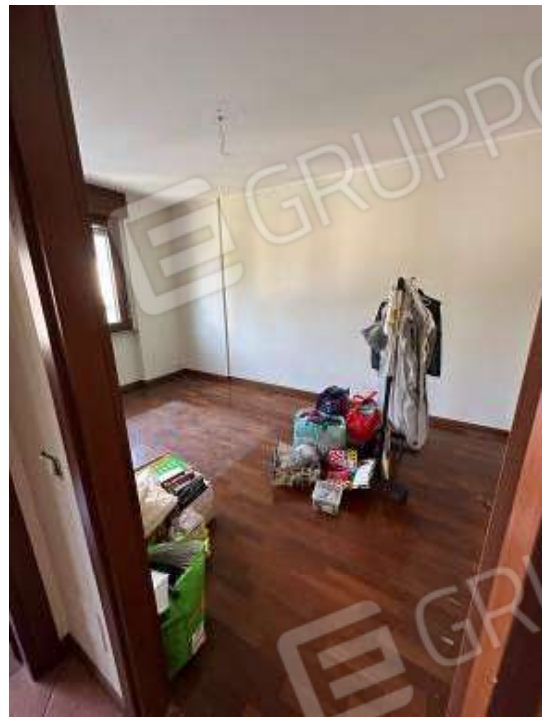
Fotografia n° 12: camera matrimoniale