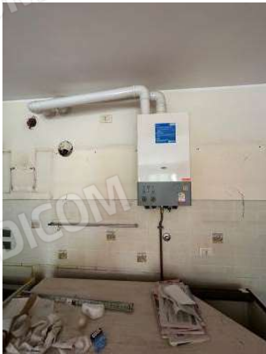
Fotografia n° 7: cucina