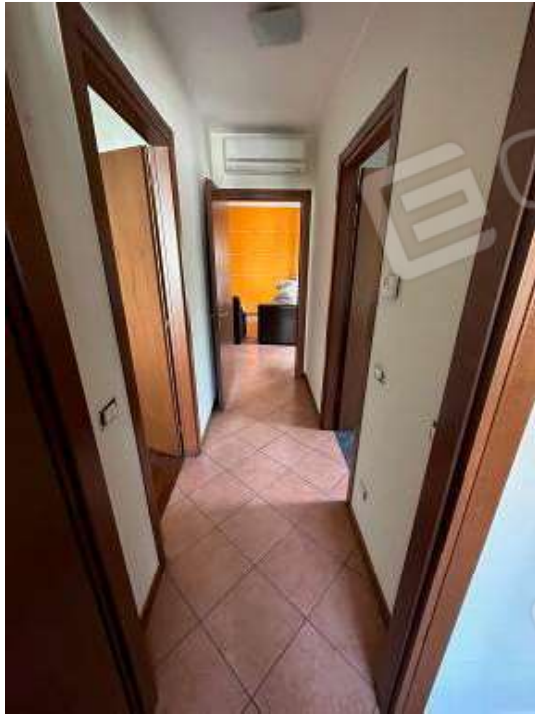
Fotografia n° 9: disimpegno