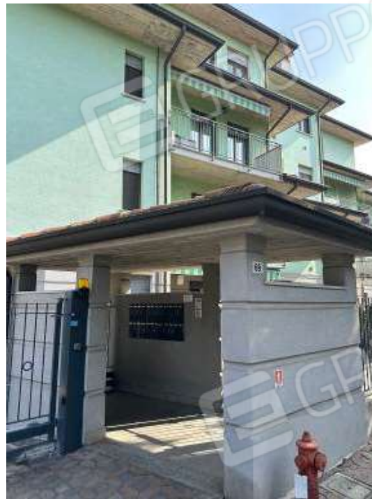
Fotografia n° 4