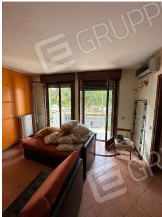
Fotografia n° 8: soggiorno