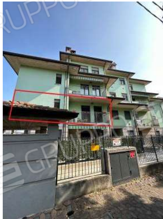
Fotografia n° 2