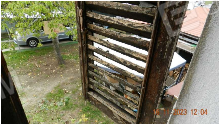
23) altro dettaglio dello Stato di conservazione della persiana della finestra della camera da letto