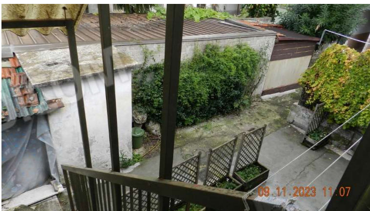
9) Un dettaglio del passaggio pedonale da percorrere per raggiungere la scala di proprietà