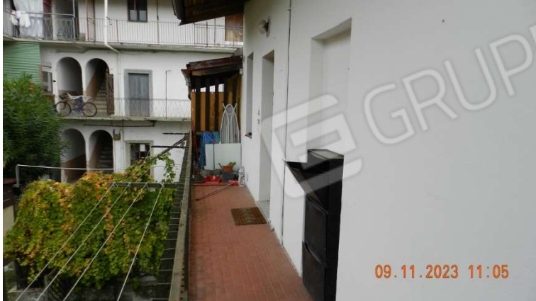
10) Una vista del terrazzo di proprietà