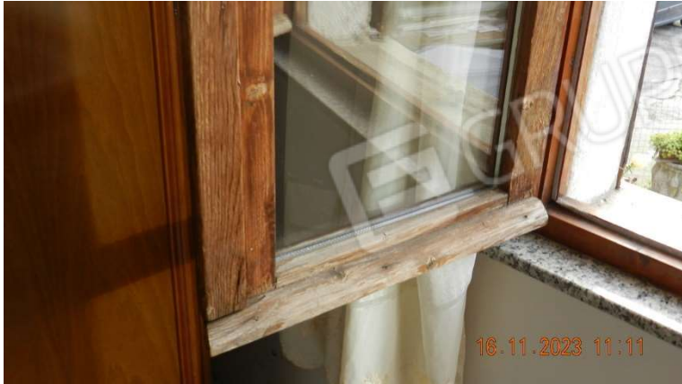
22) un dettaglio dello Stato di conservazione del serramento della camera da letto