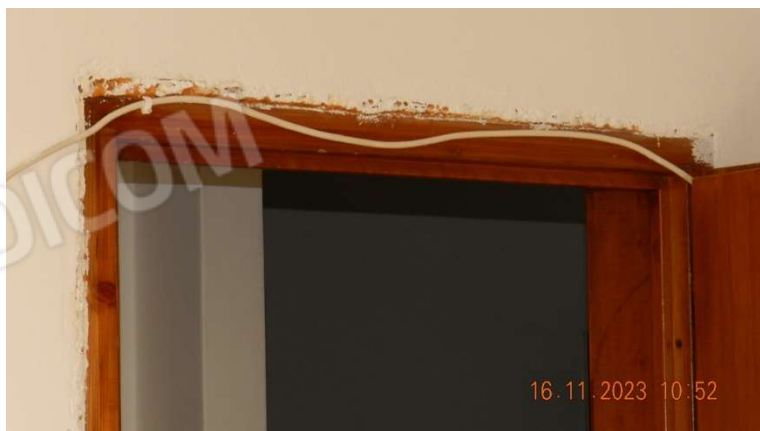
24) Cavi volanti e assenza di coprifili per la porta della camera da letto