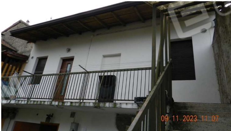
8) Altra vista della porzione oggetto di perizia