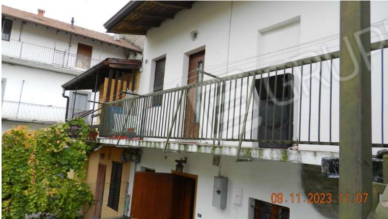
7) Una vista della porzione immobiliare in esecuzione