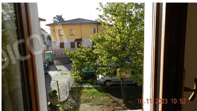
21) nella camera da letto troviamo una finestra che affaccia su altro cortile