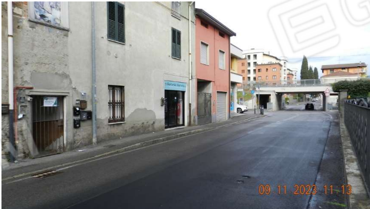
2) Altra veduta di via Cesare Battisti