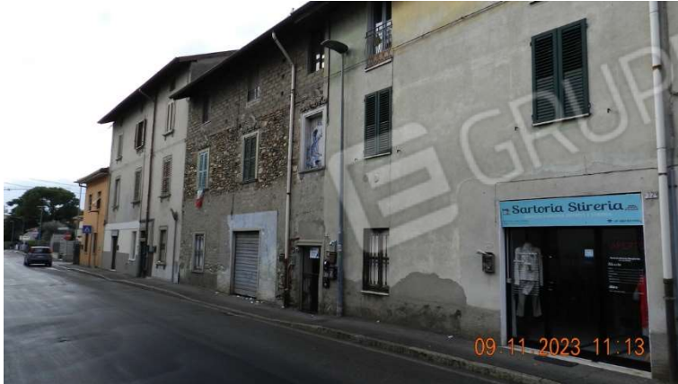
1) Una vista di via Cesare Battisti