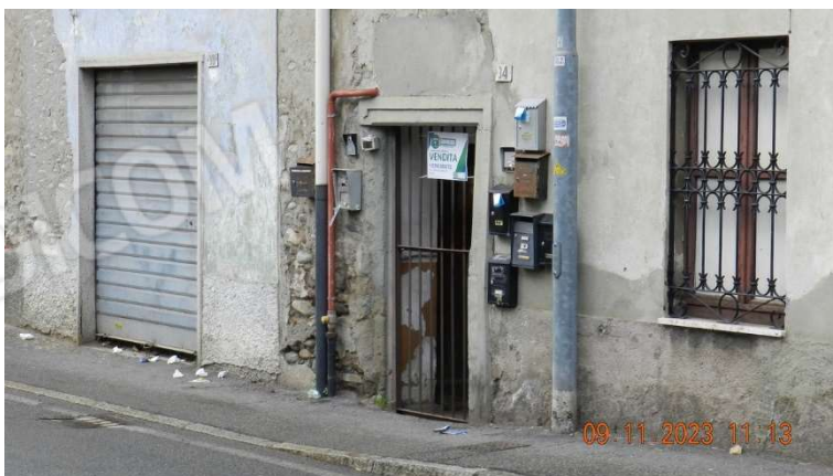
3) Il civico 34 di via Cesare Battisti. Da questo ingresso si accede ad una corte interna dove percorrendo un breve tratto comune si giunge alla scala che porta alla porzione esecutata.