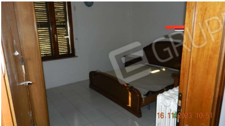
19) Questa è la camera da letto