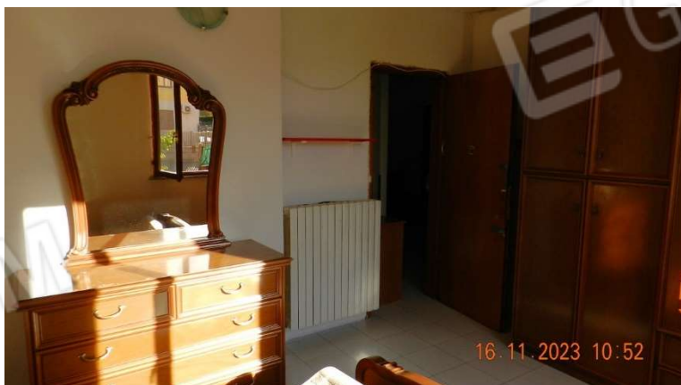
20) Altra vista della camera da letto