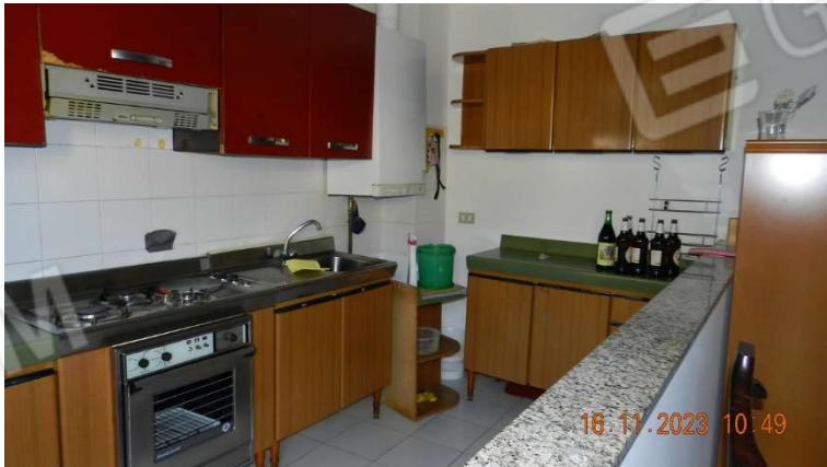
11) All'ingresso troviamo subito alla nostra sinistra la zona cottura