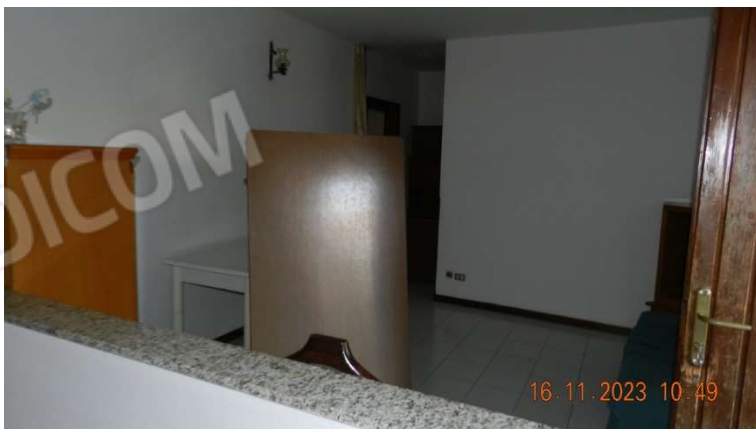
12) l'ampio locale a giorno in diretta comunicazione con la zona cottura