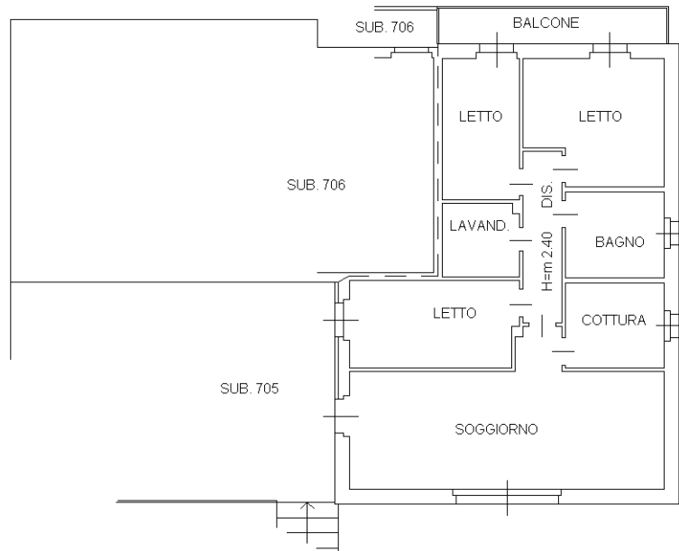
PIANO RIALZATO H=m 2.70