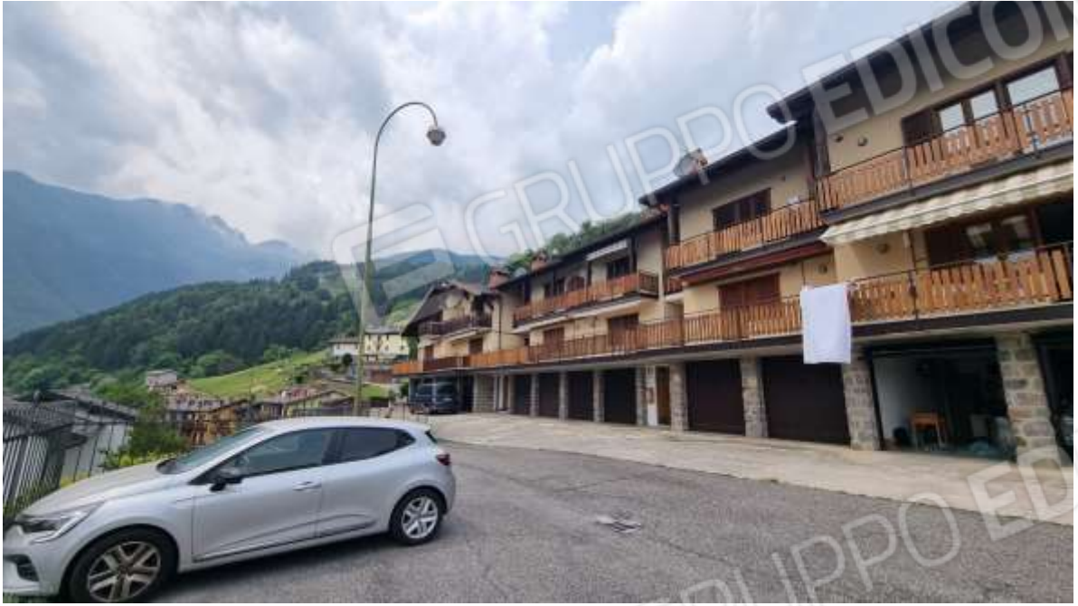
Vista d'insieme condominio Panoramico – via Pizzo Salina, 9-11