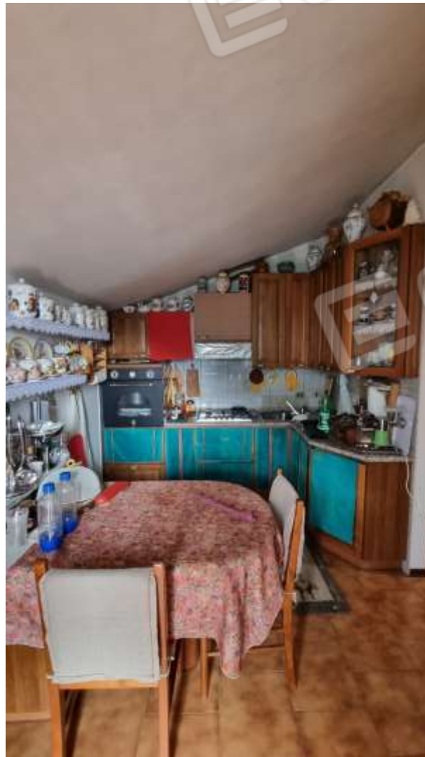
Vista vano cucina