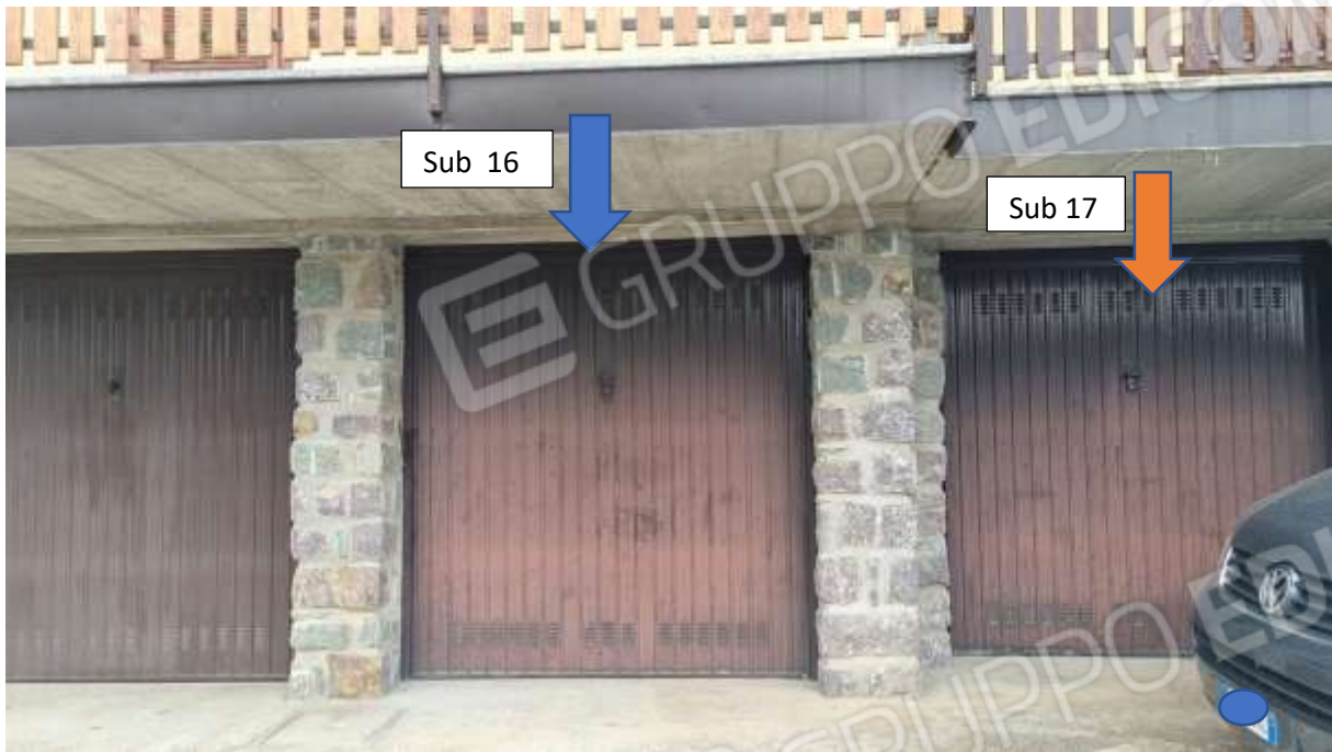
Vista autorimesse sub 16 e sub 17 al piano strada (seminterrato)