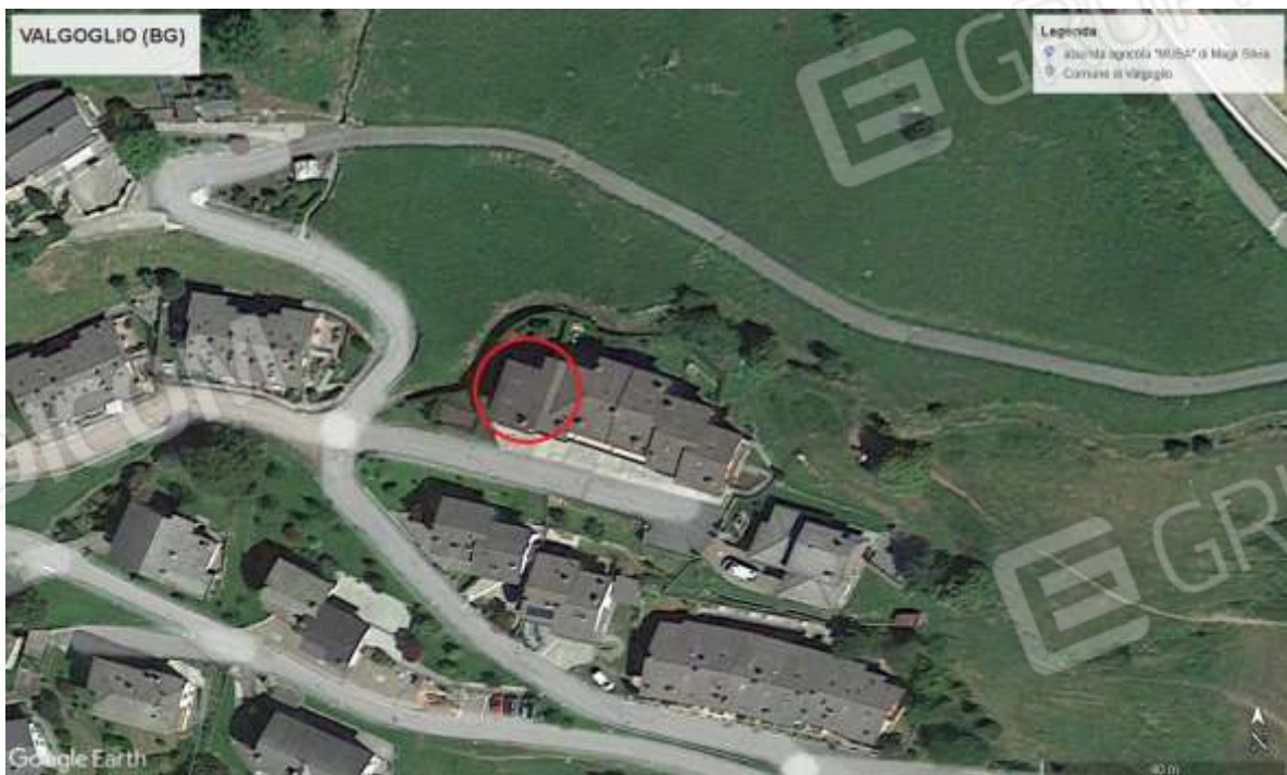
Vista aerea dell'immobile in perizia