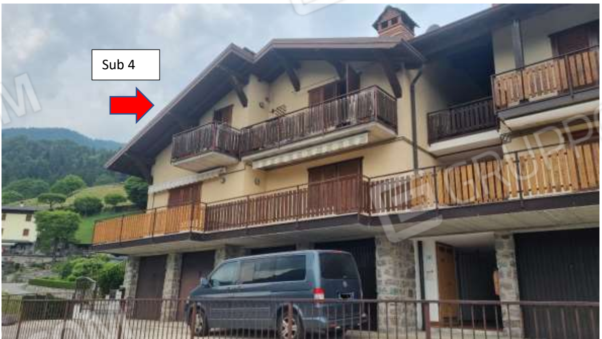
Vista dettaglio immobile pignorato – piano 1°/sottotetto