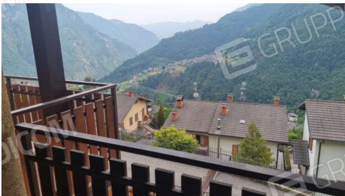
Vista panoramica dai balconi di proprietà (affaccio sud)