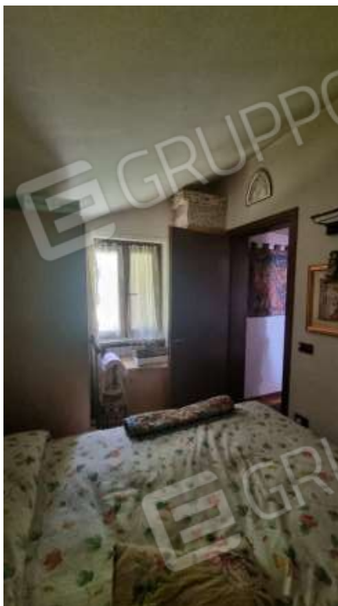
Vista vano ripostiglio/guardaroba usato come seconda camera