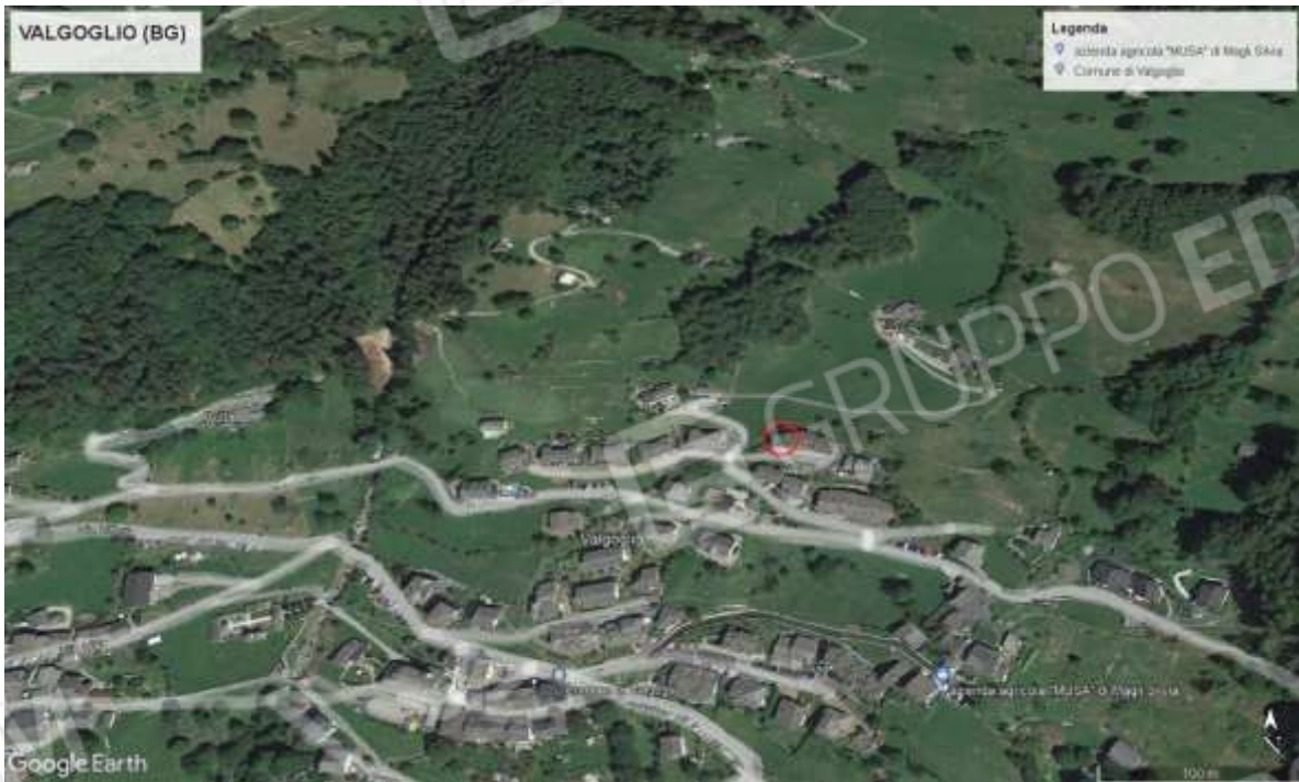
Vista aerea della ubicazione immobile rispetto alla zona centrale di Valgoglio

immobile sito in comune di Valgoglio (BG) – via Pizzo Salina, 9