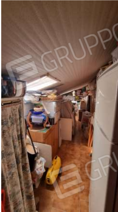
Vista ripostiglio/soffitta collegato direttamente con vano cucina