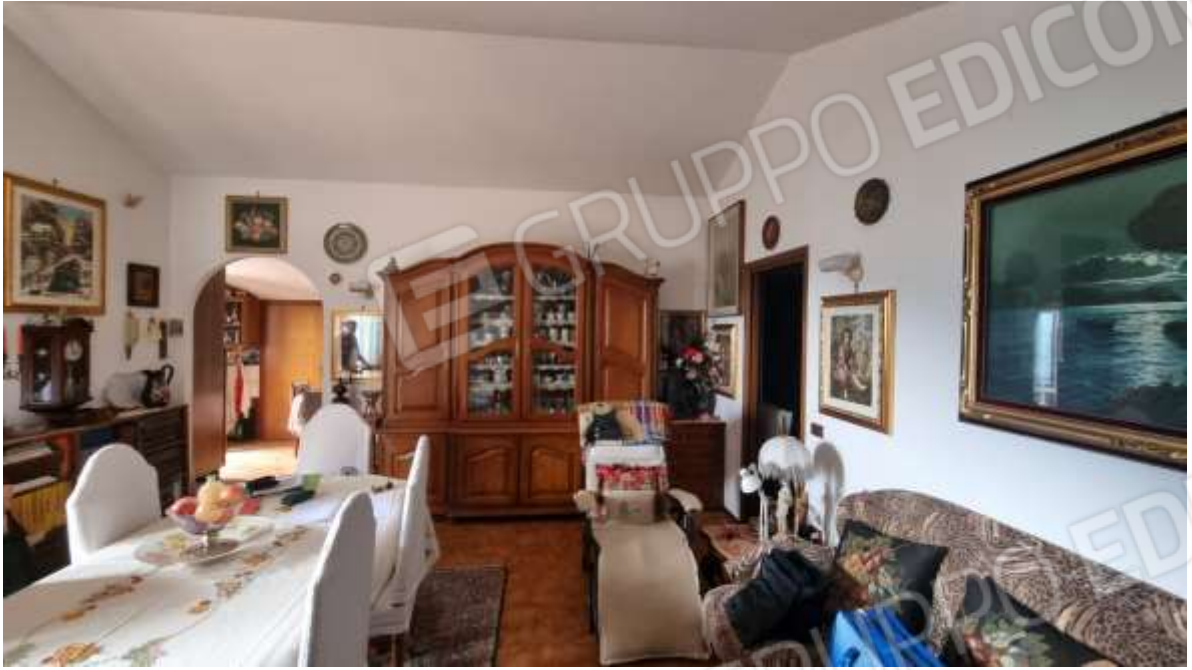
Vista soggiorno-pranzo con accesso a vano cucina e zona notte