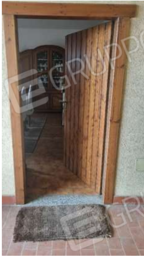
Vista portoncino ingresso appartamento p. 1°