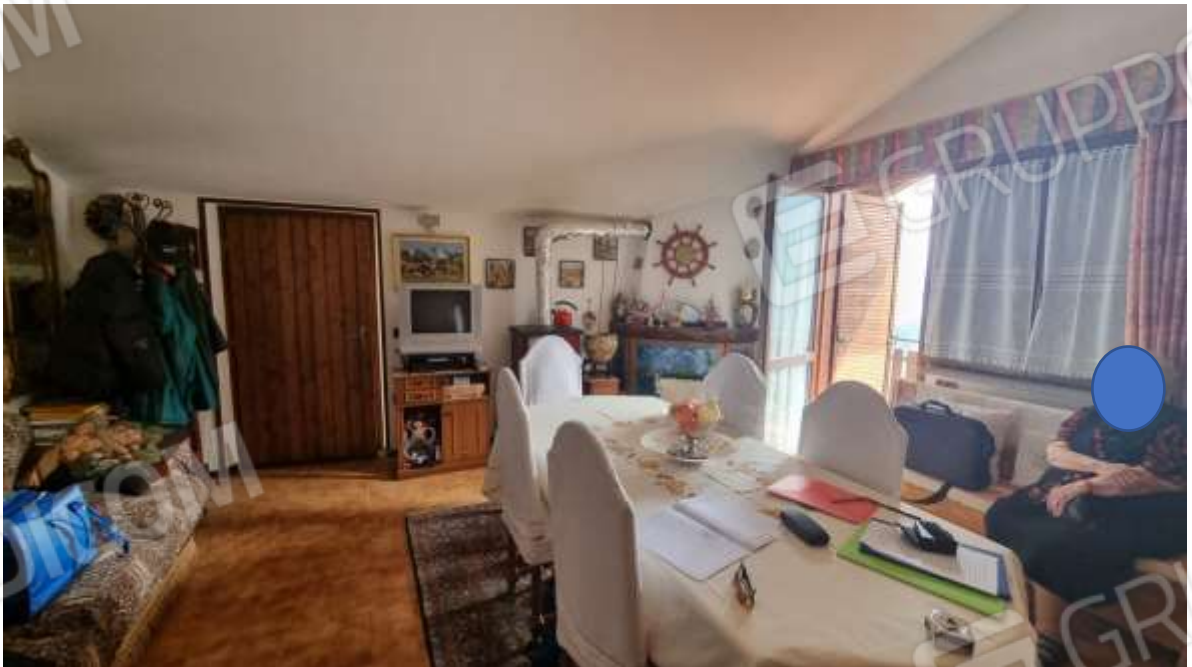
Vista locale soggiorno-pranzo con accesso al balcone