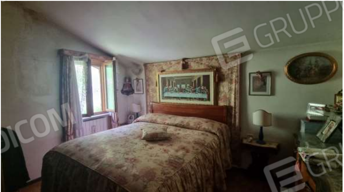
Vista camera letto matrimoniale