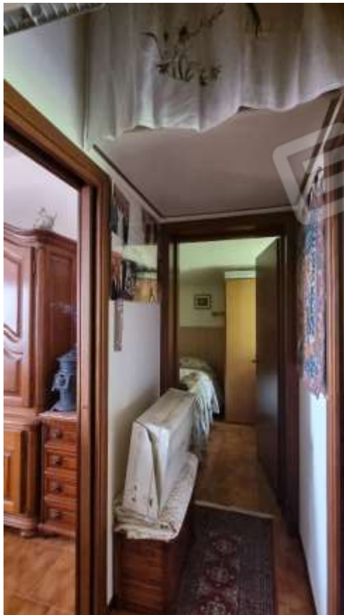
Vista disimpegno zona notte