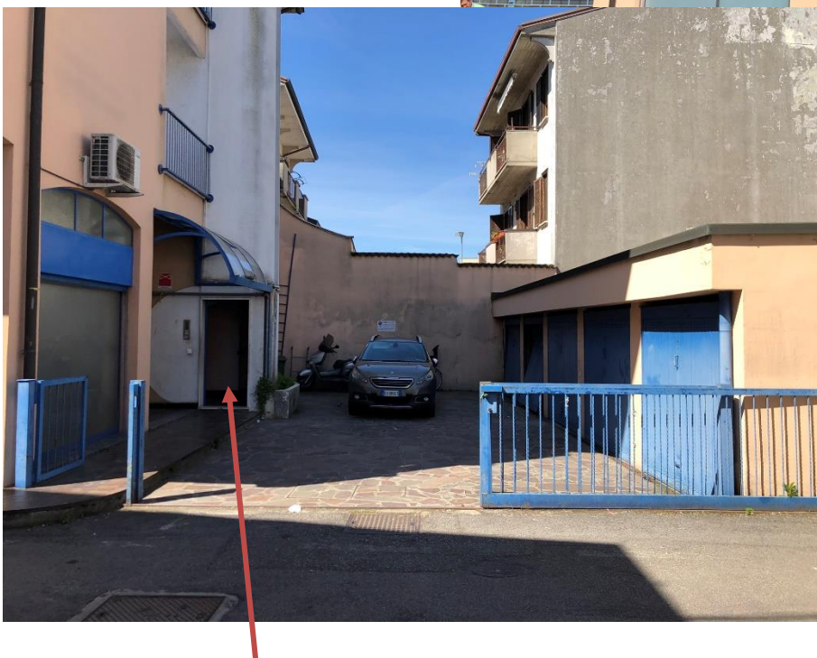
Ingresso civ. 38