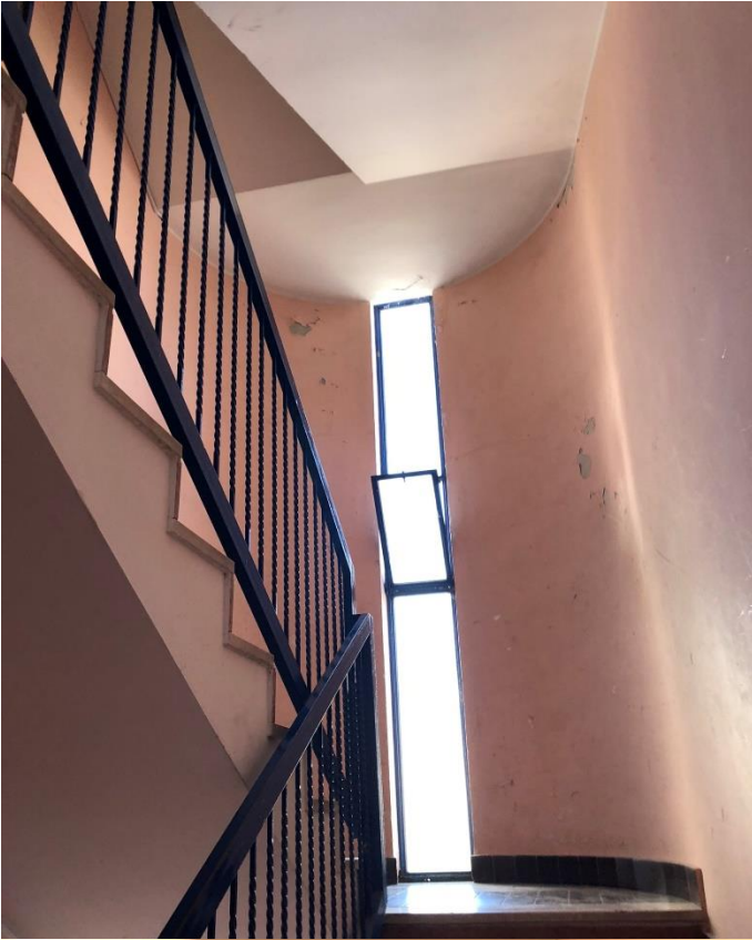
Vano scala condominiale