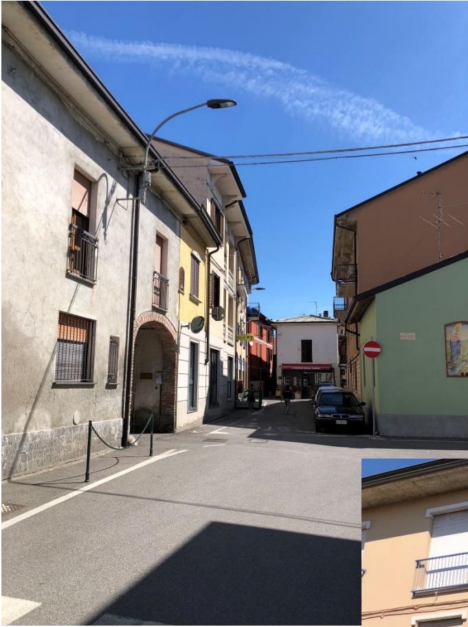
Il contesto di via Solferino