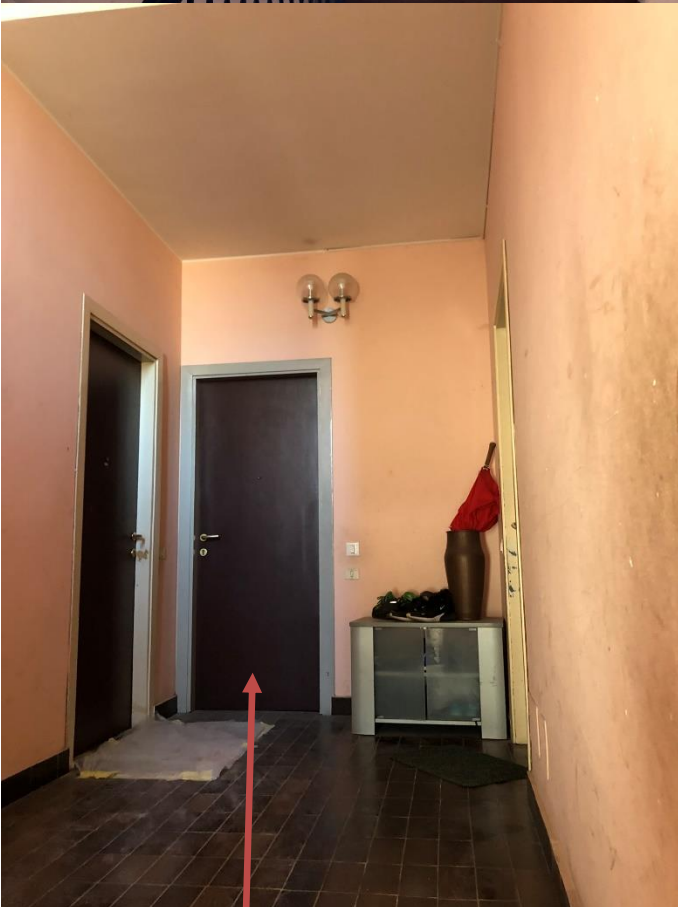
Pianerottolo primo piano