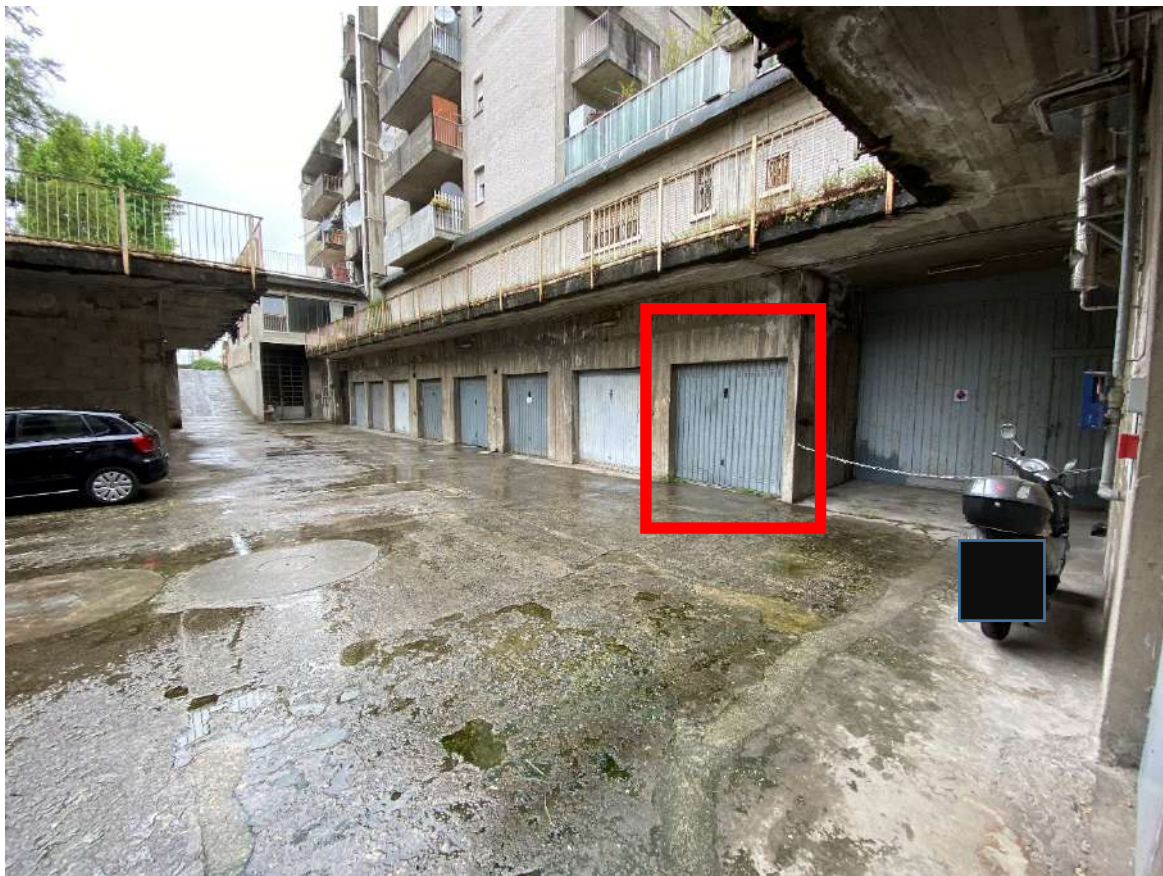
Foto 11 - Vista autorimesse P.Interrato