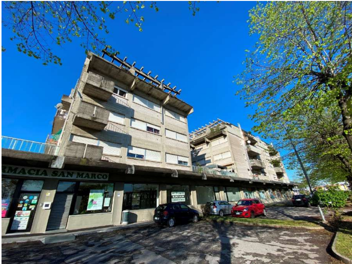
Foto 01 - Vista esterna dell'immobile