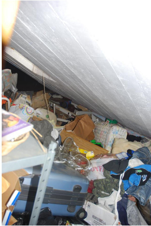
LOCALE SOLAIO - PIANO SECONDO