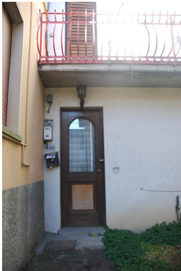
PORTA D'INGRESSO ABITAZIONE