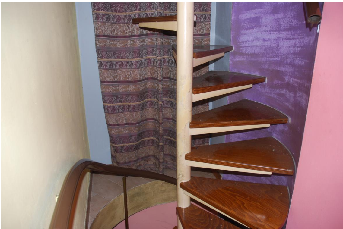
SCALA A CHIOCCIOLA ACCESSO AL PIANO PRIMO