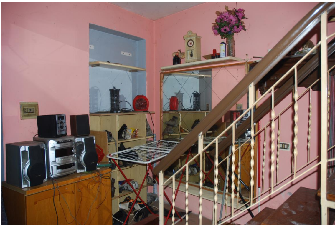
INGRESSO/SOGGIORNO/CUCINA – PIANO TERRA