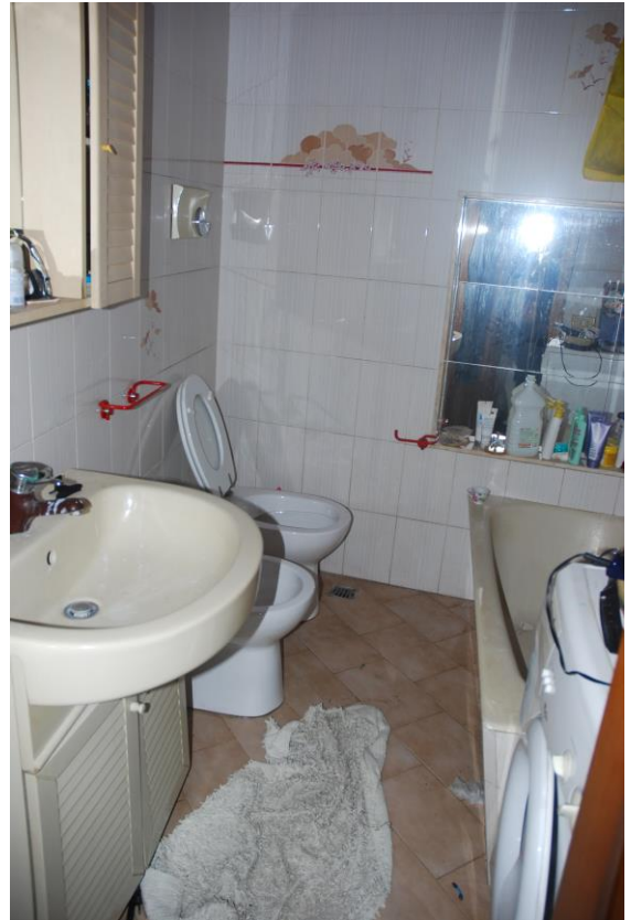
BAGNO – PIANO PRIMO