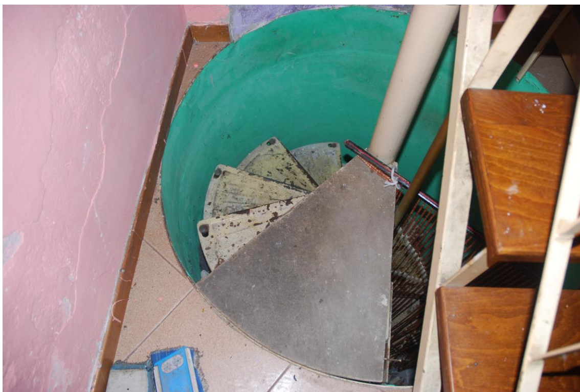
SCALA A CHIOCCIOLA PER ACCESSO AL PIANO INTERRATO (struttura e gradini in metallo)