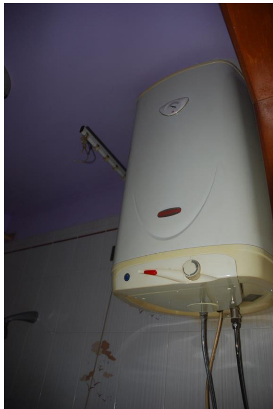
BAGNO – PIANO PRIMO