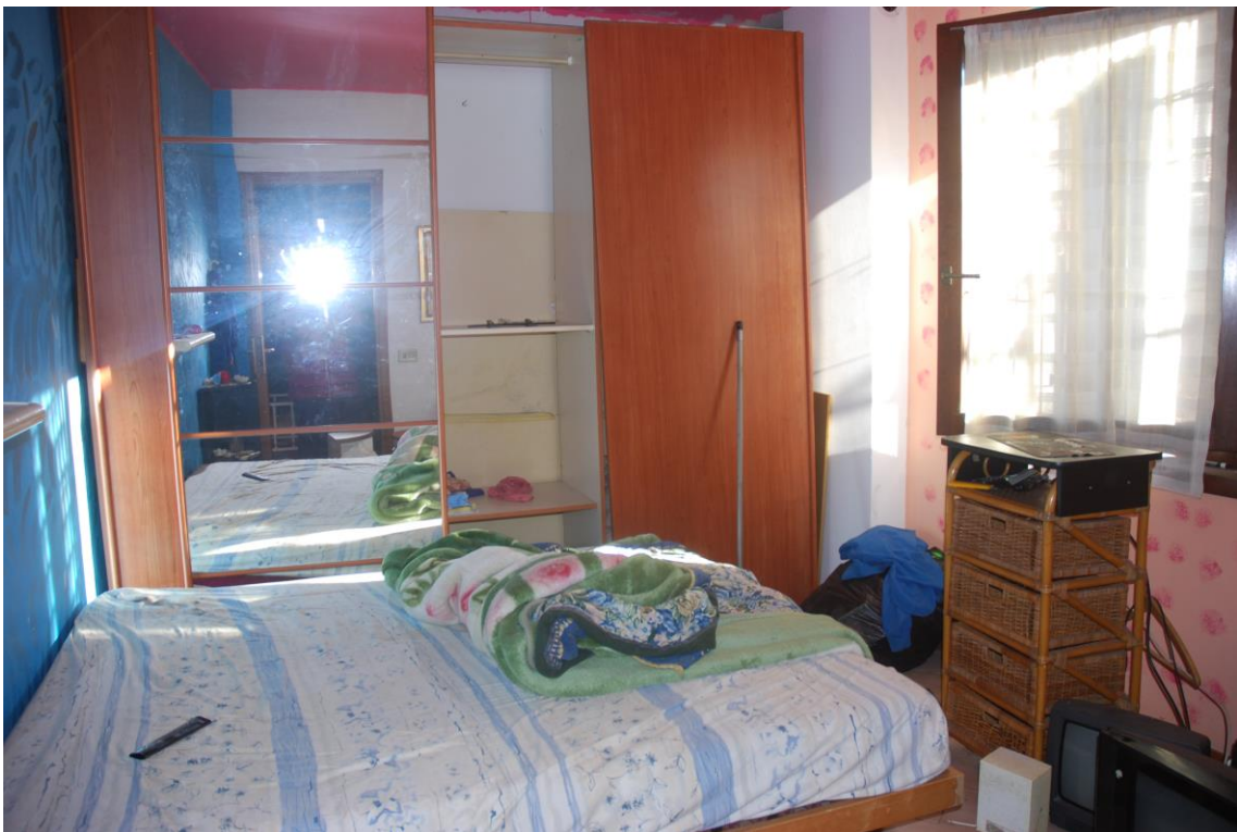
CAMERA – PIANO PRIMO