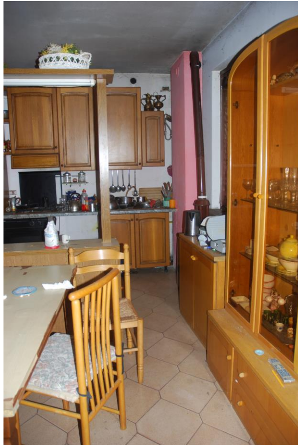
INGRESSO/SOGGIORNO/CUCINA – PIANO TERRA