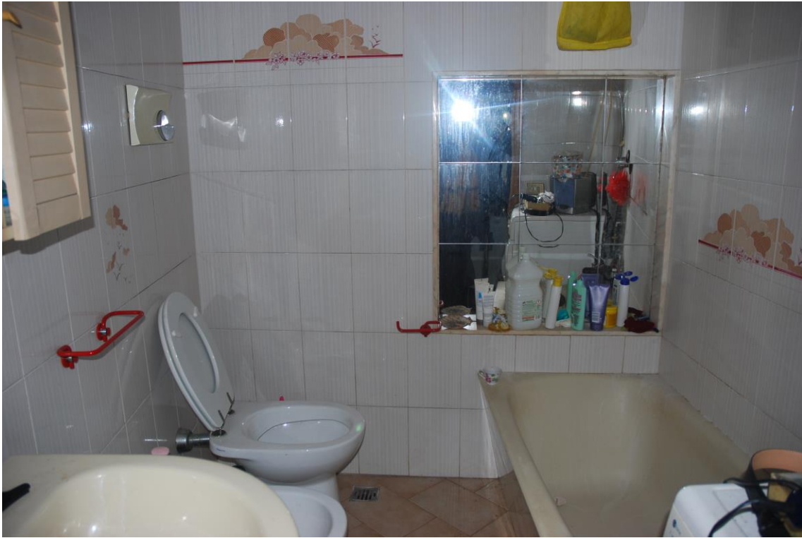
BAGNO – PIANO PRIMO