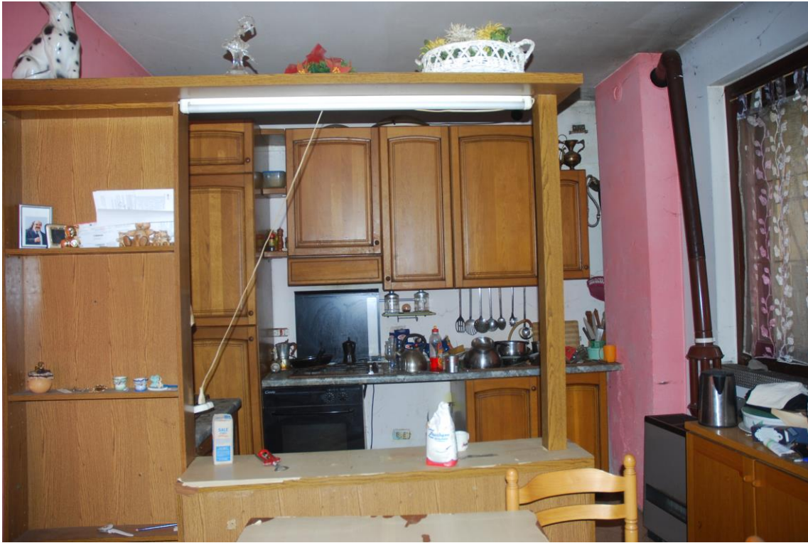
INGRESSO/SOGGIORNO/CUCINA – PIANO TERRA