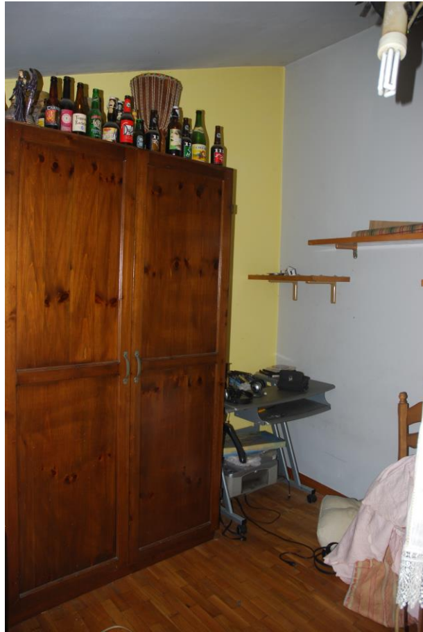
LOCALE SOLAIO – PIANO SECONDO