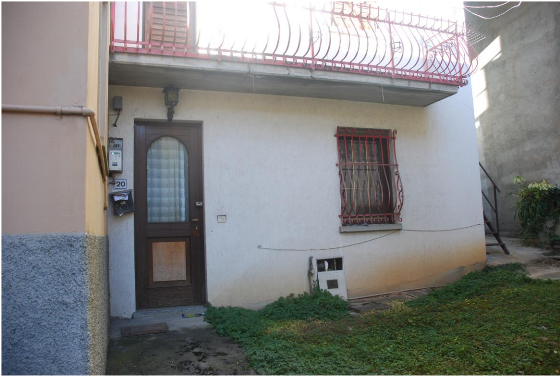
FRONTE SUD – PIANO TERRA