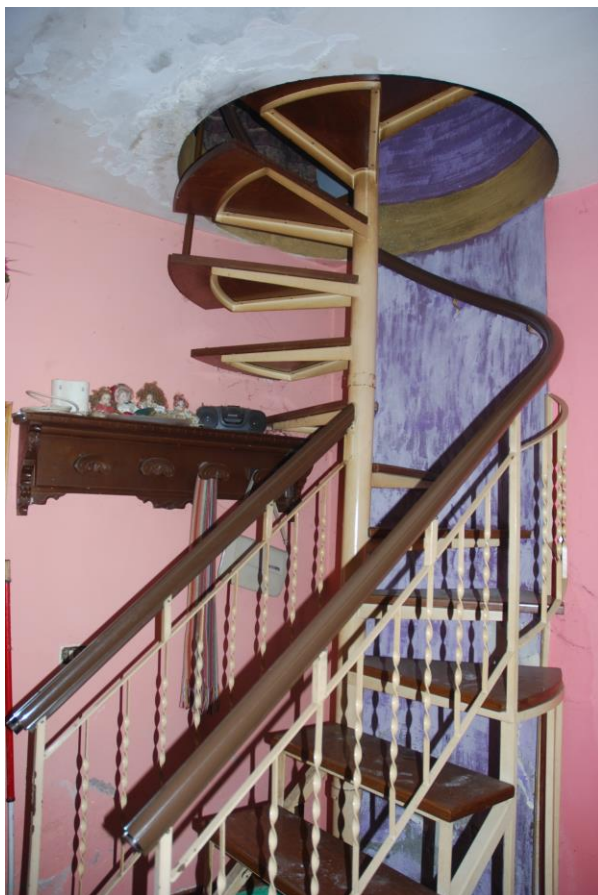
SCALA A CHIOCCIOLA PER ACCESSO AI PIANI (struttura in metallo gradini in legno)