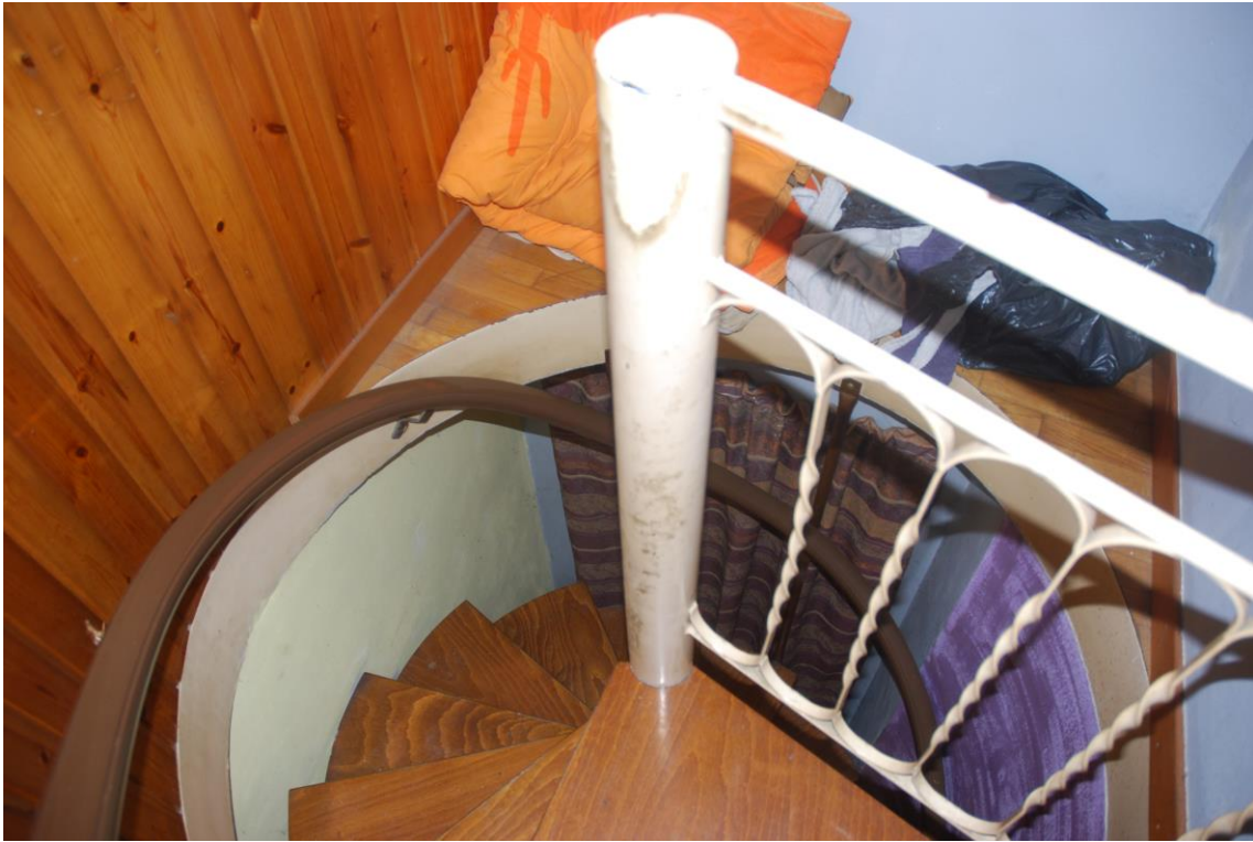
SCALA A CHIOCCIOLA ACCESSO AL PIANO SECONDO