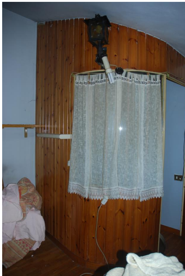
BUSSOLA DI ACCESSO AL PIANO SECONDO