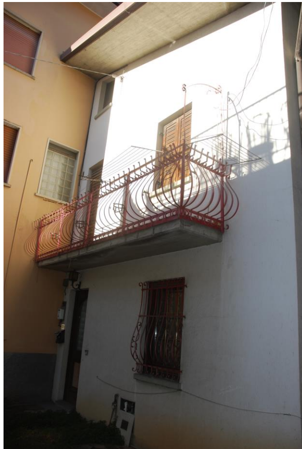
TERRAZZO AL PIANO PRIMO - FRONTE SUD