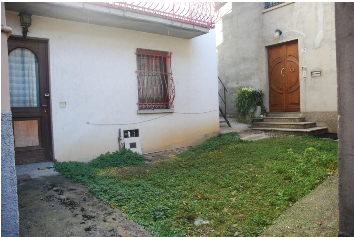
PASSAGGI FRONTE ABITAZIONE