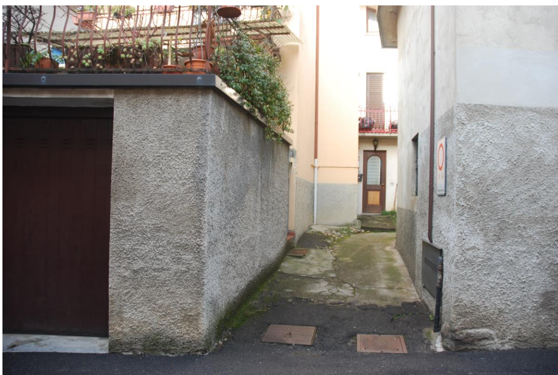
PASSAGGIO DA VIA VITTORIO EMANUELE II