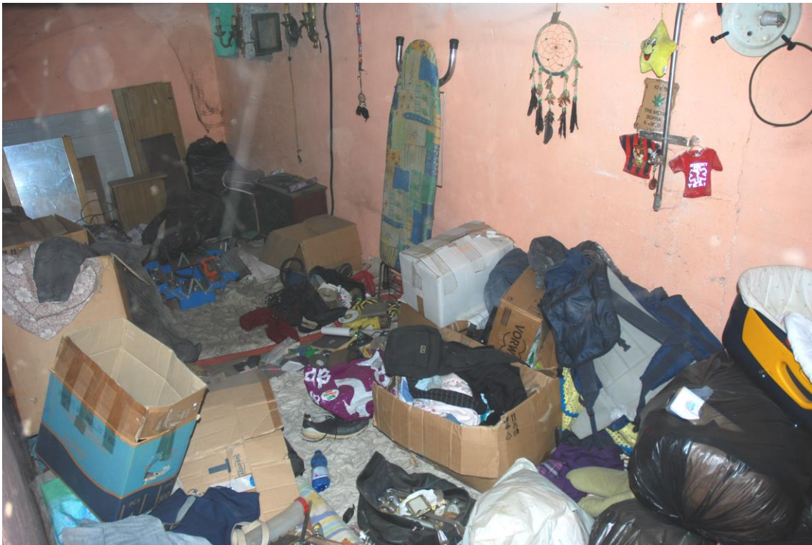
LOCALE CANTINA - PIANO INTERRATO