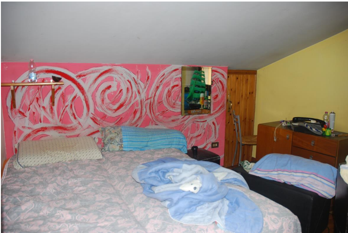
LOCALE SOLAIO – PIANO SECONDO