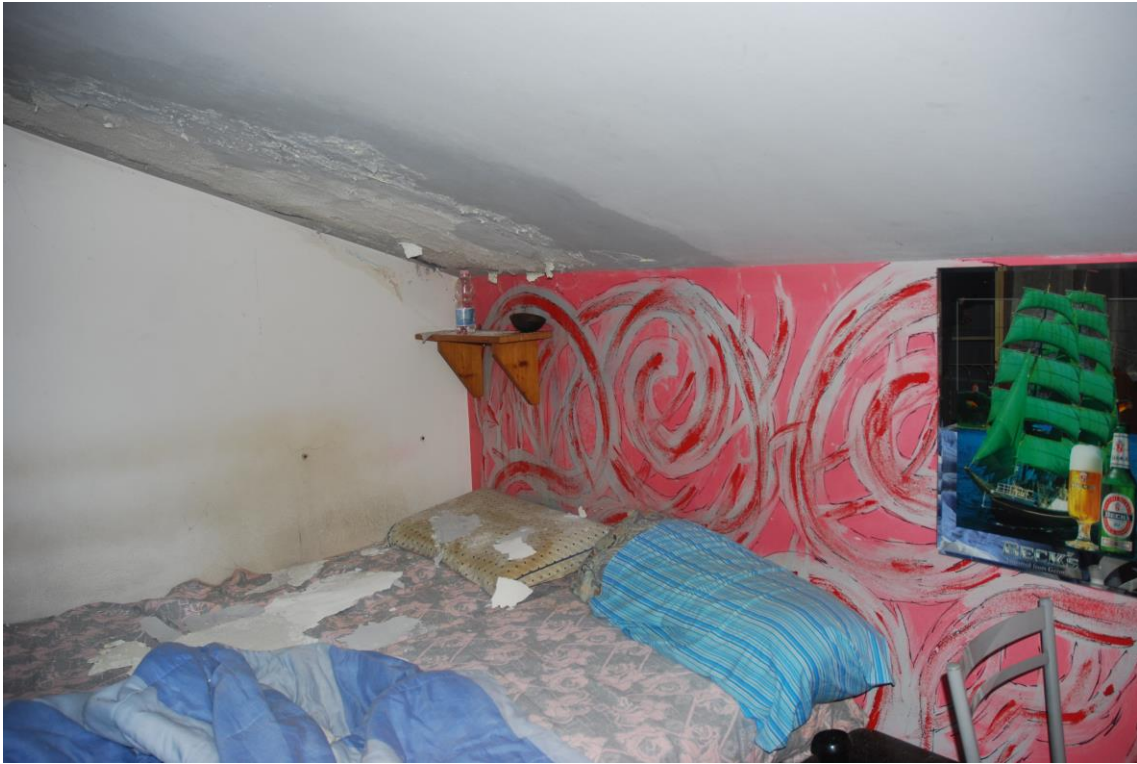
LOCALE SOLAIO – PIANO SECONDO (Si notano infiltrazioni)