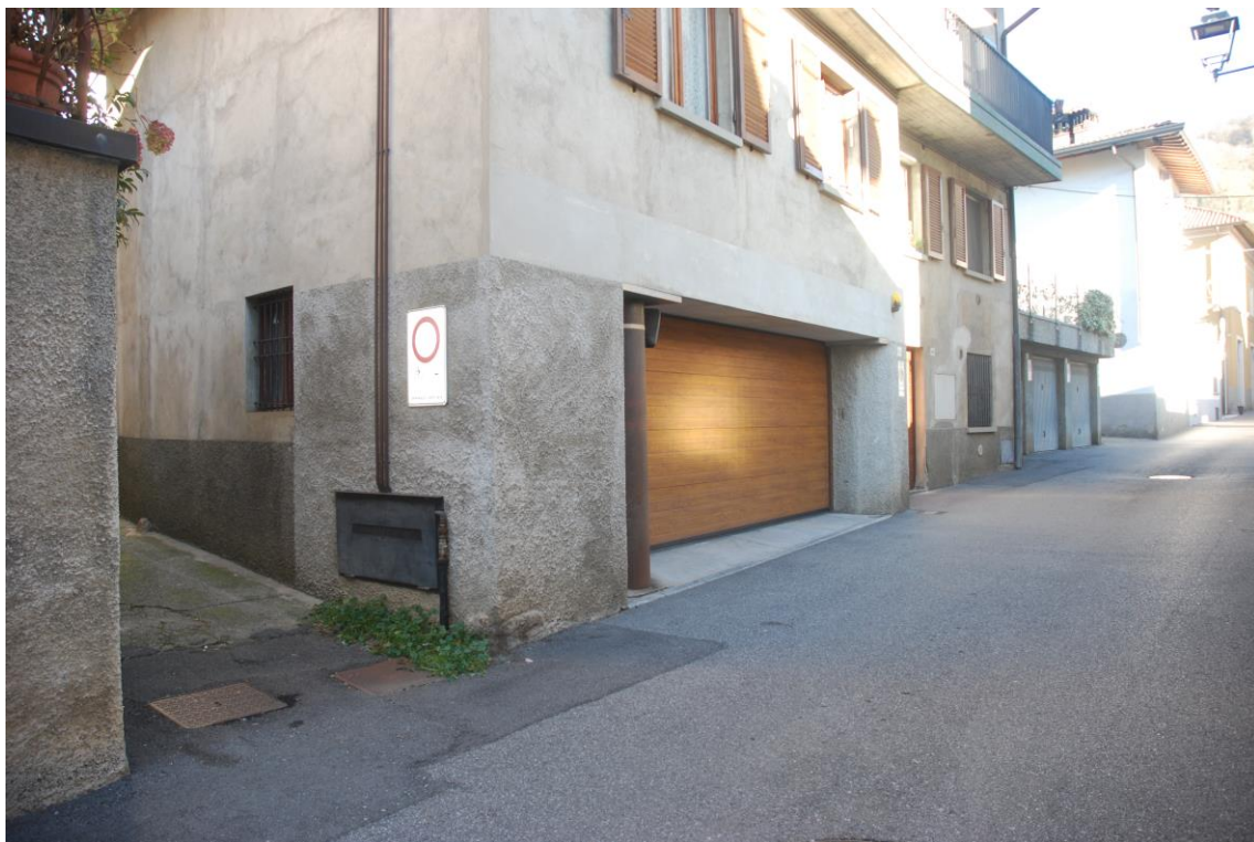
VIA VITTORIO EMANUELE II