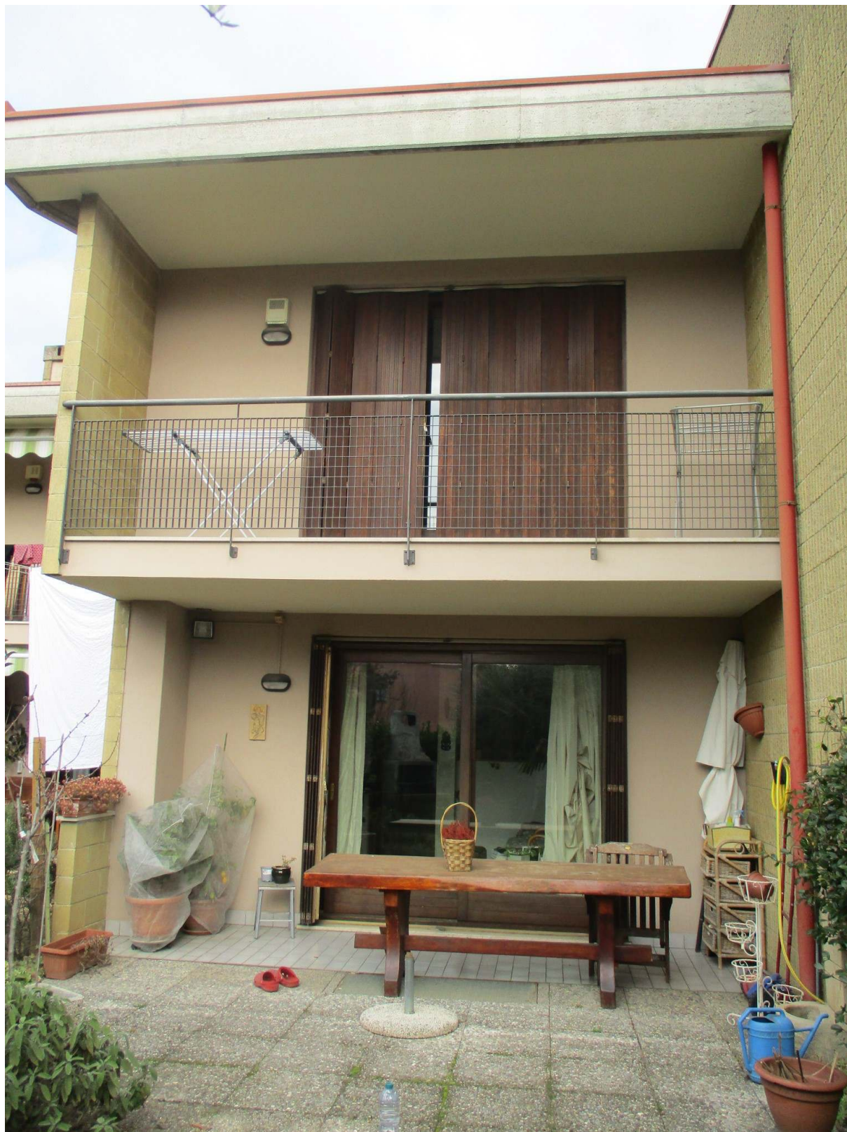
Fig. 10 – Vista della facciata sud dell'edificio oggetto di stima