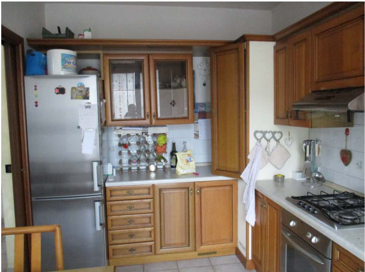
Fig. 19 – Vista della cucina