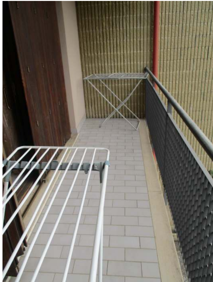
Fig. 25 – Vista del balcone della camera matrimoniale (lato sud)