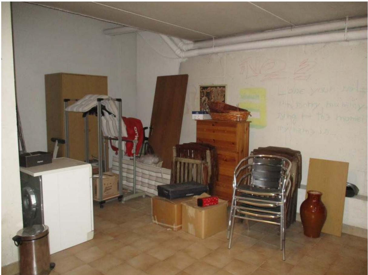
Fig. 36 – Vista della cantina