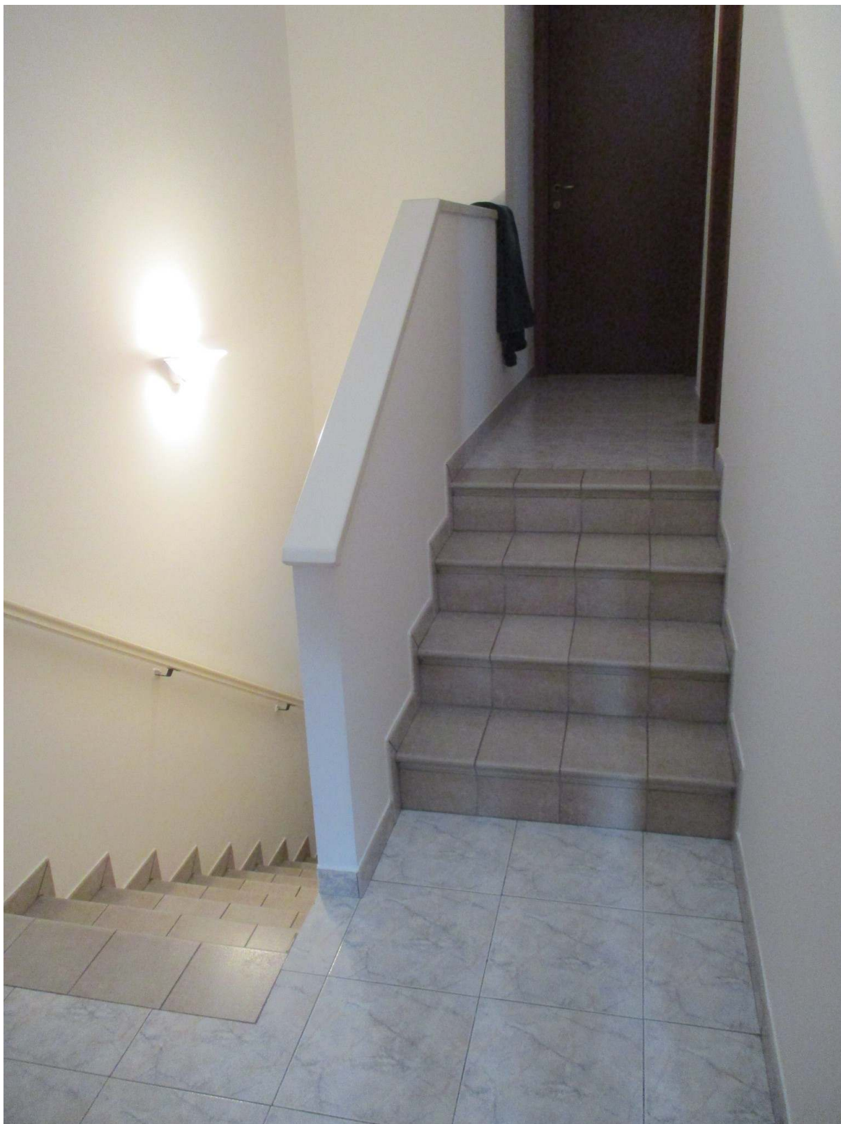
Fig. 26 – Vista del disimpegno al piano primo