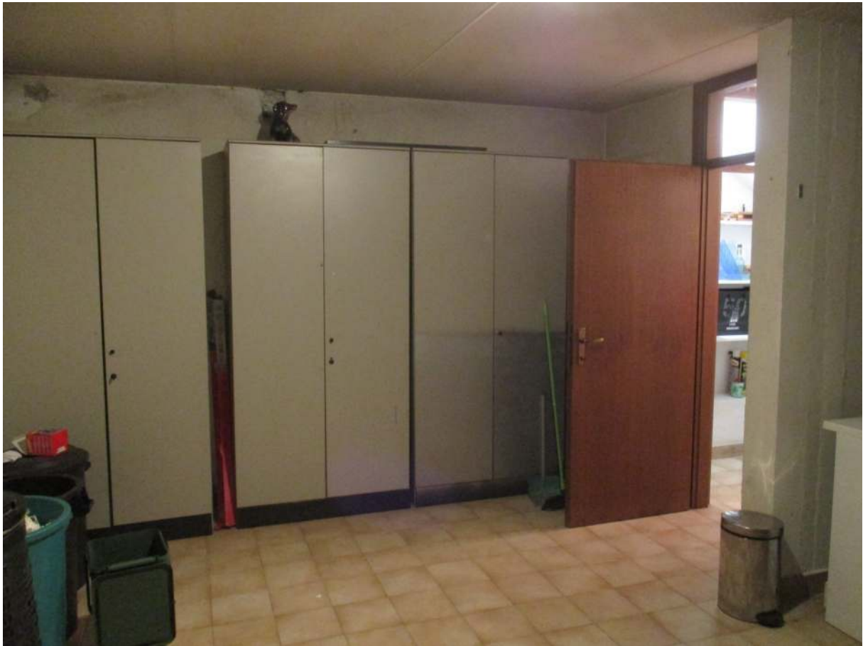
Fig. 35 – Vista della cantina