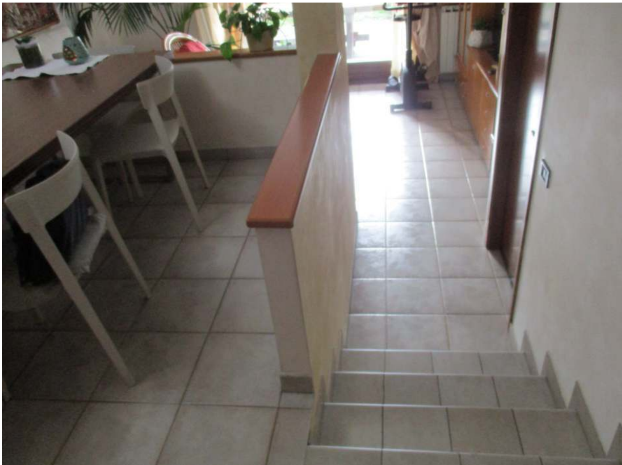
Fig. 15 – Vista della scala che dalla zona pranzo conduce al soggiorno