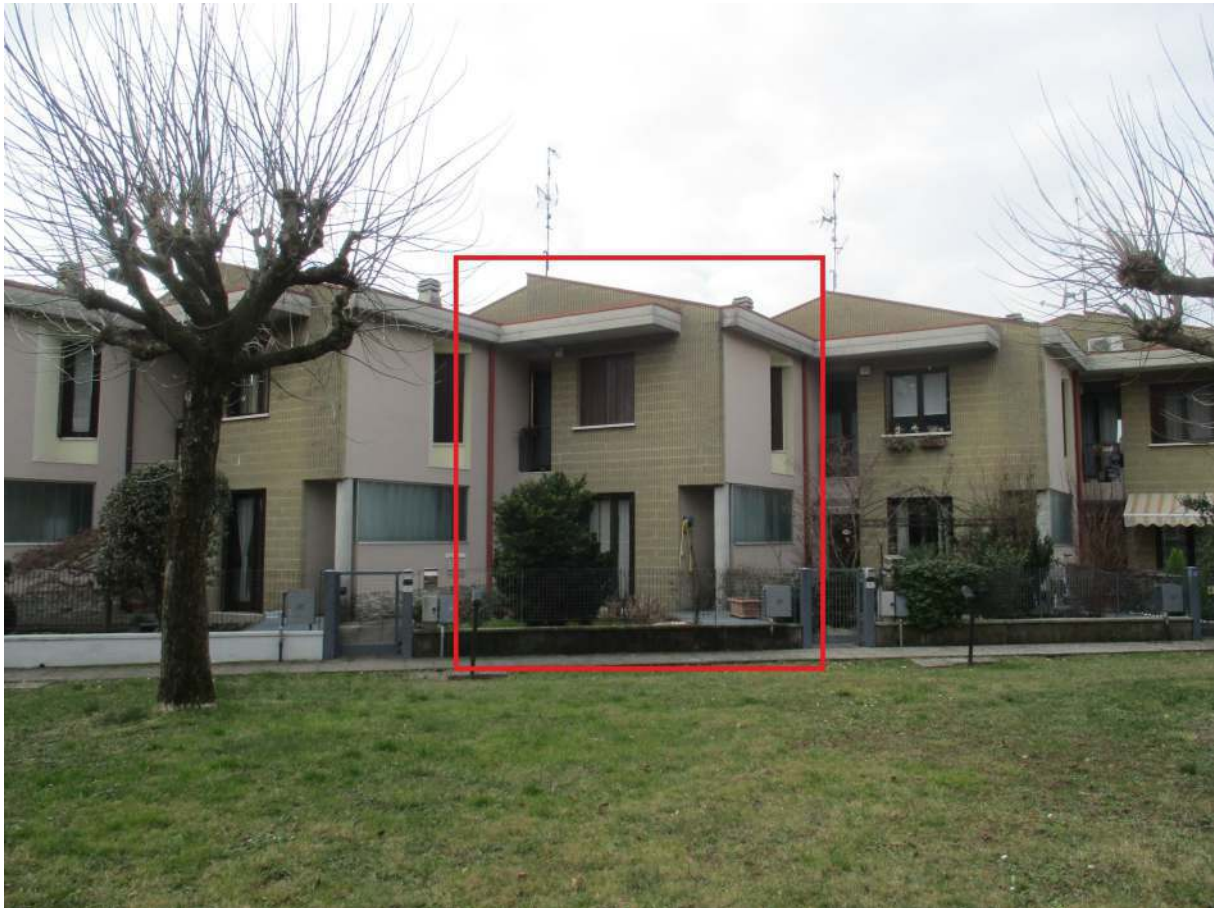
Fig. 5 – Vista d'insieme dell'edificio oggetto di stima dal parco pubblico (angolo nord-est)