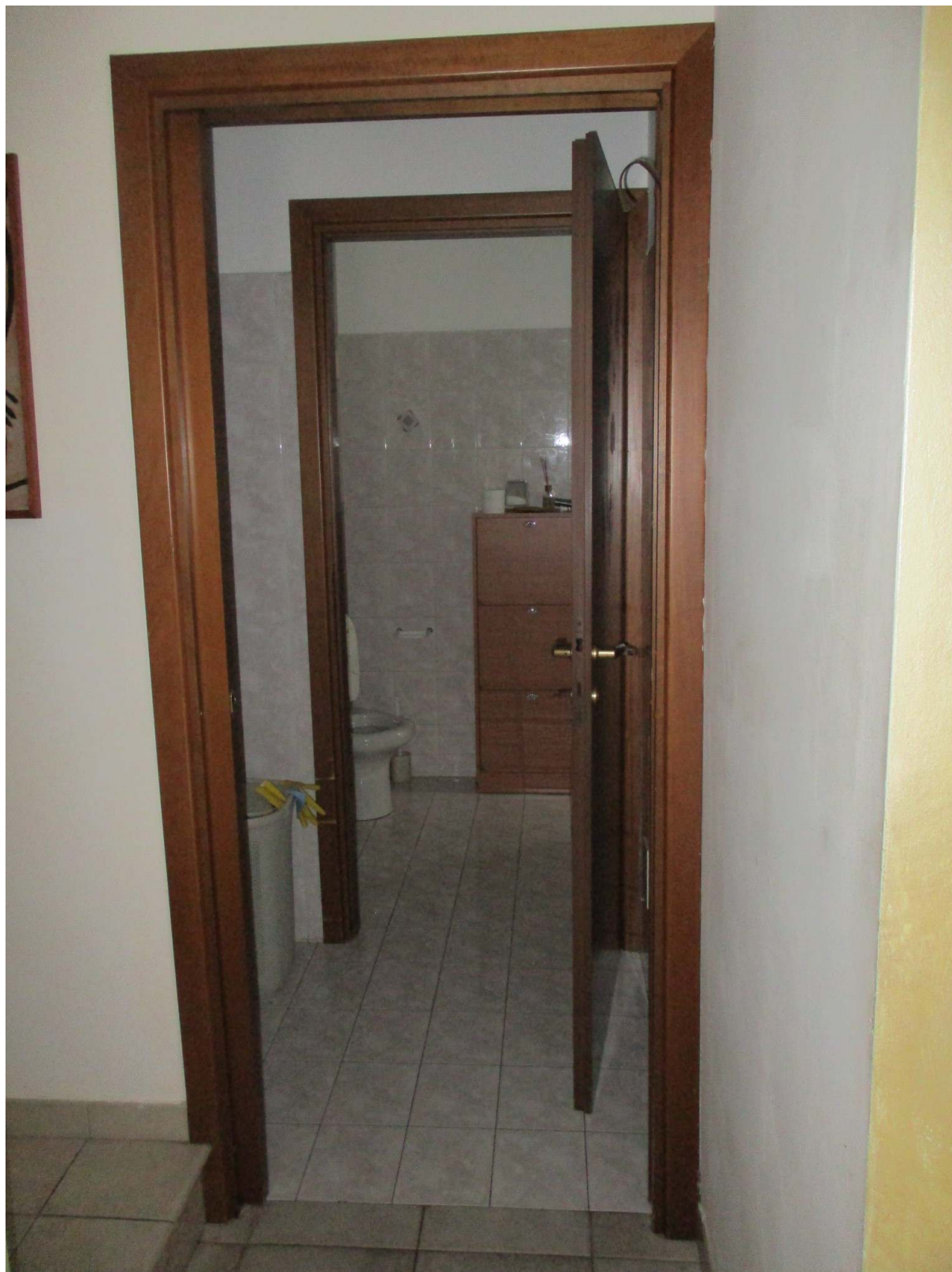
Fig. 20 – Vista dell'antibagno e sullo sfondo il bagno di servizio della zona giorno