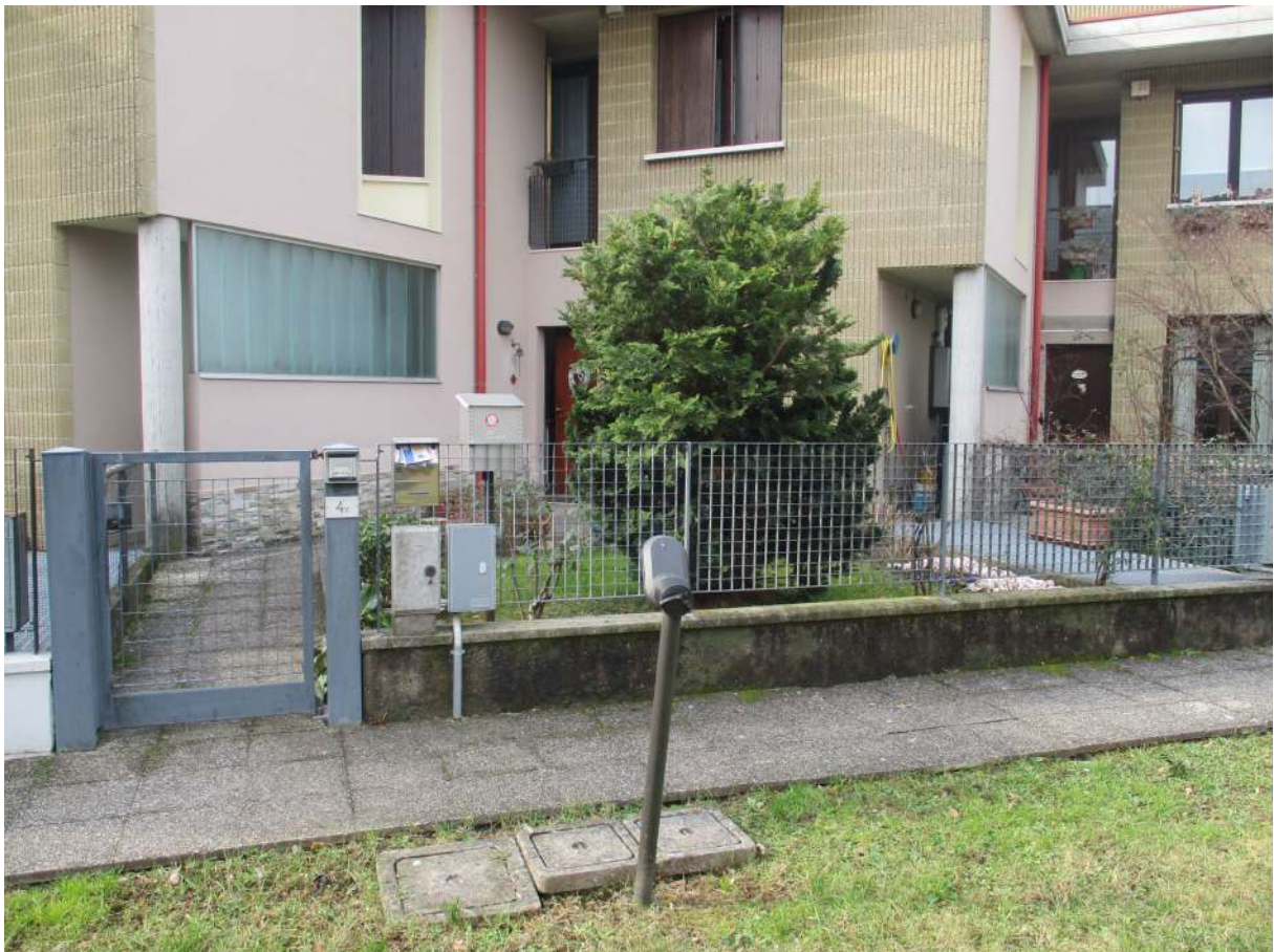
Fig. 6 – Vista dell'accesso pedonale all'immobile oggetto di stima