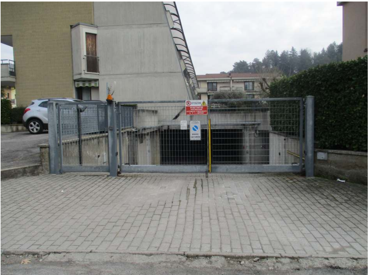
Fig. 12 – Vista del secondo accesso carrabile al complesso da Via Bergamo