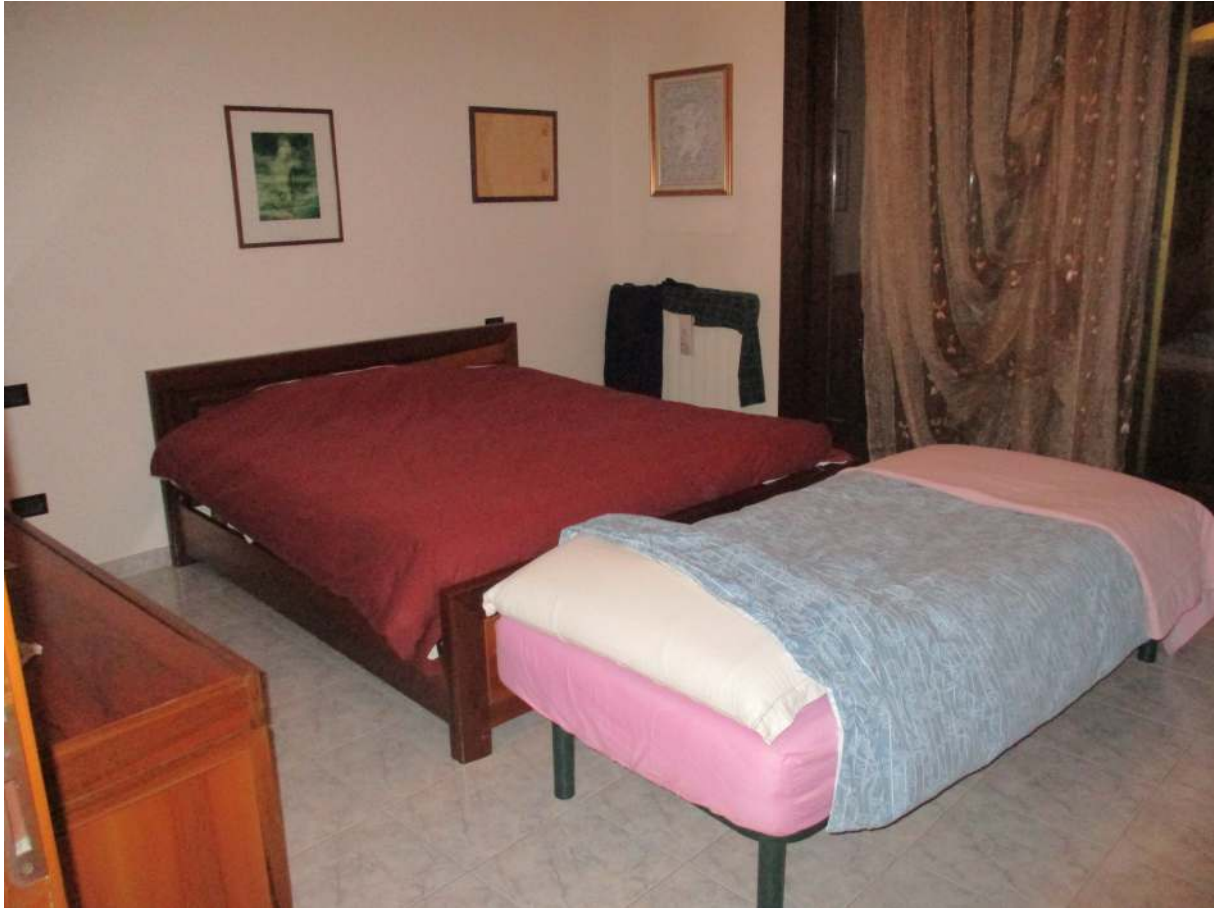
Fig. 24 – Vista della camera matrimoniale (lato sud)