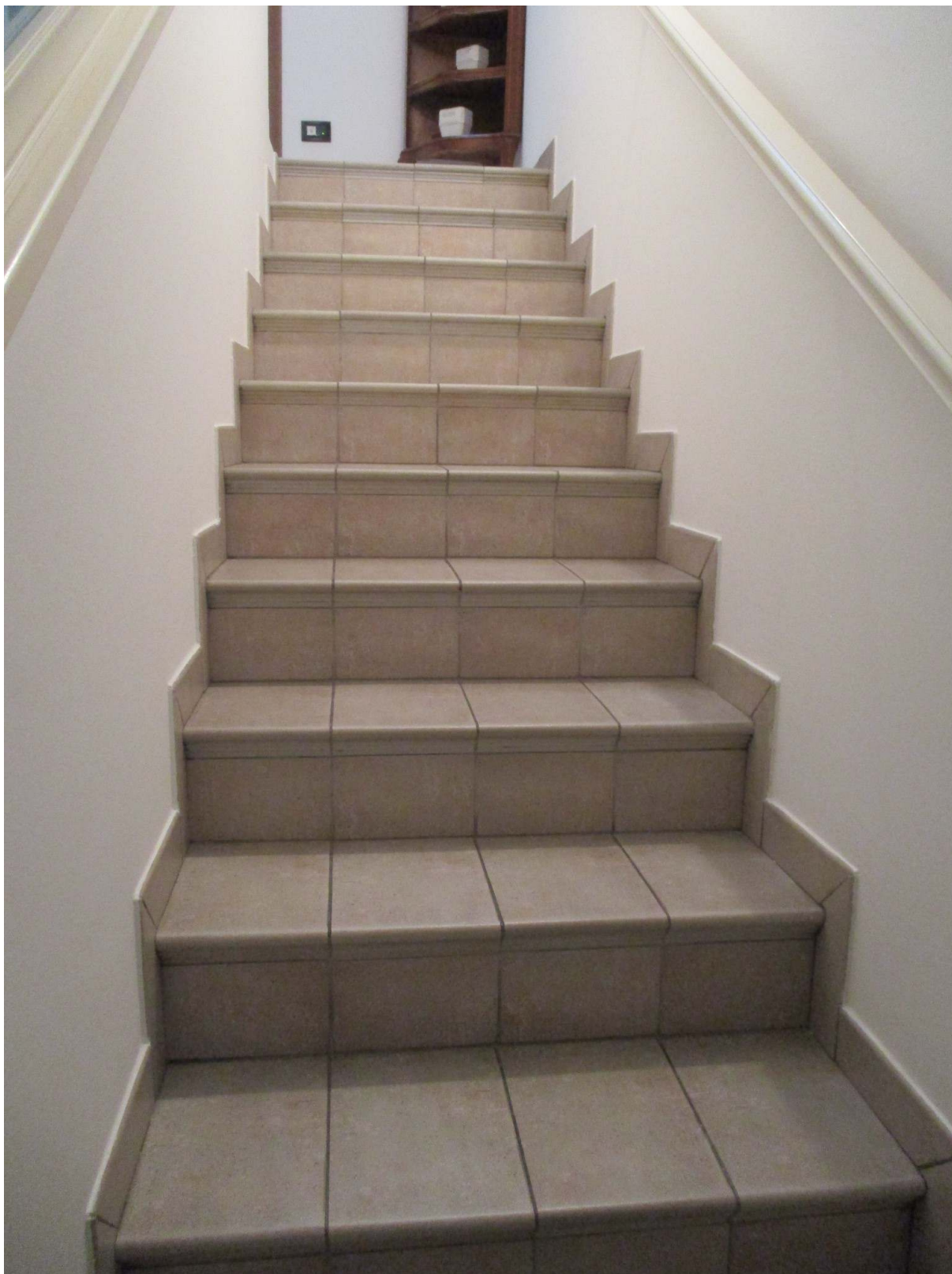
Fig. 23 – Vista della scala che conduce al primo piano