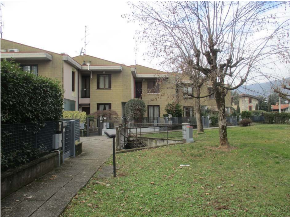
Fig. 4 – Vista del parco pubblico posto sul lato nord-est dell'immobile oggetto di stima