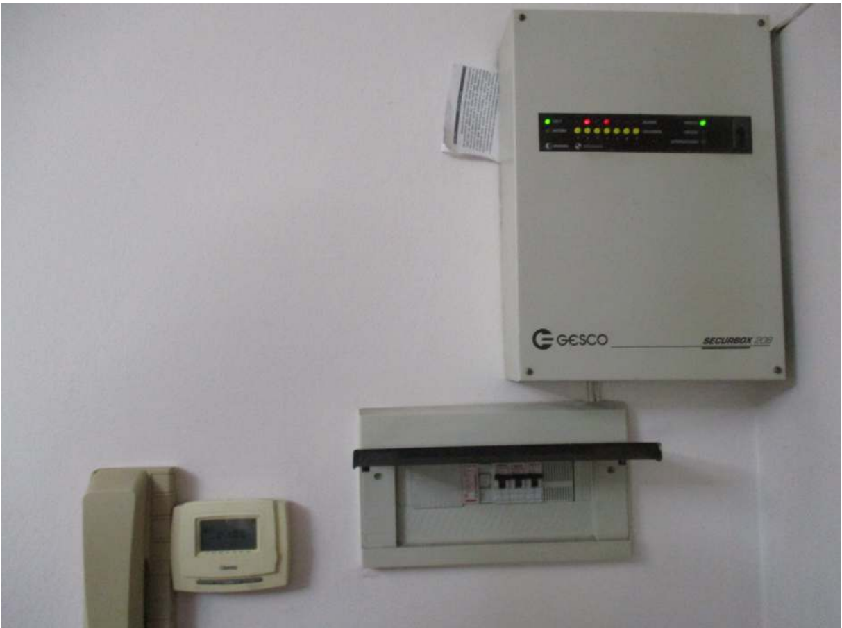
Fig. 42 – Vista del citofono, del termostato, quadro elettrico e dell'allarme installati al P. terra