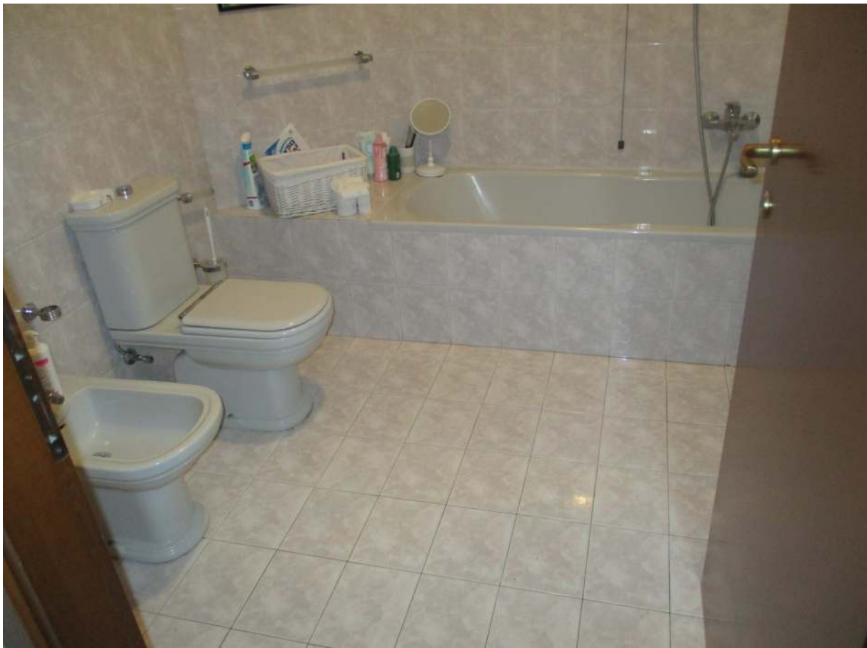
Fig. 30 – Vista del bagno al primo piano (zona sanitari e vasca)