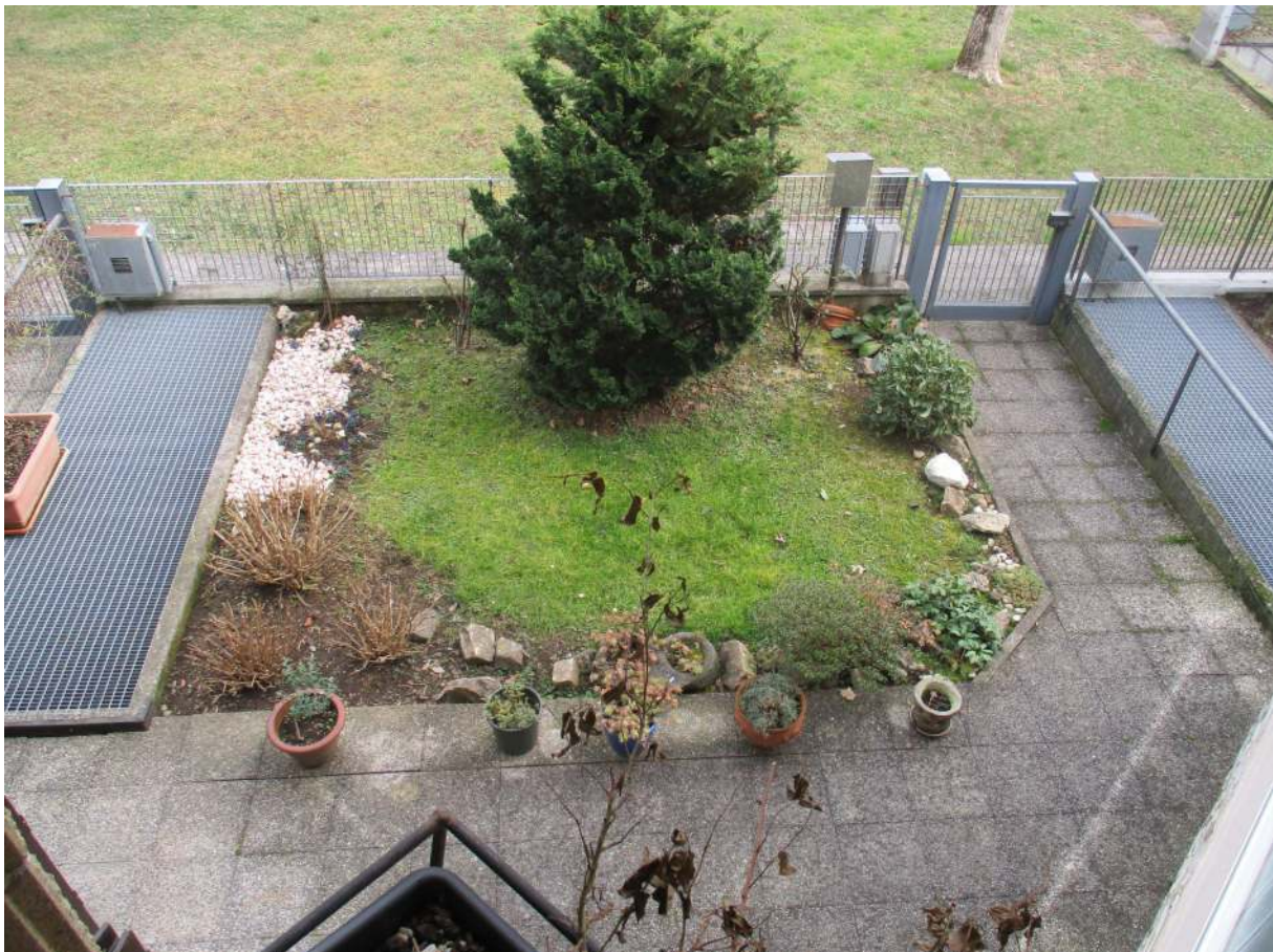
Fig. 9 – Vista dall'alto del giardino/cortile di proprietà esclusiva posto sul lato nord-est