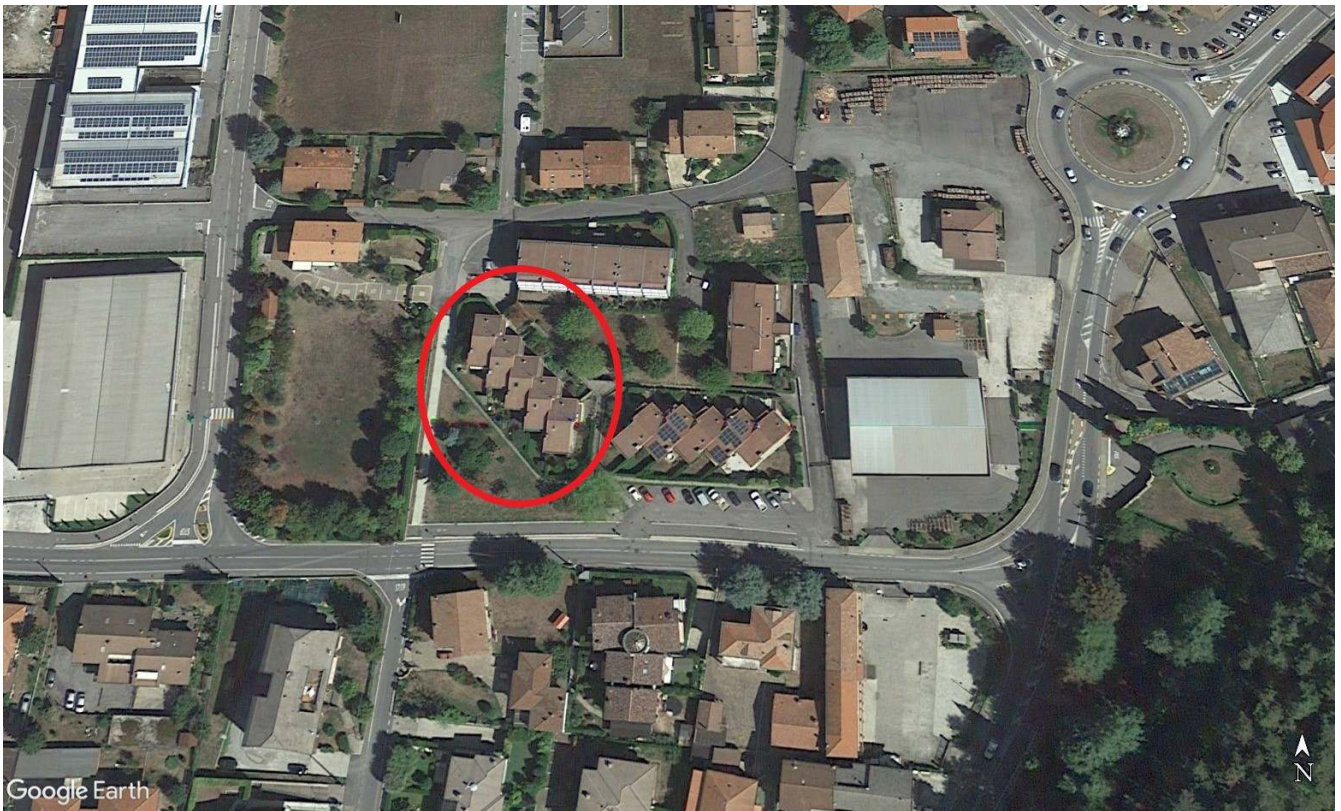
Fig. 1 – Immagine satellitare con il complesso di cui fa parte l'edificio da stimare cerchiato in rosso