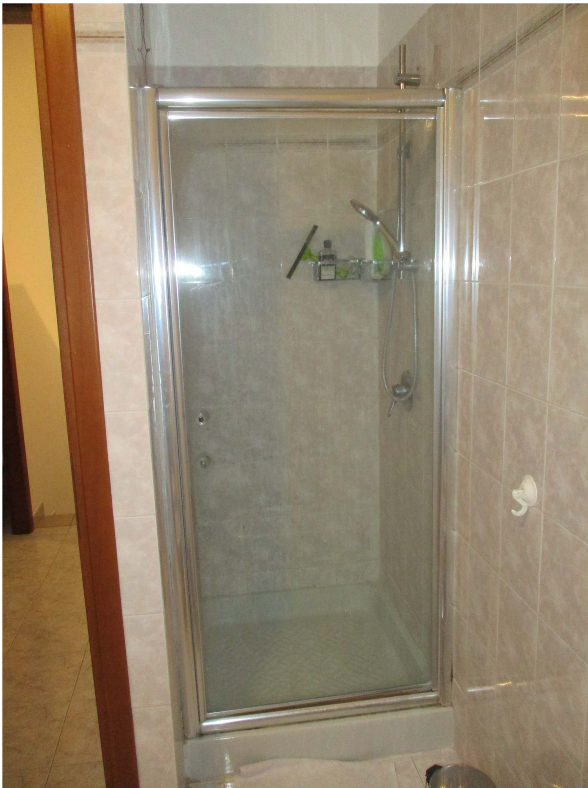
Fig. 31 – Vista della doccia installata nel bagno al primo piano