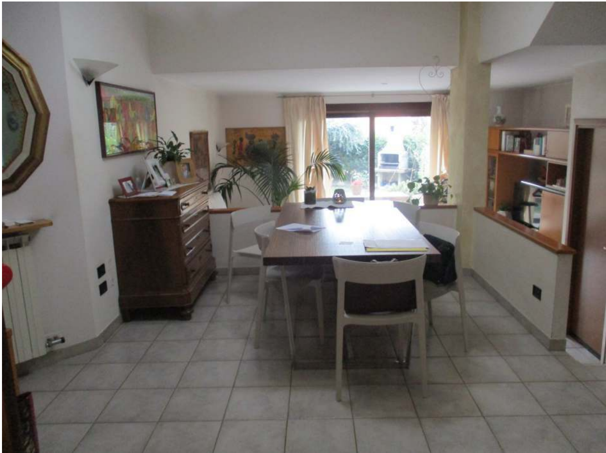
Fig. 14 – Vista d'insieme della zona pranzo