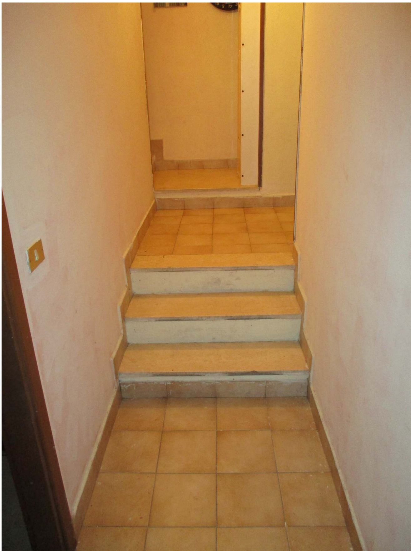
Fig. 33 – Vista del disimpegno al piano interrato