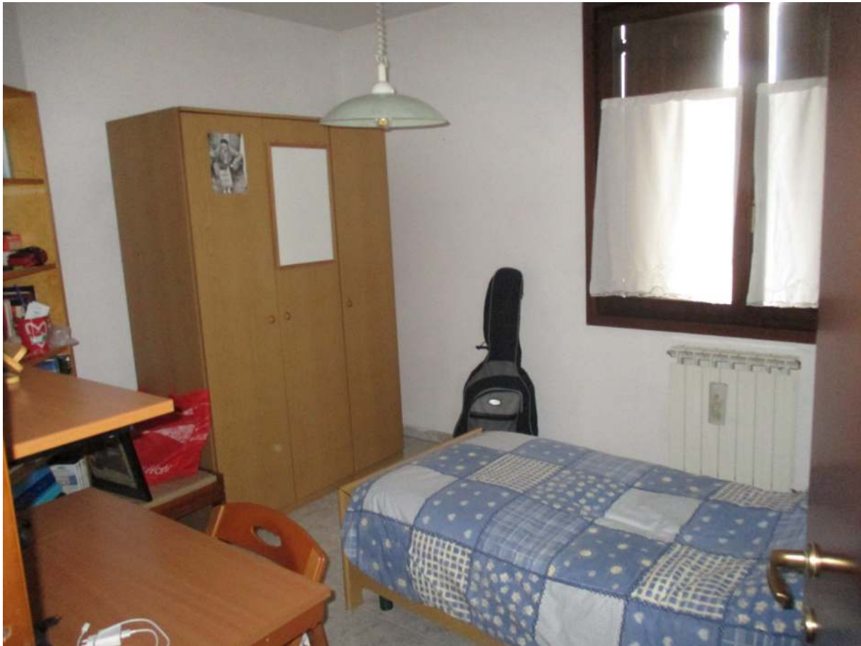
Fig. 29 – Vista della terza camera da letto (angolo nord-est)