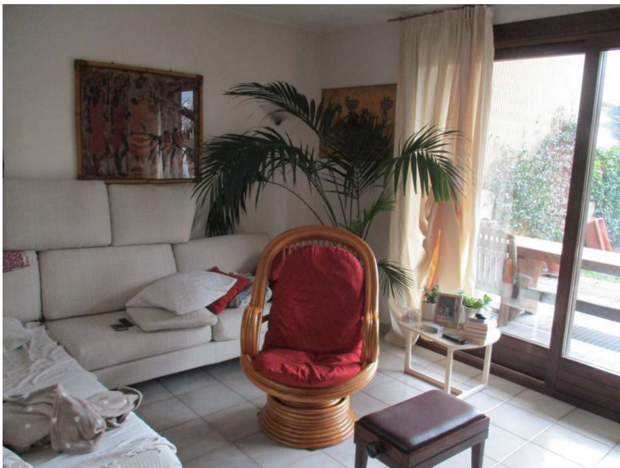
Fig. 17 – Vista del soggiorno