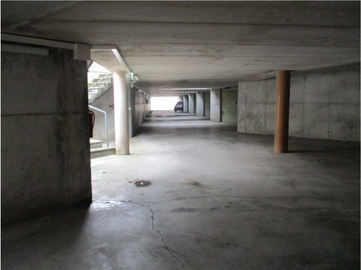
Fig. 39 – Vista del corsello comune (lato verso Via G. Camozzi)