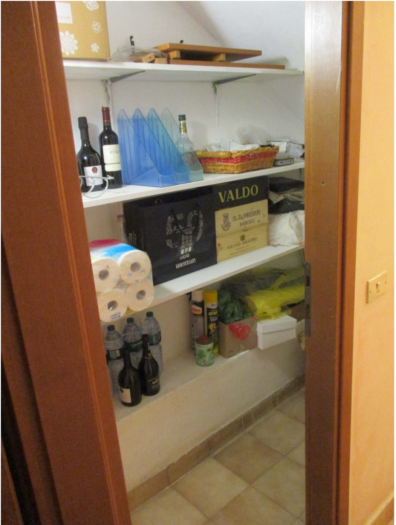
Fig. 34 – Vista del locale sottoscala