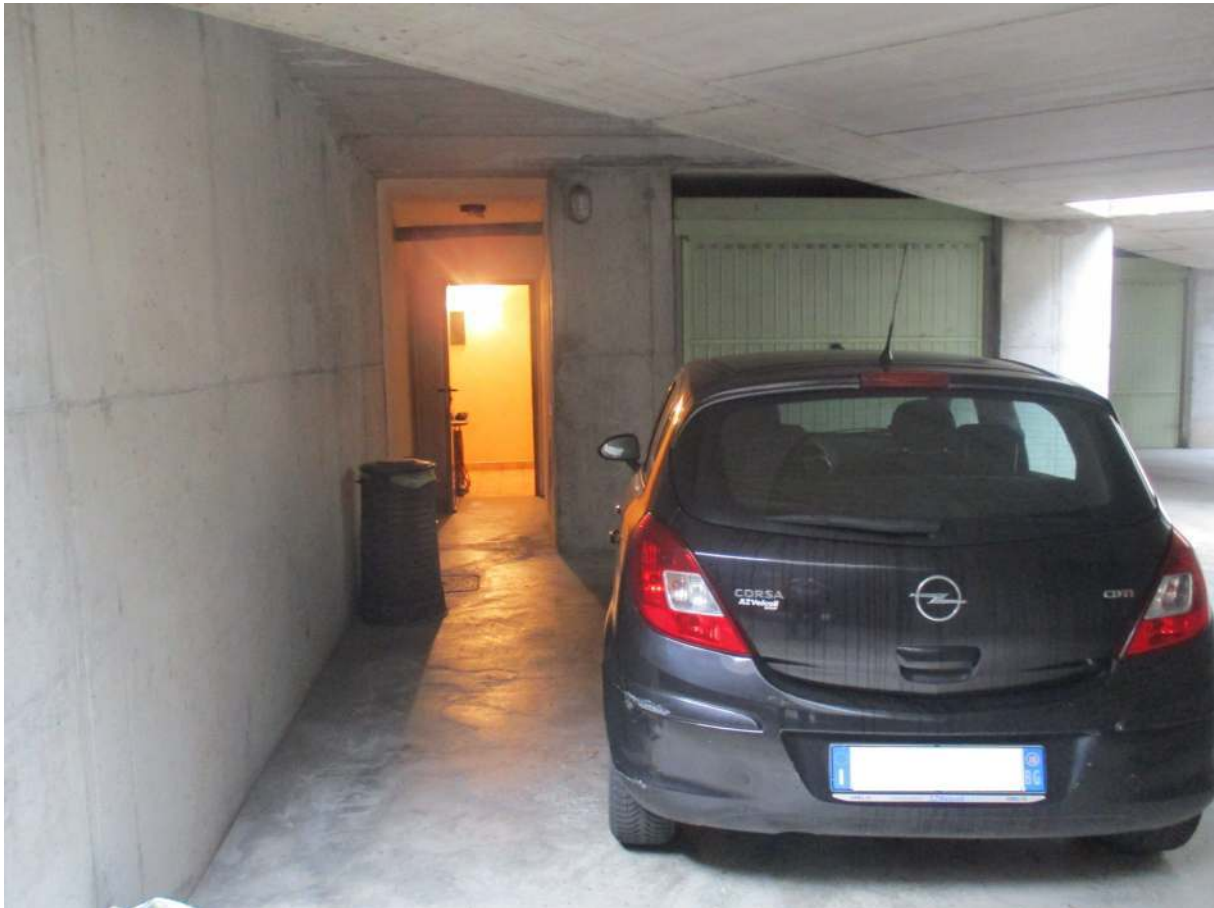
Fig. 37 – Vista del passaggio che dal piano interrato conduce al corsello dei box