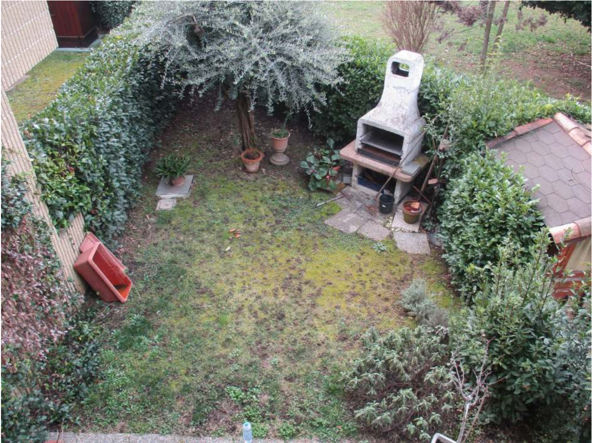
Fig. 11 – Vista dall'alto del giardino di proprietà esclusiva posto sul lato sud