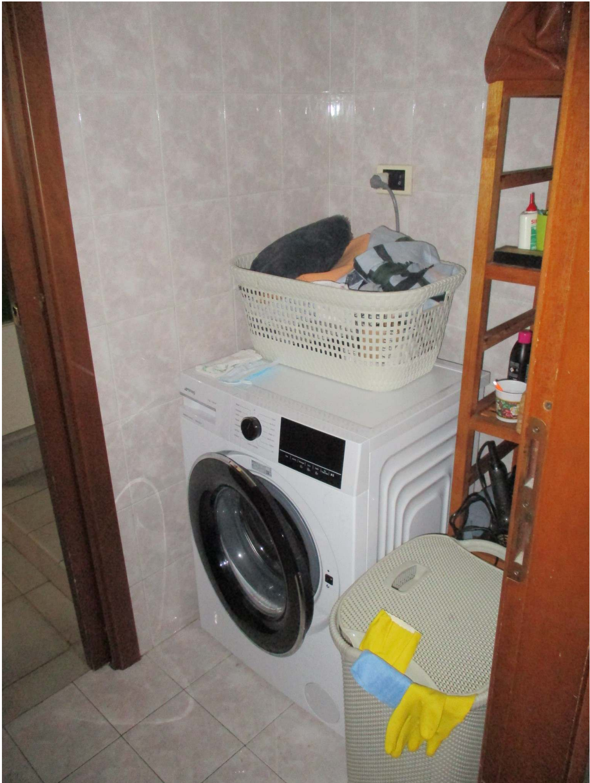
Fig. 21 – Vista dell'antibagno con installata la lavatrice