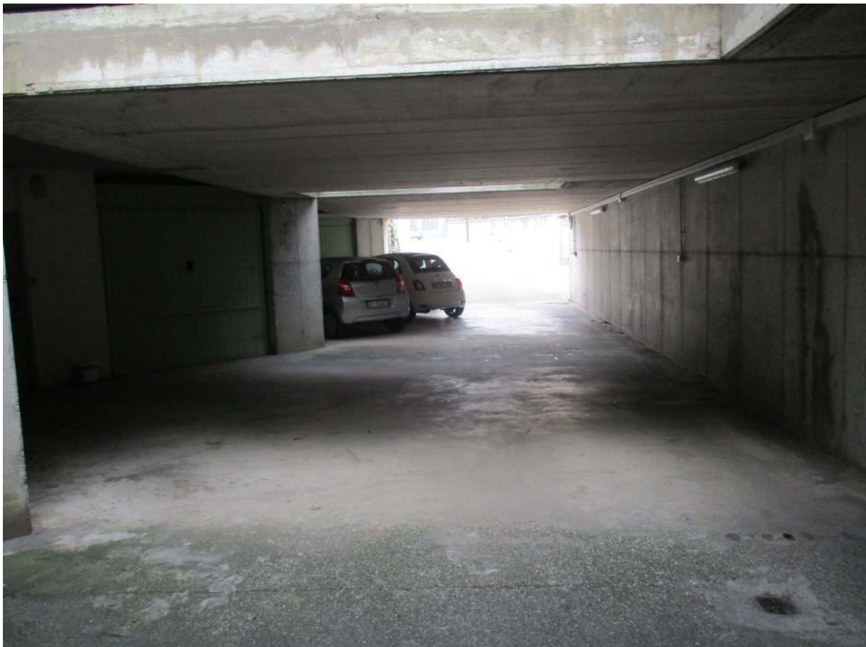
Fig. 38 – Vista del corsello comune (lato verso Via Bergamo)