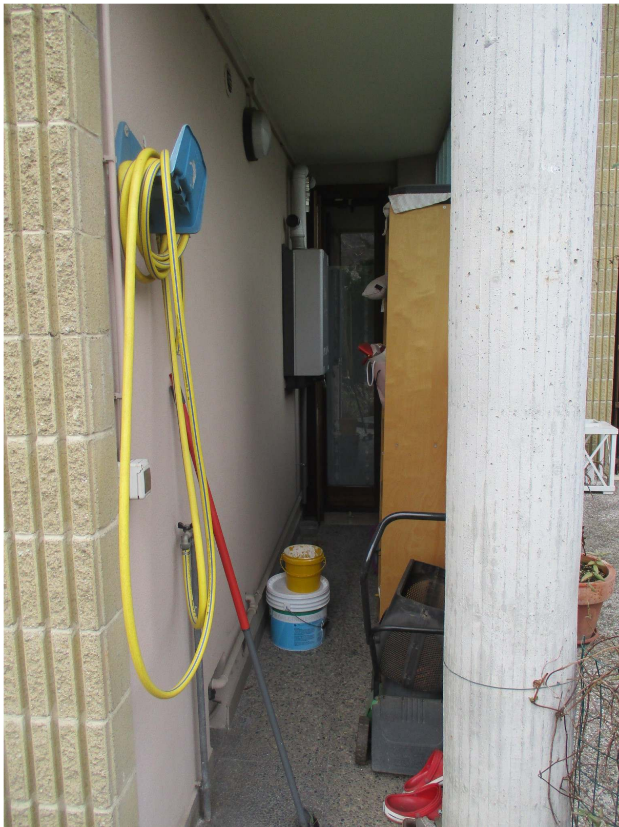
Fig. 43 – Vista della caldaia installata all'esterno del bagno di servizio al P. terra