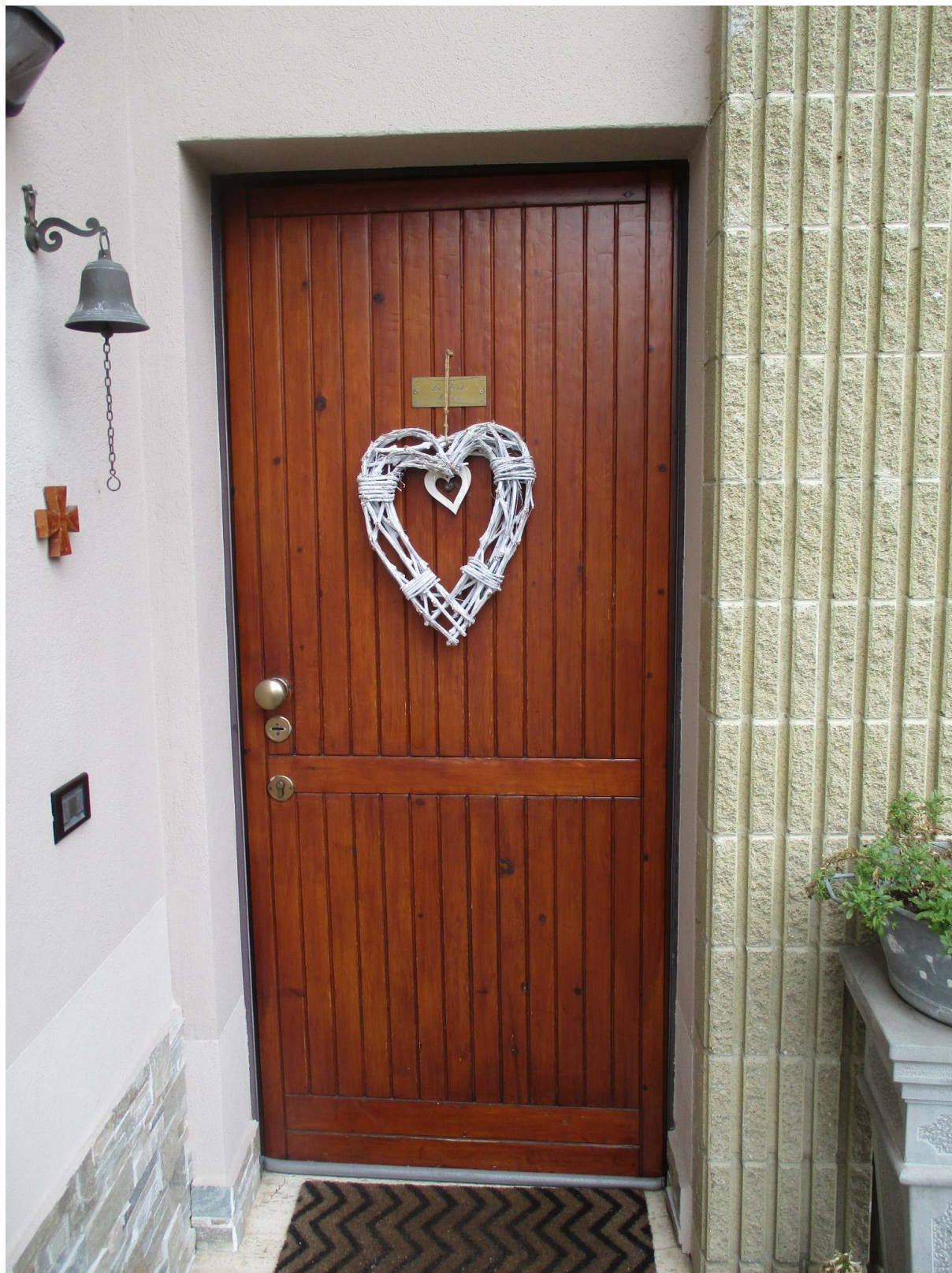
Fig. 13 – Vista del portoncino d'ingresso (lato est)