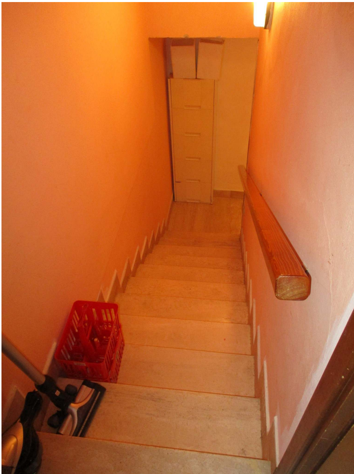
Fig. 32 – Vista della scala che conduce al primo interrato