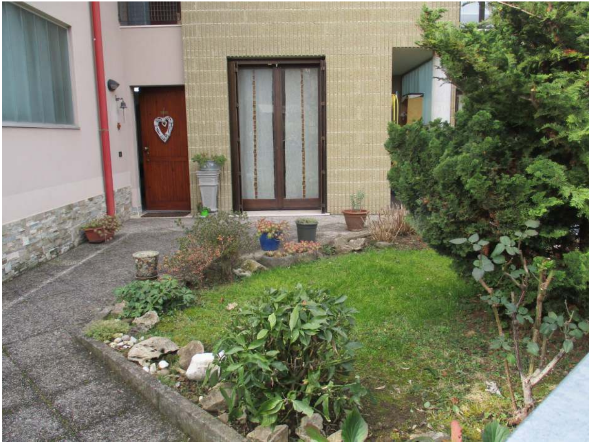
Fig. 8 – Vista del giardino/cortile di proprietà esclusiva posto sul lato nord-est