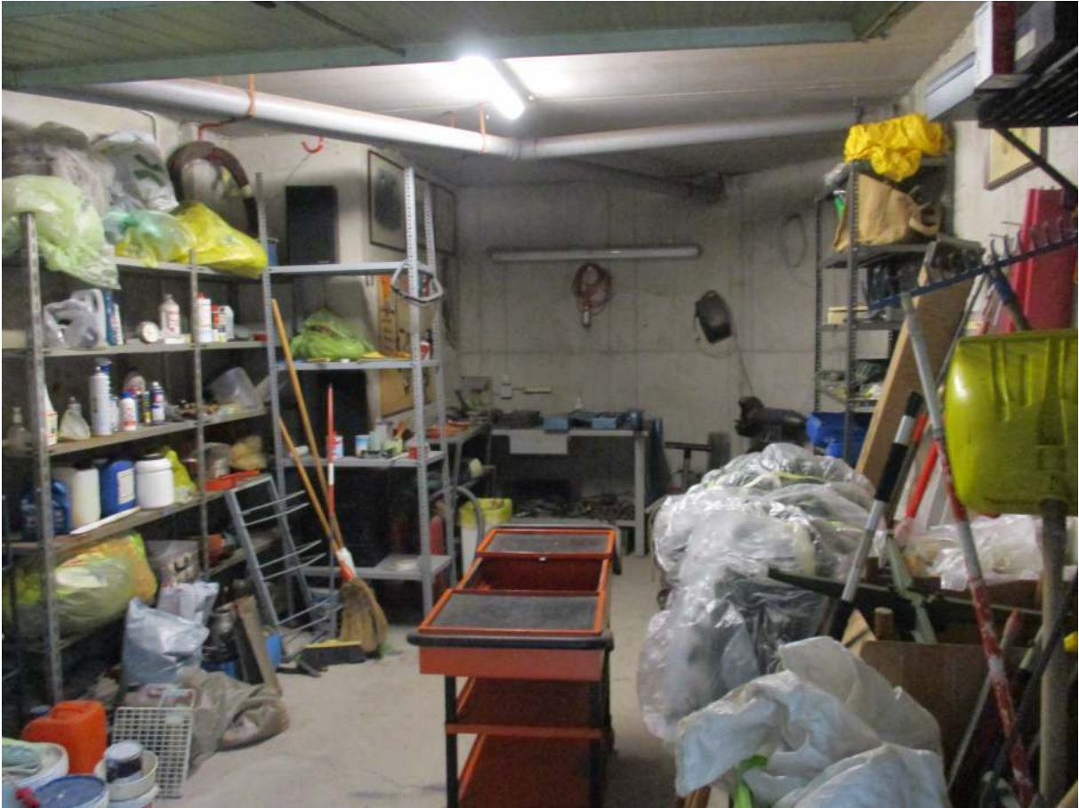
Fig. 41 – Vista interna del box pertinenziale