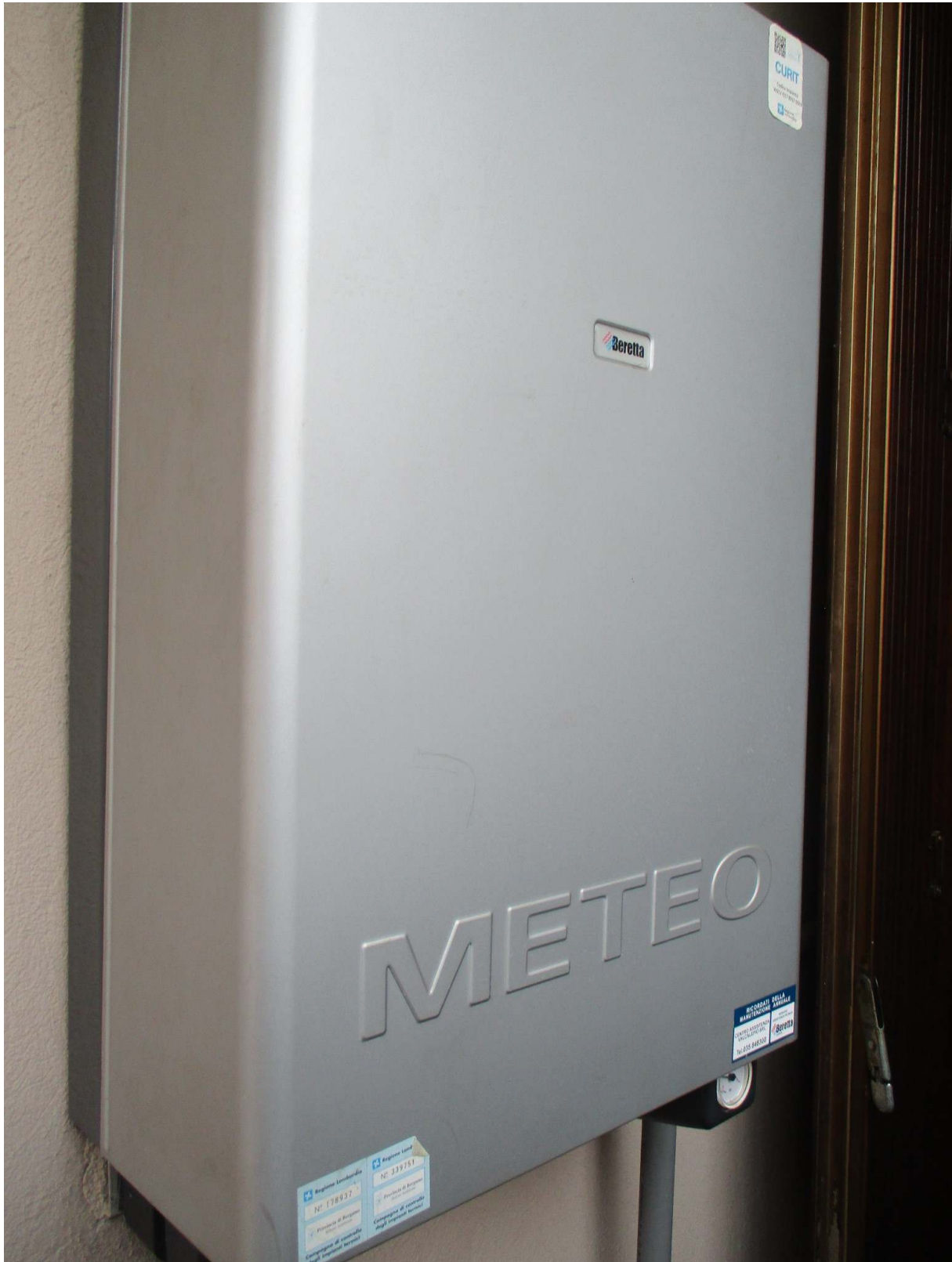
Fig. 44 – Vista della caldaia installata