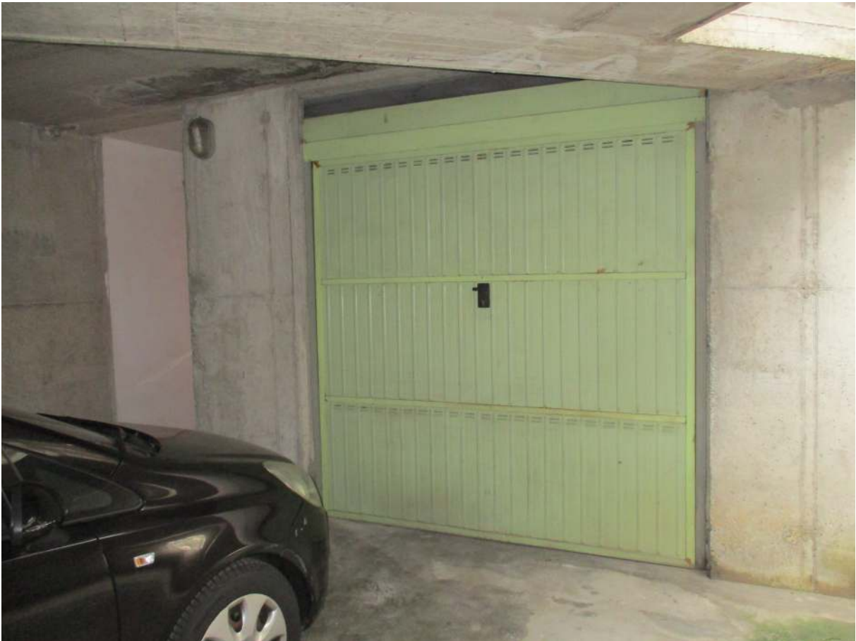
Fig. 40 – Vista della basculante del box pertinenziale all'alloggio oggetto di stima