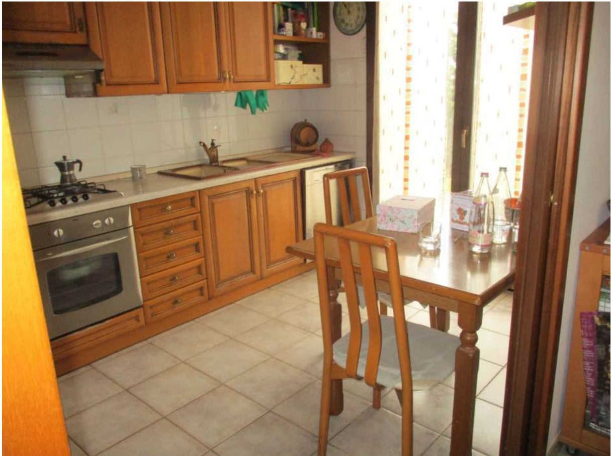
Fig. 18 – Vista della cucina dalla zona pranzo