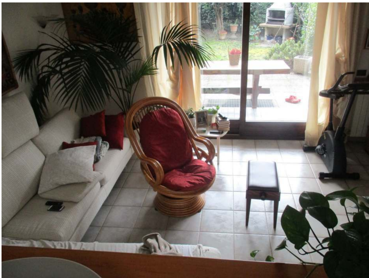
Fig. 16 – Vista del soggiorno con accesso al giardino esclusivo sul lato sud