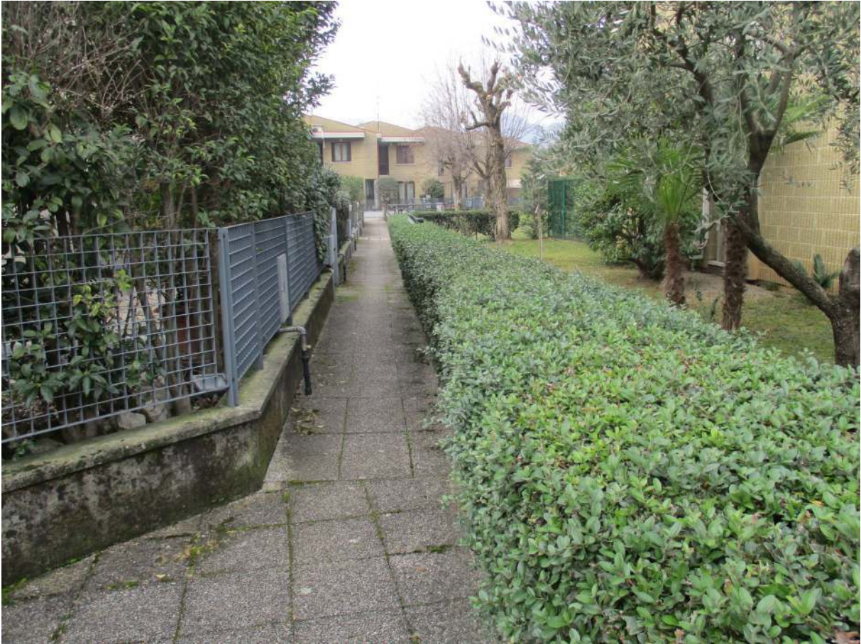
Fig. 3 – Vista del vialetto pedonale pubblico che conduce all'immobile oggetto di stima