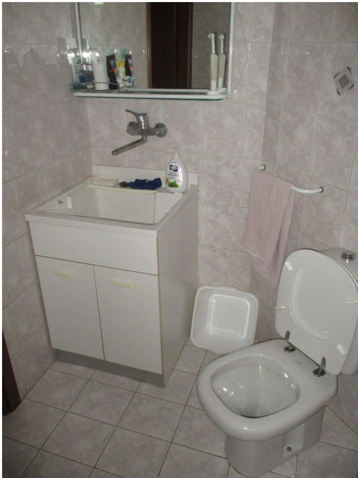
Fig. 22 – Vista del bagno di servizio della zona giorno