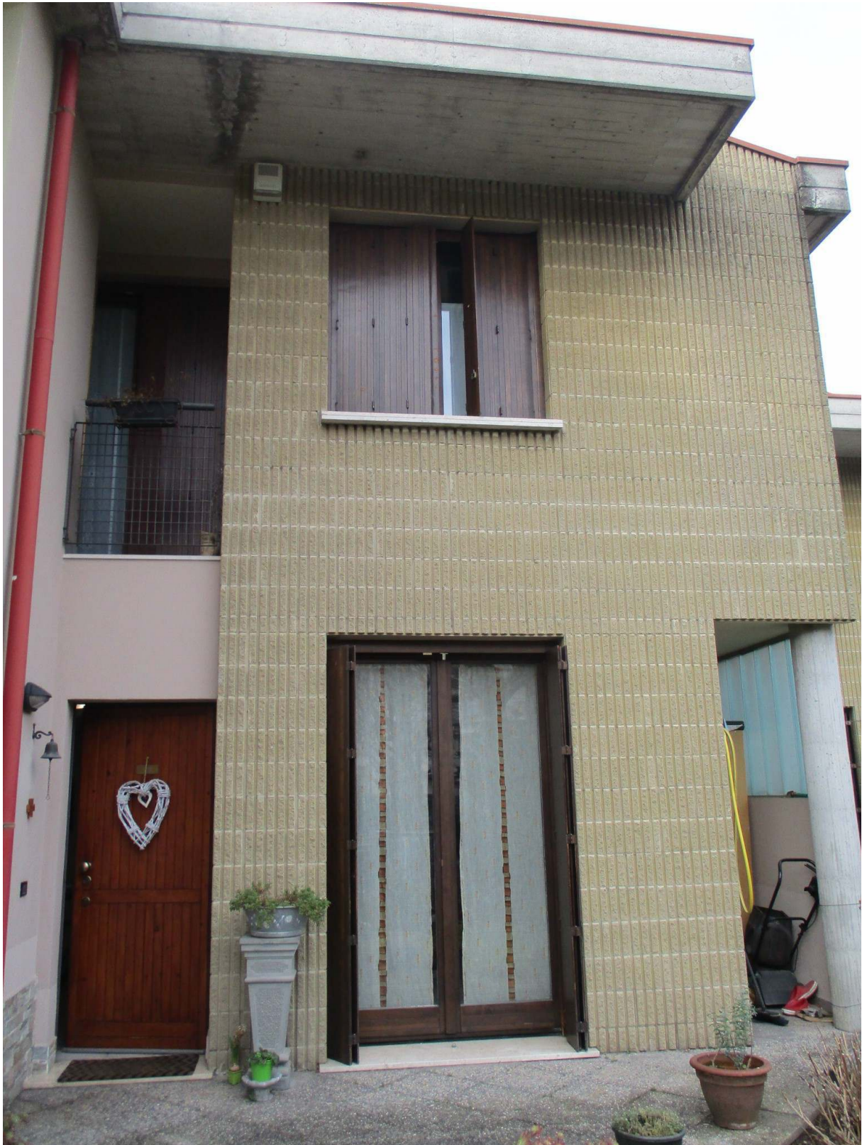
Fig. 7 – Vista della facciata est dell'edificio oggetto di stima (lato ingresso)