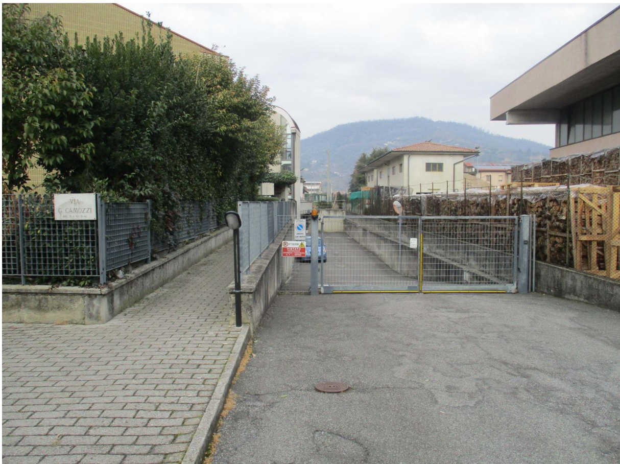
Fig. 2 – Vista del vialetto pedonale pubblico e dell'accesso carrale al complesso da Via Camozzi