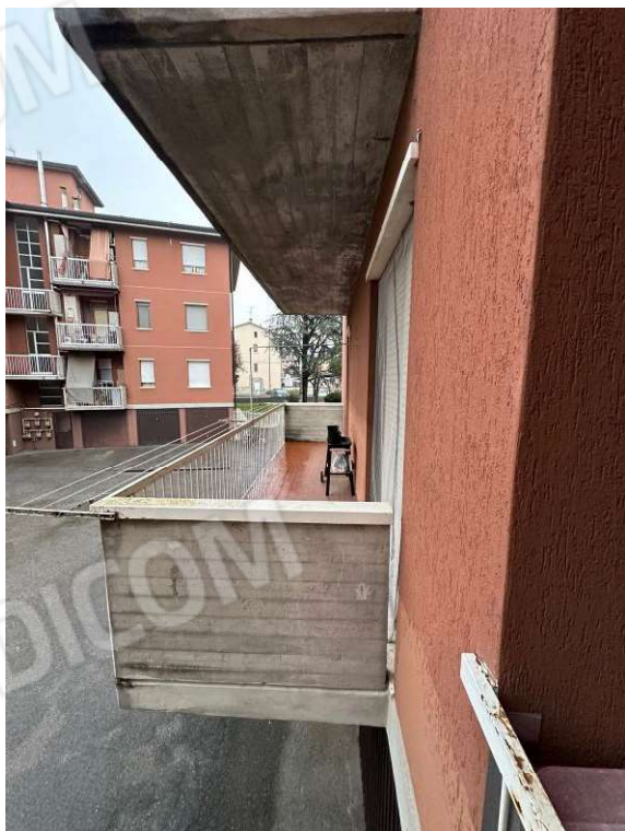
Fotografia n. 18: balcone 1