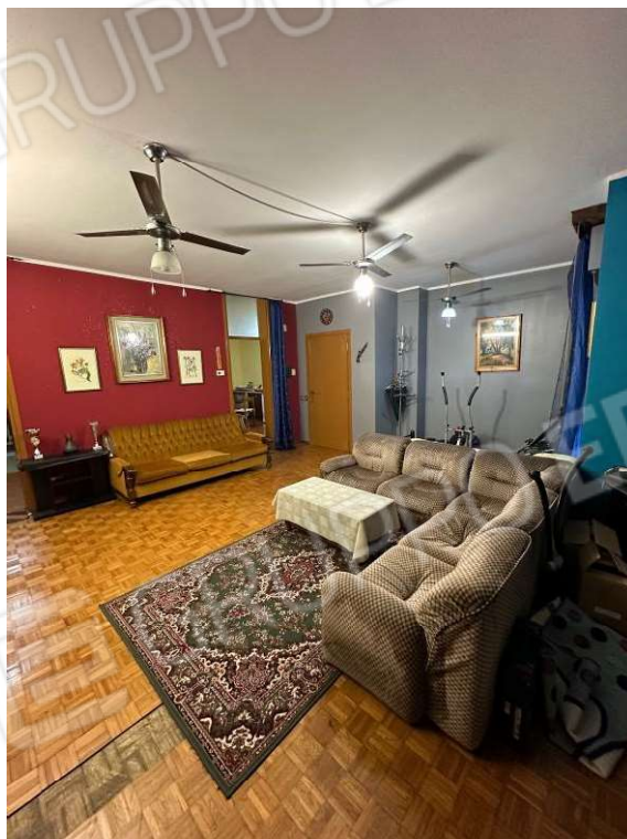
Fotografia n. 5: soggiorno