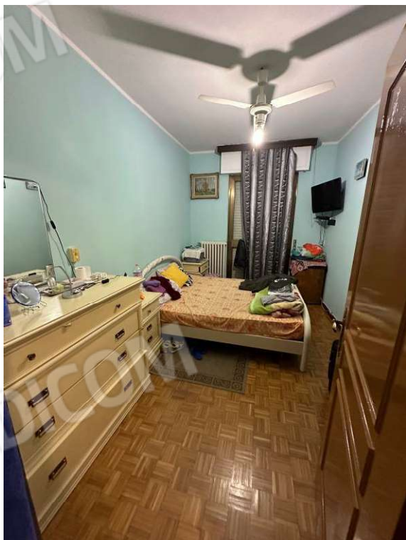
Fotografia n. 14: camera 1