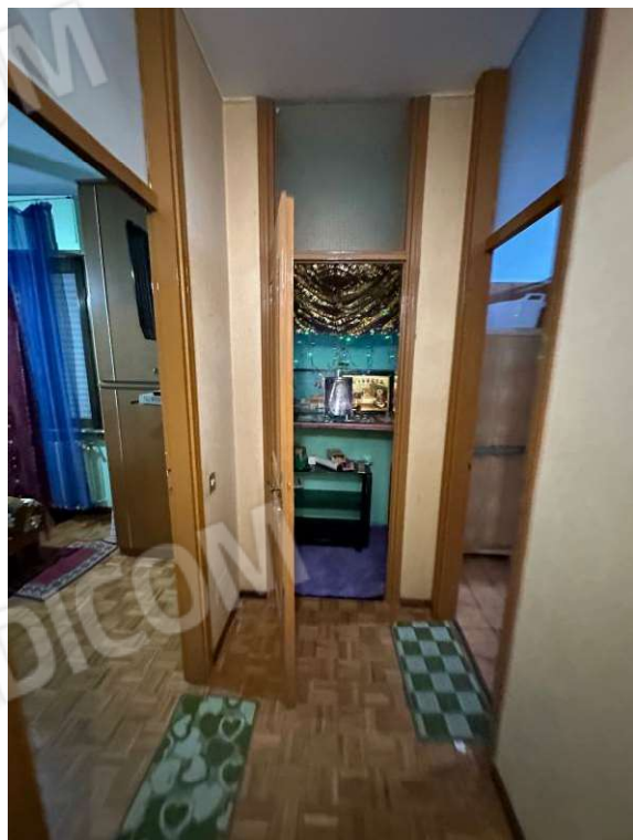
Fotografia n. 10: ripostiglio