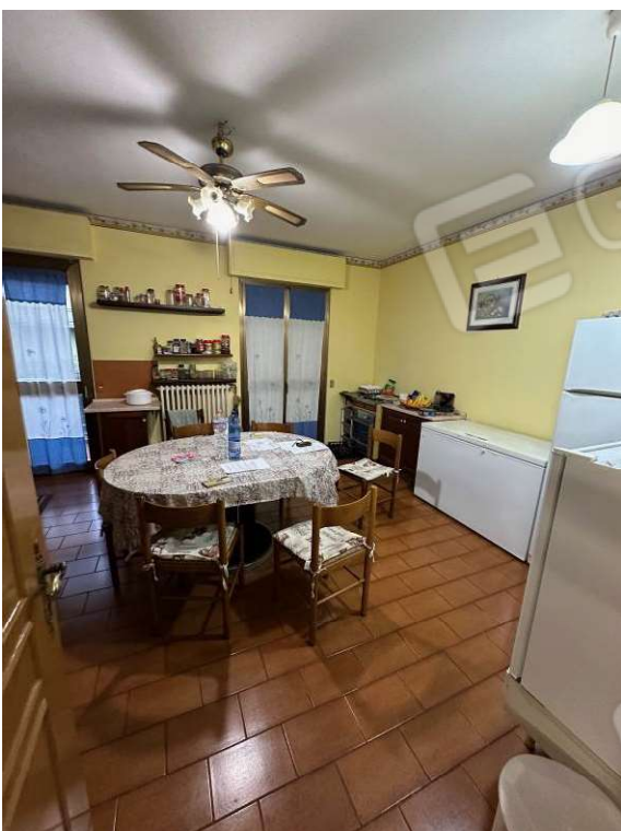
Fotografia n. 8: cucina