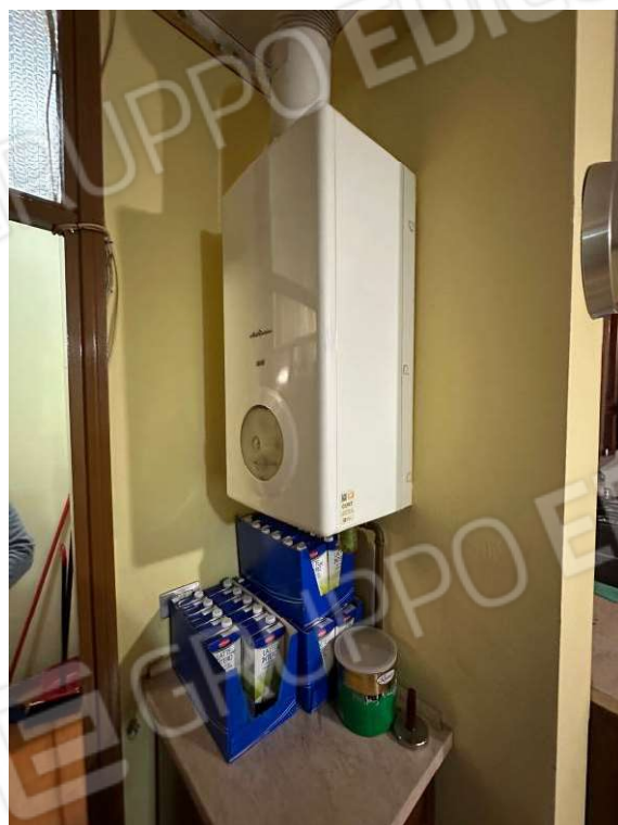
Fotografia n. 9: caldaia