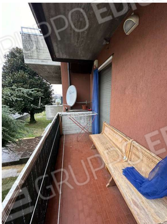
Fotografia n. 21: balcone 4