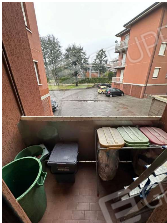
Fotografia n. 19: balcone 2