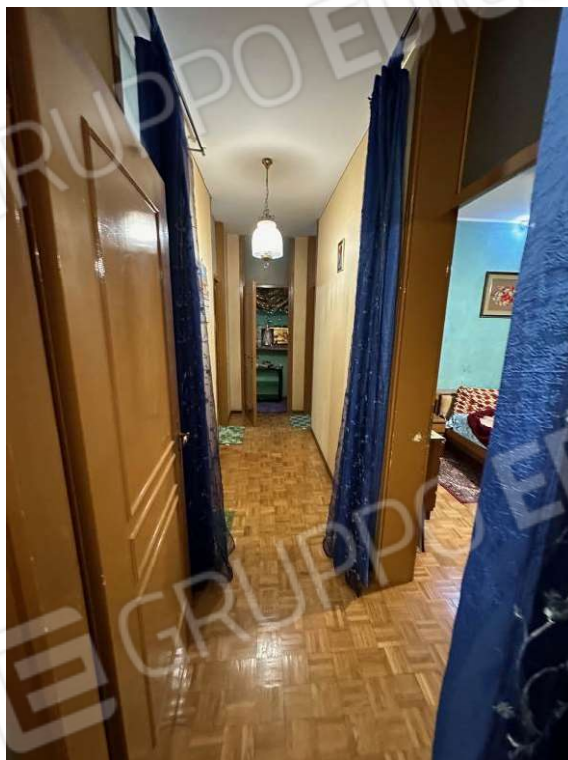
Fotografia n. 17: disimpegno