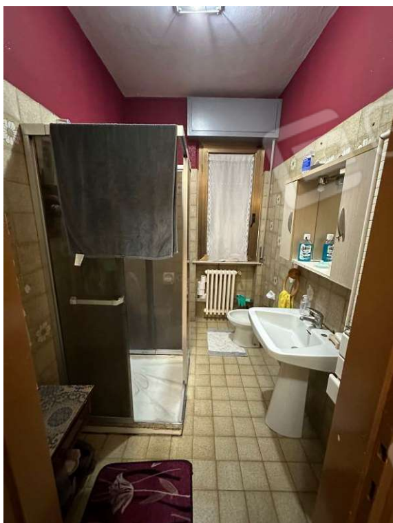
Fotografia n. 12: bagno 1