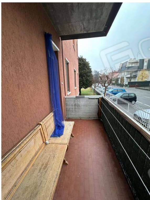
Fotografia n. 20: balcone 3