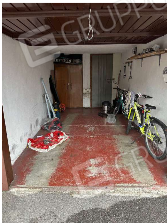
Fotografia n. 24: box