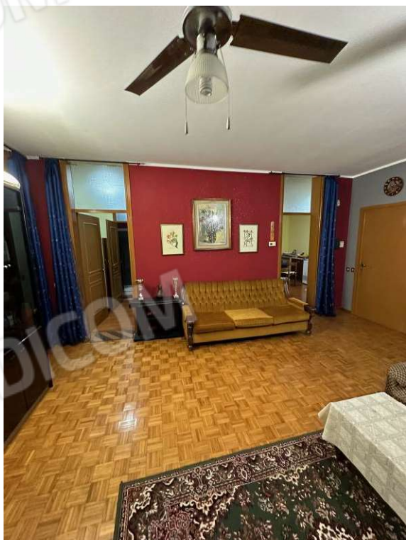
Fotografia n. 6: soggiorno