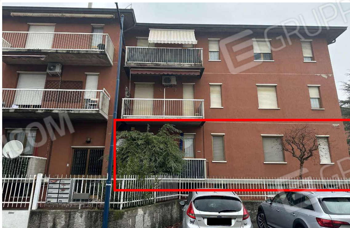
Fotografia n. 3: esterno