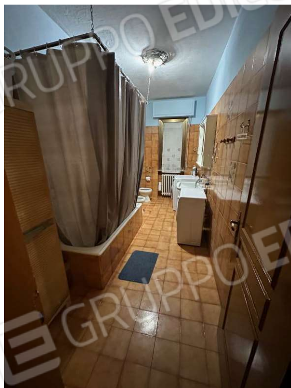
Fotografia n. 13: bagno 2