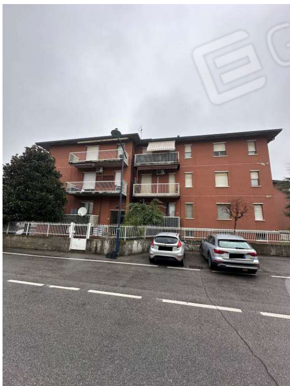
Fotografia n. 1: esterno