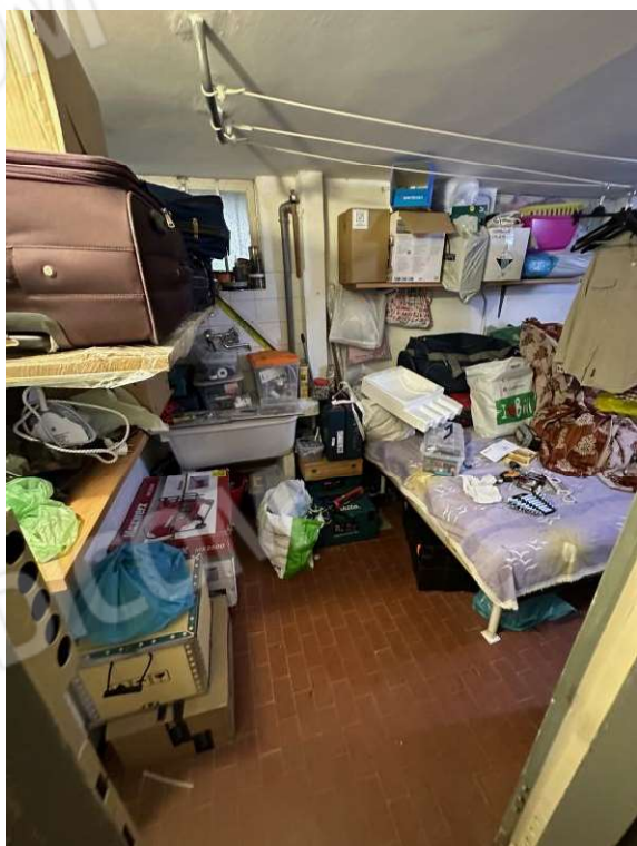
Fotografia n. 22: cantina