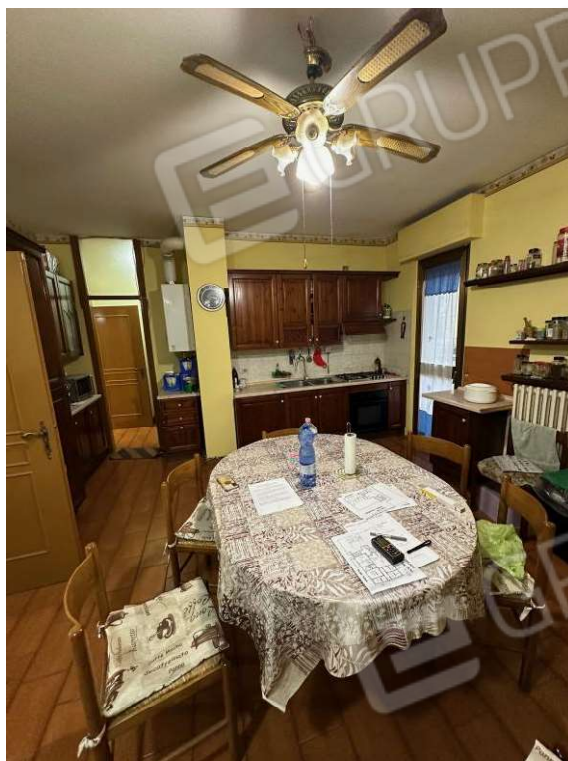
Fotografia n. 7: cucina