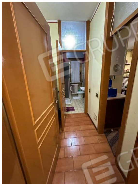
Fotografia n. 11: disimpegno