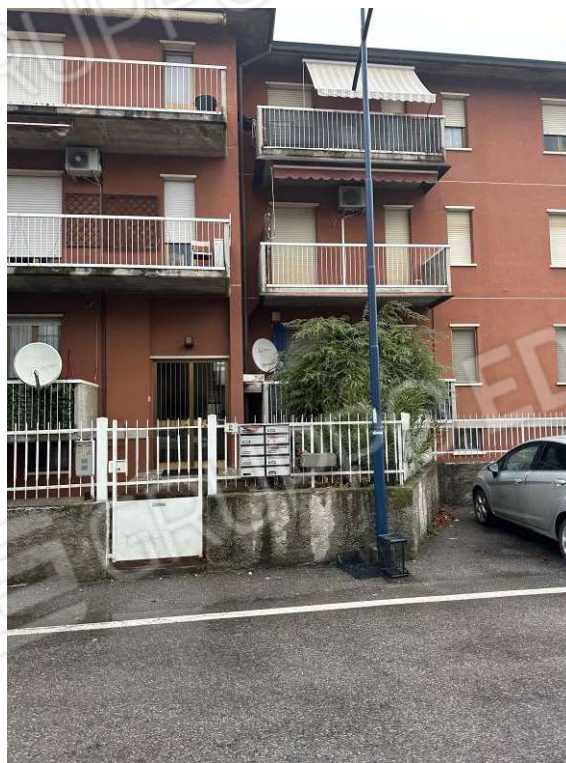
Fotografia n. 2: esterno