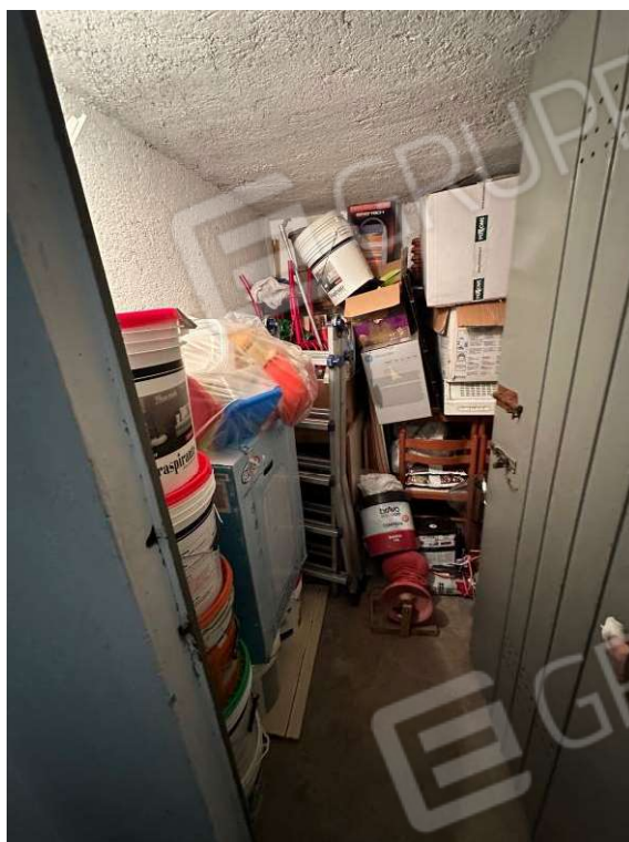
Fotografia n. 23: cantina