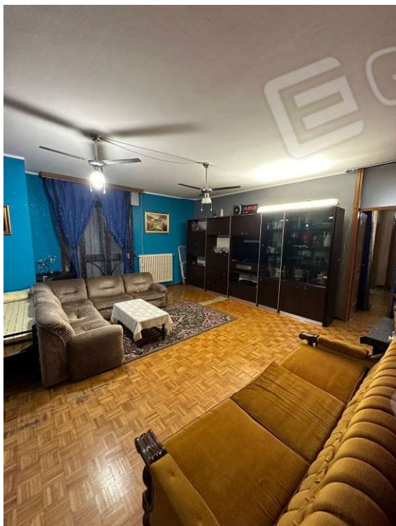
Fotografia n. 4: soggiorno