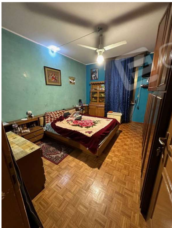
Fotografia n. 16: camera 3