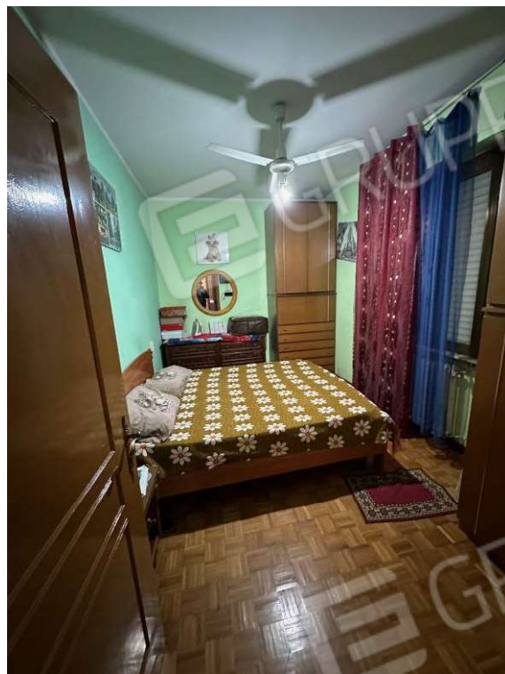
Fotografia n. 15: camera 2