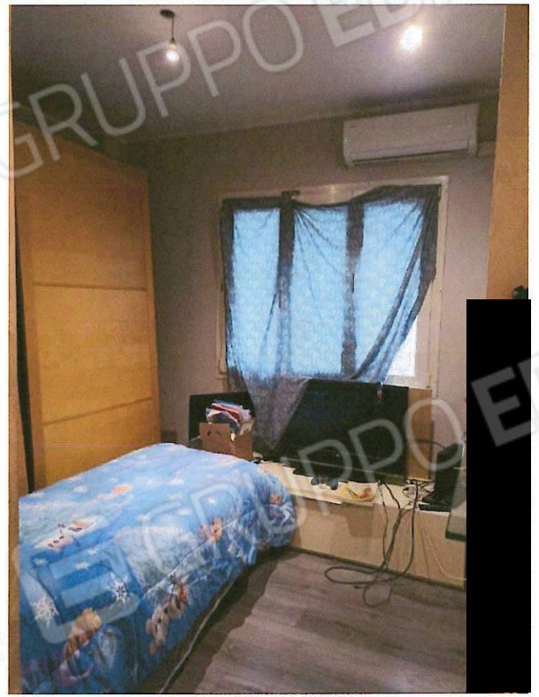
Foto 8-9 – Il corridoio d'accesso e la camera ricavata dietro l'angolo cottura.

VIA MARTINELLA N. 41 - 24020 TORRE BOLDONE BG - laura.corna@archiworldpec.it