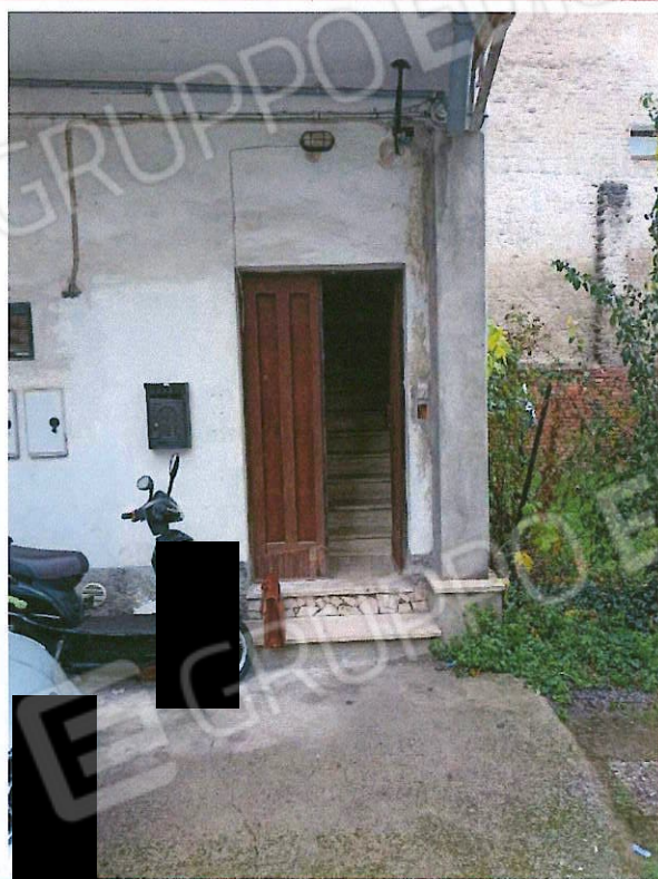
Foto 3 - Il portone d'ingresso al vano scala.