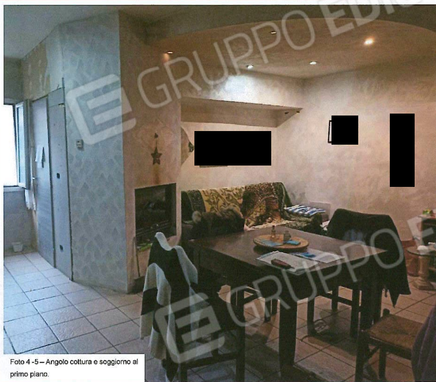
Foto 4 -5 - Angolo cottura e soggiorno al primo piano.