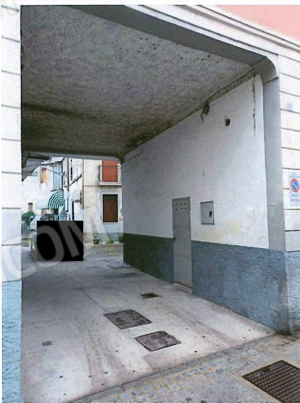
Foto 2 - L'androne d'ingresso al cortile dalla via Roma.