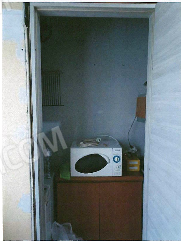
Foto 6 - Il ripostiglio di fronte all'angolo cottura.