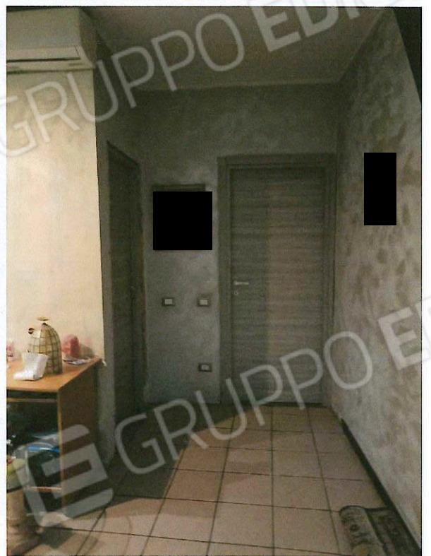
Foto 7 - Il soggiorno con le porte verso camera e bagno.