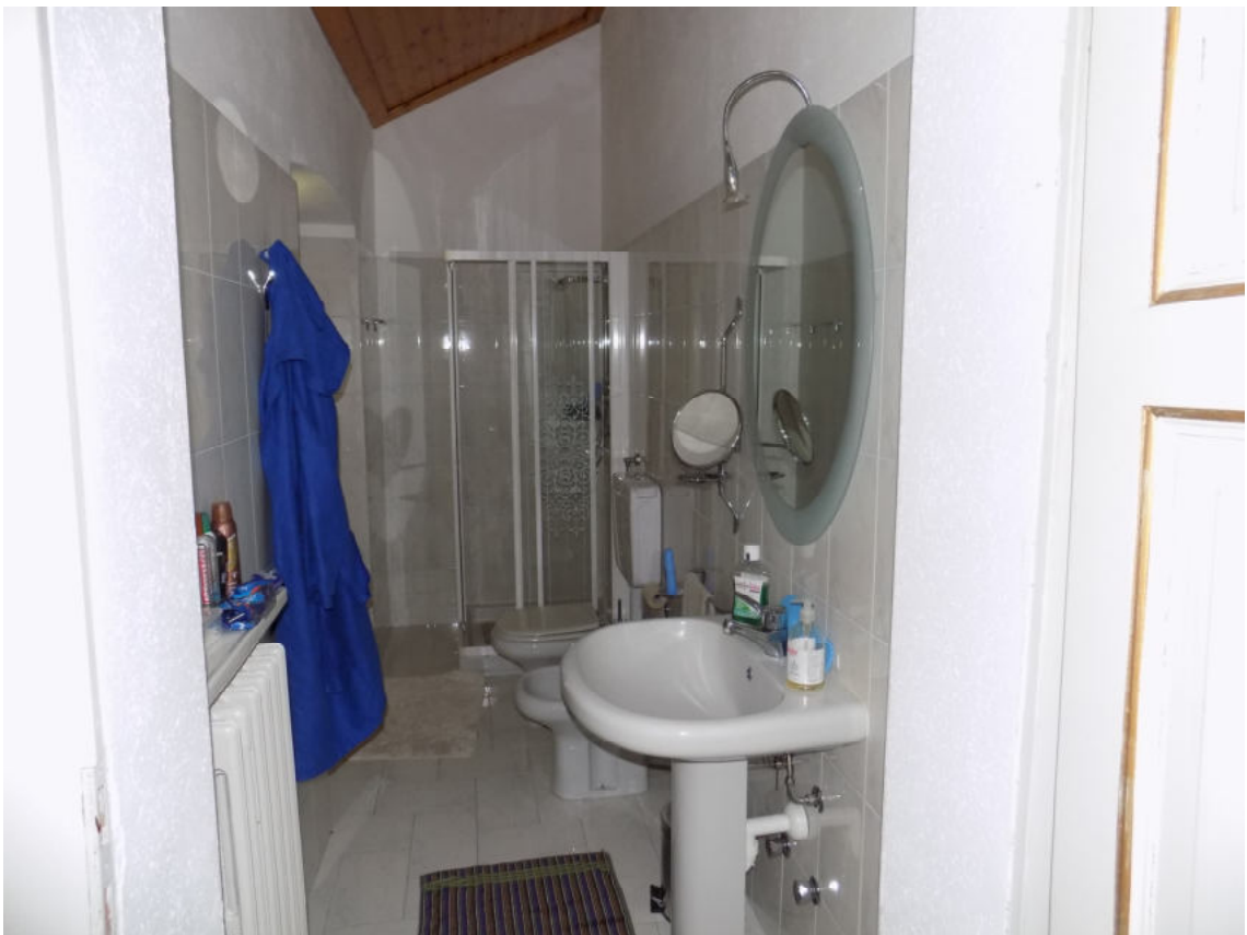
locale bagno secondo piano