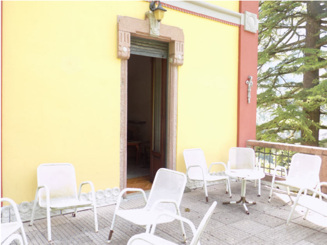
terrazza primo piano