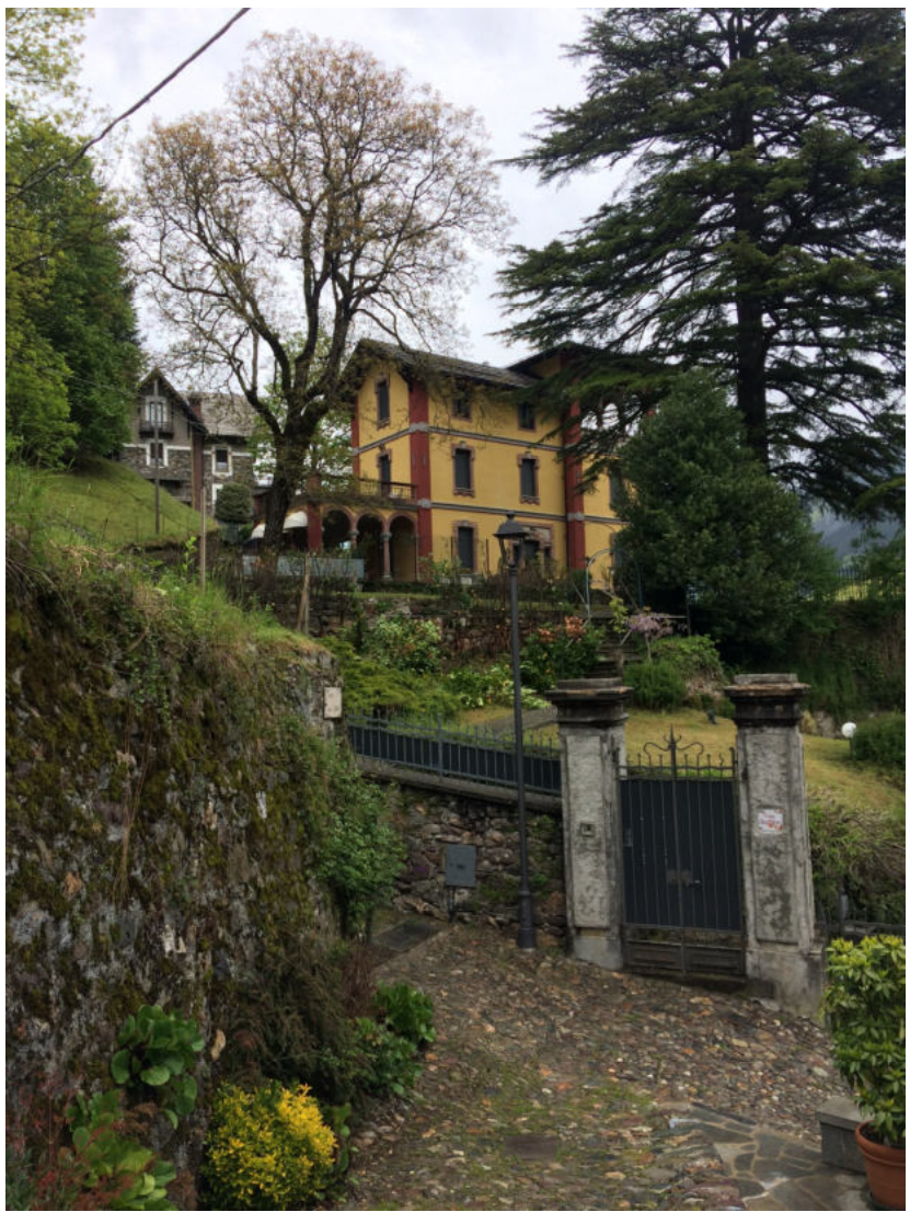
vista villa da via Portula con accessi giardino villa