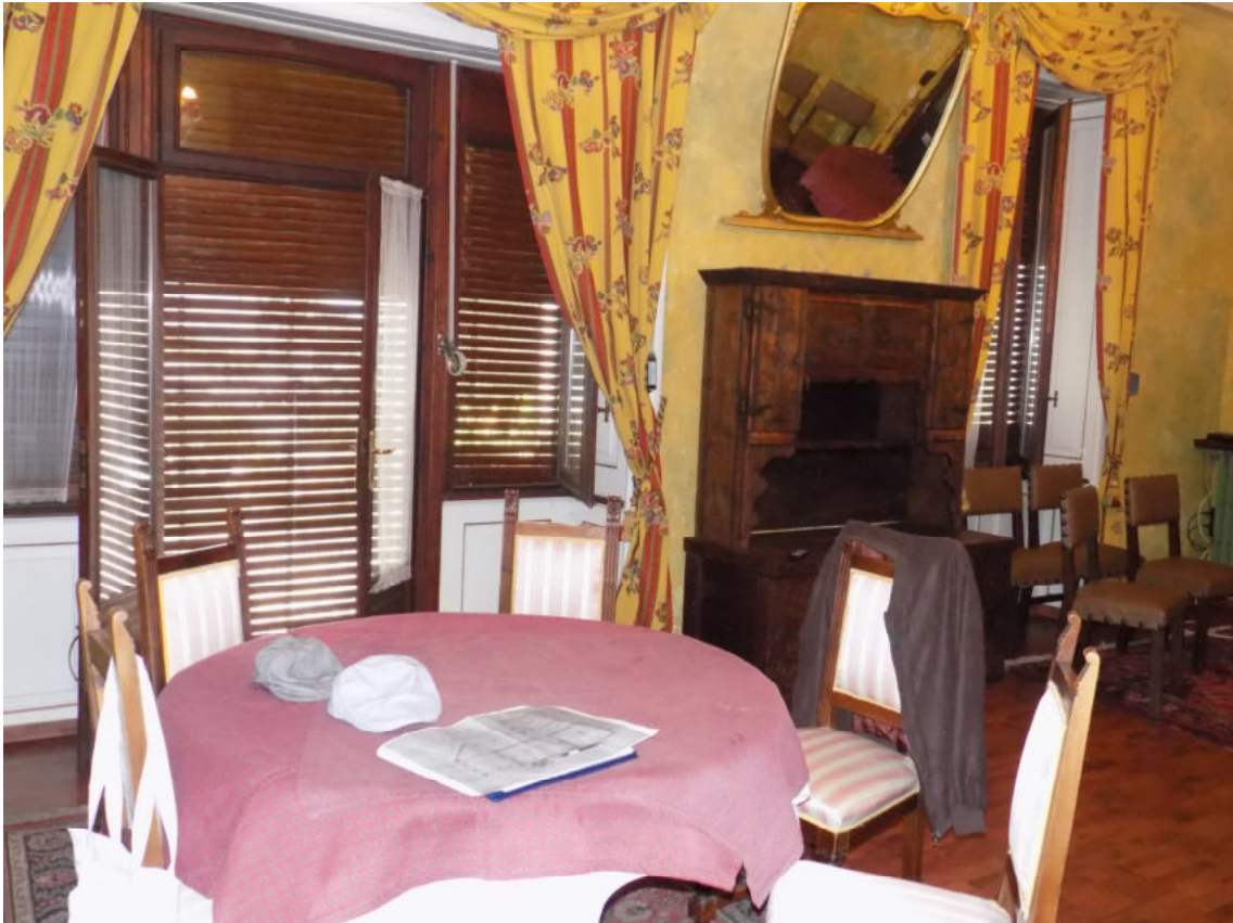
particolari interni (piano terreno)