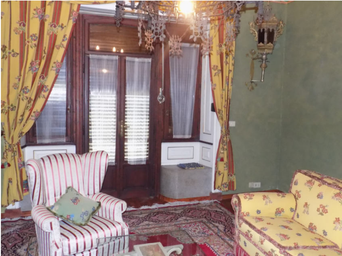
particolari interni (piano terreno)