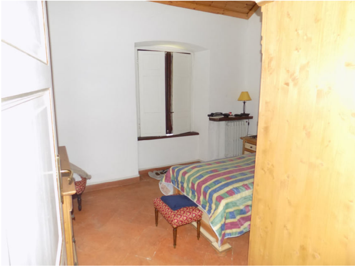
locale secondo piano