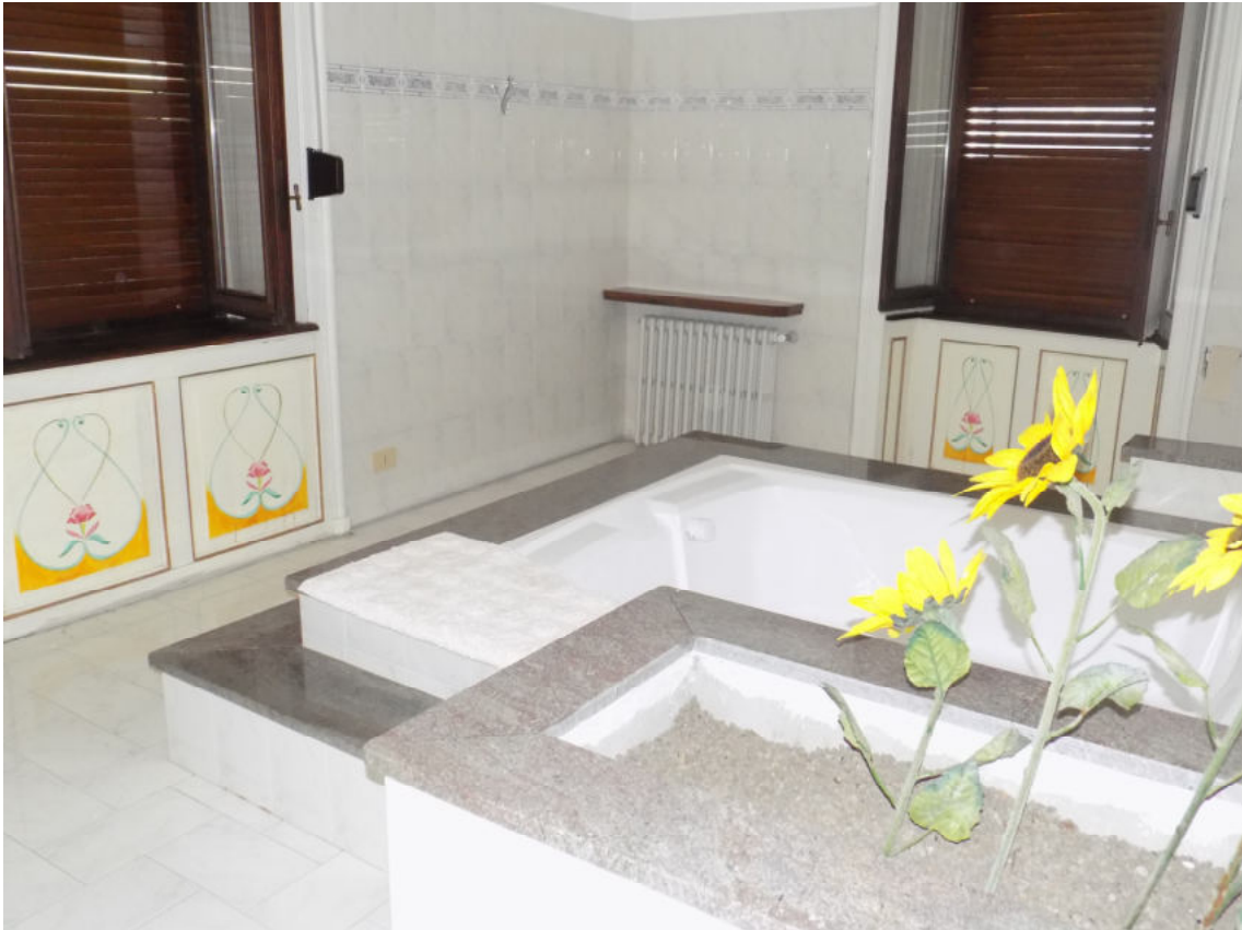
locale bagno primo piano