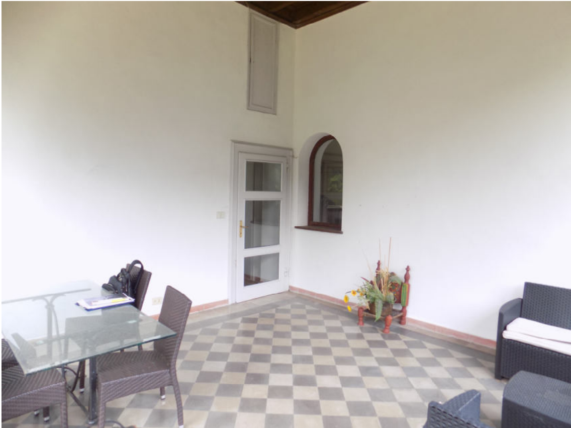
altana secondo piano