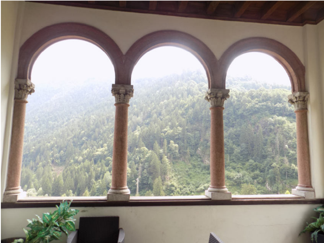
altana secondo piano