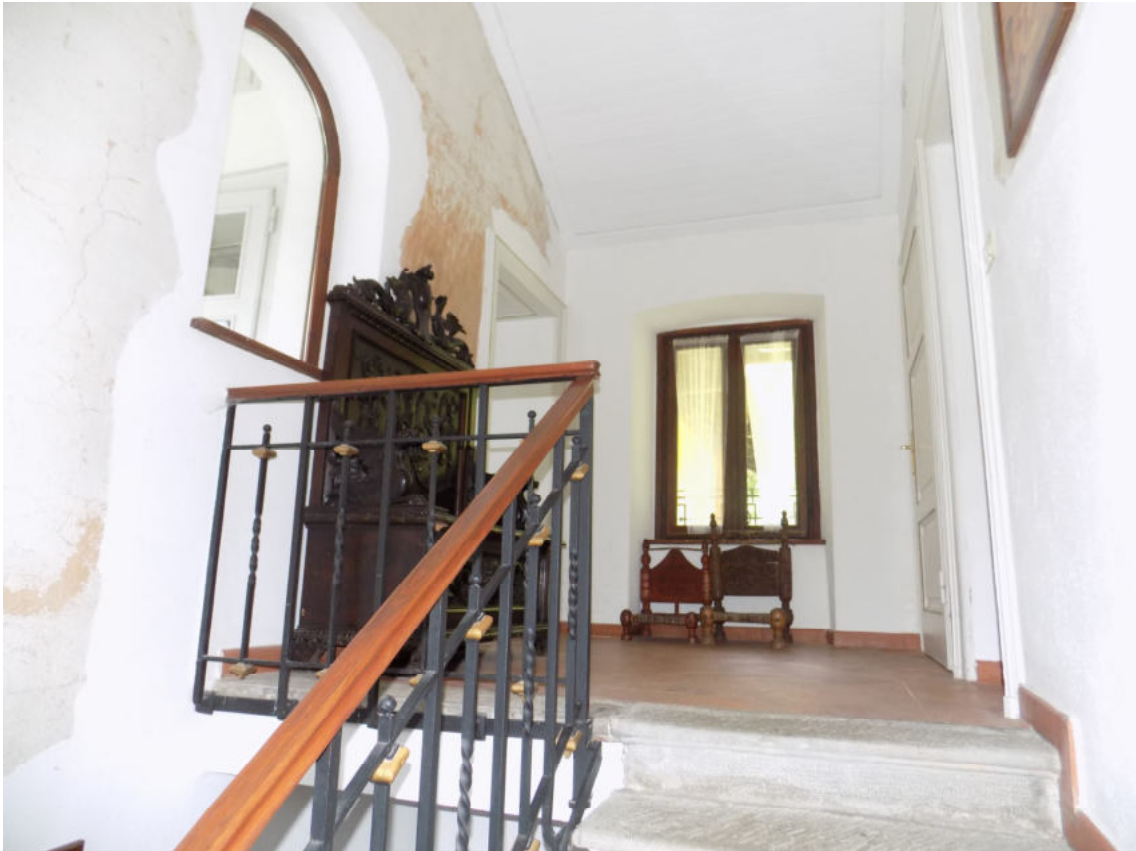
vano scala interno secondo piano