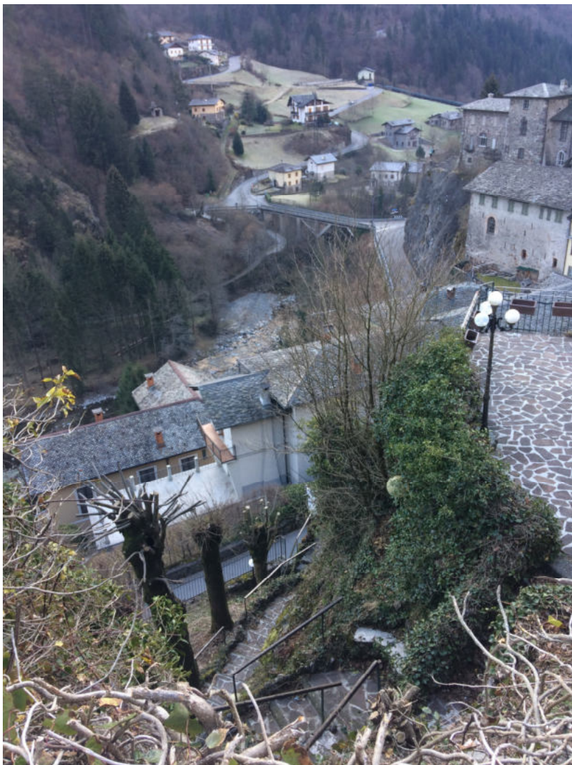
vista da giardino su scaletta da via Locatelli