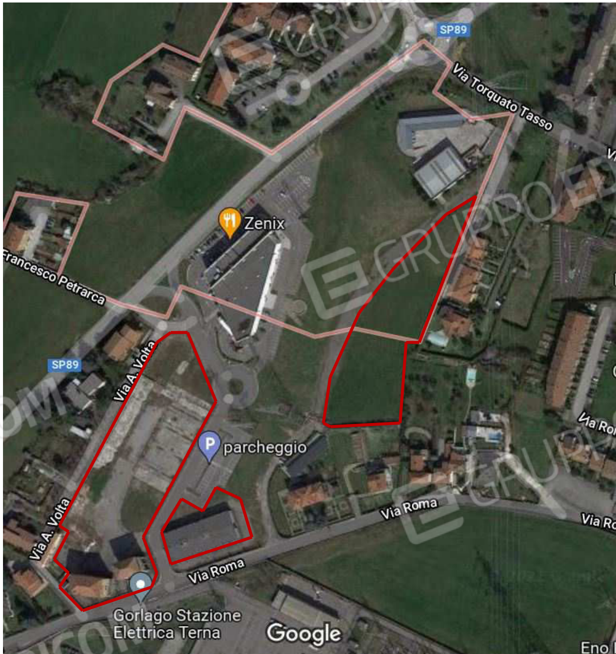
Principali aree oggetto della perizia