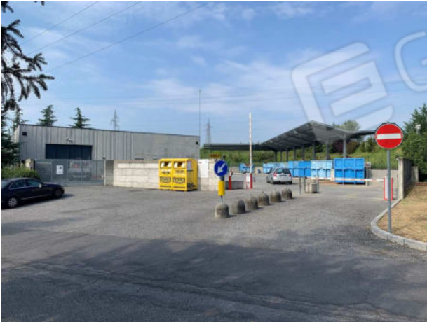
Centro raccolta rifiuti