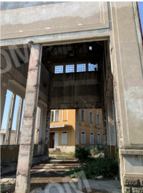
Ex sala gru