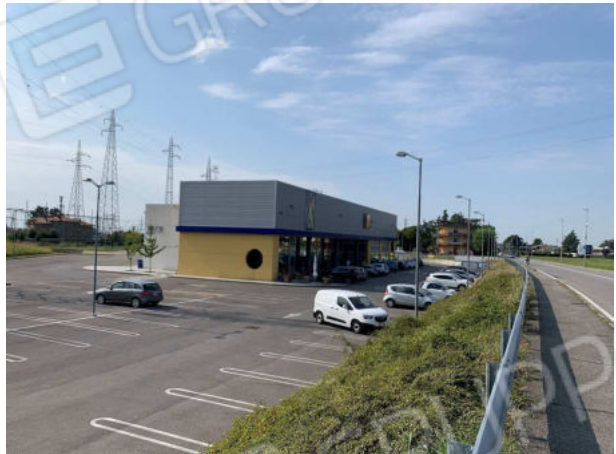
Comparto A-B area commerciale vendita