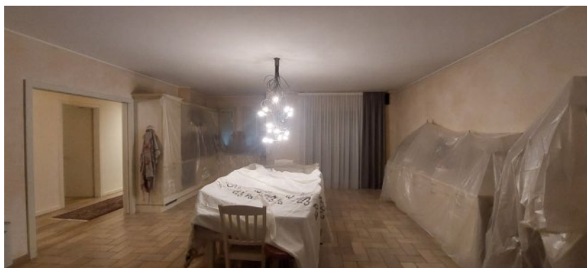
P.-1 -LOCALE PLURIUSO