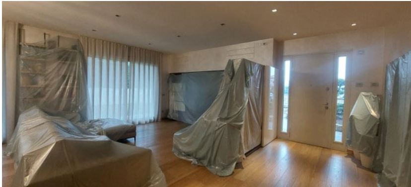
P.T. - SOGGIORNO/ENTRATA