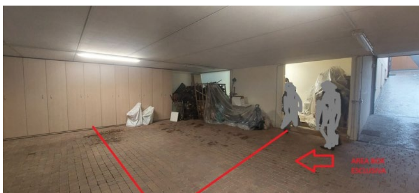
P.-1 - AUTORIMESSA DOPPIA