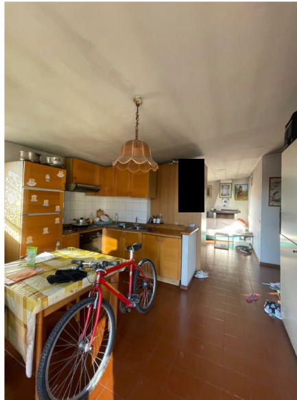
ingresso e pranzo