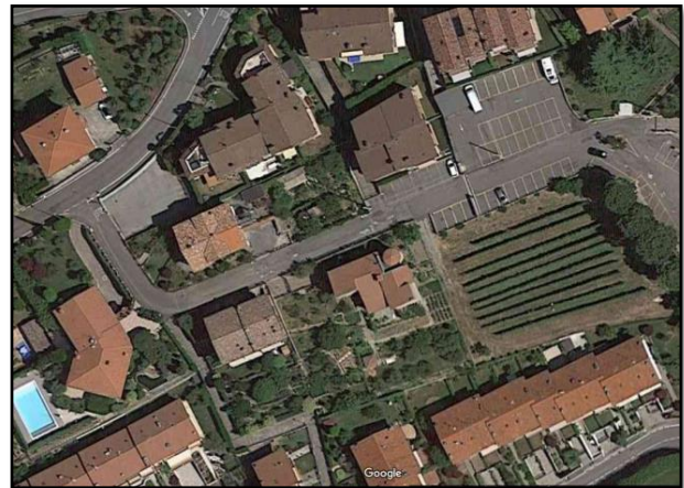
Torre De' Roveri