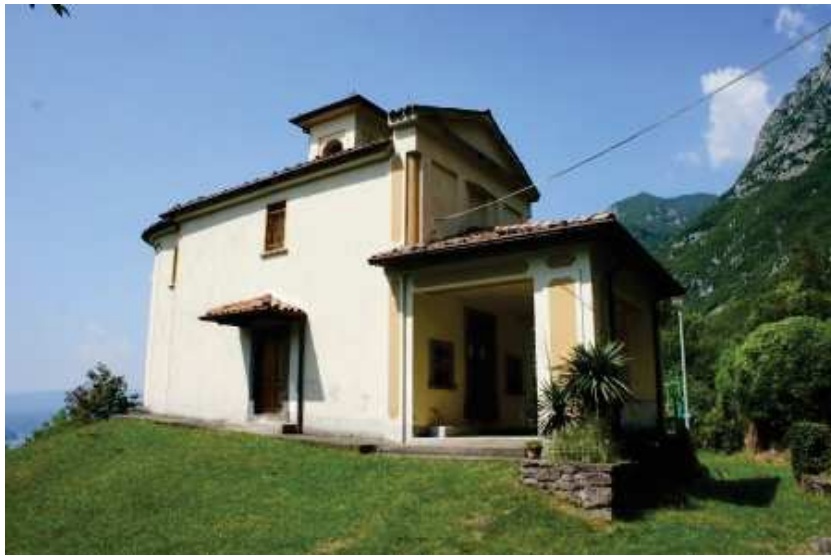
Santuario della Madonna dell'Addolorata confinante con mapp.439