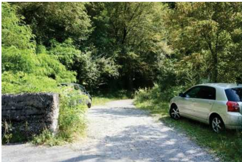
Accesso da strada comunale a mapp.2603