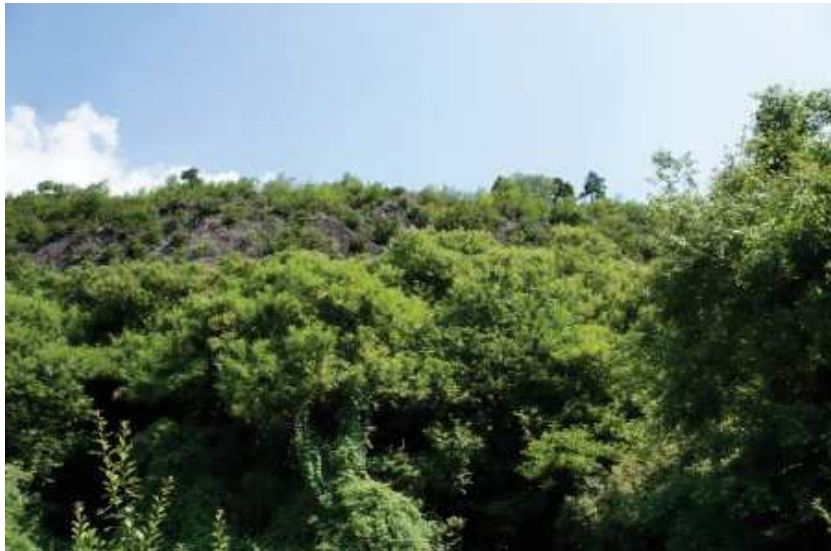
mapp.1797 da lontano