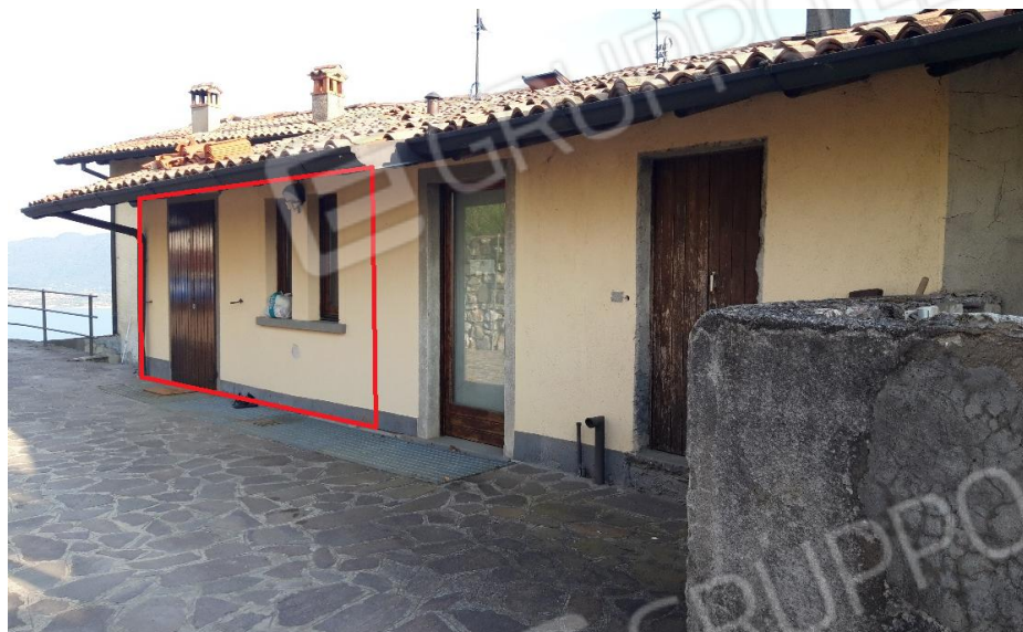
Vista ingresso lato nord 1

Foglio 1 Particella 713 Sub.706 – Bilocale con destinazione residenziale