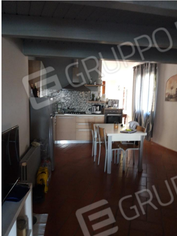
Angolo cottura vista 1