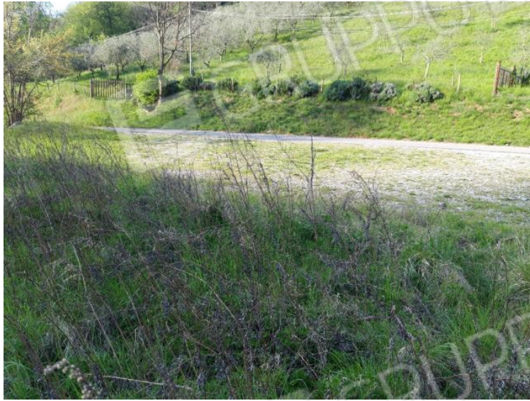
Vista lato ovest