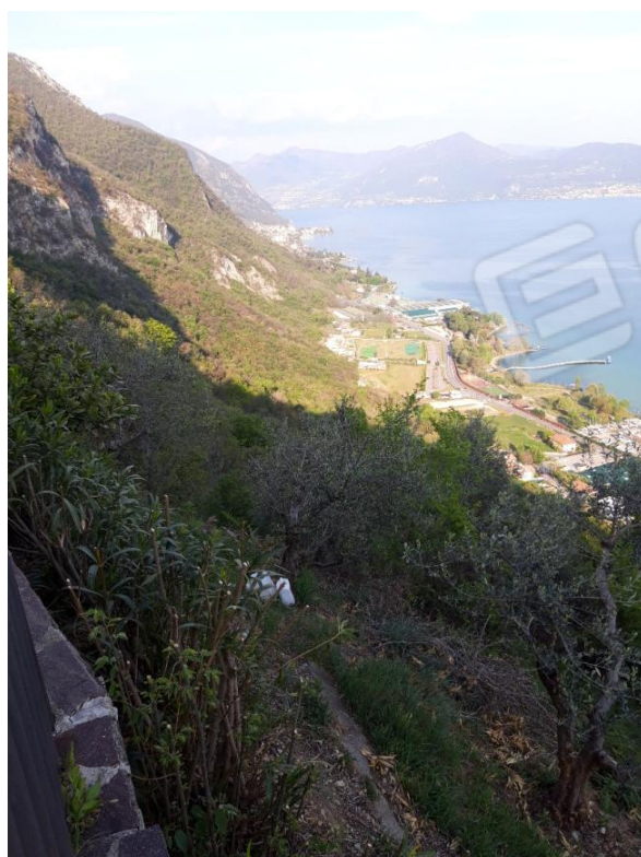
Foglio 1 Particella 711 – Terreno