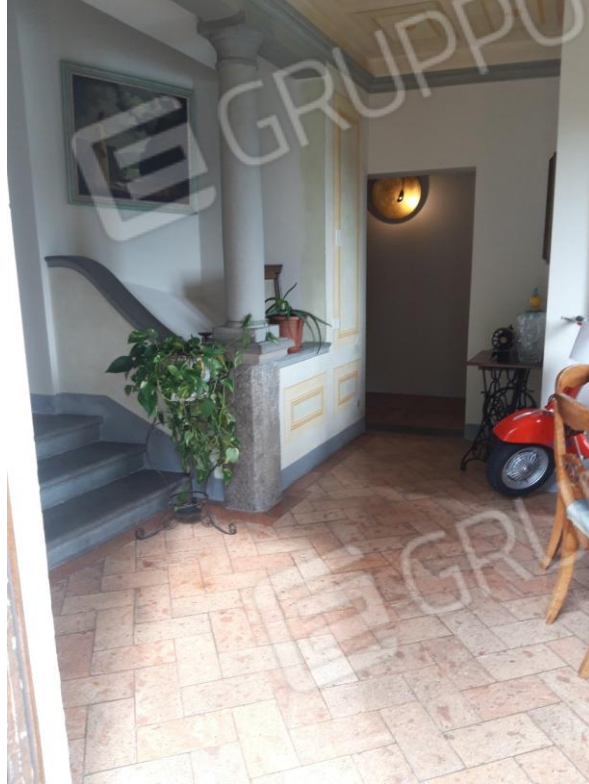
Vista interna 1