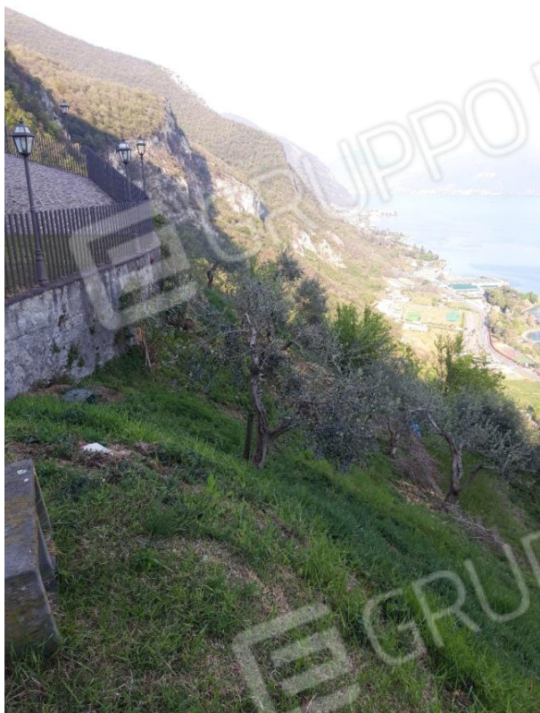
Foglio 1 Particella 681 – Terreno