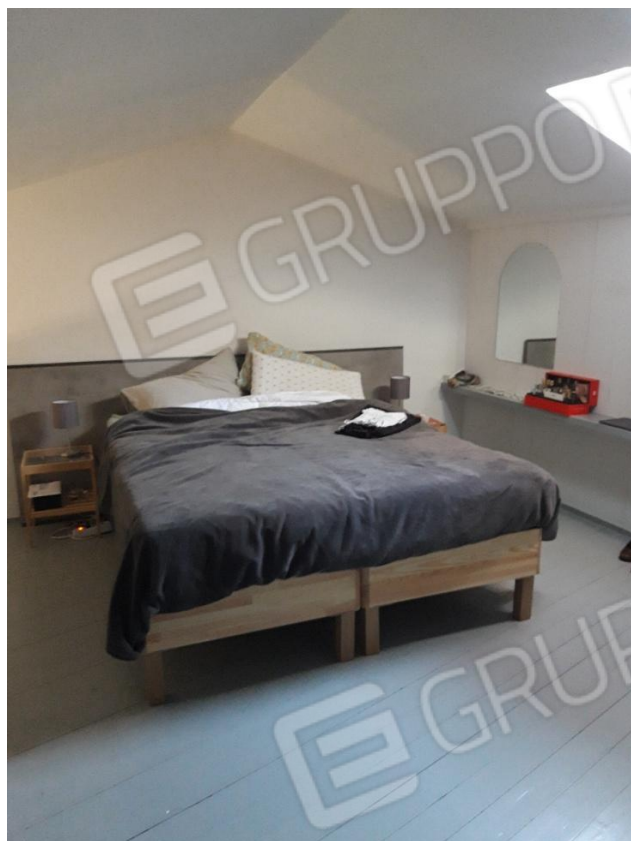
Letto su soppalco