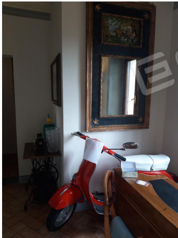
Vista interna 2