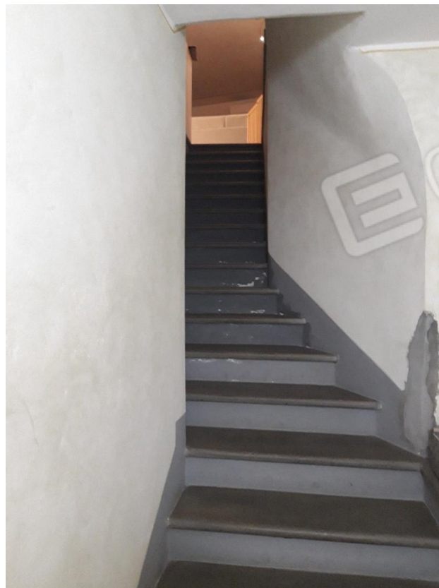
Scale con vista da piano interrato