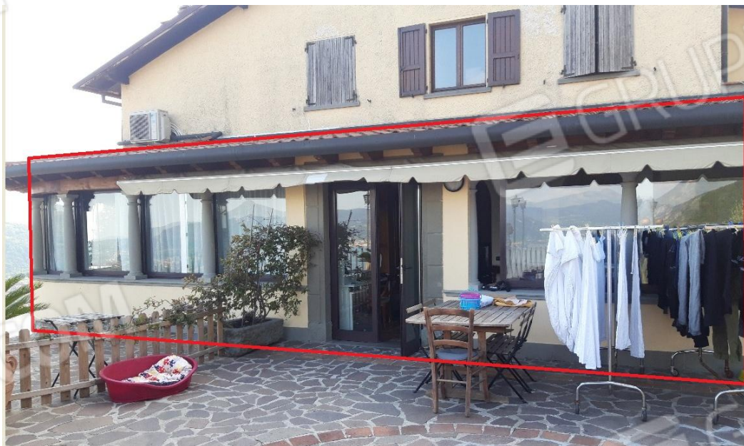
Vista esterna da est