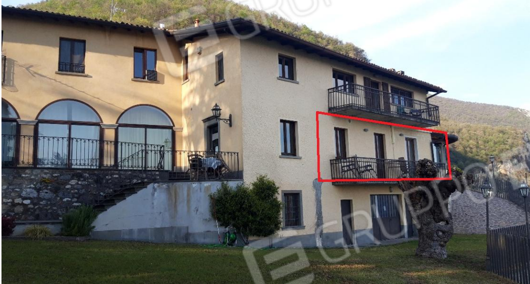
Vista esterna da sud