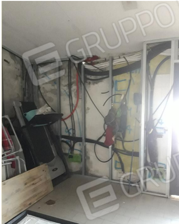
Vano in fase di ristrutturazione