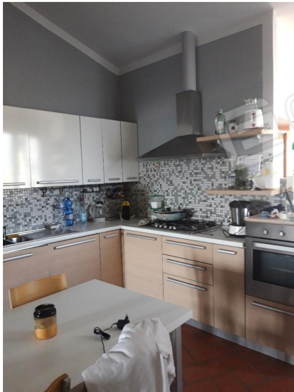
Angolo cottura vista 2