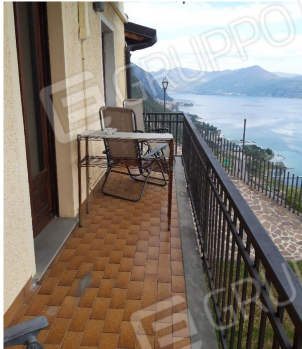
Balcone vista 1