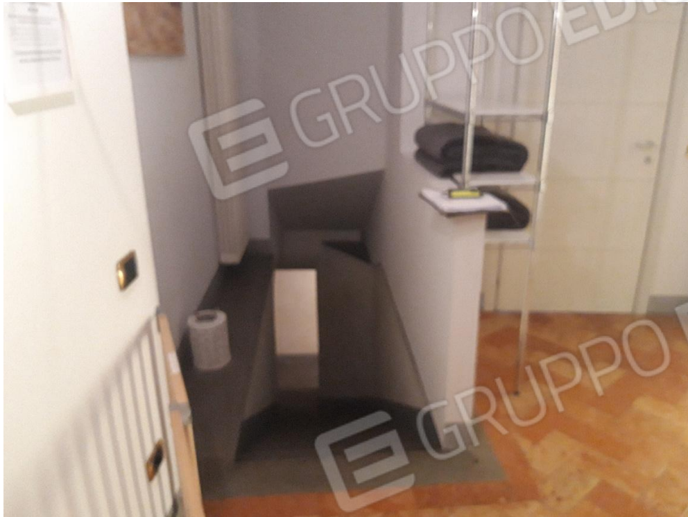
Scale per accesso ai servizi igienici