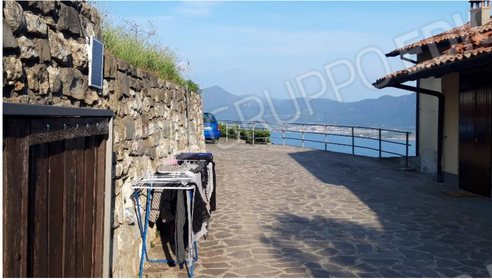
Vista corsello comune lato nord