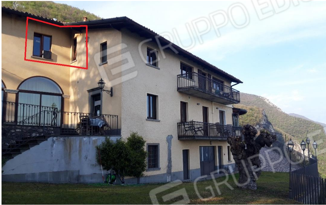
Vista immobile lato sud