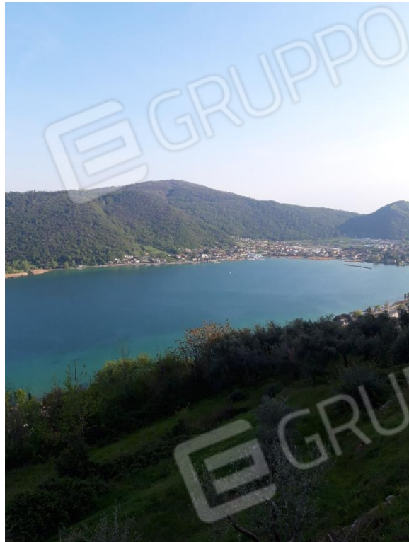
Foglio 1 Particella 802 – Terreno