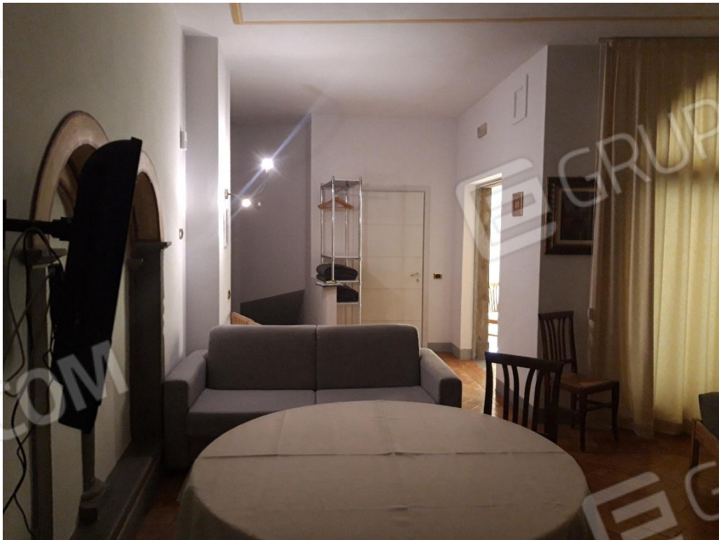
Soggiorno vista 2