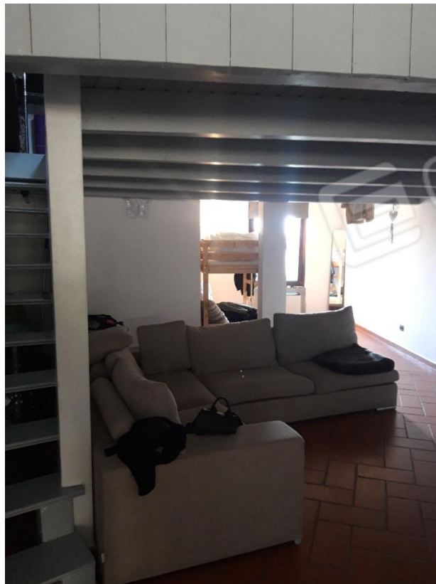
Vista soggiorno sotto soppalco