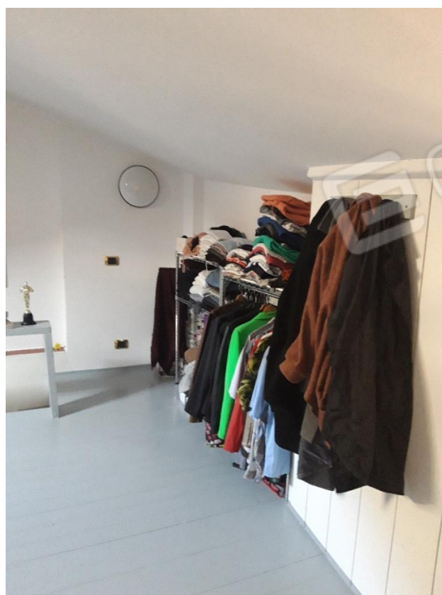
Vista su soppalco