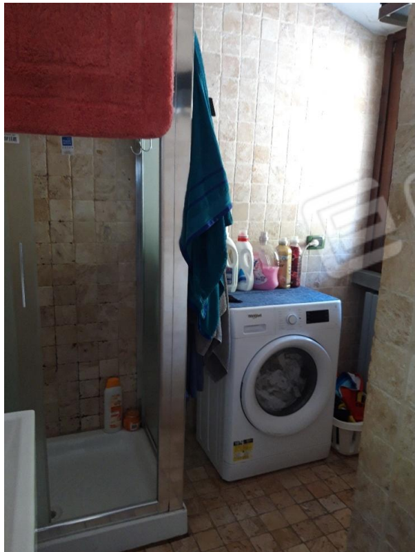
Bagno vista 2