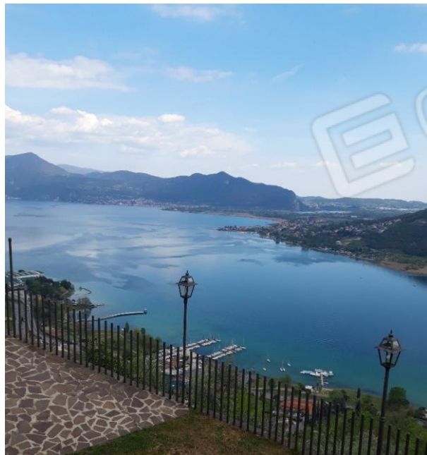
Vista panoramica dal balcone