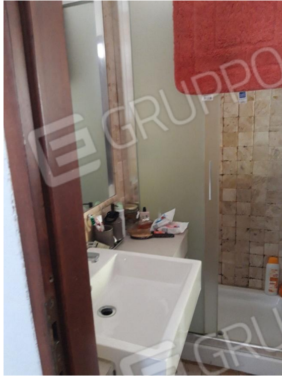
Bagno vista 1