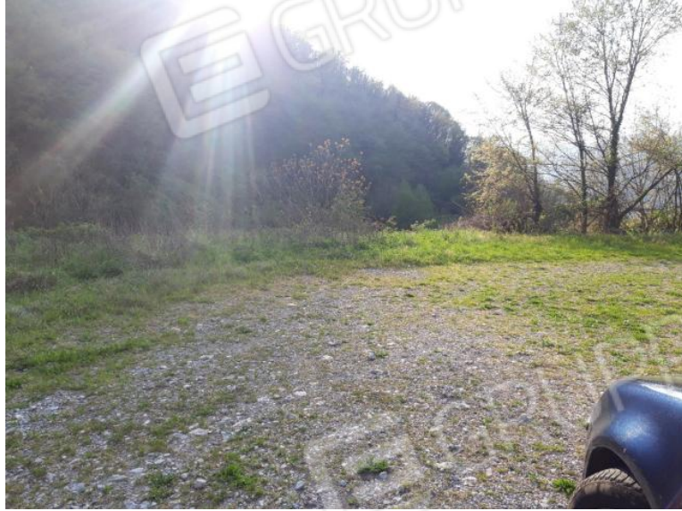
Vista da Via Forcella 1