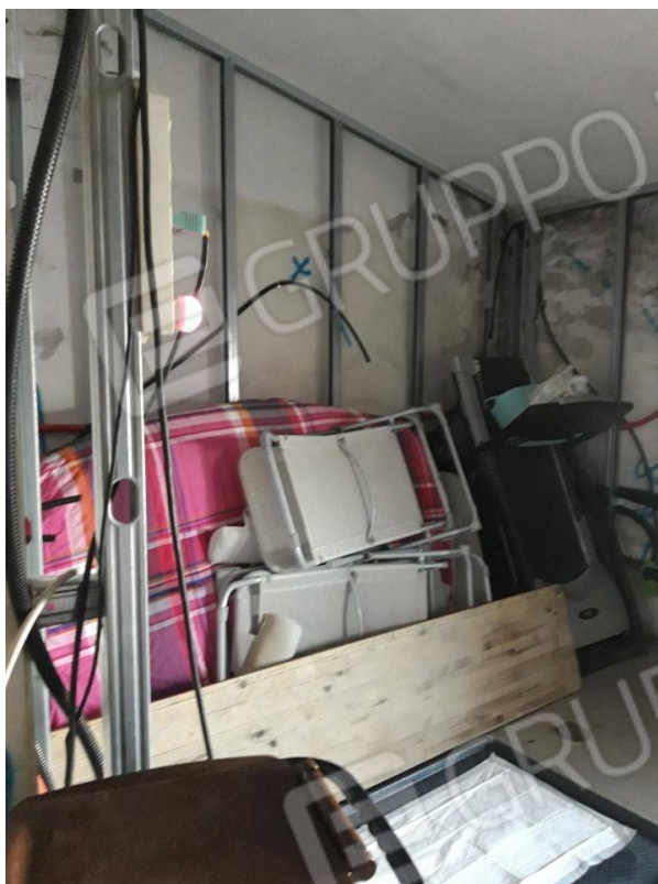
Vano 1 in fase di ristrutturazione