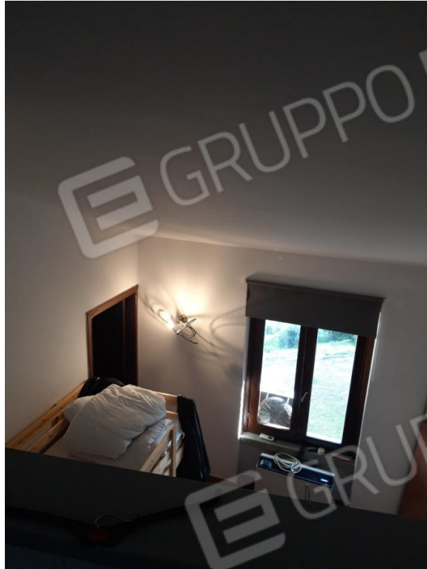
Vista da soppalco a piano terra