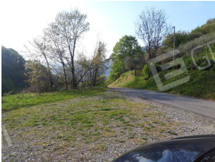
Vista da Via Forcella 2