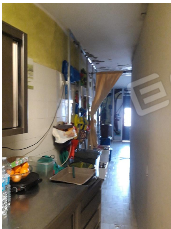
Vano 2 in fase di ristrutturazione