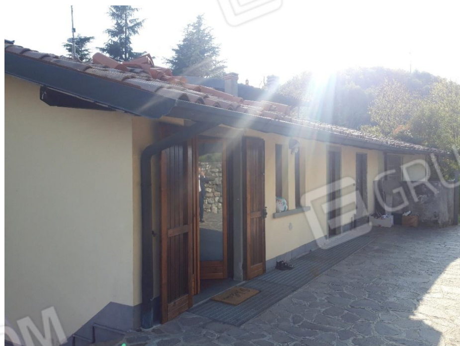
Vista ingresso lato nord 2