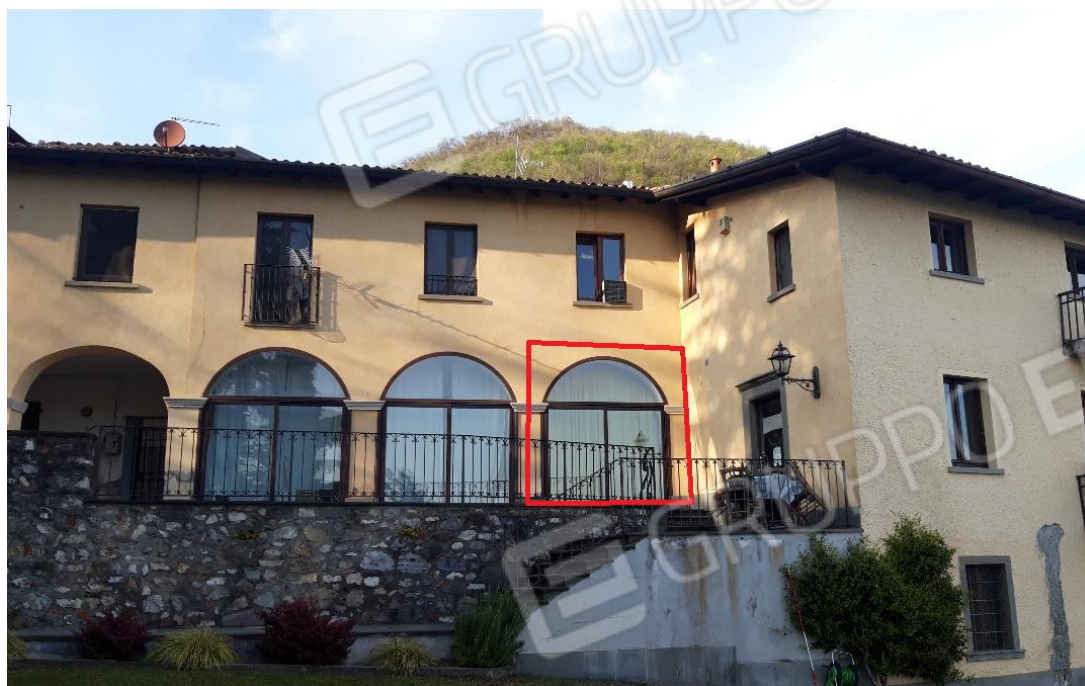
Vista immobile lato sud