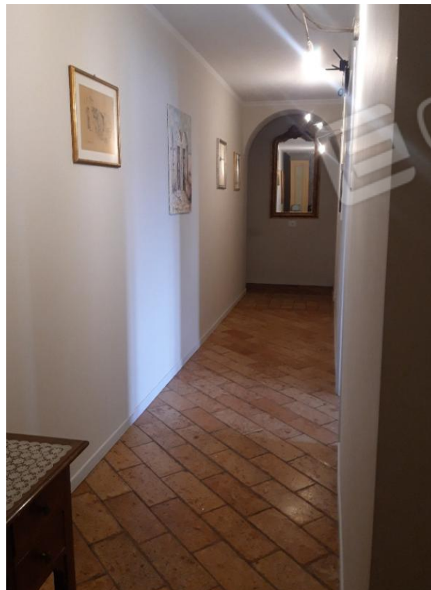
Corridoio vista 2