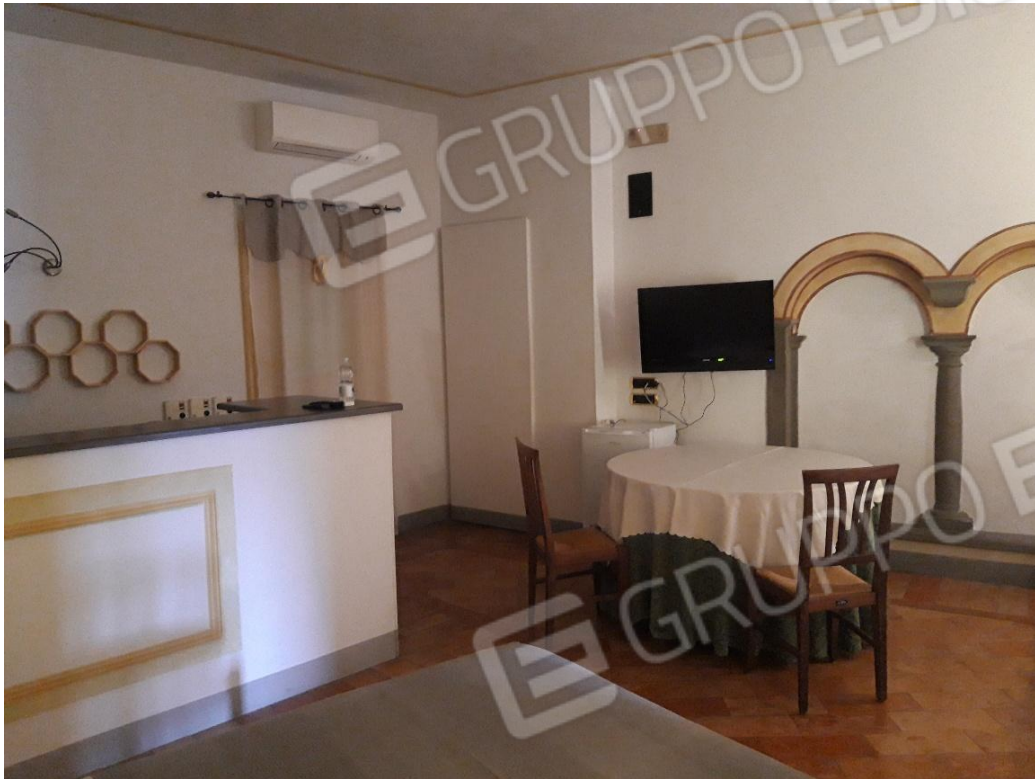
Soggiorno vista 1