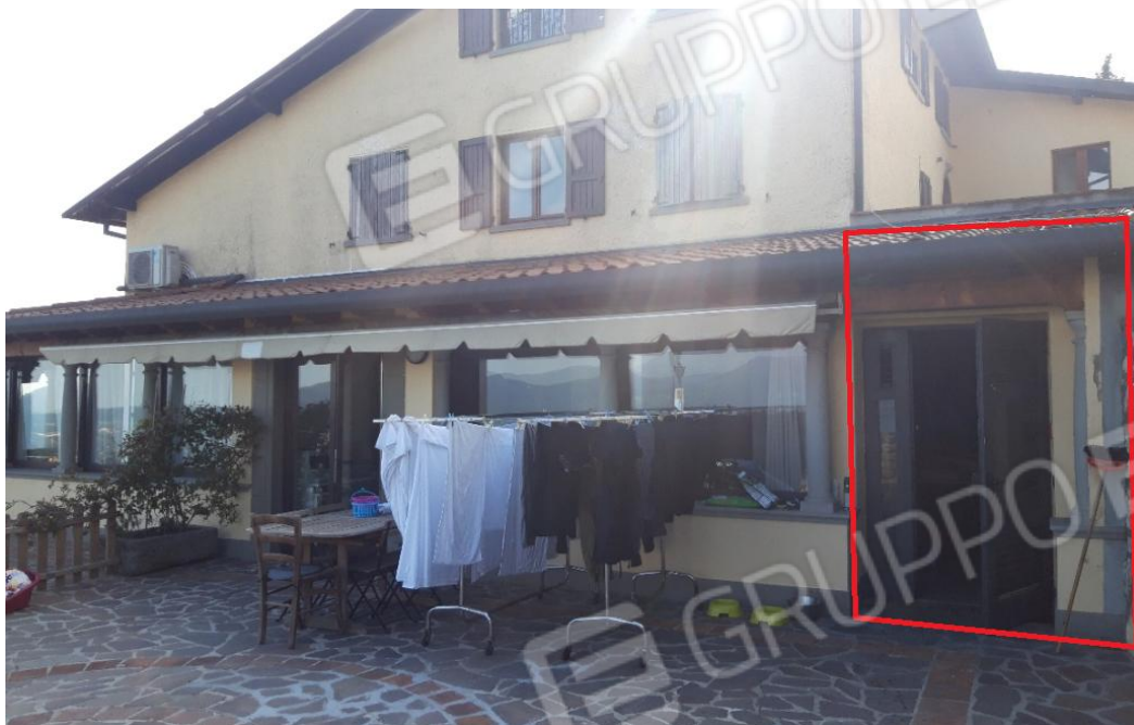
Vista esterna da est