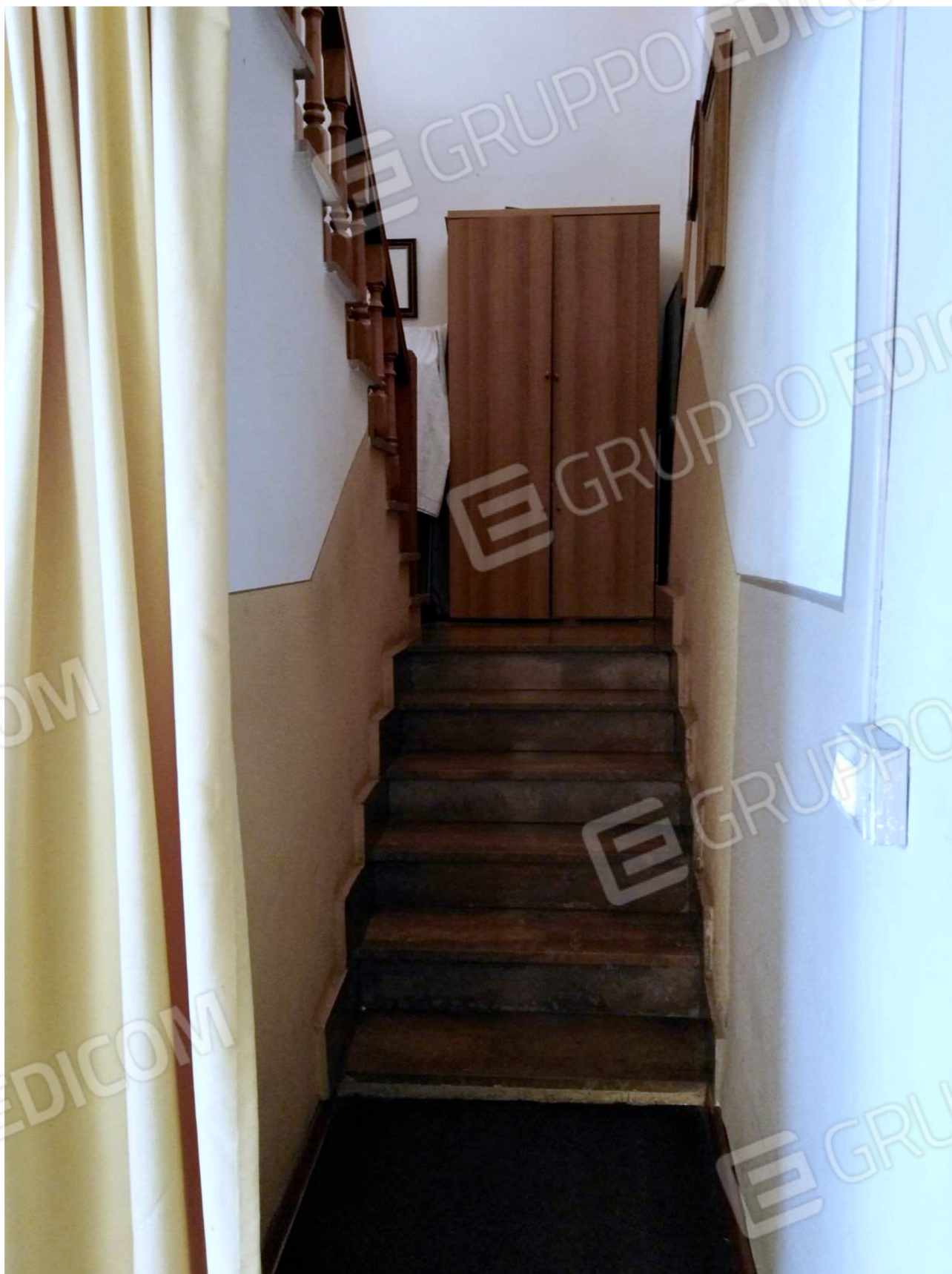
La Scala comune di accesso al Piano Primo