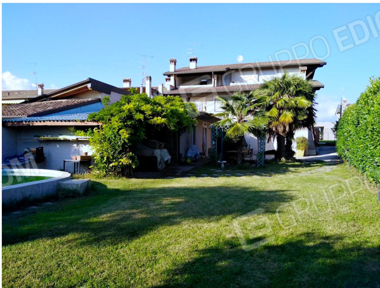
Il fabbricato dalle aree comuni – Vista da sud