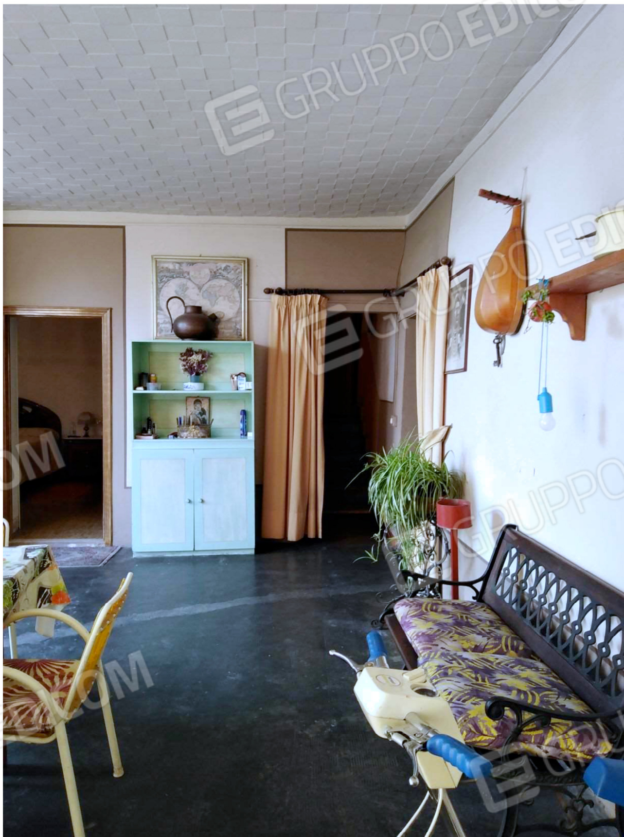
La Porzione comune del Portico e l'accesso alla Camera e alla Scala comune