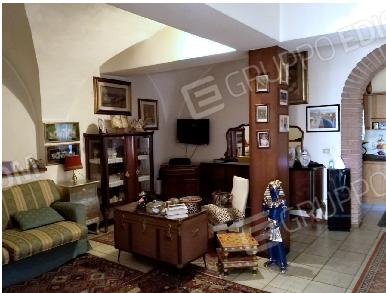
Il Soggiorno e l'ingresso alla Cucina