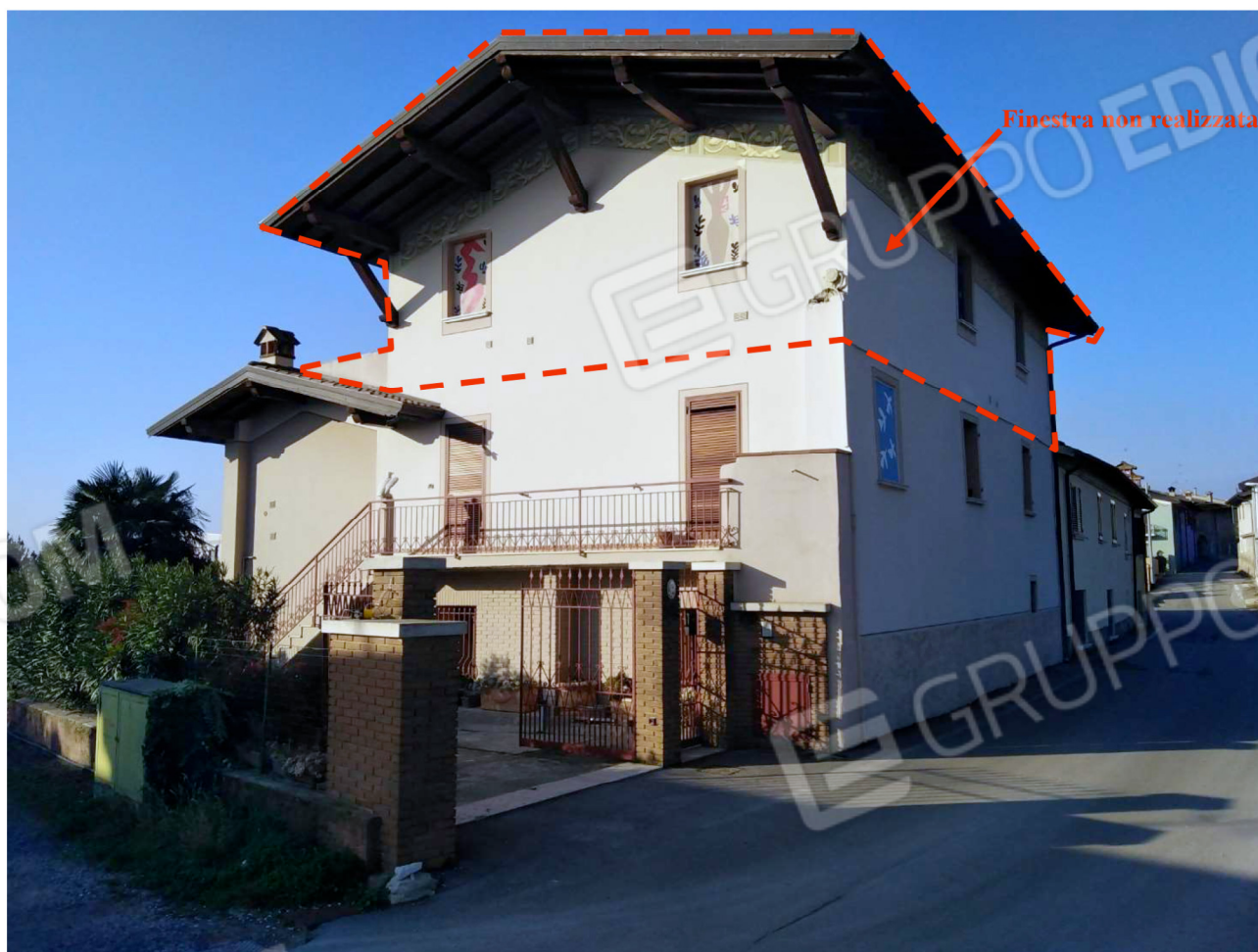
Il fabbricato su Via Marzabotto, 24 – Vista da est con indicato il sottotetto di proprietà e gli interventi difformi