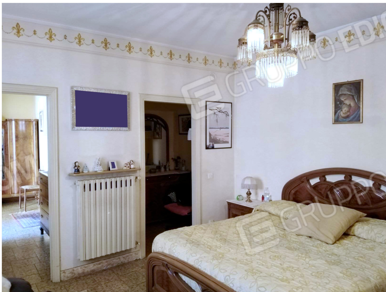
La Camera, il relativo Ripostiglio e il Disimpegno