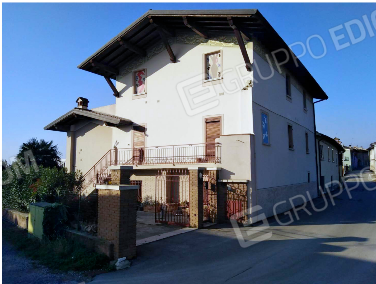
Il fabbricato su Via Marzabotto, 24 – Vista da est - Gli ingressi carraio e pedonale