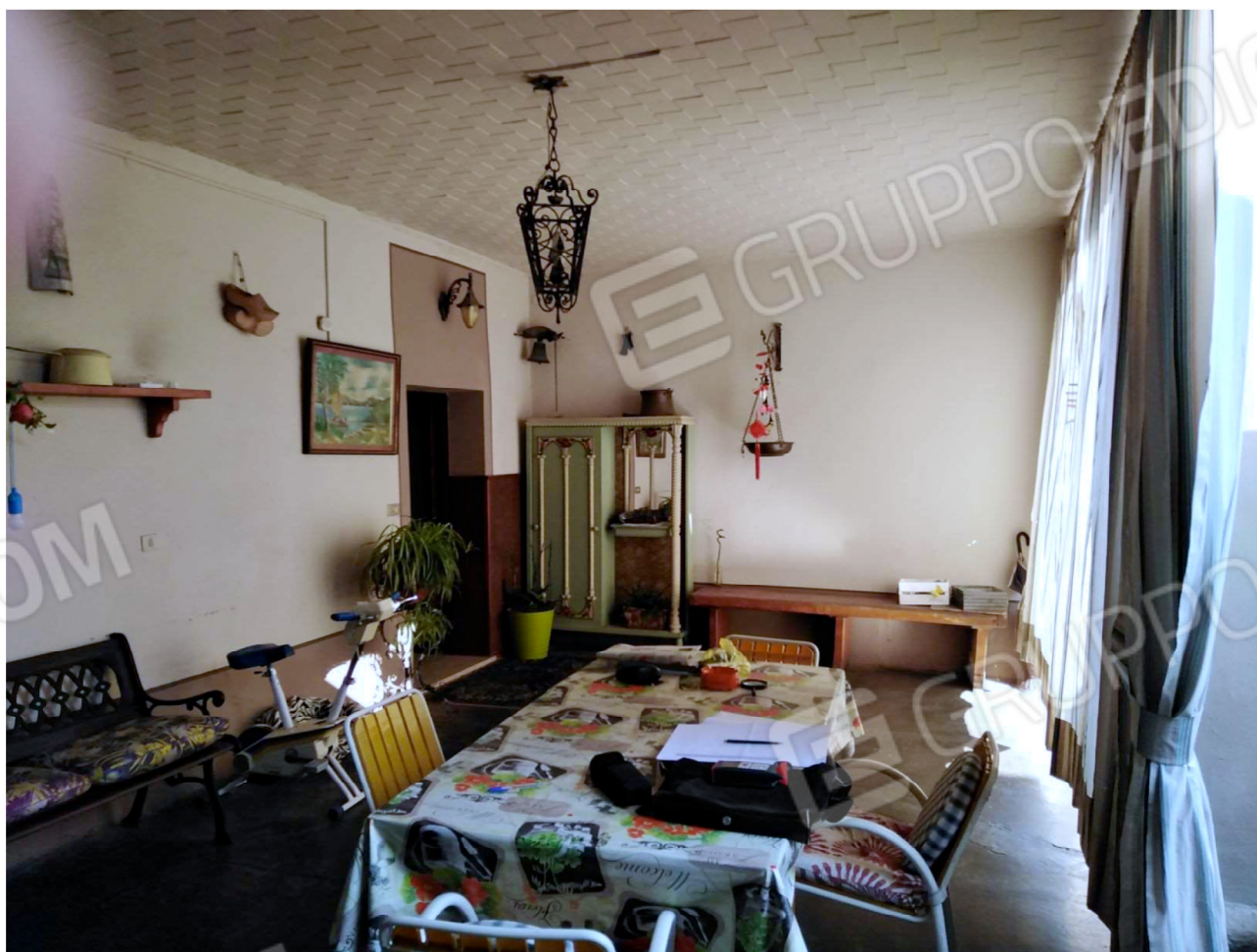
Il Portico e la porta d'ingresso al retrostante Soggiorno