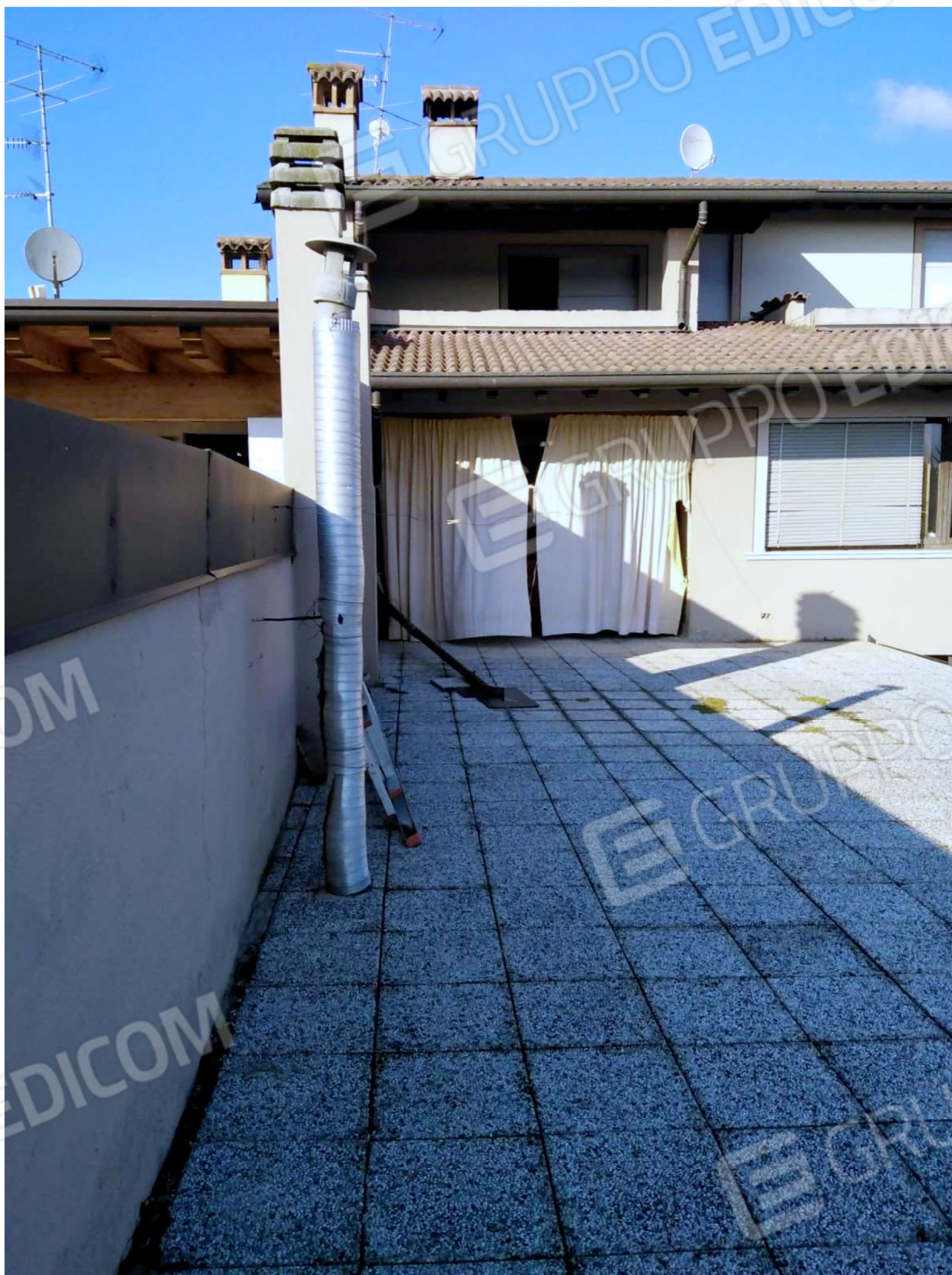
La terrazza sovrastante Camera, Disimpegno, Bagno e Lavanderia, accessibile dalla scala comune