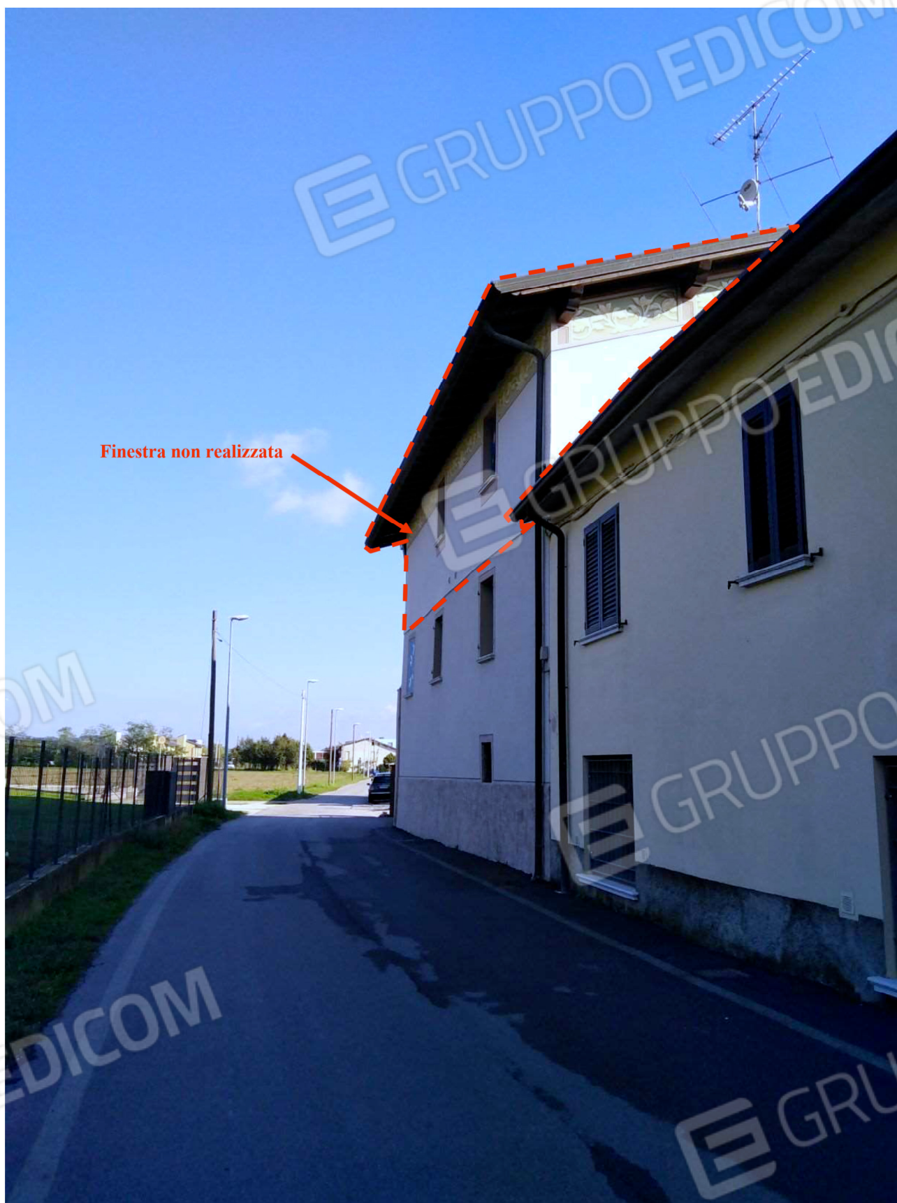
Il fabbricato su Via Marzabotto, 24 – Vista da ovest con indicato il sottotetto di proprietà e gli interventi difformi