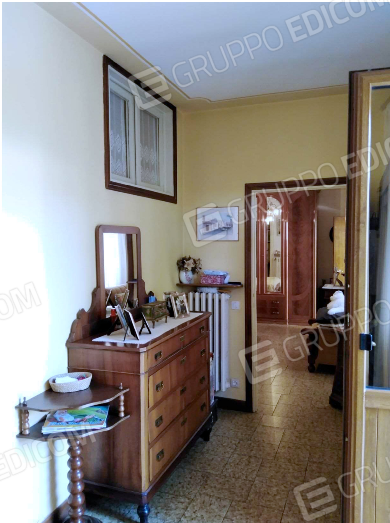
Il Disimpegno comune alla Camera e al Bagno