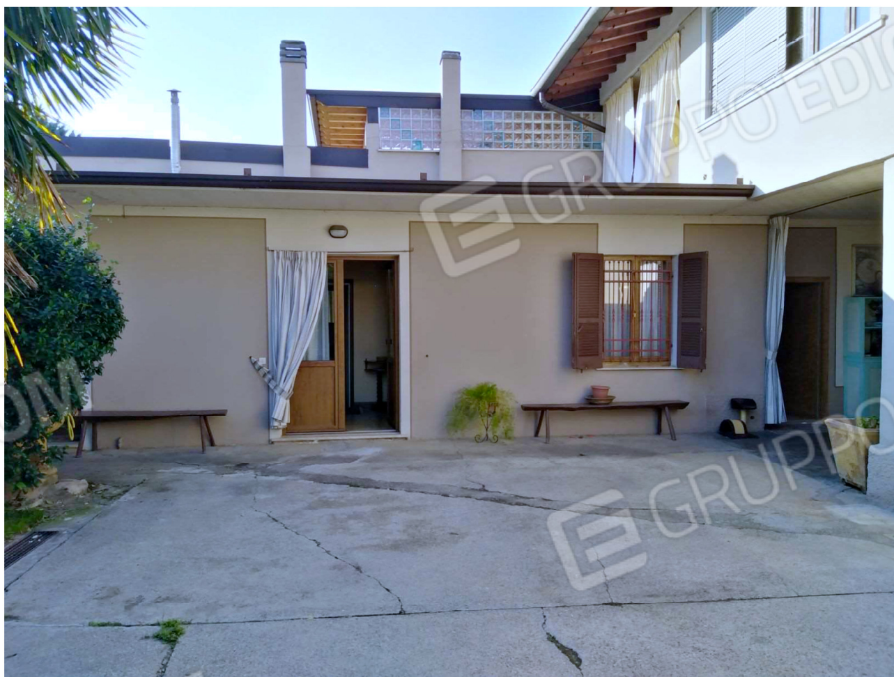
Il fabbricato di proprietà che ospita la Camera, il Bagno e la Lavanderia.