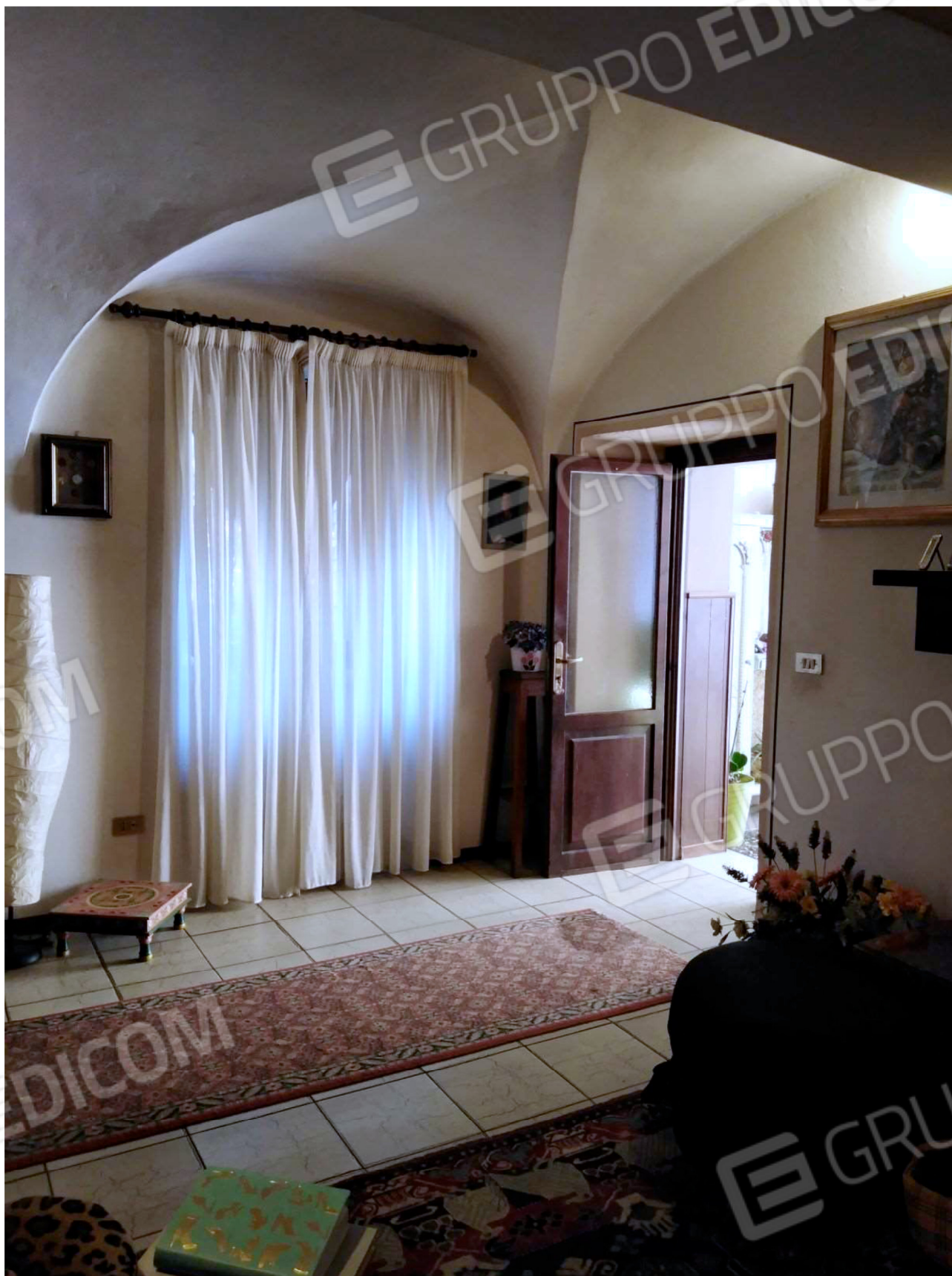
Il Soggiorno e la porta d'ingresso dall'antistante Portico