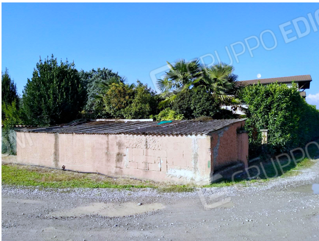
Il Pollaio edificato sul confine sud con la copertura in lastre ondulate di eternit