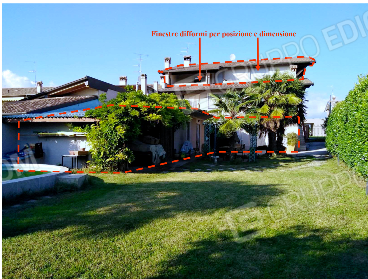
Il fabbricato dalle aree comuni – Vista da sud con indicata la proprietà e gli interventi difformi