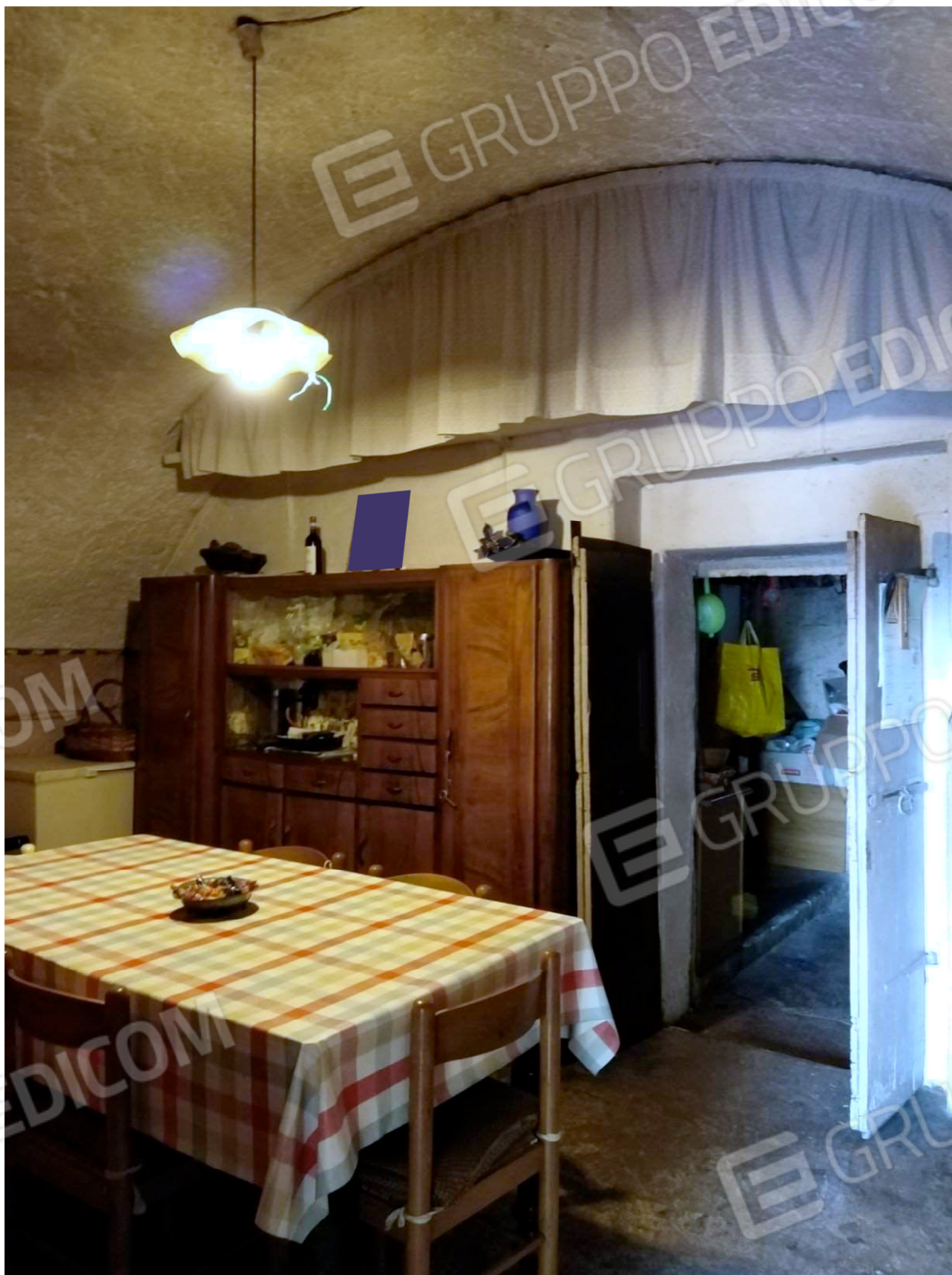
La Cantina con accesso dalla porzione comune del Portico