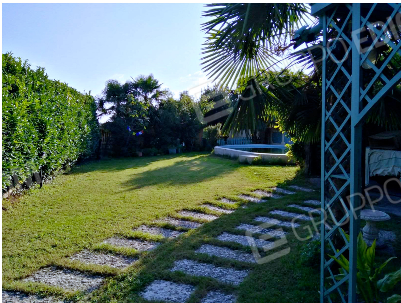
Le aree comuni verso confine sud e la Piscina per cui è prevista la demolizione