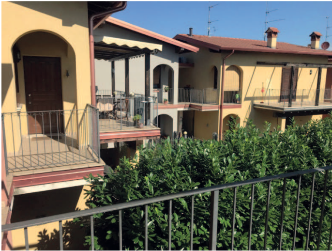
LOTTO 1 APPARTAMENTO VIA VIVALDI P.PRIMO