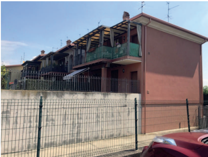
VISTA ESTERNA BLOCCO DEI LOTTI 2-3