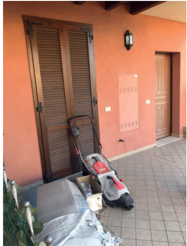
INGRESSO LOTTO 3 P.TERRA VIA COLOMBAIA 6f