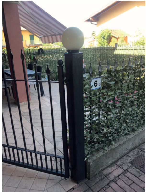
INGRESSO LOTTO 2 P.TERRA VIA COLOMBAIA 6g