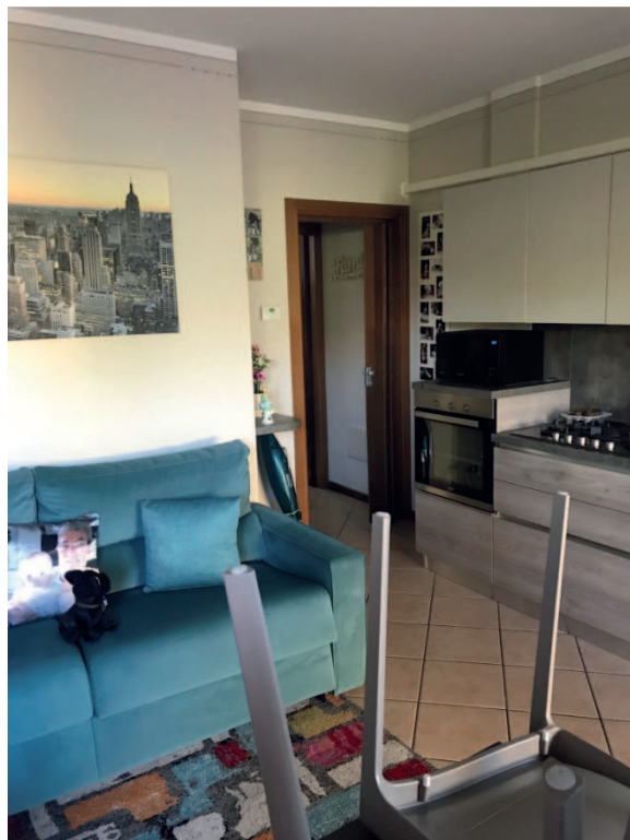
INTERNO LOTTO 2