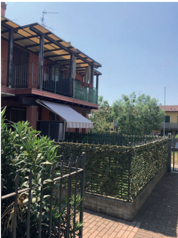
VISTA GIARDINO LOTTO 2