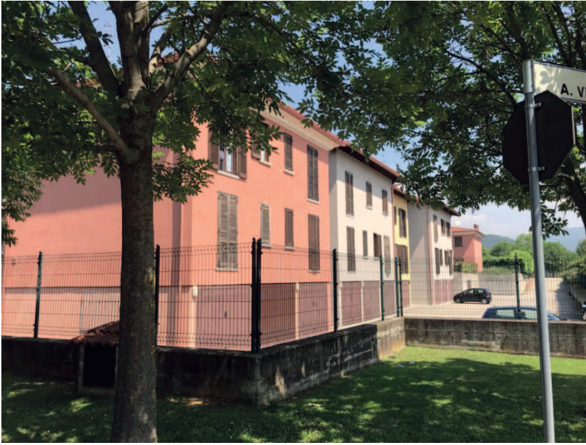
VISTA ESTERNA BLOCCO

Architetto Brunella Cappa Via Tagliaferri 6 25126 Brescia Tel.03047260-3356144143