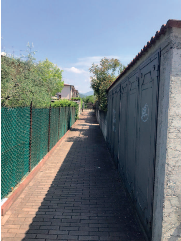
STRADA PEDONALE PRIVATA INGRESSO