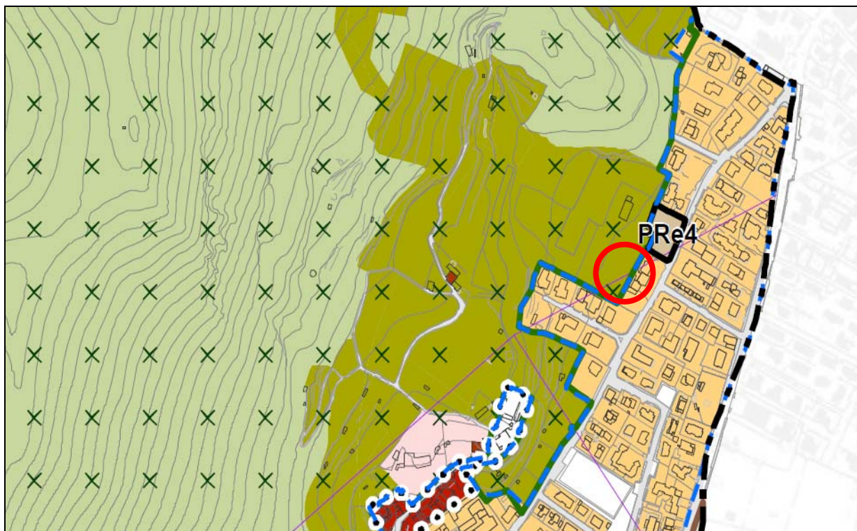
PIANO DELLE REGOLE PGT 2016 – Sintesi delle azioni di piano