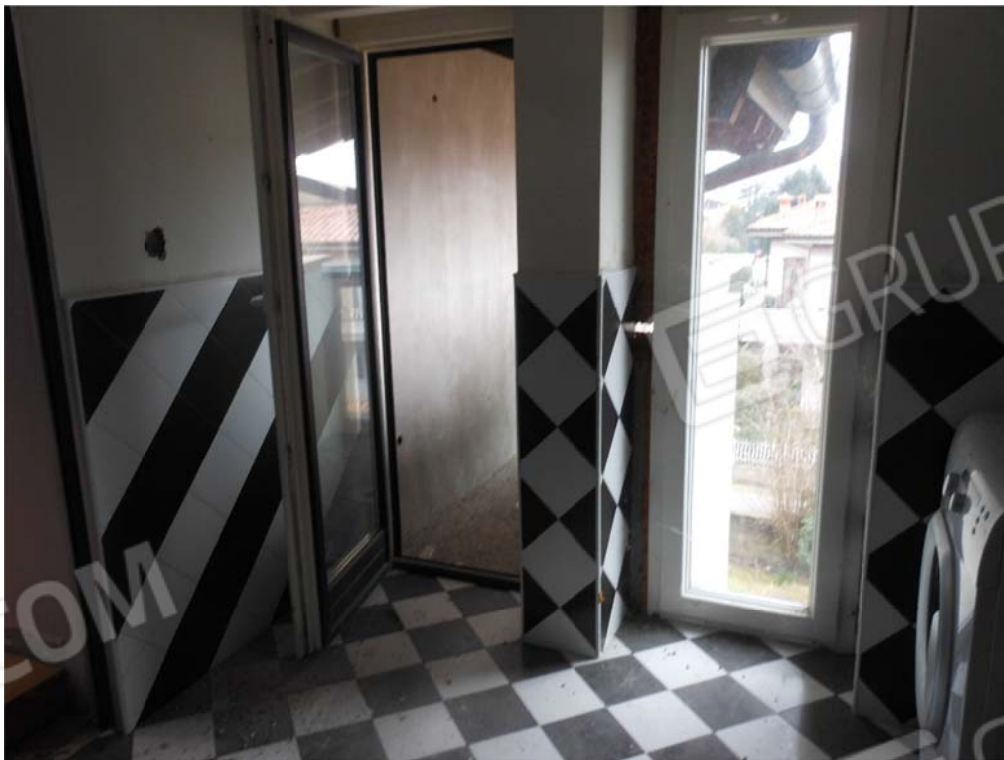
Foto 36: ripostiglio ultimo piano utilizzato come bagno / lavanderia