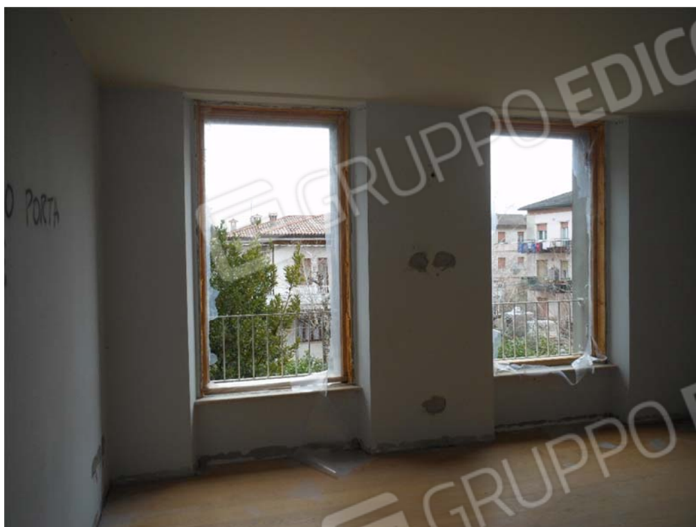
Foto 22: Serramenti rimossi e prese elettriche murate stanza 1° piano