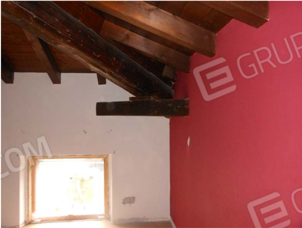
Foto 27 – 28: Secondo piano - particolare copertura con travi a vista