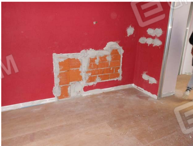
Foto 24 – 25 - 26: Particolari nicchie murate e prese elettriche cementate