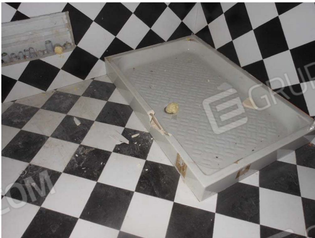
Foto 32: Piatto doccia danneggiato e tubazioni intasate con schiuma poliuretana