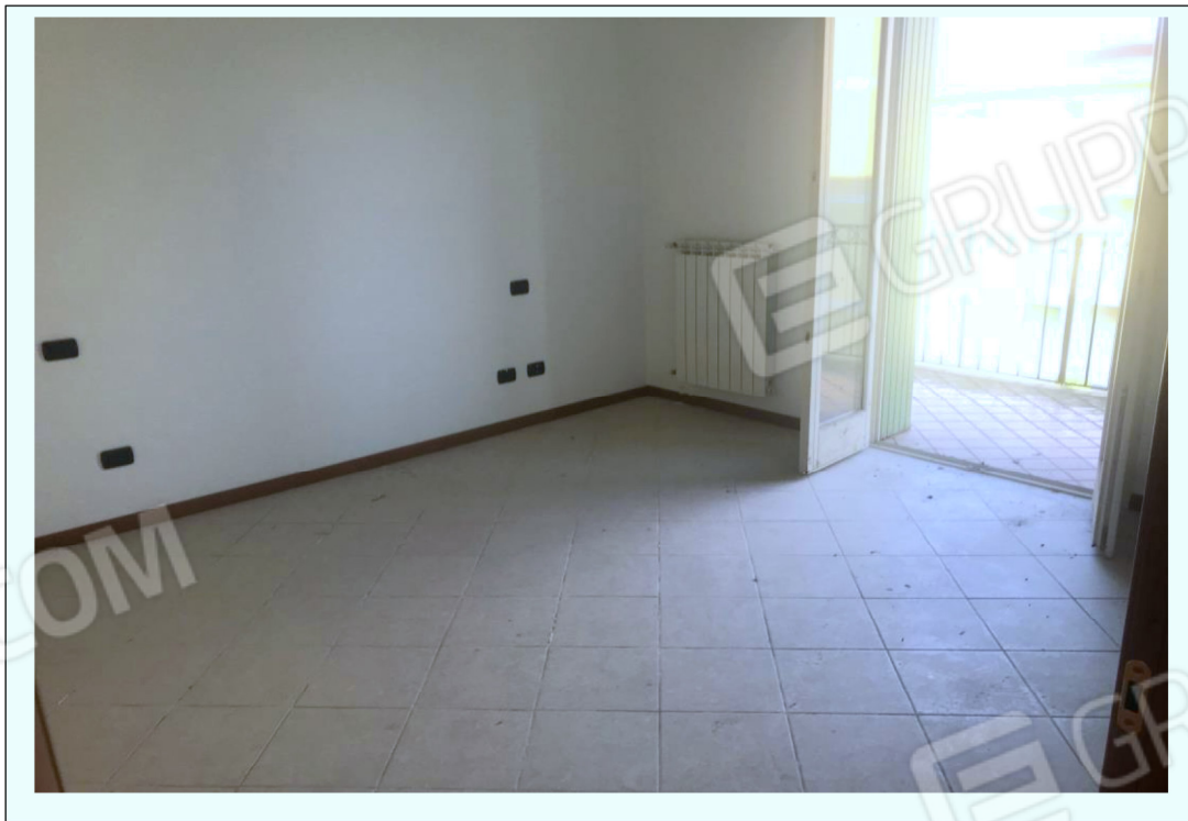
H) Fotografia riprendente la camera da letto matrimoniale che in entrambi gli appartamenti si apre con una portafinestra sul balcone/corridoio anteriore.