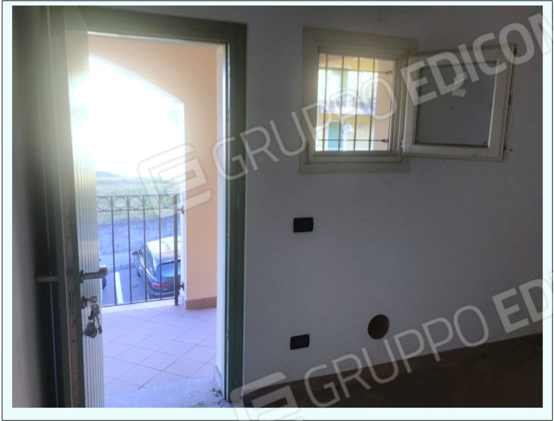
O) Fotografia che inquadra l'interno di una delle 2 cantine di pertinenza degli appartamenti.