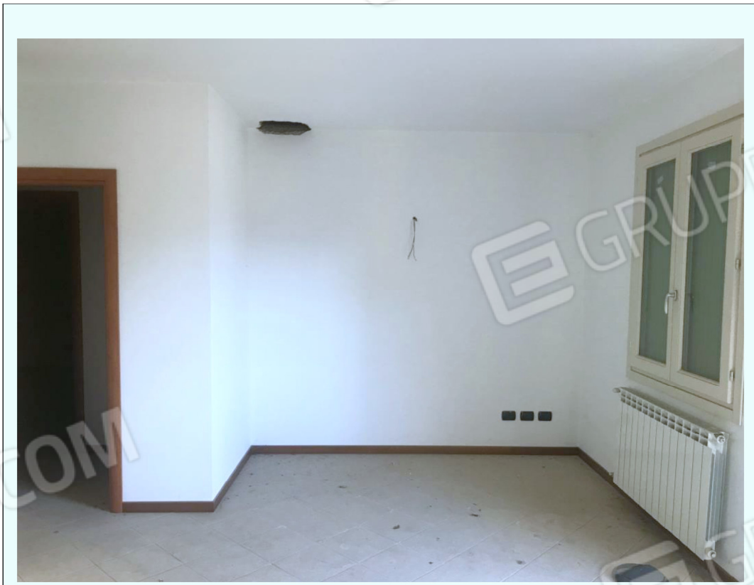
D) Fotografia che riprende la zona giorno identica di entrambi gli appartamenti. A soffitto si può notare il foro lasciato per eventuale canna fumaria.