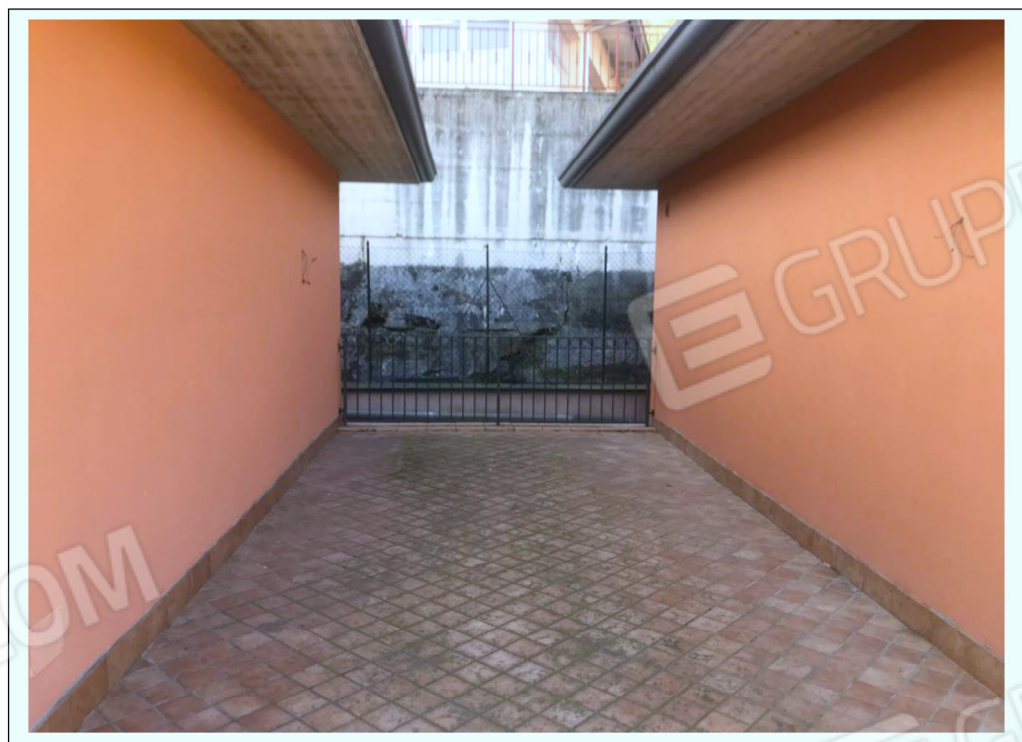
N) Fotografia della porzione di terrazza esterna che è metà del sub 5 e metà del sub 6.