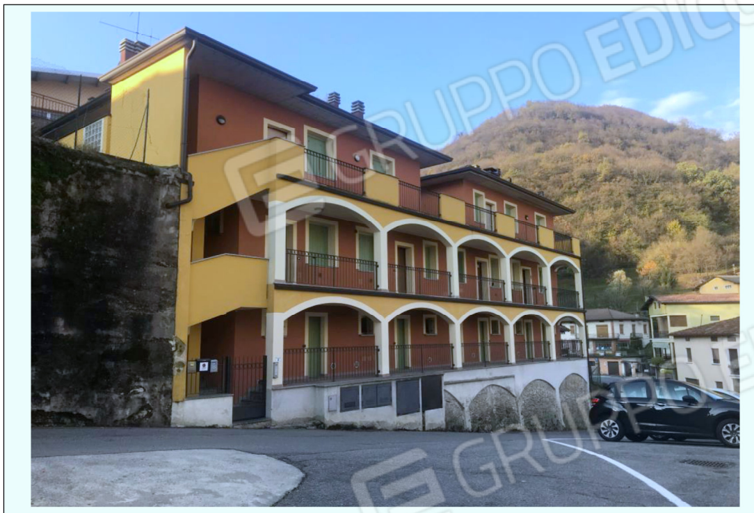
A) Fotografia della facciata principale del fabbricato di Agnosine sito in via Reguitti, in cui si trovano i 2 appartamenti con cantina, oggetto di perizia.