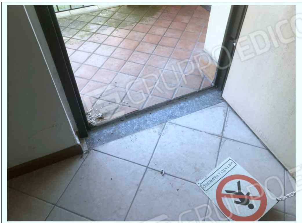
M) Fotografia della soglia d'ingresso di uno dei 2 appartamenti, che evidenzia il fatto che il pavimento esterno è più alto di 1 cm di quello interno.