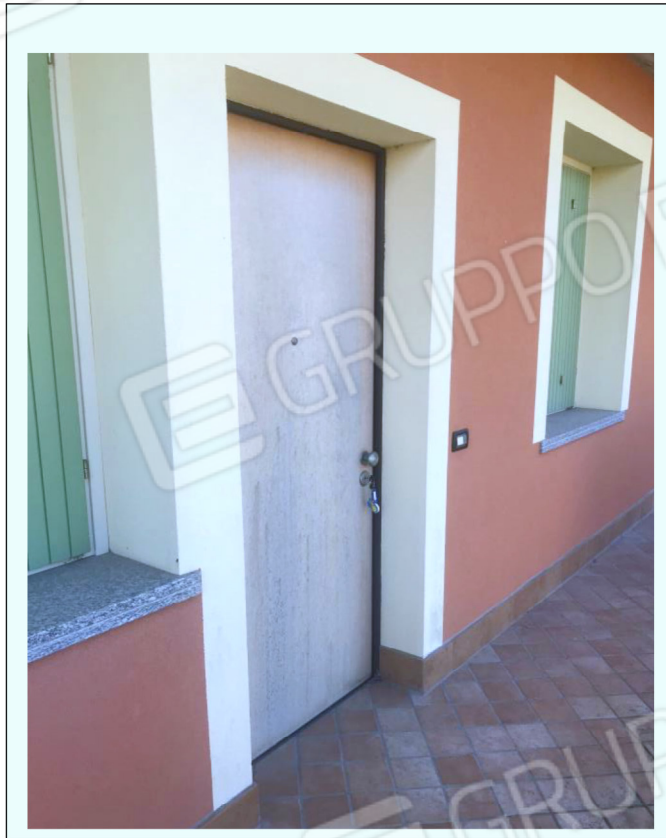
C) Fotografia che riprende uno dei 2 portoncini blindati di accesso agli appartamenti.