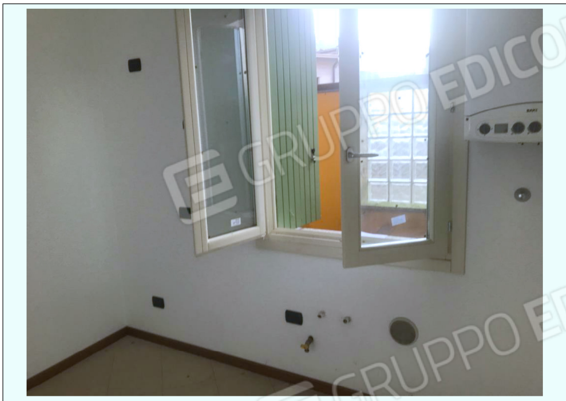
E) Fotografia che riprende la parete attrezzata della cucina e la finestra che guarda sul terrazzo retrostante. In alto a destra si intravede anche la caldaia.