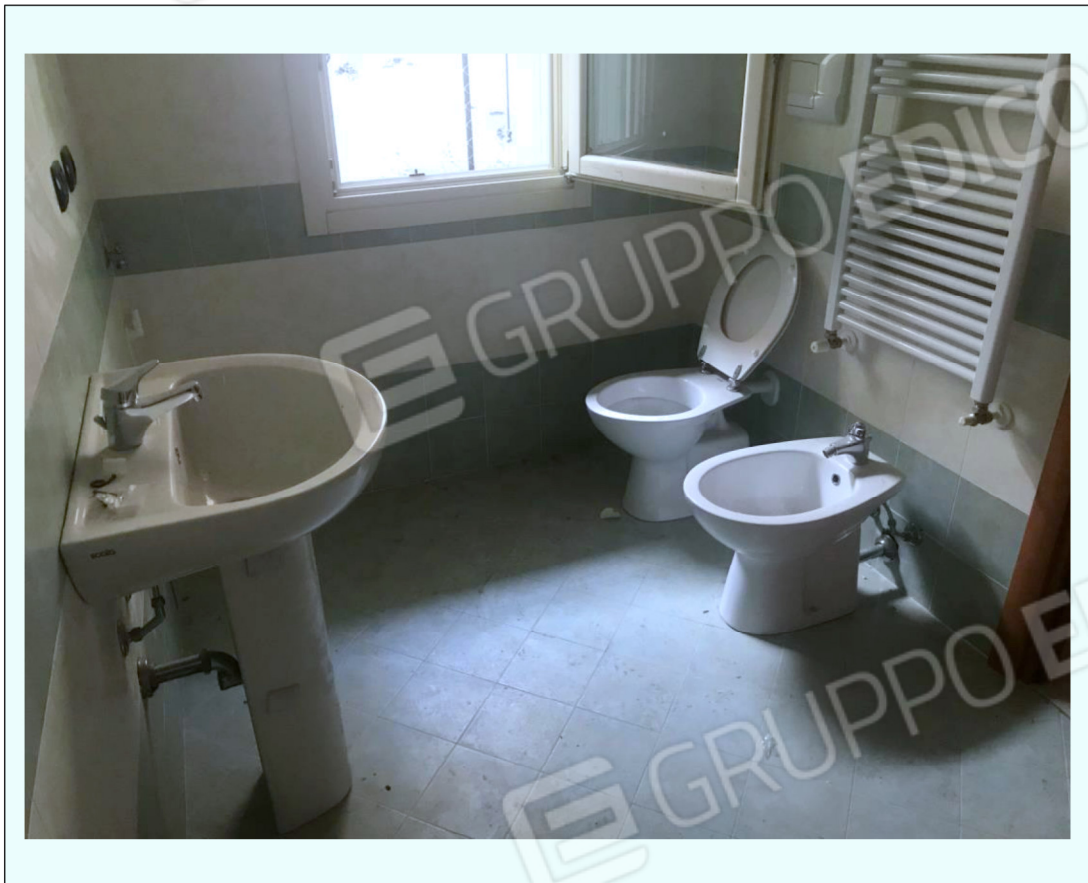
G) Fotografia che riprende il bagno di uno dei due appartamenti.