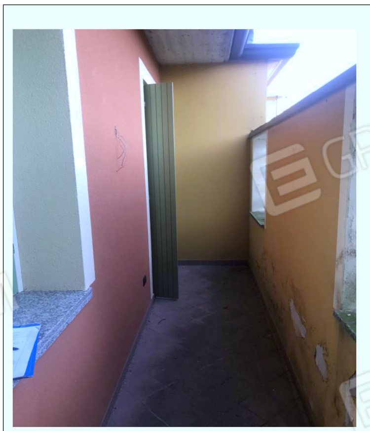
F) Fotografia che riprende il balcone del sub 6 posto sul lato confinante con la cucina.