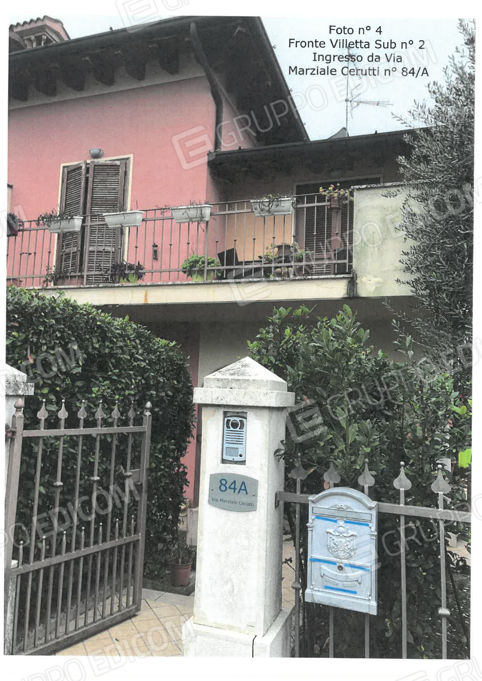
Foto n° 4 Fronte Villetta Sub n° 2 Ingresso da Via Marziale Cerutti n° 84/A