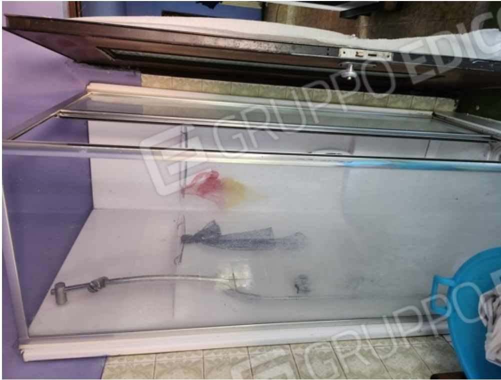
Fotografia F.13 - servizio igienico