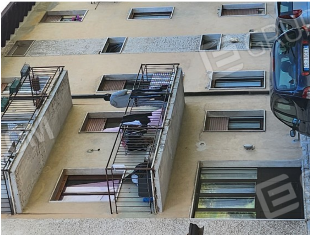
Fotografia F.2 - viasta da via XX Settembre