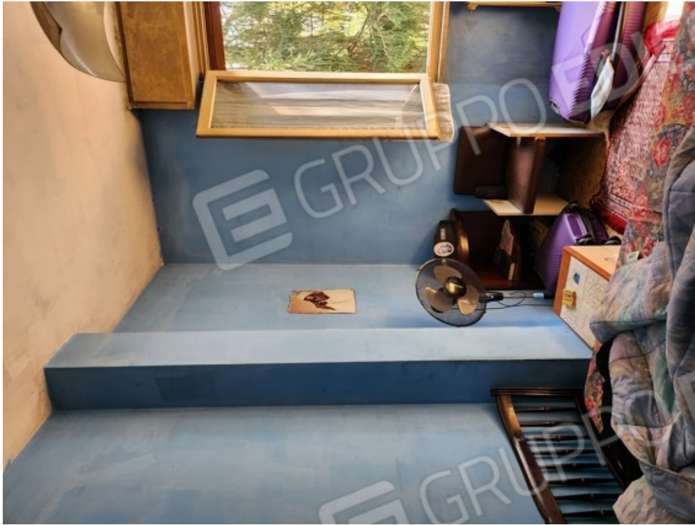
Fotografia F.3 - locale interno