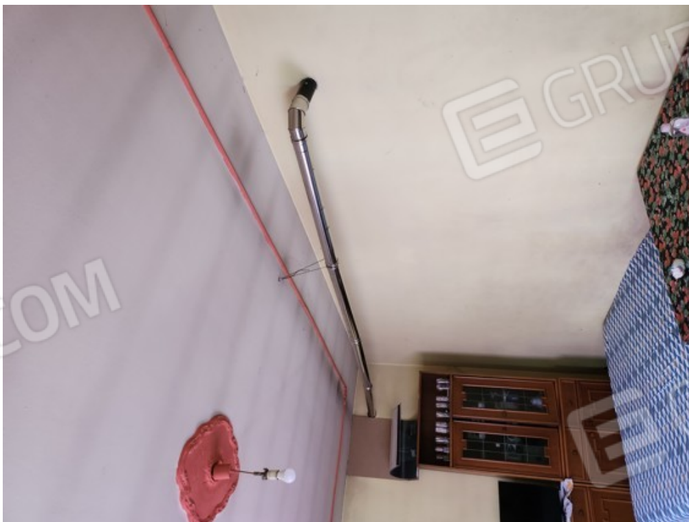
Fotografia F.8 - canalizzazione di evacuazione dei fumi posticcia