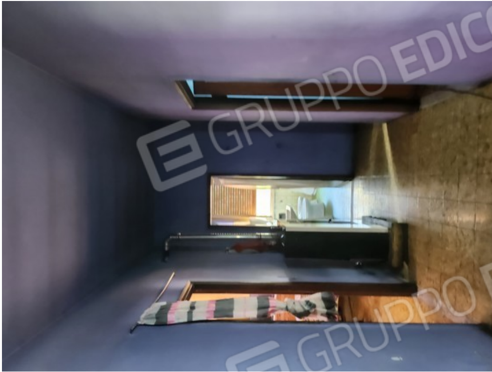
Fotografia F.5 - locale interno