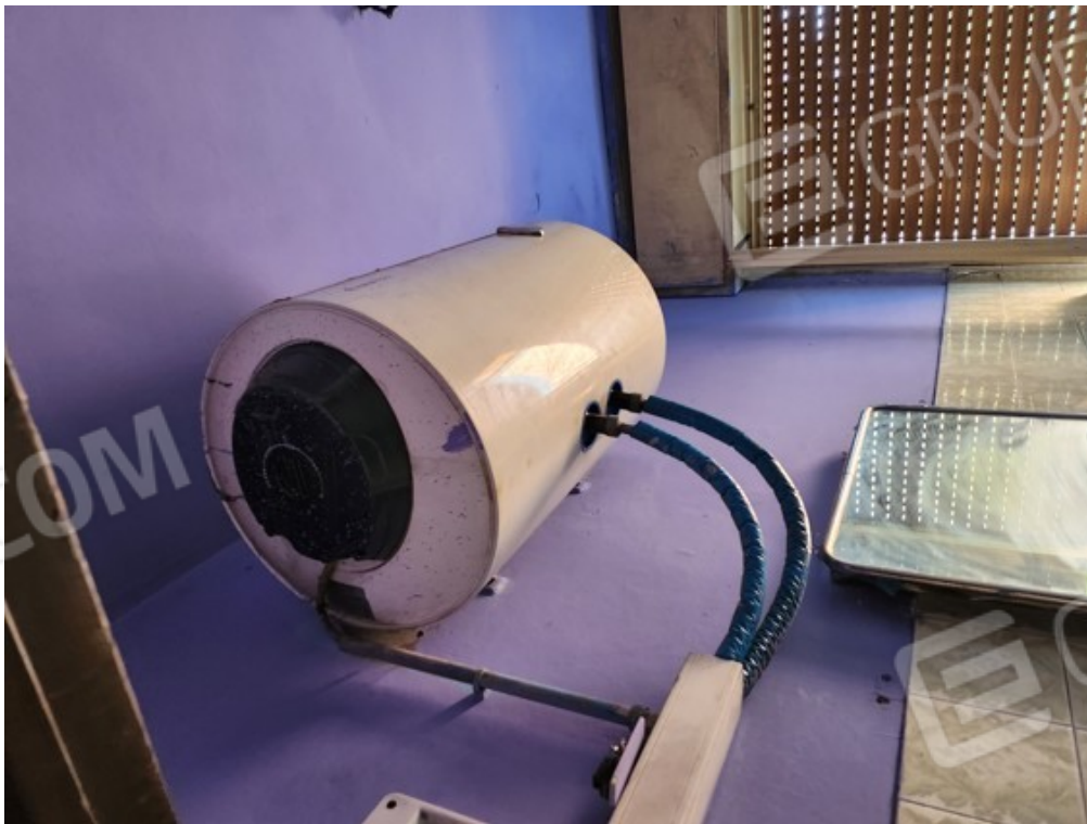
Fotografia F.12 - servizio igienico