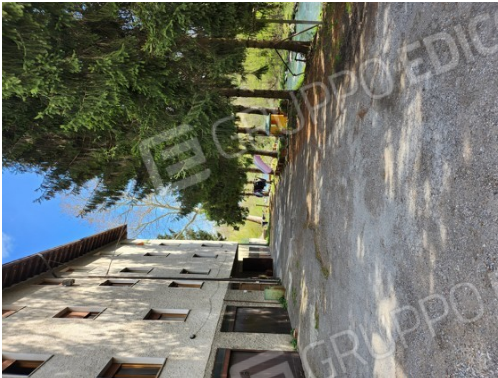
Fotografia F.27 - vista dalla corte