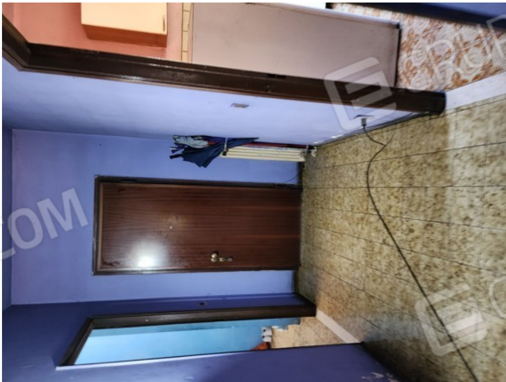
Fotografia F.6 - locale interno