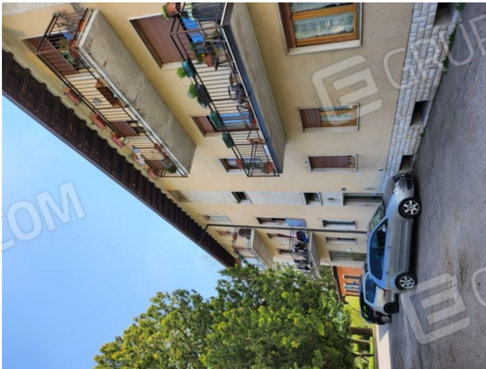
Fotografia F.24 - vista da distributore limitrofo