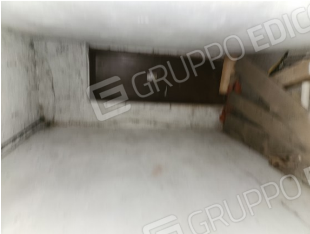
Fotografia F.21 - cantina