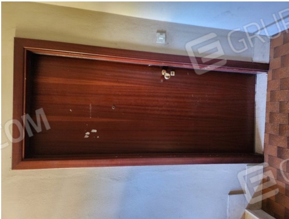
Fotografia F.16 - ingresso da vano scale