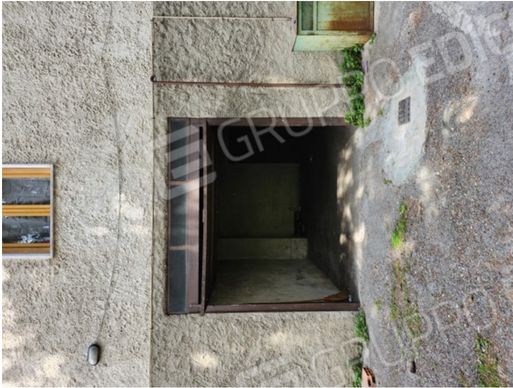
Fotografia F.19 - ingresso autorimessa