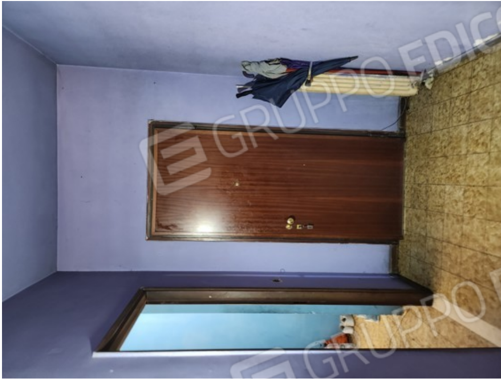
Fotografia F.15 - ingresso