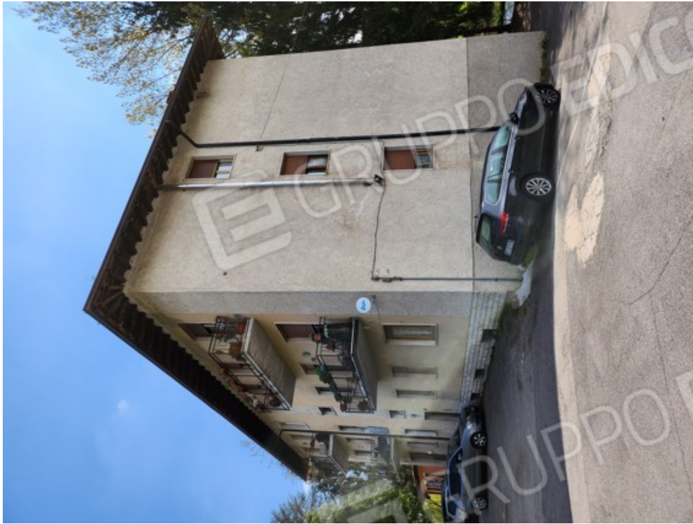
Fotografia F.29 - vista dalla corte