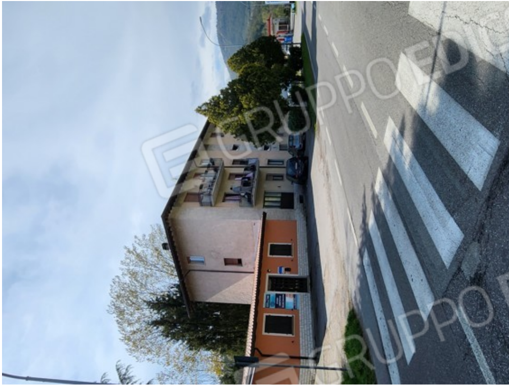
Fotografia F.1 - viasta da via XX Settembre