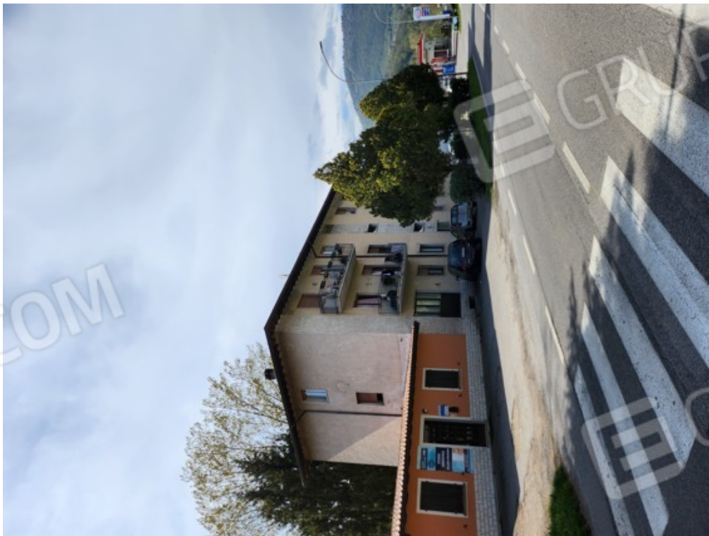
Fotografia F.30 - vista da via XX settembre