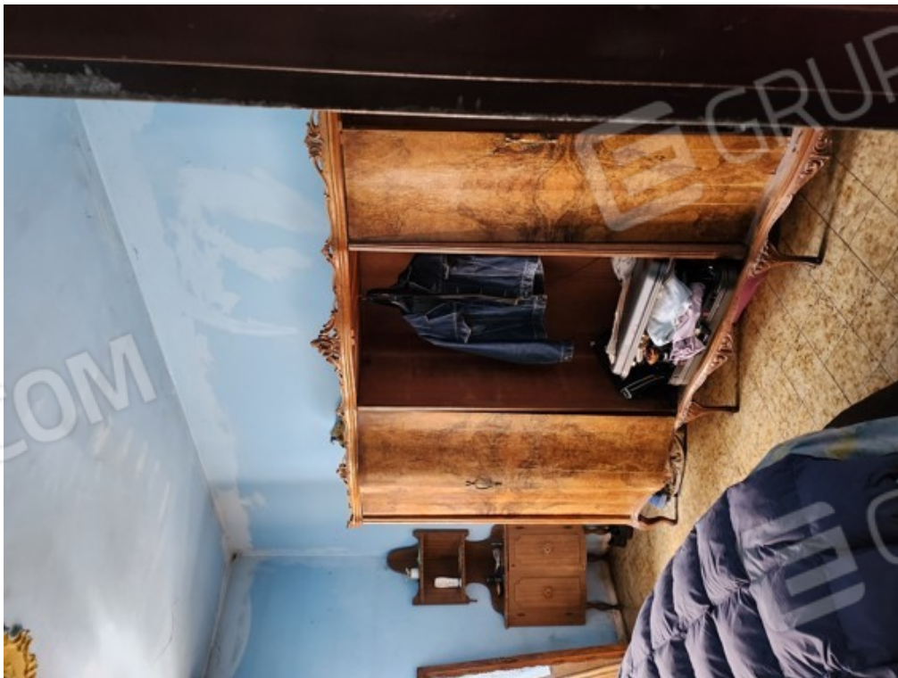
Fotografia F.10 - locale interno