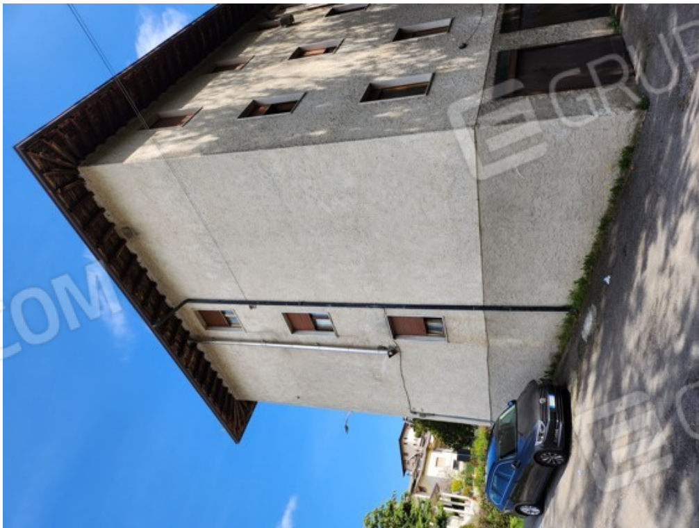
Fotografia F.26 - vista dalla corte