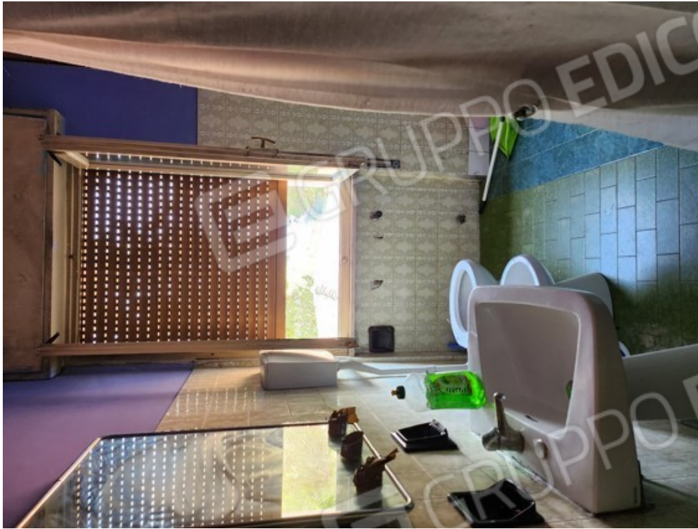
Fotografia F.11 - servizio igienico