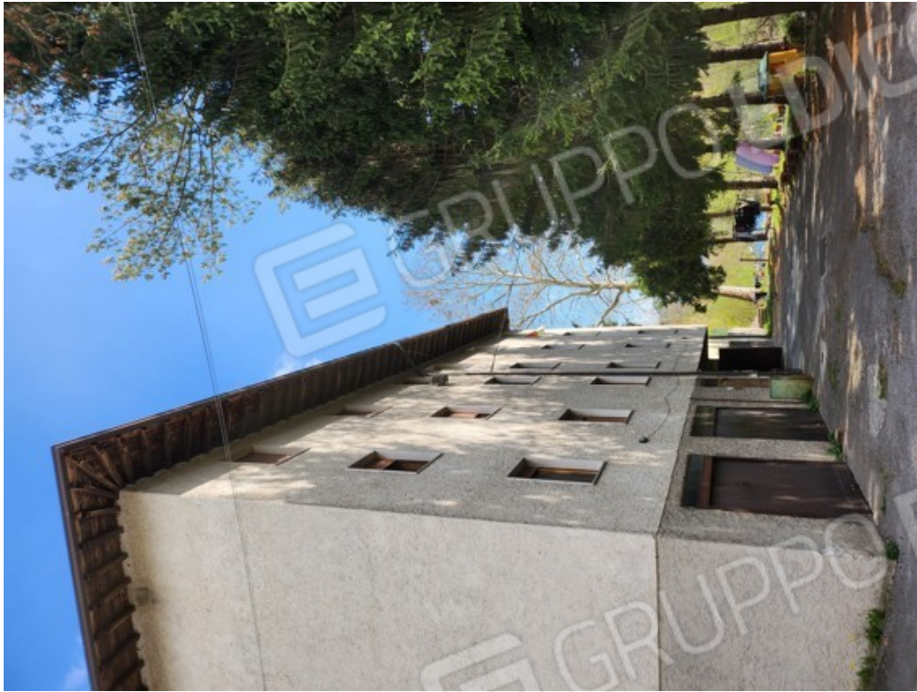
Fotografia F.25 - vista dalla corte