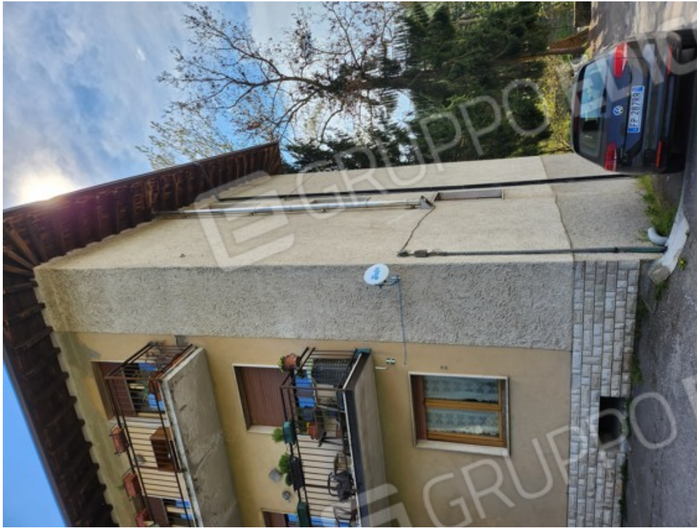
Fotografia F.23 - vista dalla corte