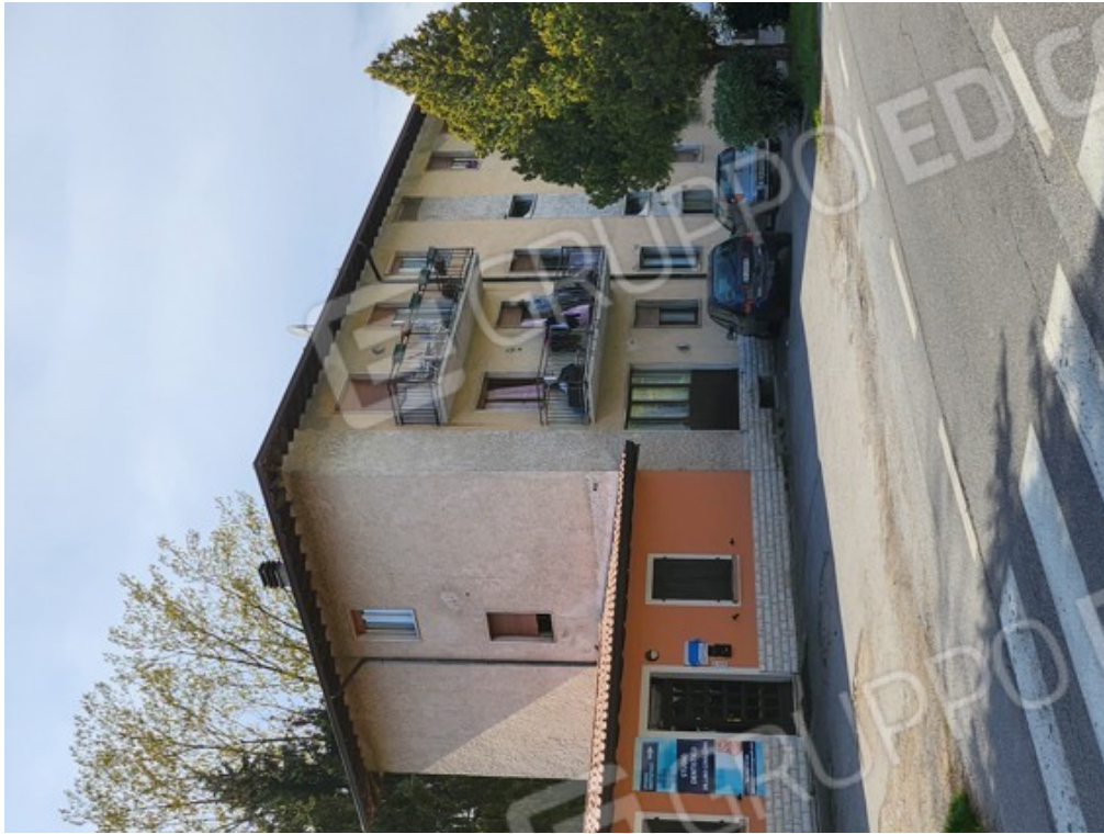
Fotografia F.31 - vista da via XX Settembre