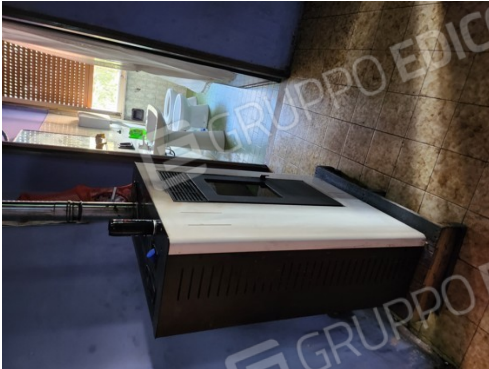
Fotografia F.7 - locale interno, generatore di calore posticcio