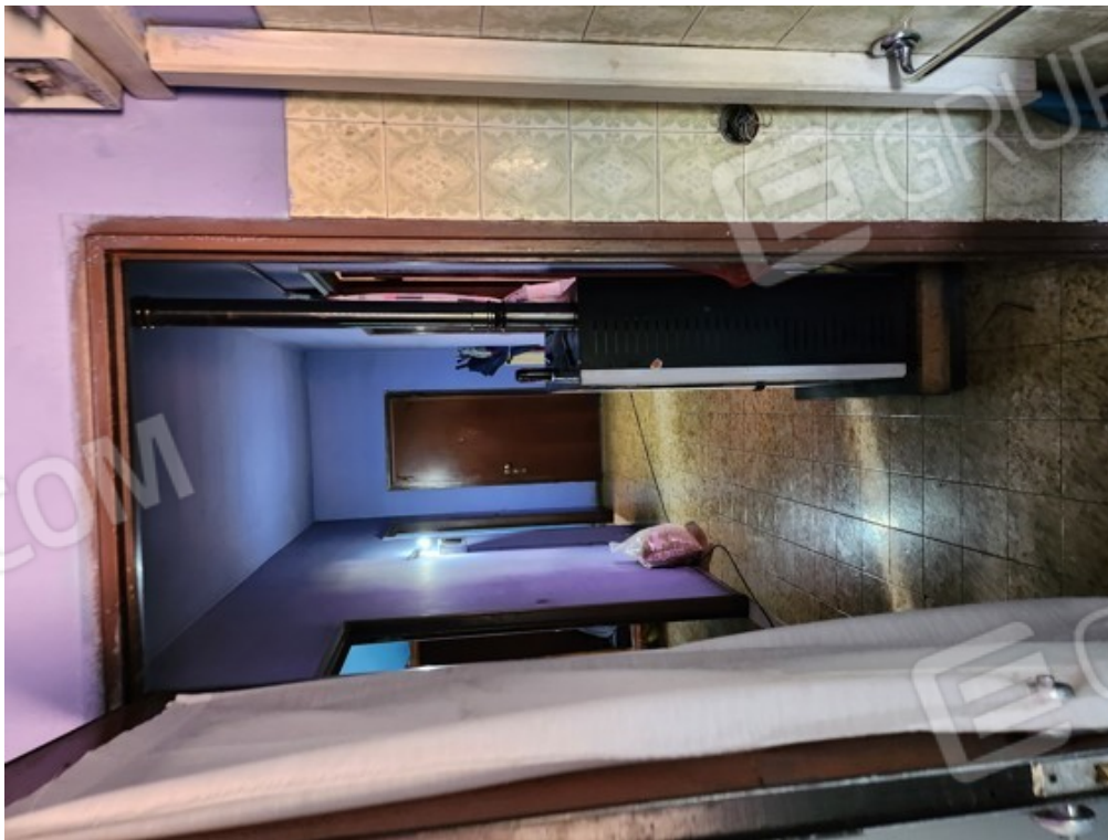
Fotografia F.14 - corridoio interno