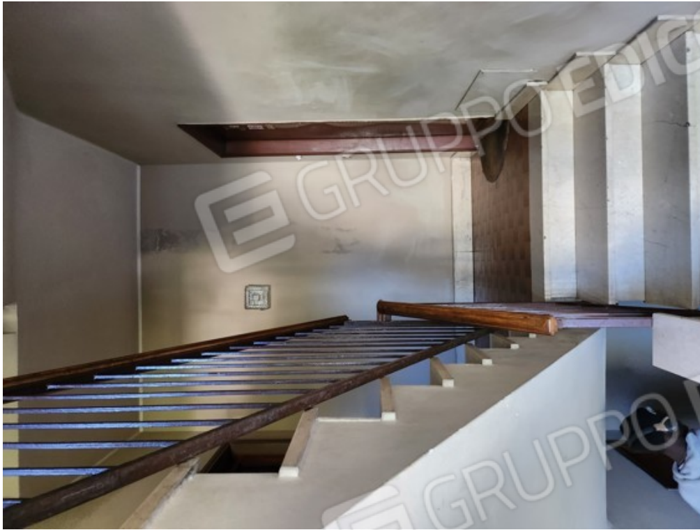
Fotografia F.17 - rampa scale condominiale