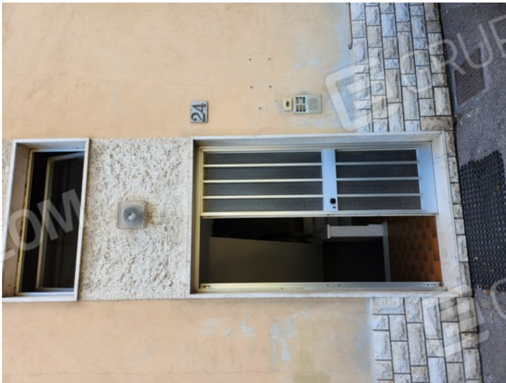
Fotografia F.22 - ingresso condominiale