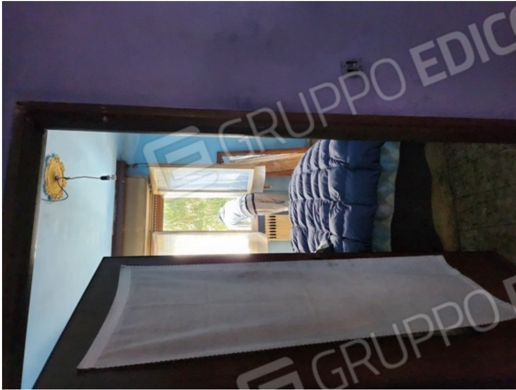
Fotografia F.9 - locale interno