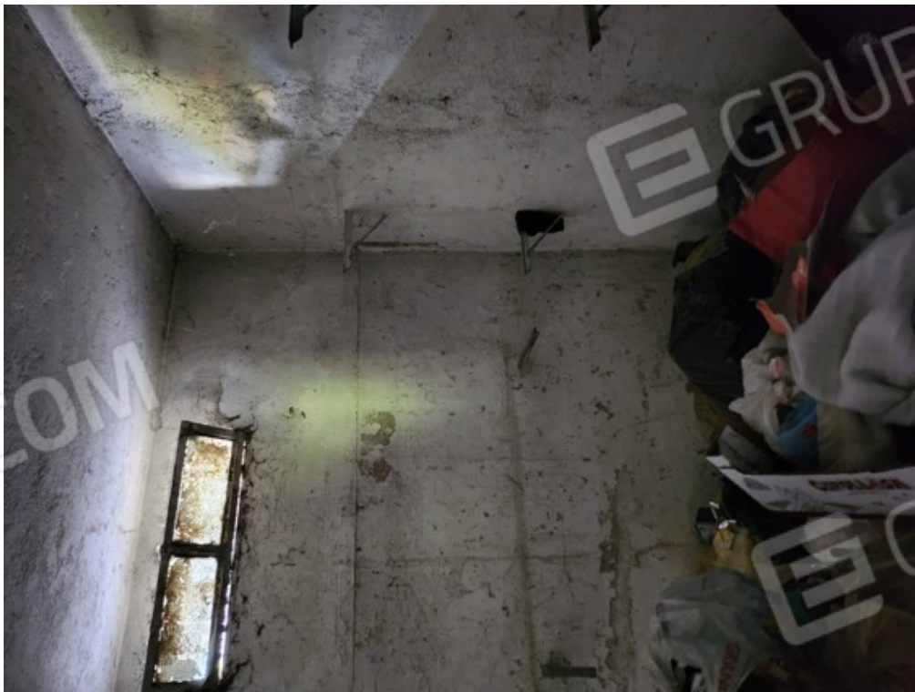
Fotografia F.20 - cantina