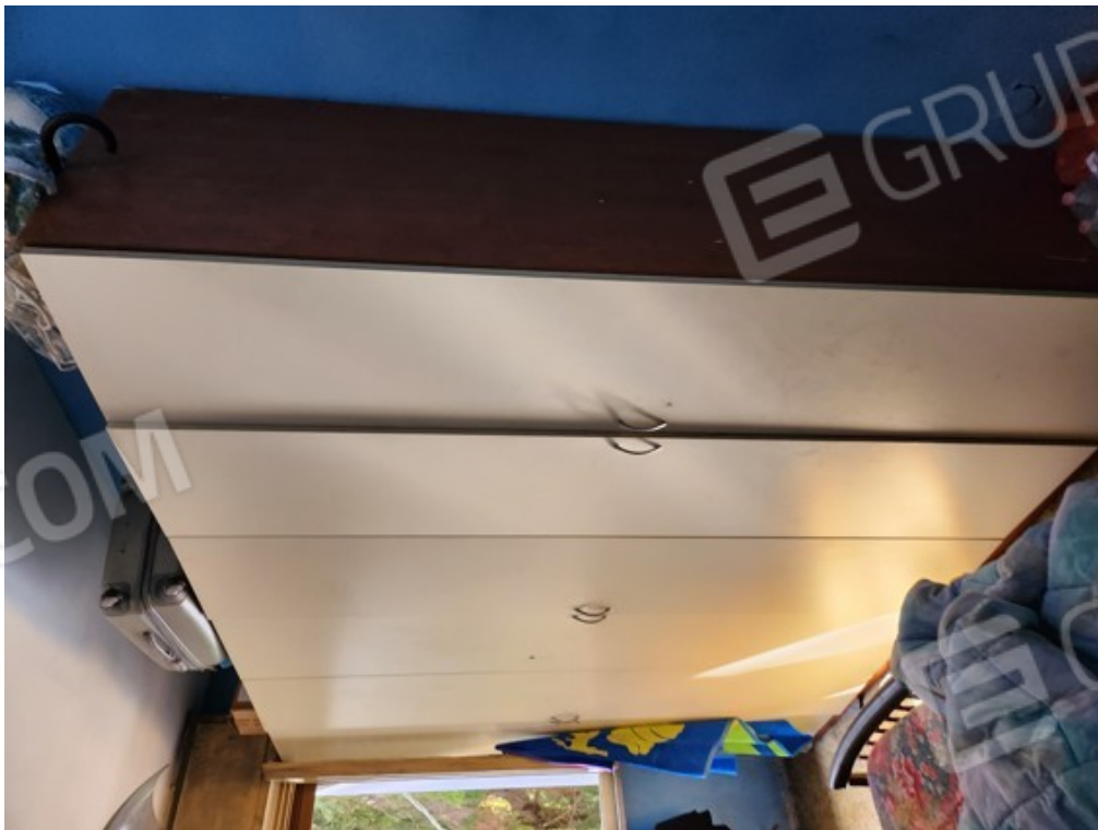
Fotografia F.4 - locale interno