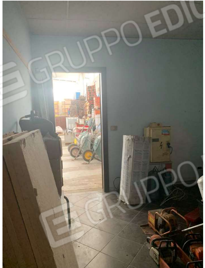
Foto 21 e 22. Vista interna dei locali destinati ad ufficio/deposito ricavati internamente al capannone

Arch. Gennari Sara – via San Martino 26 – Pontoglio, 25037 (BS) Tel./Fax 0309178867 e-mail gennarisara@virgilio.it