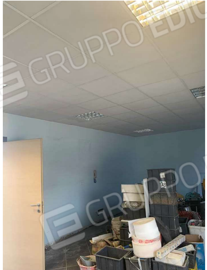
Foto 19 e 20. Vista interna dei locali destinati ad ufficio/deposito ricavati internamente al capannone

Arch. Gennari Sara – via San Martino 26 – Pontoglio, 25037 (BS) Tel./Fax 0309178867 e-mail gennarisara@virgilio.it