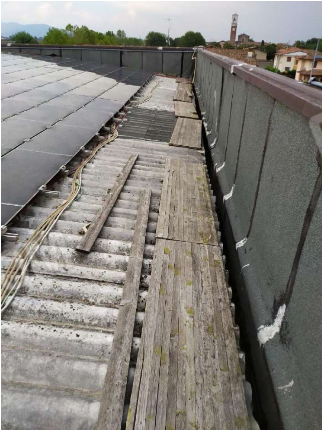
Foto 29. Stato di conservazione parte della copertura