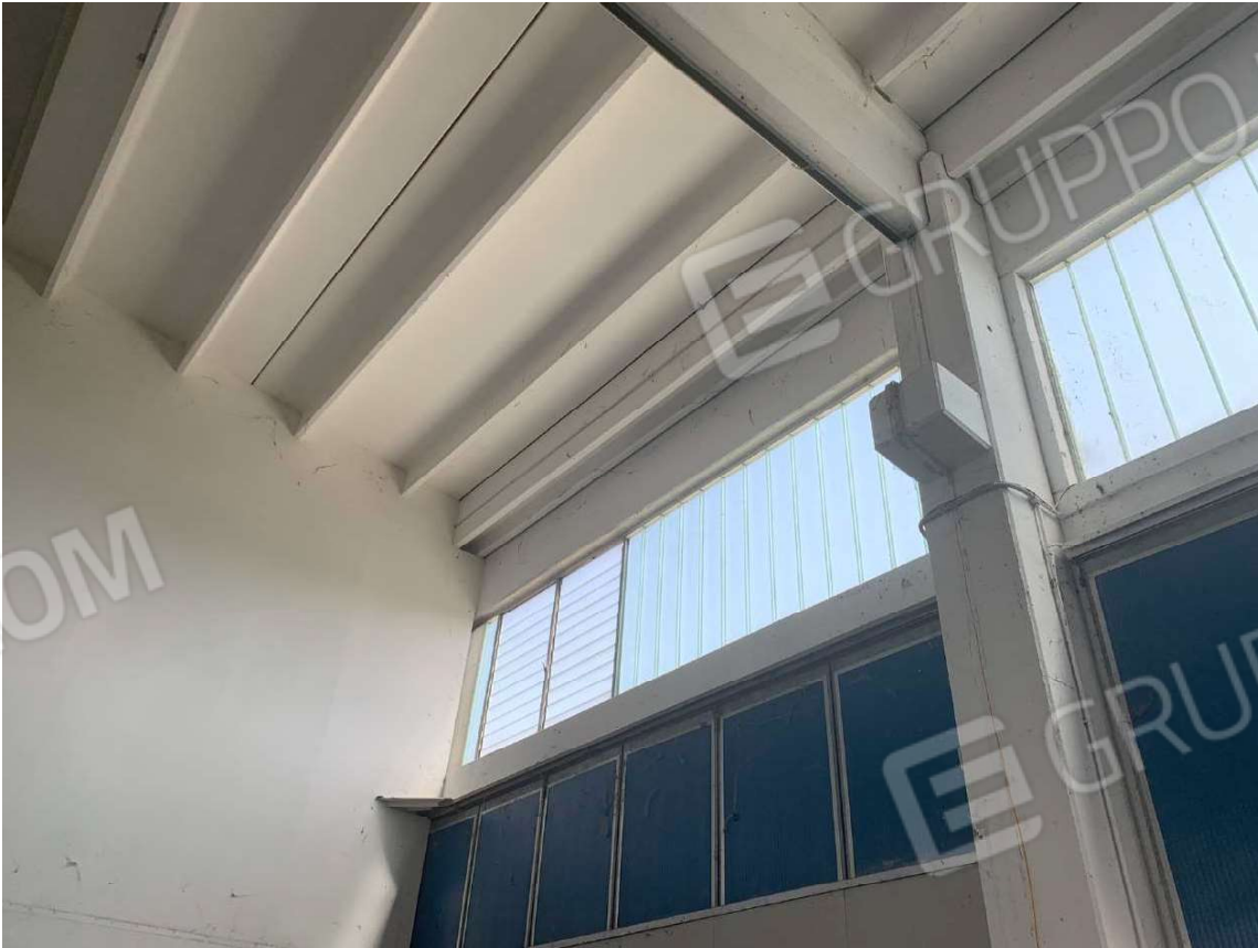
Foto 11. Vista interna del capannone, dettaglio campata e lucernari

Rapporto di valutazione - Esecuzione Immobiliare nr. 60/2022