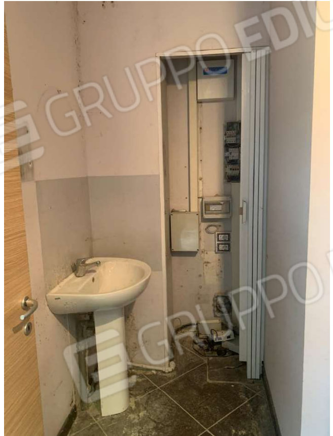
Foto 23 e 24. Vista interna dei locali destinati ad ufficio/deposito ricavati internamente al capannone – zona wc