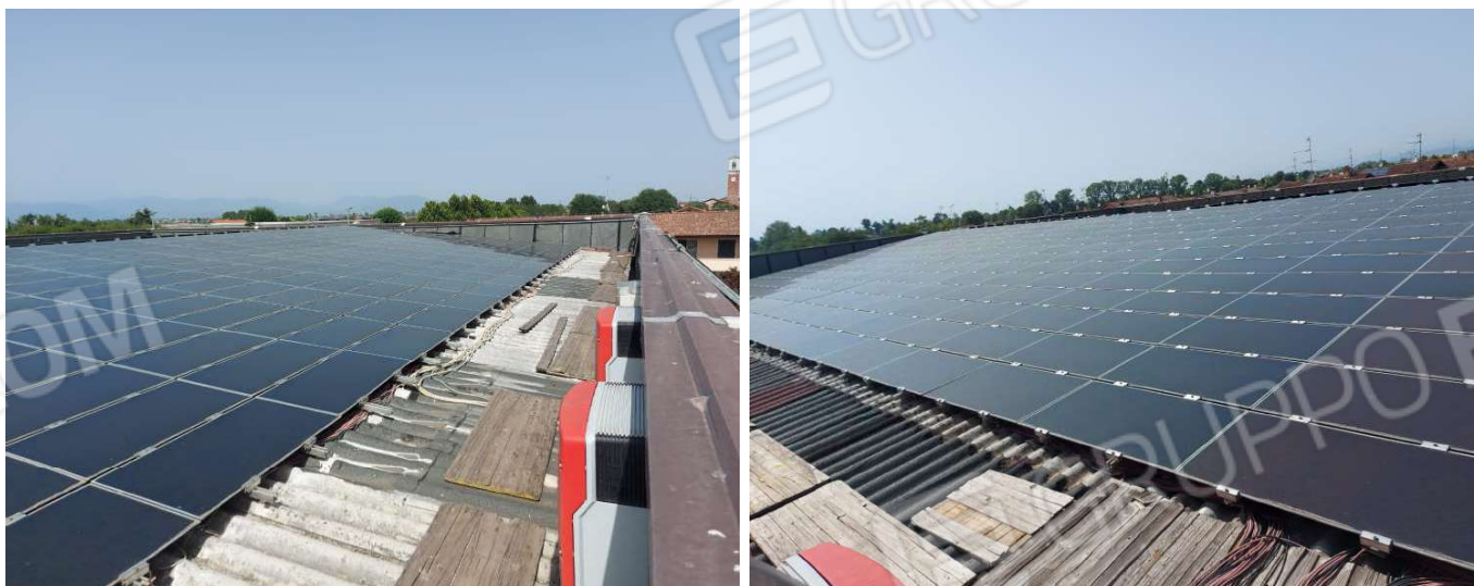
Foto 1. e 2. Impianto fotovoltaico presente sul tetto del capannone

Di seguito vengono riportate le fotografie effettuate durante il sopralluogo in loco per valutare lo stato del bene oggetto di stima, la sua localizzazione e lo stato di conservazione.