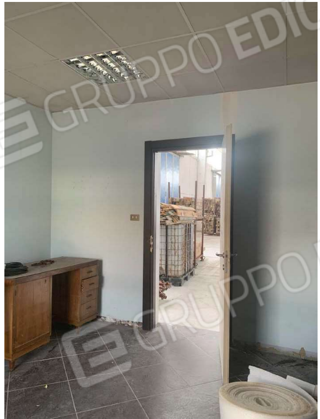
Foto 17 e 18. Vista interna dei locali destinati ad ufficio/deposito ricavati internamente al capannone

Arch. Gennari Sara – via San Martino 26 – Pontoglio, 25037 (BS) Tel./Fax 0309178867 e-mail gennarisara@virgilio.it