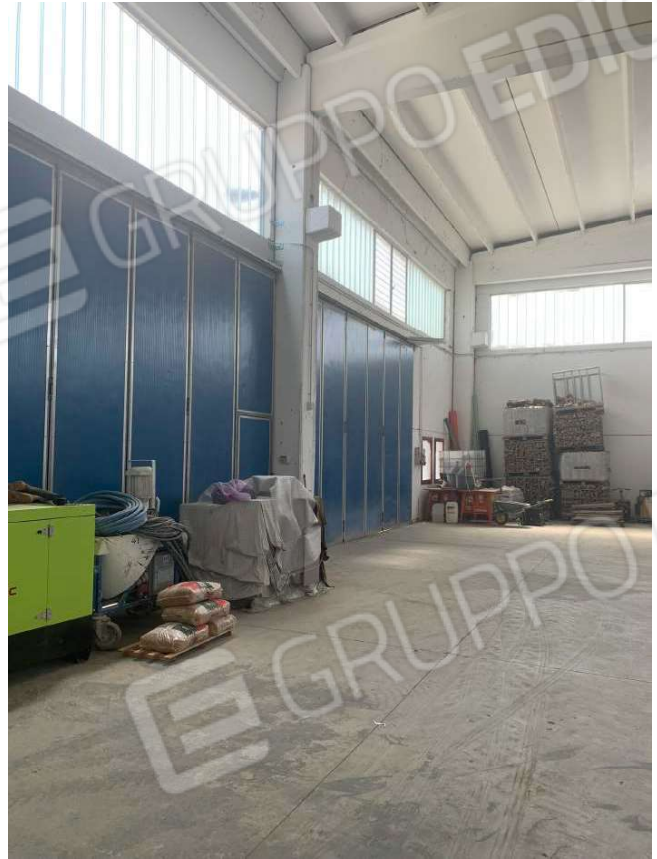
Foto 16. Vista interna di due portoni di accesso