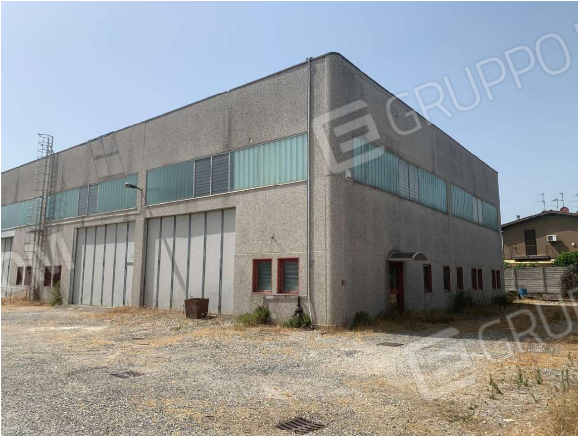
Foto 4. Vista esterna del lato sud est del capannone con scala metallica tubolare esterna per accesso alla copertura

Arch. Gennari Sara – via San Martino 26 – Pontoglio, 25037 (BS) Tel./Fax 0309178867 e-mail gennarisara@virgilio.it