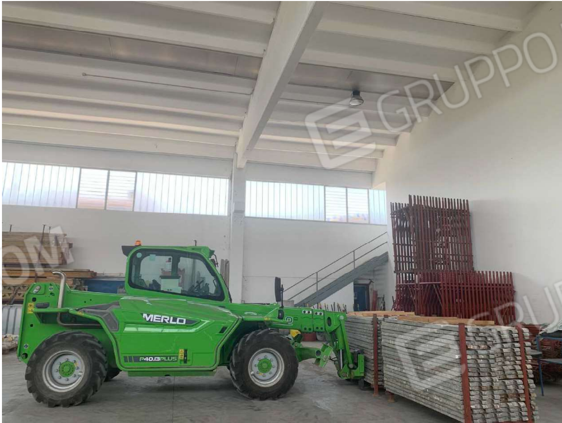
Foto 13. Vista interna generale di una porzione di capannone con la scala che permette l'accesso al soppalco

Rapporto di valutazione - Esecuzione Immobiliare nr. 60/2022