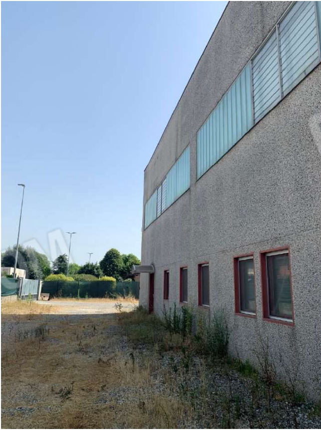
Foto 7. Vista esterna lato est del capannone

Rapporto di valutazione - Esecuzione Immobiliare nr. 60/2022