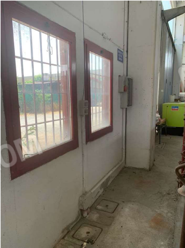
Foto 15. Quadro elettrico interno al capannone