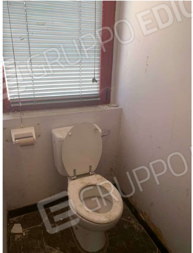
Foto 25 e 26. Vista interna dei locali destinati ad ufficio/deposito ricavati internamente al capannone – zona wc