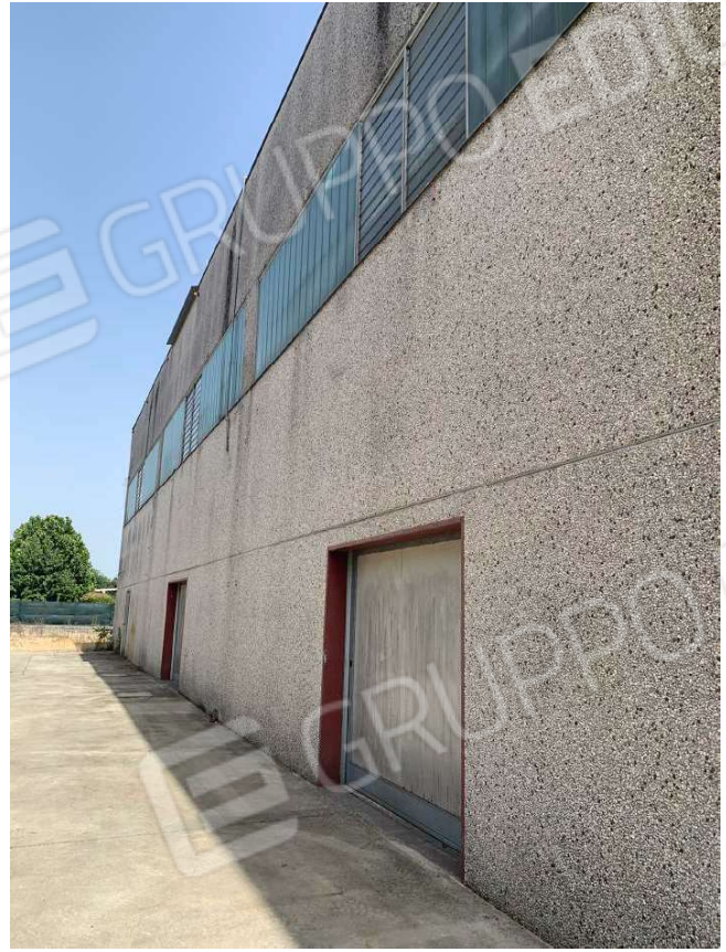
Foto 8. Vista esterna lato nord del capannone