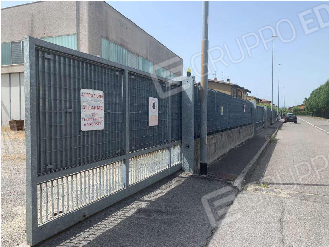
Foto 3. Ingresso carraio al capannone e all'area di pertinenza

Rapporto di valutazione - Esecuzione Immobiliare nr. 60/2022