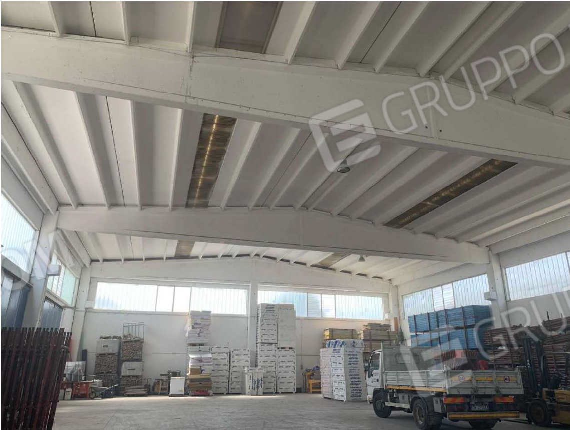
Foto 12. Vista interna generale di una porzione di capannone

Rapporto di valutazione - Esecuzione Immobiliare nr. 60/2022