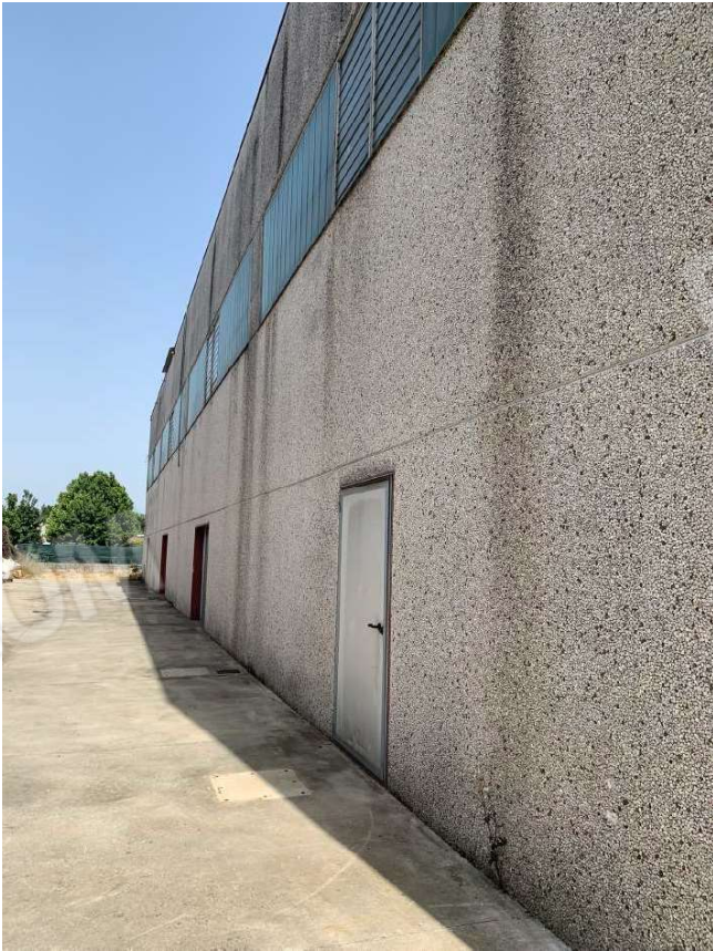
Foto 5. Vista esterna lato nord del capannone