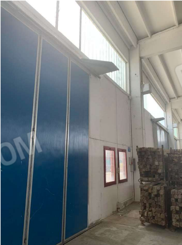
Foto 9. Vista interna di uno dei portoni di accesso al capannone