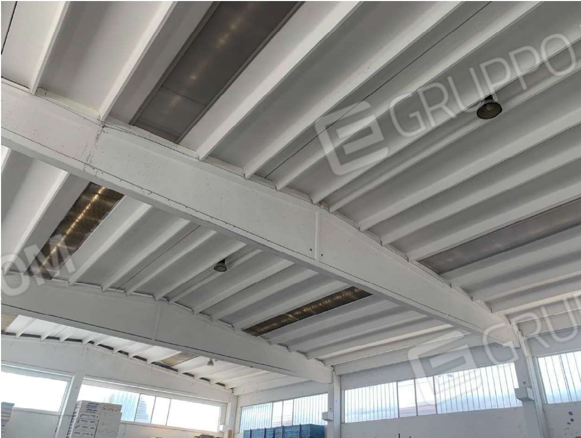
Foto 14. Vista interna del tetto del capannone