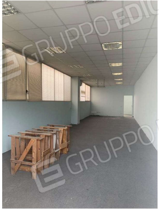
Foto 28. Area soppalco al P1, sopra la zona ufficio/deposito del PT

Arch. Gennari Sara – via San Martino 26 – Pontoglio, 25037 (BS) Tel./Fax 0309178867 e-mail gennarisara@virgilio.it