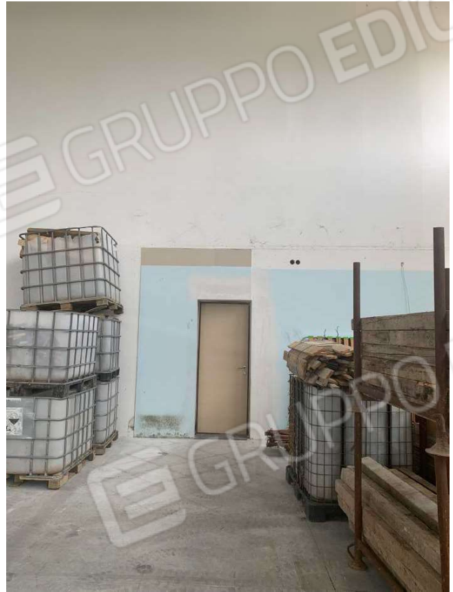
Foto 10. Vista interna del capannone