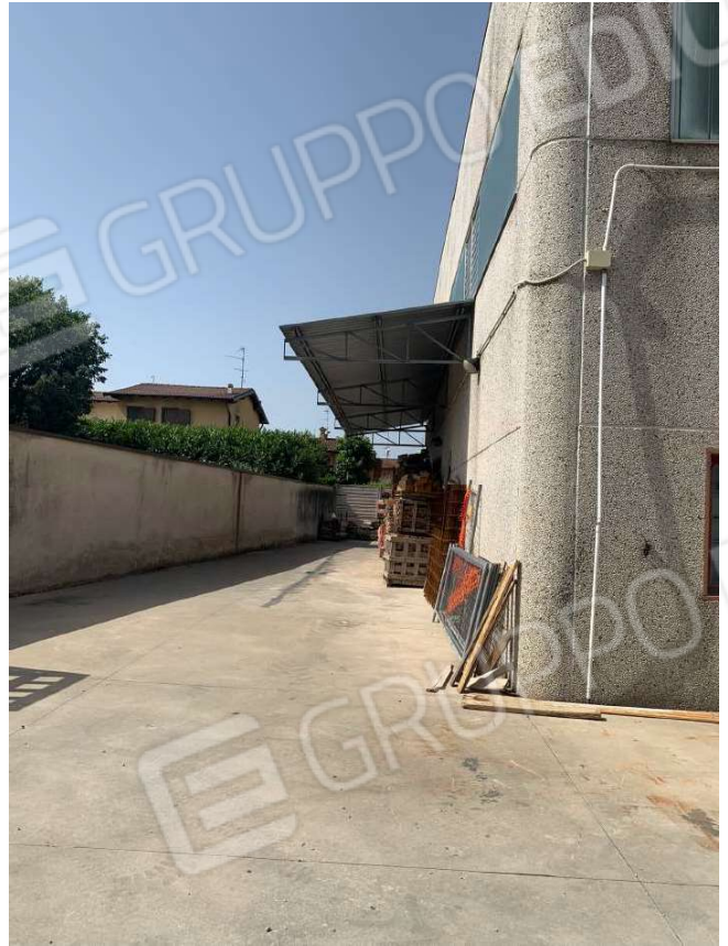
Foto 6. Vista esterna lato ovest del capannone