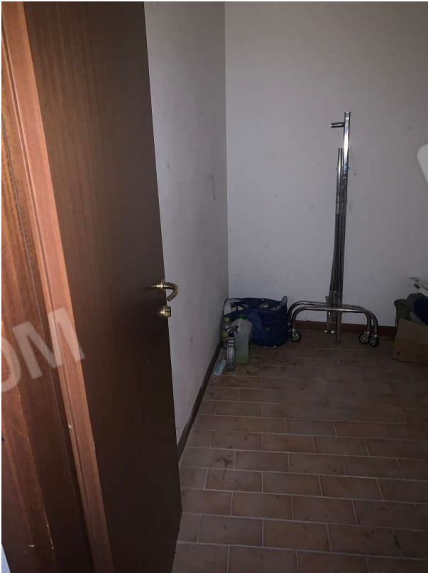
VISTA CANTINA PIANO TERRA