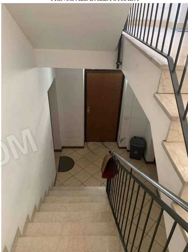
VISTA DALLA SCALA INTERNA COMUNE VERSO L'INGRESSO PRINCIPALE DALLA STRADA