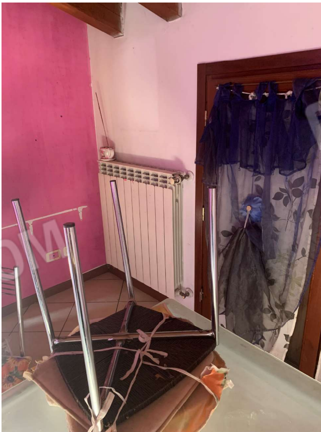
VISTA DELLA FINESTRA DELLA ZONA GIORNO