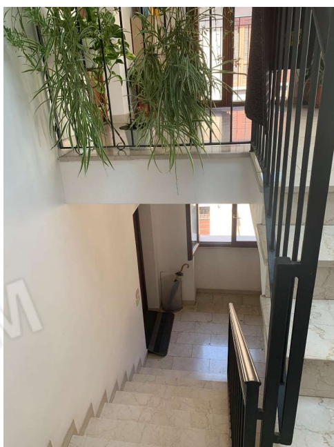
VISTA DELLA SCALA COMUNE VERSO IL PIANEROTTOLO 2° PIANO