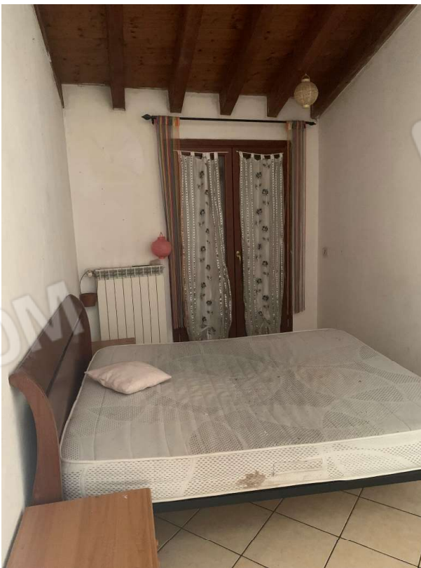
VISTA CAMERA 2 CON ACCESSO ALLA TERRAZZA