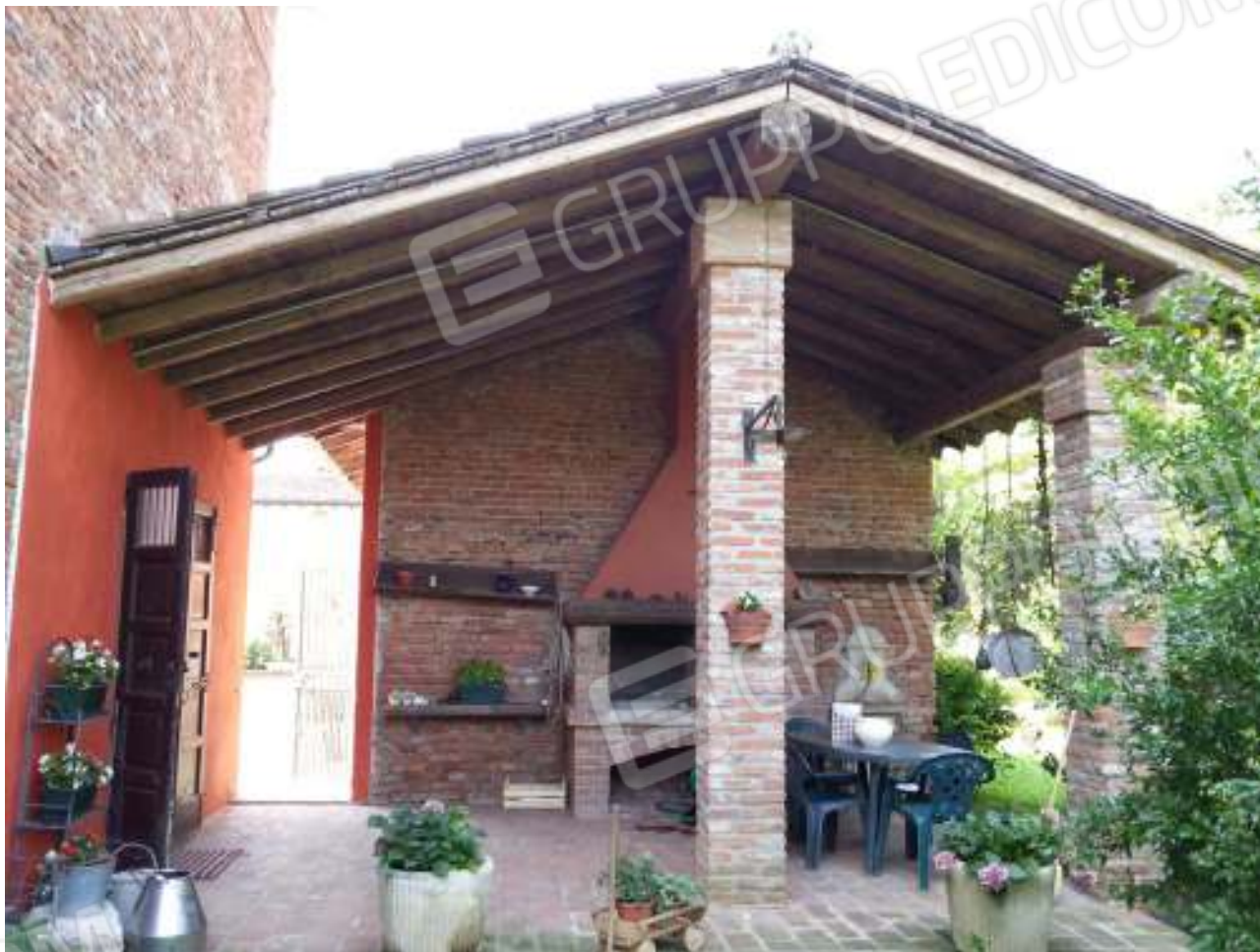
foto 10 – corpo accessorio cantine e androne ingresso carraio Mapp.le 26 Sub.10